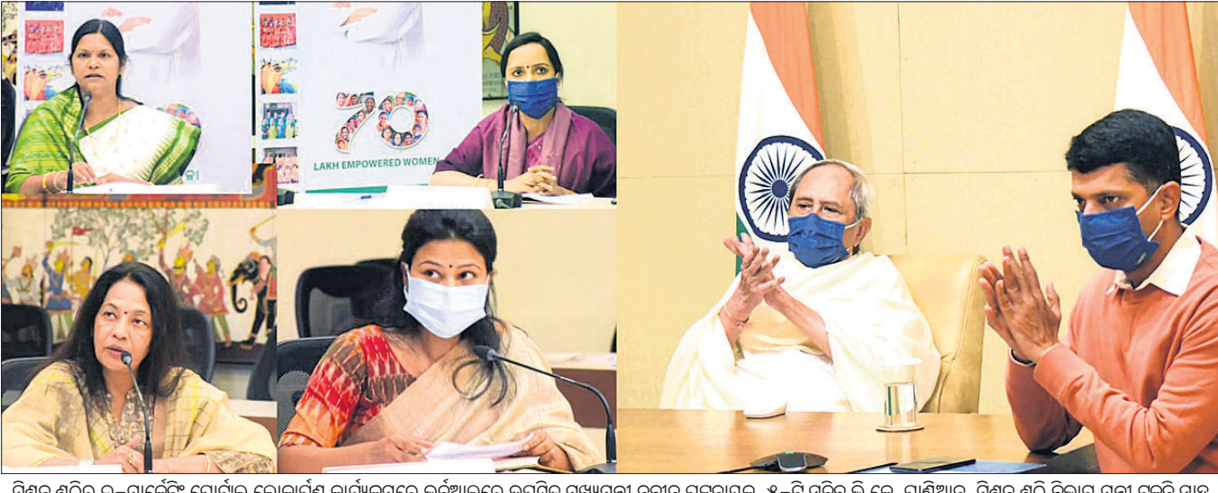
ମିଶନ ଶକ୍ତି ଇ-ମାର୍କେଟିଂ ପୋର୍ଟାଲକୁ ଲୋକାର୍ପଣ କଲେ ମୁଖ୍ୟମନ୍ତ୍ରୀ

ଭୁବନେଶ୍ୱର, ୨୨୧୨ (ବୁଧବେଳା) ମୁଖ୍ୟମନ୍ତ୍ରୀ ନବୀନ ପଟ୍ଟନାୟକଙ୍କ ଦ୍ୱାରା ପରିଚାଳିତ ମିଶନ ଶକ୍ତି ଇ-ମାର୍କେଟିଂ ପୋର୍ଟାଲର ଲୋକାର୍ପଣ କରାଯାଇଛି। ଏହାସହ ଭୁବନେଶ୍ୱର ଏକ ଆଧୁନିକ ଆର୍ଥିକ ପ୍ରାନ୍ତ ଭାବେ ଉଦ୍ଘୋଷଣା କରାଯାଇଛି।