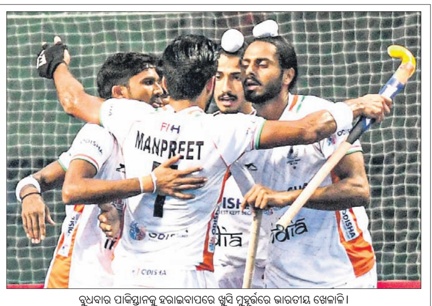
ଚୀନର ପାକିସ୍ତାନକୁ ହରାଇବାପରେ ଖୁସି ପୁହୁର୍ତ୍ତରେ ଭାରତୀୟ ଖେଳାଳି।

କାକା, ୨୨୧୨ ଏସିଆନ ଚାମ୍ପିୟନ୍ସ ଟ୍ରଫି ହକି ଟୁର୍ଣ୍ଣାମେଣ୍ଟରୁ ଚୀନର ଉପାଧିପତି ହୋଇଛି। ଏଥିରେ ଦକ୍ଷିଣ କୋରିଆ ଟୁଆ ଚାମ୍ପିୟନ ହୋଇଥିବାବେଳେ ଭାରତ ଟ୍ରୋଫି ପଦକ ହାସଲ କରିଛି।