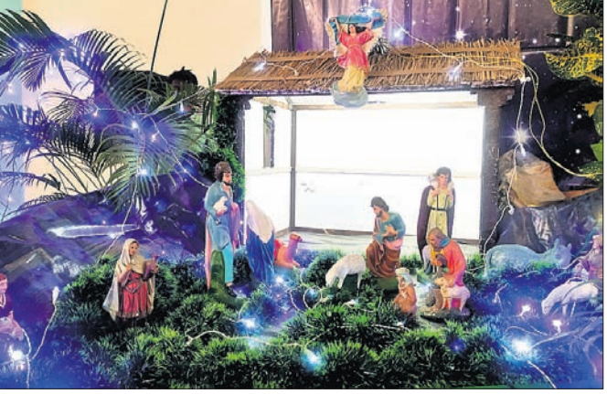
ବହୁଦିନ ପାଳନର ଅବ୍ୟବହୃତ ପୂର୍ବରୁ କଟକ କ୍ୟାଣ୍ଟନମେଣ୍ଟ ରୋଡ଼ସ୍ଥିତ କ୍ୟାଥୋଲିକ ଚର୍ଚ୍ଚରେ ସାଧକମାନେ।