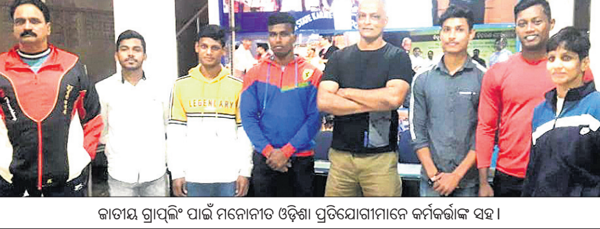
କାତୀୟ ଗ୍ରାପ୍‌ଲିଂ ପାଇଁ ମନୋନୀତ ଓଡ଼ିଶା ପ୍ରତିଯୋଗୀମାନେ କର୍ମକର୍ତ୍ତାଙ୍କ ସହ।

ଭୁବନେଶ୍ୱର, ୨୨୧୨ (କ୍ରୀଡ଼ା ପ୍ରତିନିଧି) ଭାରତୀୟ ଟେଣିସ୍ ଫିଡେରେସନ୍ ଆଗକୁ ଚେଷ୍ଟା କରି ଟେଣିସ୍ ମ୍ୟାଚ୍ ଚଳାଇବାକୁ ଚାହୁଁଛି।