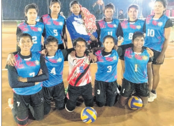
ସର୍ବଭାରତୀୟ ଗ୍ରହଣ ଯୋଗ୍ୟତା ଅର୍ଜନ କରିଥିବା କିର୍ ମହିଳା ଦଳ।

ଭୁବନେଶ୍ୱର, ୨୨୧୨ (କ୍ରୀଡ଼ା ପ୍ରତିନିଧି): ପୂର୍ଣ୍ଣାଙ୍ଗ ଆନ୍ତର୍ଜାତୀୟ ବିଶ୍ୱବିଦ୍ୟାଳୟ ଭଲିବଲ୍ (ମହିଳା) ଟୁର୍ଣ୍ଣାମେଣ୍ଟ ବାଲେଶ୍ୱରସ୍ଥିତ ଫକୀର ମୋହନ ବିଶ୍ୱବିଦ୍ୟାଳୟ ପରିସରରେ ଗତ ୨୦ତୁ ଆରମ୍ଭ ହୋଇଛି।