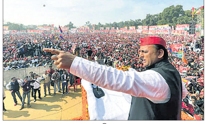
ଭଦ୍ରକୋଷଳ ଦେଉଳି ଅଖିଳେଶ ଯାଦବ ।

ସମାଜବାଦୀ ପାର୍ଟି ଅଧ୍ୟକ୍ଷ ଅଖିଳେଶ ଯାଦବଙ୍କ ସ୍ତ୍ରୀ ତଥା ପୂର୍ବତନ ଏମ୍ପି ତିମ୍ପଲ ଯାଦବ କୋଭିଡ଼ ପରିଚିତ୍ତି ଚିହ୍ନଟ ହୋଇଛନ୍ତି।