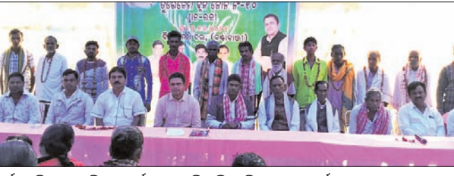
କର୍ମୀ ସମ୍ମିଳନୀ ଓ ମିଶ୍ରଣ ପର୍ବରେ ଉପସ୍ଥିତ ବିଜେଡି ନେତା ଓ କର୍ମୀ।

କଂଷାବାଞ୍ଚି, ୨୨୧୨ (ଡି.ଏନ.ଏ.): ବଲାଙ୍ଗୀର ଜିଲ୍ଲା ଭୁବନେଶ୍ୱର ବ୍ଲକ ଜୋନ ନଂ. ୧୦ର ଲକ୍ଷ୍ମୀ ଗ୍ରାମରେ କଂଷାବାଞ୍ଚି ବିଜେଡିର ଏକ କର୍ମୀ ସମ୍ମିଳନୀ ଓ ମିଶ୍ରଣ ପର୍ବ ଅନୁଷ୍ଠିତ ହୋଇଥିଲା।