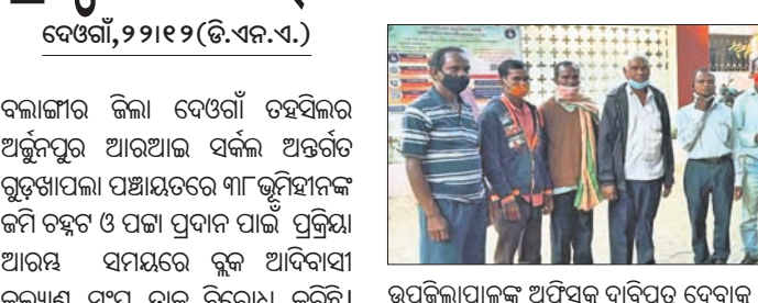
ଉପଜିଲ୍ଲାପାଳଙ୍କ ଅଧିକାରୀଙ୍କୁ ଦାବିପତ୍ର ଦେବାକୁ ଆଦେଶ ଦେବାକୁ ଆଦେଶ ଦେବାକୁ ଦାବି କରିବା ସଂଘର କର୍ମୀମାନେ।