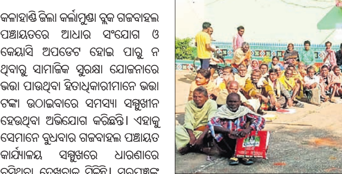
ବୃଦ୍ଧାବୃଦ୍ଧମାନେ ପଞ୍ଚାୟତ ଅଫିସ ସମ୍ମୁଖରେ ଧାରଣା ଦେଇଛନ୍ତି।