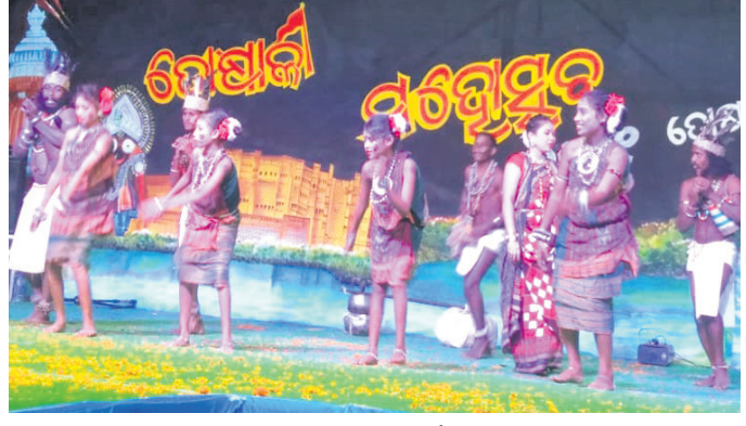
ତୋଷାଳୀ ମହୋତ୍ସବରେ ପରିବେଷିତ ସାଂସ୍କୃତିକ କାର୍ଯ୍ୟକ୍ରମ।

ତୋଷାଳୀ ମହୋତ୍ସବ-୨୧ ଉଦ୍‌ଘାଟିତ ସଂସ୍କୃତି ସ୍ତୋତ୍ର ରୁଷରା ଅଞ୍ଚଳର ଦାନ ଅନୁଜନୀୟ ବୋଲି କହିଥିଲେ। ଅଖିଳ ହୋତା ମୁଖ୍ୟବ୍ରତ୍ତା ଭାବେ ଯୋଗଦେଇ ଐତିହାସିକ ଭିକ୍ଷୁମାନଙ୍କ ଉପରେ କହିଥିଲେ।