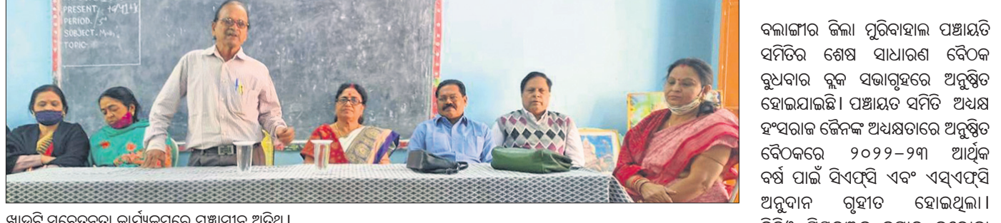
ଖାଉଟି ସଚେତନତା କାର୍ଯ୍ୟକ୍ରମରେ ମଞ୍ଚାସୀନ ଅତିଥି।