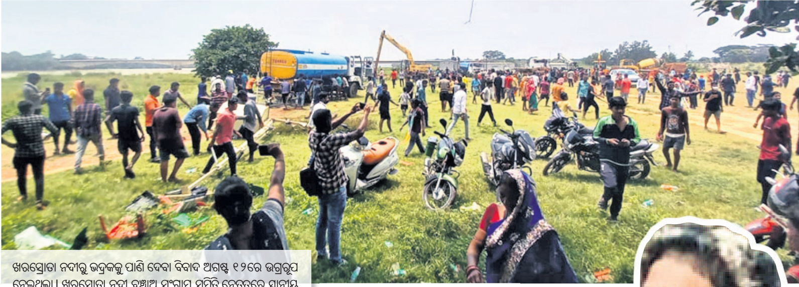
ଖରସ୍ରୋତା ନଦୀରୁ ଭଦ୍ରକକୁ ପାଣି ବେବା ବିବାଦ ଅଗଷ୍ଟ ୧୨ରେ ଉଗ୍ରରୂପ ନେଇଥିଲା। ଖରସ୍ରୋତା ନଦୀ ବଞ୍ଚାଅ ସଂଗ୍ରାମ ସମିତି ନେତୃତ୍ୱରେ ସ୍ଥାନୀୟ ଲୋକମାନେ ୧୪୪ ଧାରା ସତ୍ତ୍ୱେ ବହୁଶୀତାରେ ନିର୍ମାଣଧୀନ ପ୍ରକଳ୍ପର ବିଭିନ୍ନ ସାମଗ୍ରୀ ଭଙ୍ଗାଢ଼ୁଆ କରିବା ସହ ନିଆଁ ଲଗାଇ ଦେଇଥିଲେ। ରଣକ୍ଷେତ୍ର ପାଲଟି ଥିଲା ସେହି ସ୍ଥାନ। ପୋଲିସ ଓ ଆନ୍ଦୋଳନକାରୀ ମୁହାଁମୁହିଁ ହୋଇଥିଲେ। ଏହି ଘଟଣାରେ ୨୪ ଜଣଙ୍କୁ ପୋଲିସ ଗିରଫ ସହ ୮ଶହରୁ ଊର୍ଦ୍ଧ୍ୱ ଲୋକଙ୍କ ନାମରେ ମାମଲା ରୁଜୁ କରିଥିଲା।