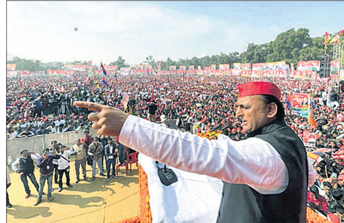
ଯୋଗଦେଇଥିଲେ। ସୋମବାରରୁ ତିନି ଦିନ ଯାଏଁ ଫିଲ୍ଡରେ ପ୍ରଧାନମନ୍ତ୍ରୀ ସେ ପଶ୍ଚିମ ଉତ୍ତରପ୍ରଦେଶରେ ନିର୍ବାଚନ ନରେନ୍ଦ୍ର ମୋଦିଙ୍କ ଫଟୋ ହଟିଲେ ସେ ପ୍ରଚାରରେ ବ୍ୟସ୍ତ ରହିଛନ୍ତି। ଏପର୍ଯ୍ୟନ୍ତ ତିନି ଦିନ ଯାଏଁ ଗତ ମାସରେ ଅଧିକାରୀ କୋଭିଡ଼ ଚିକିତ୍ସା ନେଇନାହାନ୍ତି। ଏକ ସାକ୍ଷାତ୍କାରରେ କହିଥିଲେ।

ସମାଜବାଦୀ ପାର୍ଟି ଅଧ୍ୟକ୍ଷ ଅଧିକାରୀ ଯାଦବଙ୍କ ସ୍ତ୍ରୀ ତଥା ପୂର୍ବତନ ଏମ୍ପି ତିମ୍ପଲ ଯାଦବ କୋଭିଡ଼ ପଜିଟିଭ୍ ଚିହ୍ନଟ ହୋଇଛନ୍ତି। ସେ ଏବେ ଆଇସୋଲେସନରେ ଥିବା ବୁଲ୍ କରି ଜଣାଇ ଏବଂ ନିକଟରେ ତାଙ୍କ ସଂସ୍ପର୍ଶରେ ଆସିଥିବା ଲୋକେ ନିଜକୁ ପରୀକ୍ଷା କରାଇନେବାକୁ ପରାମର୍ଶ ଦେଇଛନ୍ତି। ସ୍ତ୍ରୀ କରୋନା ସଂକ୍ରମିତ ହୋଇଥିବା ସତ୍ତ୍ୱେ ଅଧିକାରୀ ନିର୍ବାଚନ ପ୍ରଚାରରେ ବ୍ୟସ୍ତ ରହିଛନ୍ତି। ଗୁରୁବାର ଆଲିଗଡ଼ଠାରୁ ଅନୁକ୍ରମେ ହେବାକୁ ଥିବା ରାଲିରେ ତାଙ୍କ ସହ ରାଷ୍ଟ୍ରୀୟ ଲୋକ ଦଳ ନେତା ଜୟନ୍ତ ଚୌଧୁରୀ ଯୋଗଦେବେ। ଗତ ରବିବାର ଅଧିକାରୀ ଲକ୍ଷ୍ନୌରେ ଏକ ଜନସଭାରେ