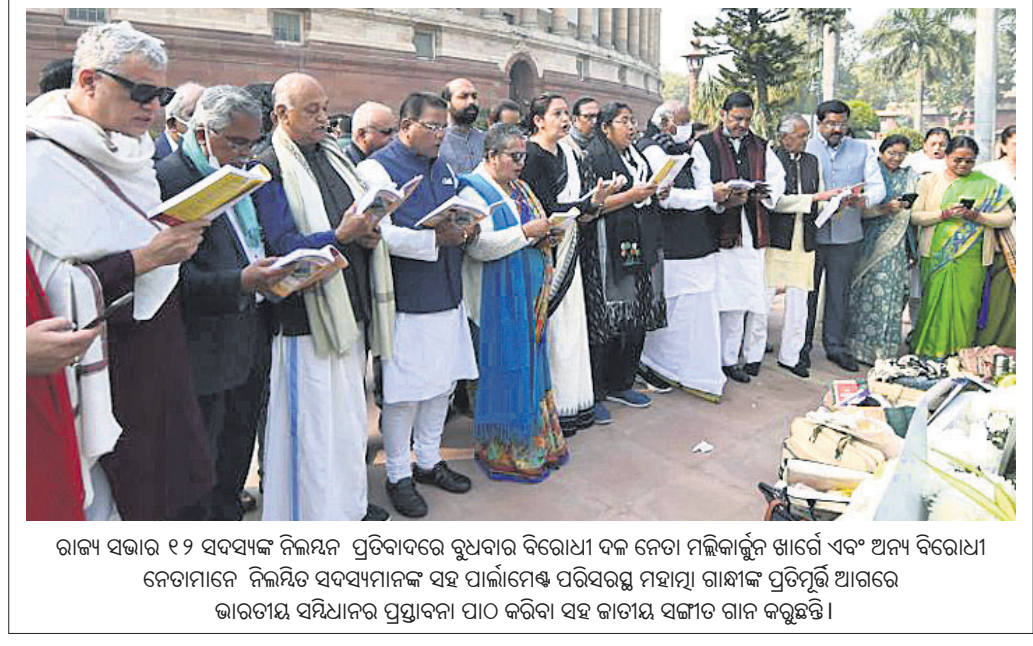
ରାଜ୍ୟ ସଭାର ୧୨ ସଦସ୍ୟଙ୍କ ନିଲମ୍ବିତ ପ୍ରତିବାଦରେ ରୁଧିରା ବିରୋଧୀ ଦଳ ନେତା ମିଲିକାର୍ଜୁନ ଖାନ୍ ଏବଂ ଅନ୍ୟ ବିରୋଧୀ ନେତାମାନେ ନିଲମ୍ବିତ ସଦସ୍ୟମାନଙ୍କ ସହ ପାର୍ଲିମେଣ୍ଟ ପରିସରକୁ ମହାତ୍ମା ଗାନ୍ଧୀଙ୍କ ପ୍ରତିମୂର୍ତ୍ତି ଆଗରେ ଭାରତୀୟ ସମ୍ବିଧାନର ପ୍ରସ୍ତାବନା ପାଠ କରିବା ସହ ଜାତୀୟ ସଙ୍ଗୀତ ଗାନ କରୁଛନ୍ତି।