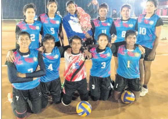
ସର୍ବଭାରତୀୟ ସ୍ତରକୁ ଯୋଗ୍ୟତା ଅର୍ଜନ କରିଥିବା କିଟ୍ ମହିଳା ଦଳ ।

ଭୁବନେଶ୍ୱର, ୨୨୧୨ (କ୍ରାନ୍ତୀ ପ୍ରତିନିଧି): ପୂର୍ବାଞ୍ଚଳ ଆନ୍ତଃ ବିଶ୍ୱବିଦ୍ୟାଳୟ ଭଲିବଲ (ମହିଳା) ଟୁର୍ନାମେଣ୍ଟ ବାଲେଶ୍ୱରସ୍ଥିତ ଫକିର ମୋହନ ବିଶ୍ୱବିଦ୍ୟାଳୟ ପରିସରରେ ଗତ ୨୦ରୁ ଆରମ୍ଭ ହୋଇଛି। ୨୩ ତାରିଖରେ ଏହା ଶେଷ ହେବ। ଏହାର ପୁଲ୍ କାଲିଫାଲ୍ ମ୍ୟାଚ୍‌ରେ କିଟ୍ ବିଶ୍ୱବିଦ୍ୟାଳୟ ଏମ୍‌ଜି କାଶି ବିଦ୍ୟାପୀଠକୁ ୩-୦ (୨୫-୧୧, ୨୫-୬, ୨୫-୪) ସେଟ୍‌ରେ ପରାସ୍ତ କରିଛି। ସୁପର ଲିଗ୍ ମ୍ୟାଚ୍ ରୁଡ଼ିକରେ ଶୀର୍ଷ ୪ ଦଳ ମଧ୍ୟରେ କିଟ୍ ବିଶ୍ୱବିଦ୍ୟାଳୟ ଏହାର ପ୍ରଥମ ମ୍ୟାଚ୍‌ରେ ରାୟପୁରର ପଞ୍ଚିତ ରବି ଶଙ୍କର ଶୁକ୍ଳ ବିଶ୍ୱବିଦ୍ୟାଳୟକୁ ୩-୦ (୨୫-୧୧, ୨୫-୬, ୨୫-୧୨) ସେଟ୍‌ରେ ହରାଇ ଦେଇଛି। ସେହିପରି ବିଜୟୀ ହୋଇ ମ୍ୟାଚ୍‌ରେ କିଟ୍ ପଶ୍ଚିମବଙ୍ଗର ବର୍ଦ୍ଧମାନ ବିଶ୍ୱବିଦ୍ୟାଳୟକୁ ୩-୦ (୨୫-୧୪, ୨୫-୨୩, ୨୫-୧୫) ସେଟ୍‌ରେ ପରାସ୍ତ କରିଛି। ଗୁରୁବାର କିଟ୍ ଏହାର ଶେଷ ଲିଗ୍ ମ୍ୟାଚ୍ କୋଲକାତାର ଆଦାମାସ ବିଶ୍ୱବିଦ୍ୟାଳୟ ବିପକ୍ଷରେ ୨୦୨୨ ଜାନୁୟାରୀ ୪ରୁ ୬ ପର୍ଯ୍ୟନ୍ତ ଅନୁଷ୍ଠିତ ହେବ।