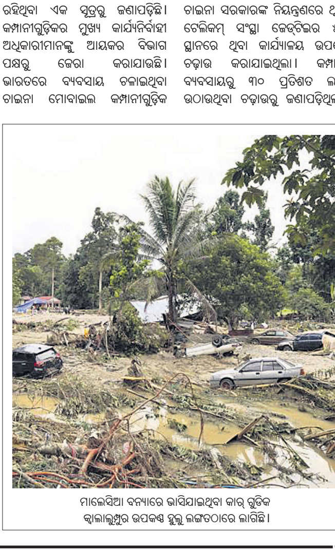
ମାଲେସିଆ ବନ୍ୟାରେ ଭାସିଯାଇଥିବା କାର ଗୁଡ଼ିକ କ୍ୱାଲାଲୁମ୍ପୁର ଉପକଣ୍ଠ ହୁଲୁ ଲଙ୍ଗଟଠାରେ ଲାଗିଛି।

ଭାରତରେ ଥିବା ଚାଲନ୍ଦାର ମୋବାଇଲ କମ୍ପାନୀଗୁଡ଼ିକ ଉପରେ ଆୟକର ବିଭାଗ ପକ୍ଷରୁ ଚଢ଼ାଉ କରାଯାଇଛି। ଓପୋ, ସାଓମି, ଓପ୍ପୋ ଆଦି କମ୍ପାନୀର ୨୫ରୁ ଉର୍ଦ୍ଧ୍ୱ ସ୍ଥାନରେ ଥିବା କାର୍ଯ୍ୟକ୍ରମରେ ଆୟକର ଅଧିକାରୀମାନେ ତଳାଧି କରିଥିଲେ। ଦିଲ୍ଲୀ, ମୁମ୍ବାଇ, ବେଙ୍ଗାଲୁରୁ,