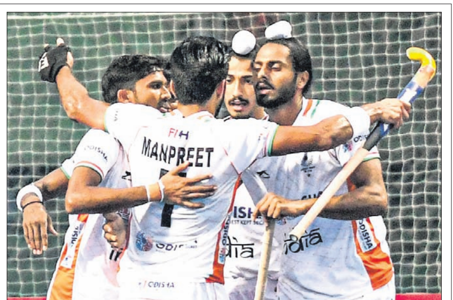
ଭାରତୀୟ ପାକିସ୍ତାନକୁ ହରାଇବାପରେ ଖୁସି ପୁହୁର୍ତ୍ତରେ ଭାରତୀୟ ଖେଳାଳି ।