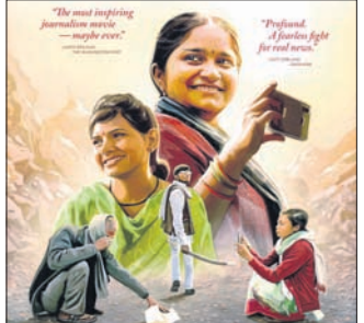
ପରିଚାଳିତ ଏକ ଖବରକାଗଜ 'ଖବର ଲହରିଆ'ର ଉତ୍ପାଦନ ଉପରେ ଆଧାରିତ।