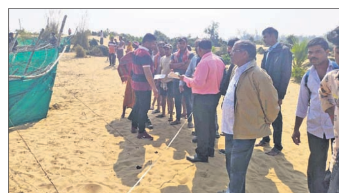
ପ୍ରଶାସନିକ ଅଧିକାରୀମାନେ ପାନ ବରଜକୁ ଭାଙ୍ଗିଥିବା ପୂର୍ବରୁ ମାପୁଛନ୍ତି।