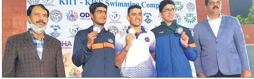
କୃତୀ ପ୍ରତିଯୋଗୀମାନେ ପଦକ ସହ ଅତିଥିଙ୍କ ଗହଣରେ ।

ଭୁବନେଶ୍ୱର, ୨୨୧୨ (କ୍ରୀଡ଼ା ପ୍ରତିନିଧି): ଭାରତୀୟ ବିଶ୍ୱବିଦ୍ୟାଳୟ ସଂଘ (ଏଆଇୟୁ) ଆନୁକୁଲ୍ୟରେ କିଟ୍ ଓ କିସ୍ ପରିସରରେ ସର୍ବଭାରତୀୟ ଆନ୍ତଃ ବିଶ୍ୱବିଦ୍ୟାଳୟସ୍ତରୀୟ ସନ୍ତରଣ (ମହିଳା ଓ ପୁରୁଷ) ଚାମ୍ପିୟନଶିପ୍ ରୁଖିବାର ଉଦ୍‌ଘାଟିତ ହୋଇଛି। ଏହି ପ୍ରତିଯୋଗିତାରେ ସର୍ବଭାରତୀୟ ସ୍ତରରେ ଓଡ଼ିଶା ସମେତ ବିଭିନ୍ନ ରାଜ୍ୟର ୩୧୦ଟି ବିଶ୍ୱବିଦ୍ୟାଳୟରୁ ୧୫୫୫ରୁ ଊର୍ଦ୍ଧ୍ୱ ପ୍ରତିଯୋଗୀ ଓ ଅତିଥିଆଳୁ ଅଂଶଗ୍ରହଣ କରିଛନ୍ତି। ୨୭ ପର୍ଯ୍ୟନ୍ତ ଚାଲିବାରୁ ଏହା ଏହି ଚାମ୍ପିୟନଶିପ୍‌ରେ ସମସ୍ତ ପ୍ରତିଯୋଗିତା କିସ୍ ଅନ୍ତର୍ଗତୀୟ ଗୁଡ଼ିଫି ପୁଲରେ ଅନୁଷ୍ଠିତ ହେଉଛି। କିସ୍ ପୁଲ୍ ପୁଲ୍ ଅନ୍ତର୍ଗତୀୟ ମାନର ହୋଇଥିବାରୁ ଏଠାରେ ଏକାଧରକେ ଏତେ ସଂଖ୍ୟକ ସନ୍ତରଣକାରୀଙ୍କୁ ନେଇ ପ୍ରତିଯୋଗିତା ସମ୍ପନ୍ନ ହୋଇଛି। ପ୍ରଥମ ଥର ଲାଗି