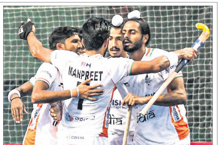
ରୁଖିବାର ପାକିସ୍ତାନକୁ ହରାଇବାପରେ ଖୁସି ପୁହୁର୍ଣ୍ଣରେ ଭାରତୀୟ ଖେଳାଳି ।