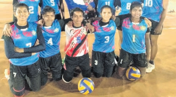
ସର୍ବଭାରତୀୟ ସ୍ତରୀୟ ଯୋଗ୍ୟତା ଅର୍ଜନ କରିଥିବା କିସ୍ ମହିଳା ଦଳ ।

ଭୁବନେଶ୍ୱର, ୨୨୧୨ (କ୍ରୀଡ଼ା ପ୍ରତିନିଧି): ପୂର୍ବାଞ୍ଚଳ ଆନ୍ତଃ ବିଶ୍ୱବିଦ୍ୟାଳୟ ଭଳିବଲ୍ (ମହିଳା) ଟୁର୍ନାମେଣ୍ଟ ବାଲେଶ୍ୱରସ୍ଥିତ ଫିଲଡ୍ ମୋହନ ବିଶ୍ୱବିଦ୍ୟାଳୟ ପରିସରରେ ଗତ ୨୦ରୁ ଆରମ୍ଭ ହୋଇଛି। ୨୩ ତାରିଖରେ ଏହା ଶେଷ ହେବ। ଏହାର ପୁଲ୍ କ୍ରୀଡ଼ାମାଳା ମ୍ୟାଚରେ କିସ୍ ବିଶ୍ୱବିଦ୍ୟାଳୟ ଏମ୍‌ସି କାଶି ବିଦ୍ୟାଳୟ ୩-୦ (୨୫-୧୧, ୨୫-୭, ୨୫-୪) ସେଟ୍‌ରେ ପରାସ୍ତ କରିଛି। ସୁପର ଲିଗ୍ ମ୍ୟାଚ ରୁଡ଼ିକରେ ଶୀର୍ଷ ୪ ଦଳ ମଧ୍ୟରେ କିସ୍ ବିଶ୍ୱବିଦ୍ୟାଳୟ ଏହାର ପ୍ରଥମ ମ୍ୟାଚରେ ରାୟସୁରେ ପଞ୍ଚିତ ରହି ଶଙ୍କର ଶୁକ୍ଳ ବିଶ୍ୱବିଦ୍ୟାଳୟକୁ ୩-୦ (୨୫-୧୧, ୨୫-୭, ୨୫-୧୨) ସେଟ୍‌ରେ ହରାଇ ଦେଇଛି। ସେହିପରି ବିଜୟୀ ପକ୍ଷରେ କିସ୍ ପଶ୍ଚିମବଙ୍ଗର ବର୍ଦ୍ଧମାନ ବିଶ୍ୱବିଦ୍ୟାଳୟ ୩-୦