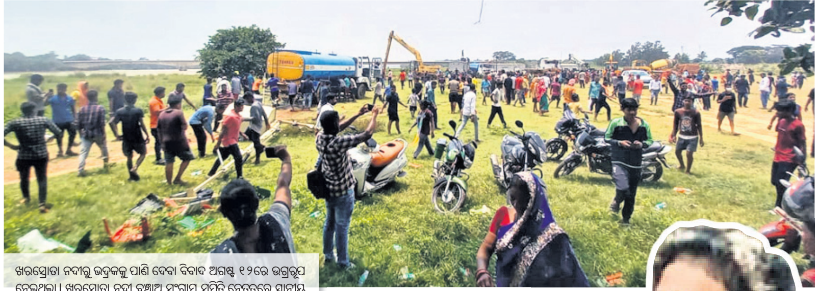
ଖରସ୍ରୋତା ନଦୀରୁ ଭଦ୍ରକକୁ ପାଣି ବେବା ବିବାଦ ଅଗଷ୍ଟ ୧୨ରେ ଉଗ୍ରରୂପ ନେଇଥିଲା। ଖରସ୍ରୋତା ନଦୀ ବଞ୍ଚାଅ ସଂଗ୍ରାମ ସମିତି ନେତୃତ୍ୱରେ ସ୍ଥାନୀୟ ଲୋକମାନେ ୧୪୪ ଧାରା ସତ୍ତ୍ୱେ ବହୁଶାନ୍ତିହୀନ ନିର୍ମାଣାଧୀନ ପ୍ରକଳ୍ପର ବିଭିନ୍ନ ସାମଗ୍ରୀ ଭଙ୍ଗାଢ଼ଙ୍ଗା କରିବା ସହ ନିଆଁ ଲଗାଇ ଦେଇଥିଲେ। ଋଣକ୍ଷେତ୍ର ପାଲଟି ଥିଲା ସେହି ସ୍ଥାନ। ପୋଲିସ ଓ ଆନ୍ଦୋଳନକାରୀ ମୁହାଁମୁହିଁ ହୋଇଥିଲେ। ଏହି ଘଟଣାରେ ୨୪ ଜଣଙ୍କୁ ପୋଲିସ ଗିରଫ ସହ ୮ଶହରୁ ଊର୍ଦ୍ଧ୍ୱ ଲୋକଙ୍କ ନାମରେ ମାମଲା ରୁଜୁ କରିଥିଲା।