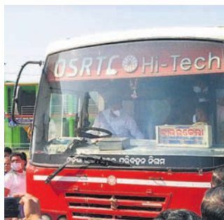
ନୟାଗଡ଼ ଜିଲ୍ଲା ସରକାର ମହକୁମାର ଦୁଆ ବସ୍ ଟର୍ମିନାଲରେ ଉଚ୍ଚଶିକ୍ଷା ମନ୍ତ୍ରୀଙ୍କୁ ଉପସ୍ଥାପନ କରିବା ପାଇଁ ଯୋଜନା କରିଛନ୍ତି।