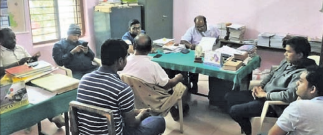
ରୌପ୍ୟ ଜୟନ୍ତୀ ବୈଠକରେ କମିଟି କର୍ମକର୍ମୀ ।

ଖଣ୍ଡପଡ଼ା ବ୍ଲକ ମର୍ଦ୍ଦାକପୁର ଶାନ୍ତିପ୍ରସାଦ ଉଚ୍ଚ ବିଦ୍ୟାଳୟରେ ରୌପ୍ୟ ଜୟନ୍ତୀ ଉତ୍ସବ ଗୁରୁବାର (୨୩ ତାରିଖ)ଠାରୁ ଆରମ୍ଭ ହେବ । ଏହା ୨୪ ତାରିଖ ପର୍ଯ୍ୟନ୍ତ ଚାଲିବ ।