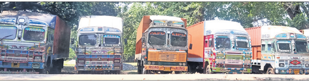
ମାଘମେଳା ପଡ଼ିଆରେ ରଖାଯାଇଥିବା କର୍ଷଣକର ।

ପ୍ରତିବର୍ଷ ପରି ଆଗାମୀ ଫେବୃଆରୀରେ ଶ୍ରୀନାଳମାଧବଙ୍କ ପ୍ରସିଦ୍ଧ ଅନୁଷ୍ଠିତ ହେବ । ମେଳା ପାଠମେଳା ଅନୁଷ୍ଠିତ ହେବା ପରେ ପଡ଼ିଆରେ ଉଚ୍ଚ ଗାଡ଼ିଗୁଡ଼ିକ ରହିଥିବାରୁ ମେଳାକୁ ଆହୁଥିବା ବ୍ୟବସାୟୀଙ୍କ ପାଇଁ ସମସ୍ୟା ସୃଷ୍ଟି ହେବ ବୋଲି ଅଭିଯୋଗ ହୋଇଛି ।