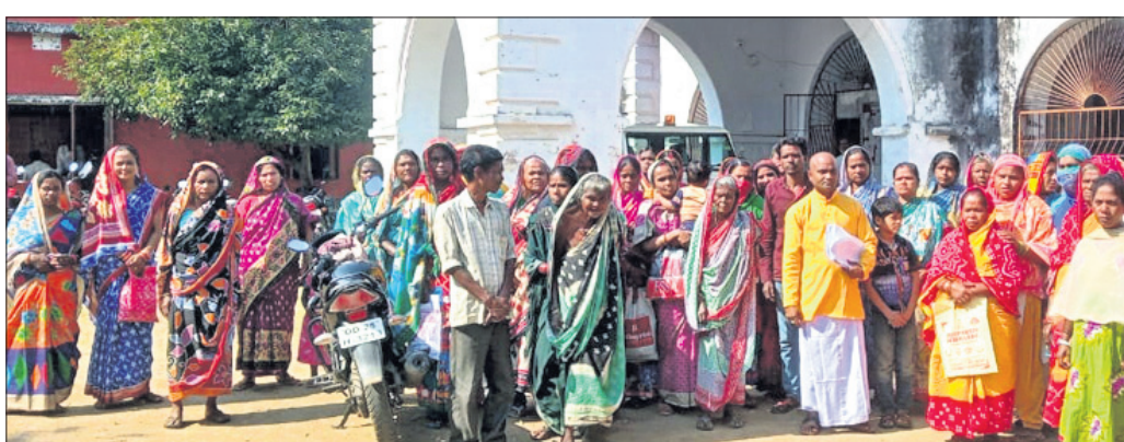
ଖଣ୍ଡପଡ଼ା ତହସିଲଦାରଙ୍କୁ ଦାବିପତ୍ର ପ୍ରଦାନ କରିବାକୁ ଆସିଥିବା ଲୋକମାନେ ।

ନାରବସ୍ତ୍ରାଣୁ ସାଜିଛନ୍ତି । ପ୍ରଶାନ୍ତିକ ବସ୍ତ୍ରାଣୁ ଯୋଜନାରେ ଭୁବନେଶ୍ୱର ପରିବାର ବର୍ଗକୁ ଟିକ୍ସ କରି ସରକାର ଜାଗା ପକା ପ୍ରଦାନ କରିବାର ଦିଅଁ ବ୍ୟବସ୍ଥା ରହିଛି ।