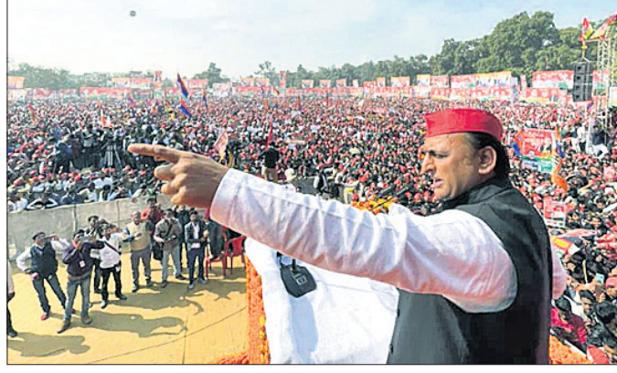
ଭଦ୍ରାପାଳରେ ଅଖିଳେଶ ଯାଦବ

ସମାଜବାଦୀ ପାର୍ଟି ଅଧ୍ୟକ୍ଷ ଅଖିଳେଶ ଯାଦବଙ୍କ ସ୍ତ୍ରୀ ତଥା ପୂର୍ବତନ ଏମ୍ପି ତିମ୍ପଲ ଯାଦବ କୋଭିଡ଼ ପରିଚିତ୍ତିକ ରିକ୍ଟ୍ ହୋଇଛନ୍ତି।