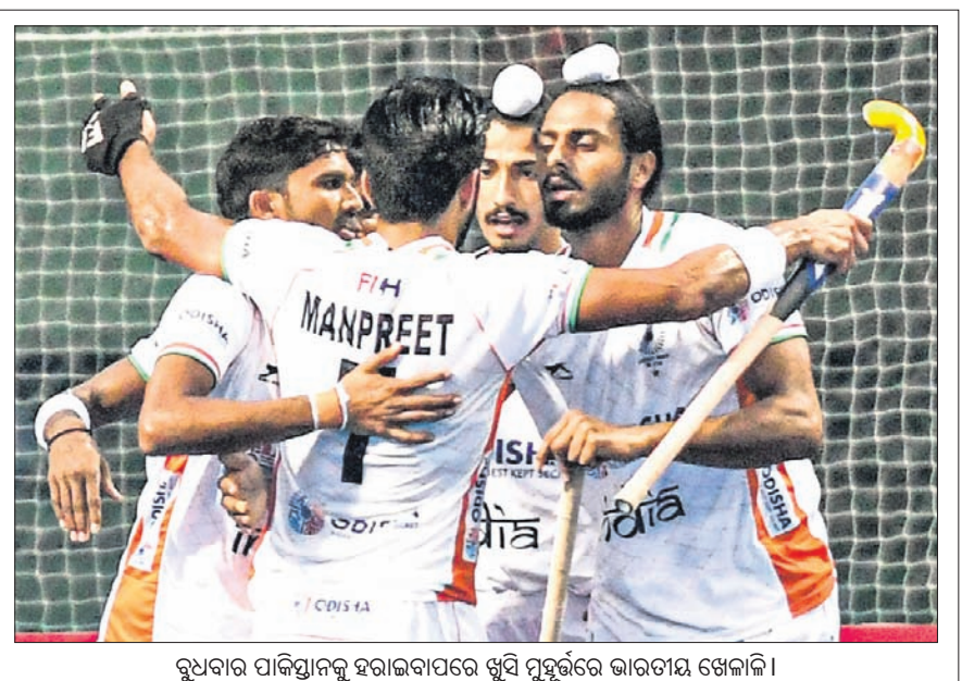
ବୁଧବାର ପାକିସ୍ତାନକୁ ହରାଇବାପରେ ଖୁସି ପୁହୁର୍ଣ୍ଣରେ ଭାରତୀୟ ଖେଳାଳି।