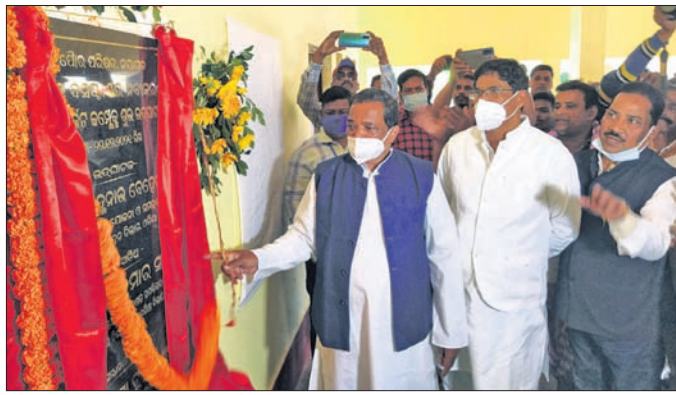
ନୂଆ ବସ୍ତ୍ରାଣୁ ଓ ମାଲିକ କମ୍ପ୍ୟୁଟର ମାଟ୍ରିକ୍ୟୁଲେସନ୍ ପ୍ରୋଗ୍ରାମର ଉଦ୍ଘାଟନ କରୁଛନ୍ତି । ପାଖରେ ଅଛନ୍ତି ଉଚ୍ଚଶିକ୍ଷା ମନ୍ତ୍ରୀ ଅରୁଣ କୁମାର ସାହୁ ।