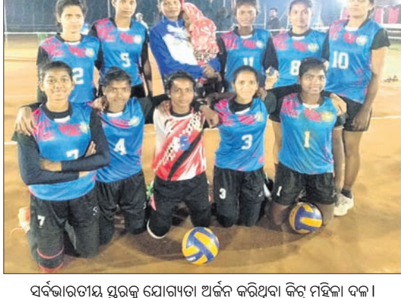
ସର୍ବଭାରତୀୟ ସ୍ତରକୁ ଯୋଗ୍ୟତା ଅର୍ଜନ କରିଥିବା କିଟ୍ ମହିଳା ଦଳ।

ଭୁବନେଶ୍ୱର, ୨୨୧୨ (କ୍ରାନ୍ତୀ ପ୍ରତିନିଧି) ପୂର୍ବାଞ୍ଚଳ ଆନ୍ତଃ ବିଶ୍ୱବିଦ୍ୟାଳୟ ଭଲିବଲ୍ (ମହିଳା) ଟୁର୍ନାମେଣ୍ଟ ବାଲେଶ୍ୱରସ୍ଥିତ ଫକିର ମୋହନ ବିଶ୍ୱବିଦ୍ୟାଳୟ ପରିସରରେ ଗତ ୨୦ତୁ ଆରମ୍ଭ ହୋଇଛି। ୨୩ ତାରିଖରେ ଏହା ଶେଷ ହେବ। ଏହାର ପୁଲ୍ କାଲିପାଲ୍ ମ୍ୟାଚରେ କିଟ୍ ବିଶ୍ୱବିଦ୍ୟାଳୟ ଏମ୍‌ଜି କାଶି ବିଦ୍ୟାପୀଠକୁ ୩-୦ (୨୫-୧୧, ୨୫-୬, ୨୫-୪) ସେଟ୍‌ରେ ପରାସ୍ତ କରିଛି। ସୁପର ଲିଗ୍ ମ୍ୟାଚ ରୁଡ଼ିକରେ ଶୀର୍ଷ ୪ ଦଳ ମଧ୍ୟରେ କିଟ୍ ବିଶ୍ୱବିଦ୍ୟାଳୟ ଏହାର ପ୍ରଥମ ମ୍ୟାଚରେ ରାୟପୁରର ପଣ୍ଡିତ ରବି ଶଙ୍କର ଶୁକ୍ଳା ବିଶ୍ୱବିଦ୍ୟାଳୟକୁ ୩-୦ (୨୫-୧୧, ୨୫-୬, ୨୫-୧୨) ସେଟ୍‌ରେ ହରାଇ ଦେଇଛି। ସେହିପରି ବିତାୟ ବିସ୍ତରରେ କିଟ୍ ପଶ୍ଚିମବଙ୍ଗର ବର୍ଦ୍ଧମାନ ବିଶ୍ୱବିଦ୍ୟାଳୟକୁ ୩-୦