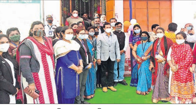
ଖାତରୁ ସେଣ୍ଟର ସମାପନ ନିକଟ୍ସ ରୁହ ଉଦଘାଟିତ। ଏହି କେନ୍ଦ୍ର ଦ୍ୱାରା ମହିଳାଙ୍କ ସମାପନା କରିବାରେ ଆହୁରି ସହଜ ହେବ। ଏହାକୁ ଲୋକାଭିମୁଖୀ କରିବା ପାଇଁ ସମସ୍ତ ସହଯୋଗ କରାଯିବ। ସୂଚନାଯୋଗ୍ୟ, ୧୭ କର୍ମଚାରୀଙ୍କୁ ୩୭ ମାମଲା ବିଚାରାଧୀନ ରହିଛି।