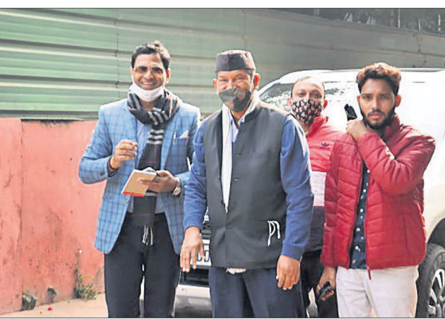
ନୂଆଦିଲ୍ଲୀରେ କଂଗ୍ରେସ ନେତା ରାହୁଲ ଗାନ୍ଧୀଙ୍କୁ ଭେଟିବାକୁ ଯାଉଥିବା ଉତ୍ତରାଖଣ୍ଡର ପୂର୍ବତନ ମୁଖ୍ୟମନ୍ତ୍ରୀ ହରିଶ ରାଫ୍ଟ

ନୂଆଦିଲ୍ଲୀ, ୨୫ ଡିସେମ୍ବର ଉତ୍ତରାଖଣ୍ଡ ବିଧାନସଭା ନିର୍ବାଚନରେ ପୂର୍ବତନ ମୁଖ୍ୟମନ୍ତ୍ରୀ ହରିଶ ରାଫ୍ଟ କଂଗ୍ରେସର ନେତୃତ୍ୱ ନେବେ। ସେ କଂଗ୍ରେସ ପ୍ରଚାର କମିଟିର ମଙ୍ଗ ଧରିବେ ବୋଲି ଗୁରୁବାର ପୂର୍ବଦିନ ଦେଖାଗଲା। କଂଗ୍ରେସରେ ତାଙ୍କୁ ଅଣଦେଖା କରାଯାଉଥିବା ଅଭିଯୋଗ ଆଣି ରାଫ୍ଟର ପୂର୍ବ ଦୁଇମାସ ଧରି ବିରୋଧ କରିବା ପରେ ତାଙ୍କ ମନ ବଦଳିଲା। ତେବେ ନିର୍ବାଚନରେ କଂଗ୍ରେସ ବିଜୟ ହେଲେ କିଏ ମୁଖ୍ୟମନ୍ତ୍ରୀ ହେବେ ତାହା ପରବର୍ତ୍ତୀ ସମୟରେ ନିଷ୍ପତ୍ତି ନିଆଯିବ ବୋଲି ରାଫ୍ଟ କହିଛନ୍ତି। ପ୍ରକାଶ ଯେ, ବିରକ୍ଷ କଂଗ୍ରେସ ନେତା ହରିଶ ରାଫ୍ଟ