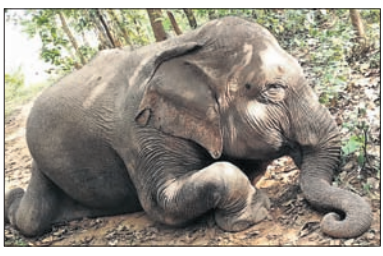
ମୃତ ମାଙ୍କଡ଼ାହାତୀ । ଅଭିଯୋଗ ହୋଇଛି । ଏଥିପାଇଁ ବନ ବିଭାଗର ଅବହେଳାକୁ ଦାୟୀ କରିଛନ୍ତି ପୂର୍ବତନ ବିଧାୟକ

ଡେକାନାଲ ଅଫିସ, ୨୪।୧୨ ଡେକାନାଲ ଜିଲା ଷଡ଼ଙ୍ଗା ରେଞ୍ଜ ଅଧୀନ ଲହଡ଼ା ସଂରକ୍ଷିତ ଜଙ୍ଗଲରେ ଶୁକ୍ରବାର ଏକ ଗର୍ଭିଣୀ ହାତୀର ମୃତ୍ୟୁ ଘଟିଛି । ମୃତ ମାଙ୍କଡ଼ାହାତୀର ଆନୁମାନିକ ବୟସ ୧୫ବର୍ଷ ହେବ । ବ୍ୟବହୃତ ସମୟରେ ଏହାର ପେଟରୁ ଏକ ମୃତ ଅଣ୍ଡିଆ ହାତୀ ଶାବକ ବାହାରିଛି । ତେବେ ହାତୀମୃତ୍ୟୁକୁ ନେଇ ସ୍ଥାନୀୟ ବାସିନ୍ଦା ଏବଂ ବନ ବିଭାଗ ମଧ୍ୟରେ ମତପାର୍ଥକ୍ୟ ଦେଖାଦେଇଛି । ଉକ୍ତ ହାତୀ କପିଳାସ ଅଭୟାରଣ୍ୟର ପିମ୍ପିରିଆ ନିକଟ ଗ୍ରେଡ଼ରେ ପଡ଼ି ମରିଥିବା ସାଧାରଣରେ