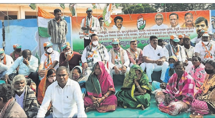
ବିଭିନ୍ନ ପ୍ରସଙ୍ଗରେ ଶୁକ୍ରବାର ଖୋର୍ଦ୍ଧା ଜିଲ୍ଲାପାଳଙ୍କ କାର୍ଯ୍ୟାଳୟ ଆଗରେ କଂଗ୍ରେସ ପକ୍ଷରୁ ବିଶୋଭ ପ୍ରଦର୍ଶନ ।