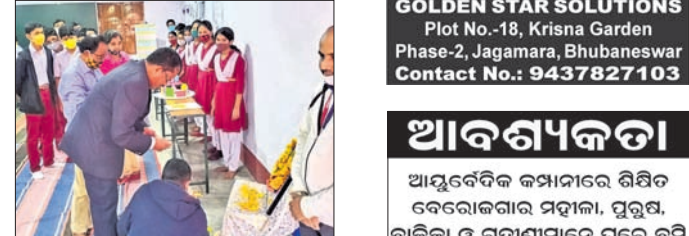
ଅତିଥିମାନେ ଛାତ୍ରାଛାତ୍ରୀଙ୍କୁ ପ୍ରକଳ୍ପ ବୁଝାଉଛନ୍ତି।