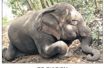
ମୃତ ମାଛହାତୀ। ଡେକାନାଲ ଅଫିସ, ୨୪୧୧୨

ଡେକାନାଲ ଜିଲା ଷଡ଼ଙ୍ଗା ରେଞ୍ଜ୍ ଅଧୀନ ଲହଡ଼ା ସଂରକ୍ଷିତ ଜଙ୍ଗଲରେ ଶୁକ୍ରବାର ଏକ ଗର୍ଭିଣୀ ହାତୀର ମୃତ୍ୟୁ ଘଟିଛି। ମୃତ ମାଛହାତୀର ଆନୁମାନିକ ବୟସ ୧୫ବର୍ଷ ହେବ। ବ୍ୟବଚ୍ଛେଦ ସମୟରେ ଏହାର ପେଟରୁ ଏକ ମୃତ ଅକ୍ଷିରା ହାତୀ ଶାବକ ବାହାରିଛି।