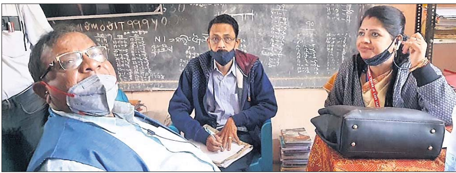
ଅଭିଯୋଗର ତଦନ୍ତ କରିବାକୁ ଆସିଥିବା ଶିକ୍ଷା ବିଭାଗ ଅଧିକାରୀମାନେ ।