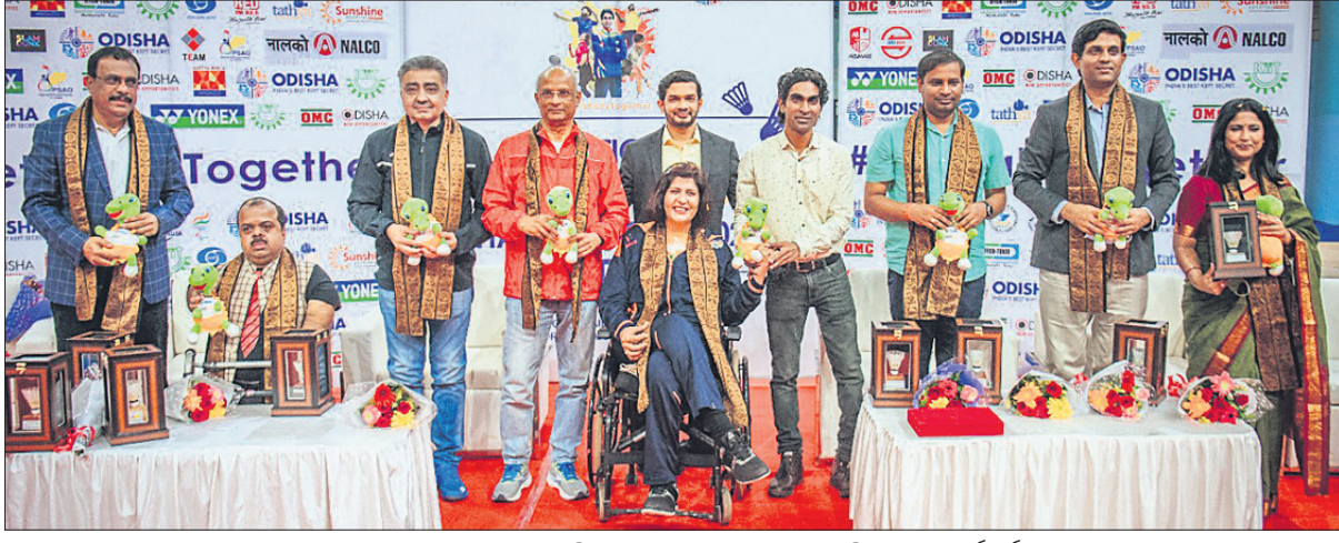
ଶୁକ୍ରବାର ଜାତୀୟ ପାରା ବ୍ୟାଡମିଣ୍ଟନ ଉଦ୍‌ଘାଟନା ଉତ୍ସବରେ ଅତିଥିଙ୍କ ସହ କର୍ମକର୍ତ୍ତା ।