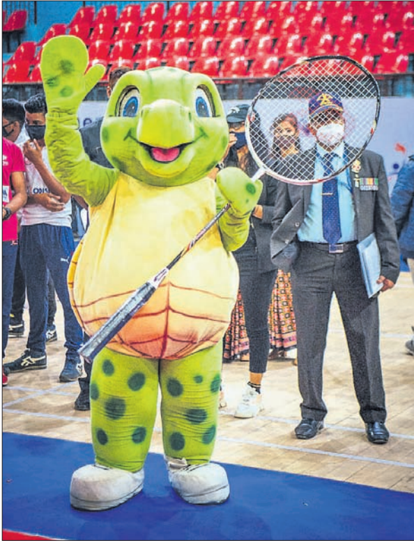
ରେଲଡେ ଇନଡୋର ଷ୍ଟାଡ଼ିୟମରେ ଶୁକ୍ରବାର ଆରମ୍ଭ ହୋଇଥିବା ଚତୁର୍ଥ ଜାତୀୟ ପାରା ବ୍ୟାଡମିଣ୍ଟନ ଚାମ୍ପିୟନଶିପ୍ରେ ଖେଳିବା ଅବସରରେ ଭୁଜ ପ୍ରତିଯୋଗୀ ।