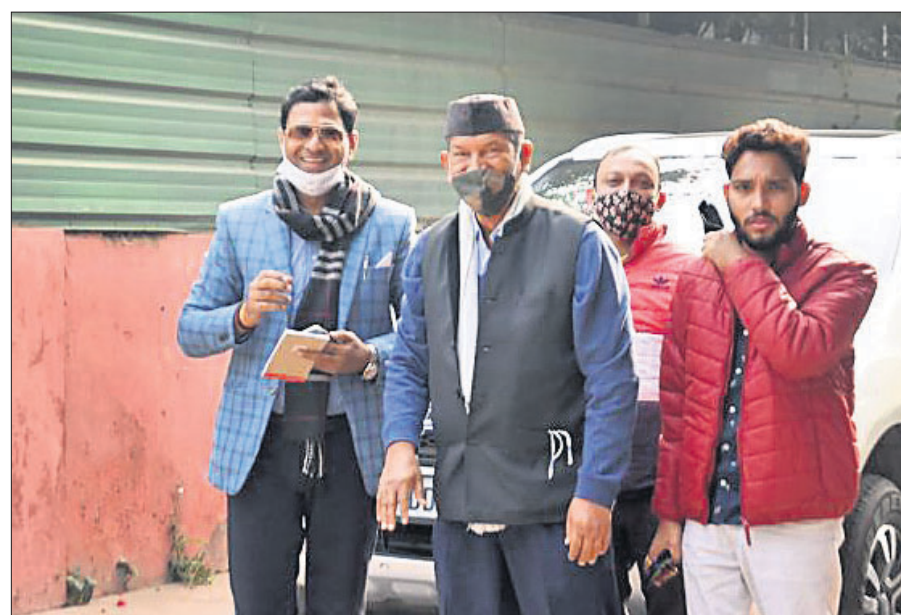
ନୂଆଦିଲ୍ଲୀରେ କଂଗ୍ରେସ ନେତା ରାଝିତ୍ ଗାନ୍ଧୀଙ୍କୁ ଭେଟିବାକୁ ଯାଇଥିବା ଉତ୍ତରାଖଣ୍ଡର ପୂର୍ବତନ ମୁଖ୍ୟମନ୍ତ୍ରୀ ହରିଶ ଚାଓଓ୍ଵେ ।