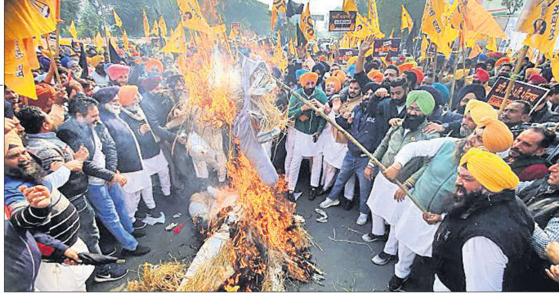
ଅମୃତସରରେ ଶିରୋମଣି ଅକାଳୀ ଦଳ ନେତା ବିଜୁ ମାଲିଆଙ୍କ ବିରୋଧରେ ଏପିଆଇଆର ପ୍ରତିବାଦରେ ଦଳୀୟ କର୍ମୀ ବିକ୍ଷୋଭ କରୁଛନ୍ତି ।