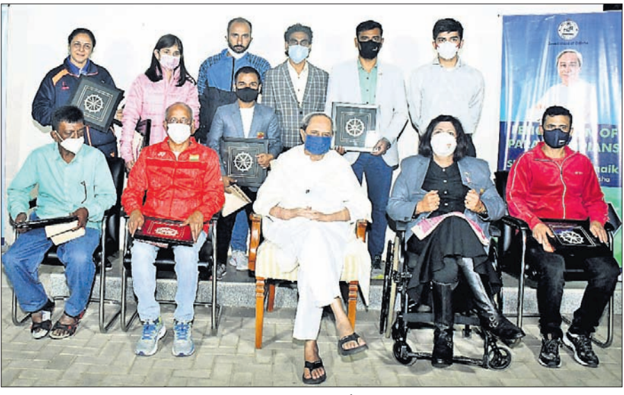
ମୁଖ୍ୟମନ୍ତ୍ରୀ ନବୀନ ପଟ୍ଟନାୟକଙ୍କ ସହ ସମ୍ବର୍ଦ୍ଧିତ ପାରା ଆଥଲେଟମାନେ ।

ଚୋକିଠି ପାରାଲିମ୍ପିକ୍ସରେ ପଦକ ହାସଲ କରିଥିବା ପାରା ଆଥଲେଟମାନଙ୍କୁ ମୁଖ୍ୟମନ୍ତ୍ରୀ ନବୀନ ପଟ୍ଟନାୟକ ନିଜ ବାସଭବନରେ ଶୁକ୍ରବାର ସମ୍ବର୍ଦ୍ଧନ କରିଛନ୍ତି । ସମସ୍ତ ପାରା ଆଥଲେଟଙ୍କୁ ସେ ଅଭିନନ୍ଦନ ଜଣାଇଛନ୍ତି । ପାରା ସ୍ପୋର୍ଟ୍ସ୍ ଲଭେଷ୍ଟ ଓ ପାରା ଆଥଲେଟମାନଙ୍କୁ ସମର୍ଥନ କରିବା ନେଇ ସେ ଏହି ଅବସରରେ ପ୍ରତିଶ୍ରୁତି ଦେଇଛନ୍ତି । ଭୁବନେଶ୍ୱରରେ ଚାଲିଥିବା ଜାତୀୟ ପାରା ବ୍ୟାଡମିଣ୍ଟନ ଚାମ୍ପିୟନଶିପ୍ରେ ଅଂଶଗ୍ରହଣ କରିଥିବା ସବୁ ଆଥଲେଟଙ୍କୁ ସେ ଶୁଭେଚ୍ଛା ଜଣାଇଛନ୍ତି । ପାରାଲିମ୍ପିକ୍ସ କମିଟି ଅଫ୍ ଇଣ୍ଡିଆ ଅଧ୍ୟକ୍ଷା ଦୀପା ମଲିକ ଏଥିପାଇଁ ମୁଖ୍ୟମନ୍ତ୍ରୀଙ୍କୁ ଧନ୍ୟବାଦ ଜଣାଇଛନ୍ତି । ଆୟୋଜିତ ଏକ ସ୍ୱତନ୍ତ୍ର ଉତ୍ସବରେ