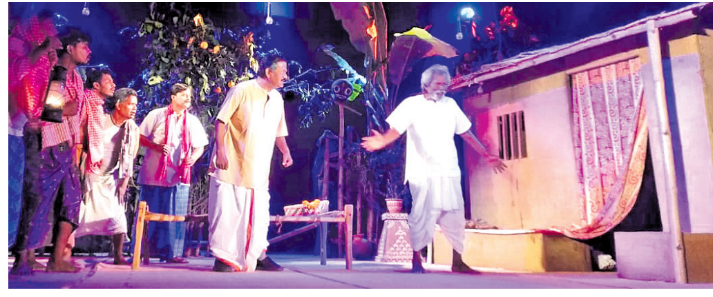
ମଞ୍ଚସ୍ଥ ନାଟକ ବାଞ୍ଛାର ଏକ ଦୃଶ୍ୟ।