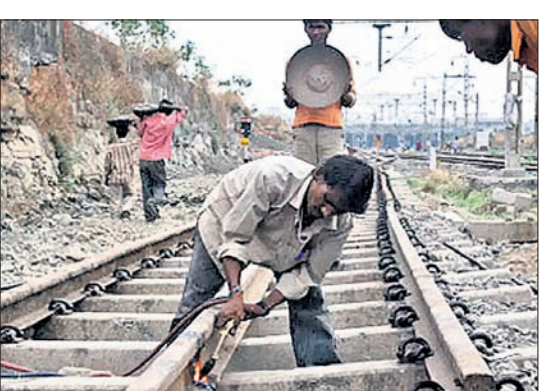
ଯାଜପୁର ଅଫିସ, ୨୪୧୨

■ ଅଟକିଛି ୧୧ ରେଳ ପ୍ରକଳ୍ପ କାମ ■ ୨୬ ବର୍ଷ ପରେ ବି ଖୋର୍ଦ୍ଧା-ବଲାଙ୍ଗୀର ପ୍ରକଳ୍ପ କାମ ସରୁନି