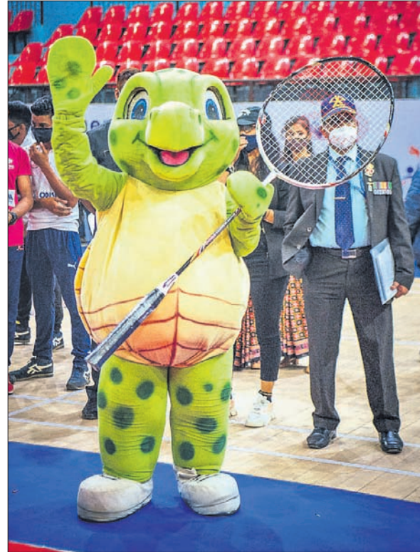
ଆକର୍ଷଣର କେନ୍ଦ୍ରବିନ୍ଦୁ ମାଧବ ଓଲି ।