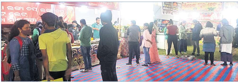
ପଲିଶ୍ରୀ ମେଳାରେ ପଡିଥିବା ଖାଦ୍ୟ ସ୍ତଳରେ ଲୋକଙ୍କ ଗହଳି।