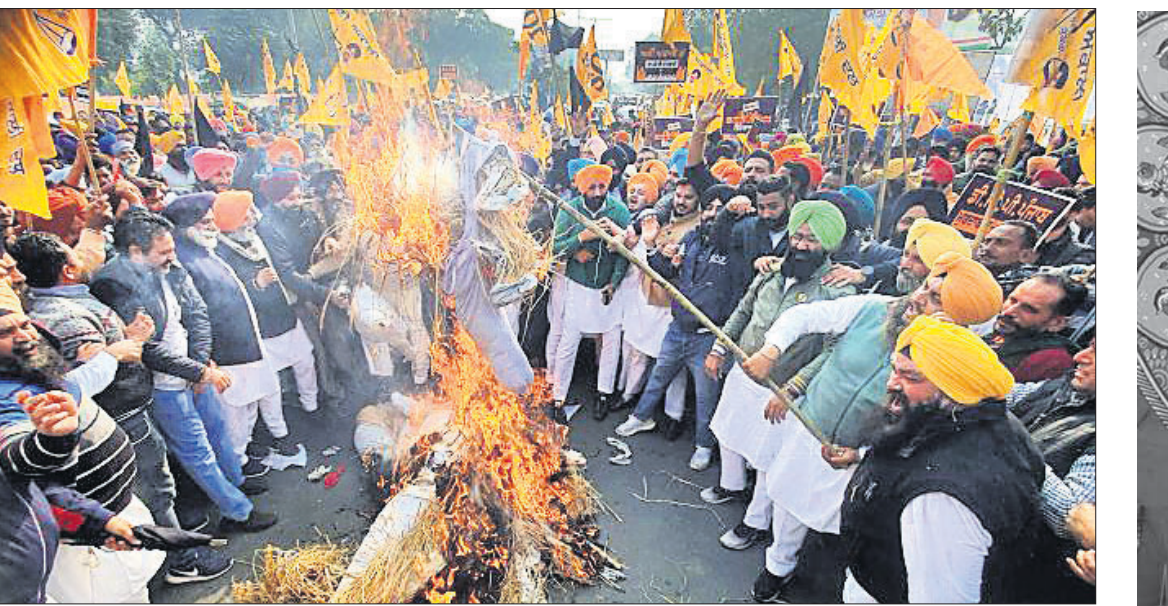
ଅମୃତସରରେ ଶିରୋମଣି ଅକାଳୀ ଦଳ ନେତା ବିଜୁ ମାଲିଆଙ୍କ ବିରୋଧରେ ଏପିଆଇଆର ପ୍ରତିବାଦରେ ଦଳୀୟ କର୍ମୀ ବିଶୋଭ କରୁଛନ୍ତି।