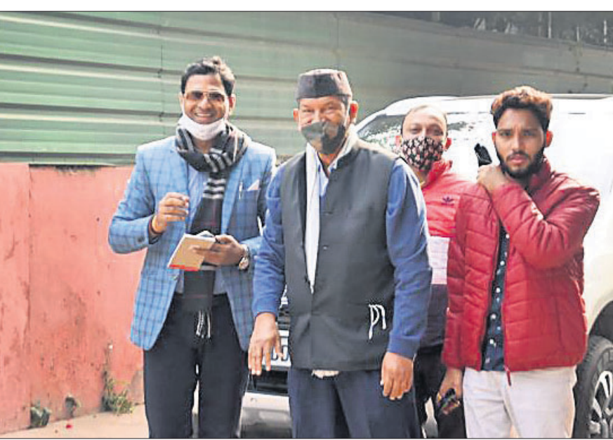
ନୂଆଦିଲ୍ଲୀରେ କଂଗ୍ରେସ ନେତା ରାହୁଲ ଗାନ୍ଧୀଙ୍କୁ ଭେଟିବାକୁ ଯାଉଥିବା ଉତ୍ତରାଖଣ୍ଡର ପୂର୍ବତନ ପୁଞ୍ଜ୍ୟମନ୍ତ୍ରୀ ହରିଶ ରାଫ୍ଟ

ନୂଆଦିଲ୍ଲୀ, ୨୫ ଡିସେମ୍ବର ଉତ୍ତରାଖଣ୍ଡ ବିଧାନସଭା ନିର୍ବାଚନରେ ପୂର୍ବତନ ପୁଞ୍ଜ୍ୟମନ୍ତ୍ରୀ ହରିଶ ରାଫ୍ଟ କଂଗ୍ରେସର ନେତୃତ୍ୱ ନେବେ। ସେ କଂଗ୍ରେସ ପ୍ରଚାର କମିଟିର ମଙ୍ଗ ଧରିବେ ବୋଲି ଗୁରୁବାର ପୂର୍ବଦିନ ଦେଖାଗଲା। କଂଗ୍ରେସରେ ତାଙ୍କୁ ଅଣଦେଖା କରାଯାଉଥିବା ଅଭିଯୋଗ ଆଣି ରାଫ୍ଟର ପୂର୍ବ ପୁଲାଇଥିବା ବରିଷ୍ଠ ନେତା ରାଫ୍ଟର ଦଳର ପୂର୍ବତନ ଅଧ୍ୟକ୍ଷ ରାହୁଲ ଗାନ୍ଧୀଙ୍କୁ ଭେଟିବା ପରେ ତାଙ୍କ ମନ ବଦଳିଛି। ତେବେ ନିର୍ବାଚନରେ କଂଗ୍ରେସ ବିଜୟ ହେଲେ କିଏ ପୁଞ୍ଜ୍ୟମନ୍ତ୍ରୀ ହେବେ ତାହା ପରବର୍ତ୍ତୀ ସମୟରେ ନିଷ୍ପତ୍ତି ନିଆଯିବ ବୋଲି ରାଫ୍ଟ କହିଛନ୍ତି। ପ୍ରକାଶ ଯେ, ବରିଷ୍ଠ କଂଗ୍ରେସ ନେତା ହରିଶ ରାଫ୍ଟ