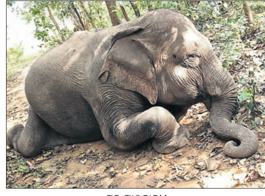
ମୃତ ମାଛହାତୀ ।