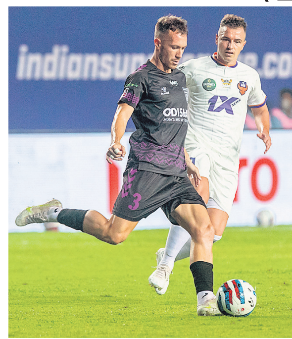
ଓଡ଼ିଶା ଏମ୍‌ସି ଏ ଓ ଗୋଆ ମ୍ୟାଚ୍‌ରେ ଅନୁଷ୍ଠିତ ମ୍ୟାଚ୍।

ପୂରା ନାମ: ହରଭଜନ ସିଂ ପାହା ଜନ୍ମ: ୧୯୮୦ ଜୁଲାଇ ୩, ଜଳନ୍ଦର, ପଞ୍ଜାବ ବୟସ: ୪୧ ବର୍ଷ ପ୍ରତିନିଧିତ୍ୱ କରିଥିବା ଦଳ: ପଞ୍ଜାବ, ସରେ, ପୃଥ୍ୱୀ ଇଣ୍ଡିଆନ୍, ଚେନାଇ ସୁପର କିଙ୍ଗ୍ସ, କୋଲକାତା ନାଇଟ ରାଇଡର୍ସ। କ୍ୟାରିୟର ଟେଷ୍ଟ: ମ୍ୟାଚ୍: ୧୦୩ ଉଇକେଟ: ୪୧୭ ବୋଲି ଆଉଟ: ୩୨.୪୬ ଏକ ଇନିଂସରେ ୫ ଉଇକେଟ ସଫଳତା: ୨୫ ଗୋଟିଏ ମ୍ୟାଚ୍‌ରେ ୧୯ ଉଇକେଟ ସଫଳତା: ୫ ଶ୍ରେଷ୍ଠ ବୋଲି: ୮/୮୪ ରନ ସଂଗ୍ରହ: ୨,୨୨୪ ବ୍ୟାଟିଂ ଆଉଟ: ୧୮.୨୩ ଶତକ-୨, ଅର୍ଦ୍ଧଶତକ- ୯ ଦିନିକିଆ ମ୍ୟାଚ୍: ୨୩୬ ଉଇକେଟ: ୨୬୯ ବୋଲି ଆଉଟ: ୩୩.୩୫ ୫ ଉଇକେଟ ସଫଳତା: ୩ ଶ୍ରେଷ୍ଠ ବୋଲି: ୫/୩୧ ରନ ସଂଗ୍ରହ: ୧,୨୩୭ ଟି୨୦ ମ୍ୟାଚ୍: ୨୮ ଉଇକେଟ: ୨୫ ବୋଲି ଆଉଟ: ୨୫.୩୨ ଶ୍ରେଷ୍ଠ ବୋଲି: ୪/୧୨ ରନ ସଂଗ୍ରହ: ୧୦୮