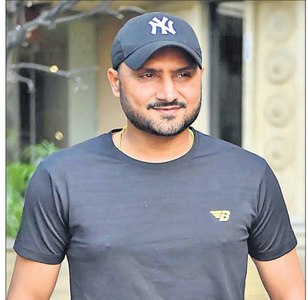
ଉଇକେଟ ଅଭିଆର କରିଥିଲେ ୨୩ ବର୍ଷର ଏହି ଯାତ୍ରା ବେଶ୍ ସ୍ମରଣୀୟ ରହିଆସିଛି। ଏଥିପାଇଁ