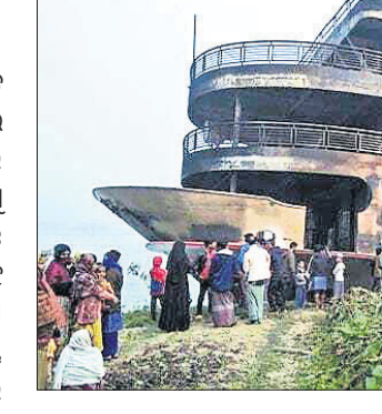
ଭାବା, ୨୫ ଡିସେମ୍ବର

କରିଛନ୍ତି। ରାତି ୯ ରୁ ସକାଳ ୬ ପର୍ଯ୍ୟନ୍ତ ସର୍ବସାଧାରଣ ଗୁଲାନରେ ୫ରୁ ଅଧିକ ଲୋକ ଏକାଠି ହେବାକୁ ବାରଣ କରାଯାଇଛି। ଦିନ ୨୦୦ରୁ ଅଧିକ ଲୋକ ଏକତ୍ର ହେବା ପ୍ରକୋଷ୍ଟରେ ବିବାହ ଲାଗି ସର୍ବାଧିକ ୧୦୦ ଲୋକଙ୍କୁ ଅନୁମତି ଦିଆଯାଏ ବୋଲି ଘୋଷଣା