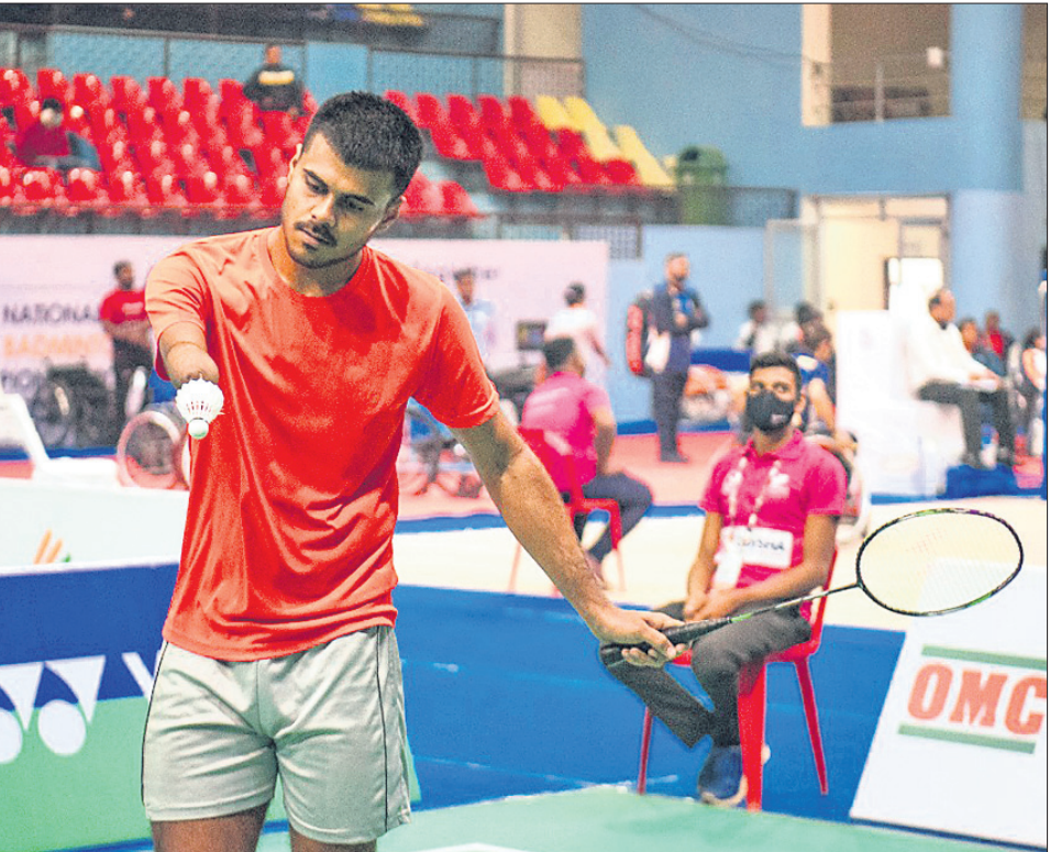
ରେଲଫ୍ରେ ଇନ୍‌ଡୋର ଷ୍ଟାଡ଼ିୟମରେ ଶୁକ୍ରବାର ଆରମ୍ଭ ହୋଇଥିବା ଚତୁର୍ଥ ଜାତୀୟ ପାରା ବ୍ୟାଡମିଣ୍ଟନ ଚାମ୍ପିୟନଶିପ୍‌ରେ ଖେଳିବା ଅବସରରେ ବୁଲୁ ପ୍ରତିଯୋଗୀ ।