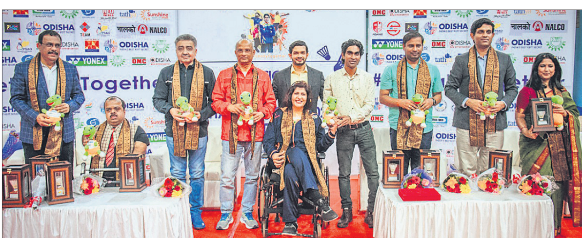
ଶୁକ୍ରବାର ଜାତୀୟ ପାରା ବ୍ୟାଡମିଣ୍ଟନ ଉଦ୍‌ଘାଟନା ଉତ୍ସବରେ ଅତିଥିଙ୍କ ସହ କର୍ମକର୍ତ୍ତା ।

ସୋର, ୨୪।୧୨ (ଡି.ଏନ୍.ଏ.): ସୋର ରୁକ୍ ମହାପାତ୍ରଙ୍କ ପଞ୍ଚାୟତ ବାବୁଡ଼ି କ୍ରିକେଟ ପଡ଼ିଆରେ ମହାବୀର କୁବ ଆରକ୍ଷକଙ୍କର ୨୩ତମ ମହାବୀର ସର୍ବଭାରତୀୟ କ୍ରିକେଟ ଚୂର୍ଣ୍ଣମେଷର ଦ୍ୱିତୀୟ ସେମିଫାଇନାଲରେ ବର୍ଷିଏସ୍, ଭାଇକାଗକୁ ହରାଇ ଇଷ୍ଟକୋଷ୍ଠ ରେଲଫ୍ରେ ଖୋର୍ଦ୍ଧା ଫାଇନାଲରେ ପ୍ରବେଶ କରିଛି । ବର୍ଷିଏସ୍, ଭାଇକାଗ ୨୭.୪ ଓଭରରେ ସମଗ୍ର ଉଇକେଟ ହରାଇ ୧୮୭ ରନ୍ କରିଥିଲା । ଜବାବରେ ଇଷ୍ଟକୋଷ୍ଠ