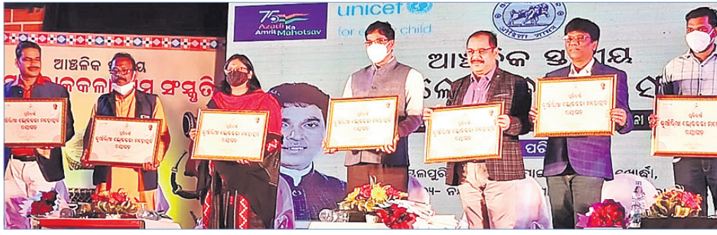
ଆମ ଲୋକକଳା କାର୍ଯ୍ୟକ୍ରମରେ ଉପସ୍ଥିତ ଅତିଥିମାନେ।