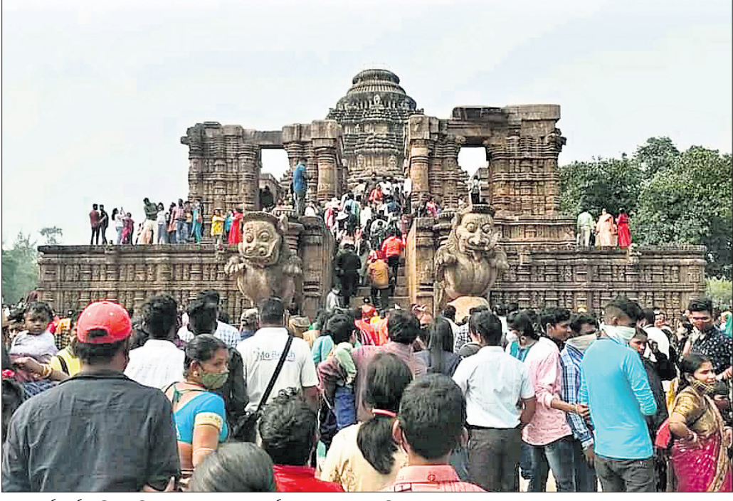
କୋଣାର୍କ ସୂର୍ଯ୍ୟମନ୍ଦିର ପରିସରରେ ମଙ୍ଗଳବାର ପର୍ଯ୍ୟଟକଙ୍କ ପ୍ରବଳ ଗହଳ।