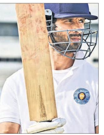
ସାହିଦ ଖାନ କ୍ରିକେଟର ଭୂମିକାରେ ନଜର ଆସିବେ।

ମୁମ୍ବାଇ: ସାହିଦ କପୁରଙ୍କ ଏ ପର୍ଯ୍ୟନ୍ତ ଶେଷ ଚଳଚ୍ଚିତ୍ର କବୀର ସିଂ ଯାହାକି ୨ ବର୍ଷ ପୂର୍ବେ ପରଦାକୁ ଆସିଥିଲା। ସିନେମାଟି ଲୋକଙ୍କ ଦ୍ୱାରା ବହୁ ଆଦୃତ ପାଇଥିଲା। ତା ପରଠୁ ସେ ଆଉ କୌଣସି ସିନେମା କରିନାହାନ୍ତି। ଚଳଚ୍ଚିତ୍ର ନିର୍ଦ୍ଦେଶକ ଗୌତମ ତିନାୟାଙ୍କ ନିର୍ଦ୍ଦେଶନାରେ ସାହିଦଙ୍କ ଆଗାମୀ ଚଳଚ୍ଚିତ୍ର 'ଜର୍ସି' ଯେଉଁଥିରେ ସାହିଦ ଏକ ୩୫ ବର୍ଷର କ୍ରିକେଟର ଭୂମିକାରେ ନଜର ଆସିବେ। ନିଜ ପୁଅର ଇଚ୍ଛାକୁ ପୂରଣ କରିବାକୁ ସେ ପୁଣି ଥରେ କ୍ରିକେଟକୁ ଫେରିଛନ୍ତି। ଏଥିରେ ସାହିଦଙ୍କ ସହ ଅଭିନେତ୍ରୀ ମୁଖା ଠାକୁରଙ୍କ ଯୋଡି