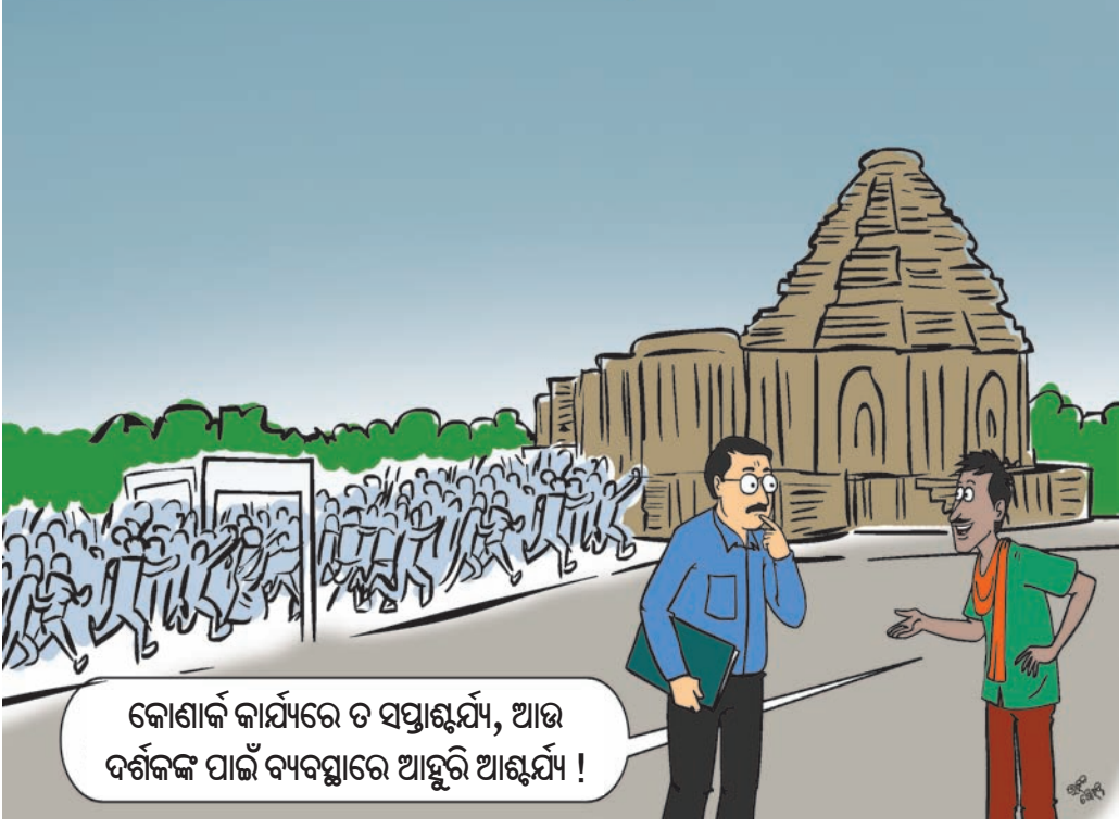
କୋଣାର୍କ କାର୍ଯ୍ୟରେ ତ ସପ୍ତାହାର୍ଯ୍ୟ, ଆଉ ଦର୍ଶକଙ୍କ ପାଇଁ ବ୍ୟବସ୍ଥାରେ ଆହୁରି ଆଶ୍ଚର୍ଯ୍ୟ !