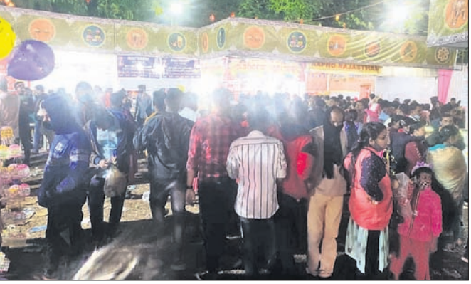
ପଲ୍ଲିଶ୍ରୀ ମେଳାରେ ଭିଡ଼।

ପଞ୍ଚାୟତରାଜକୁ ରାଜନୈତିକ ଗାପରେ ସଂରକ୍ଷଣ ବ୍ୟବସ୍ଥା ଅନୁସୂଚିତ ଜାତି ପାଇଁ ସଂରକ୍ଷଣ ରହିଛି।