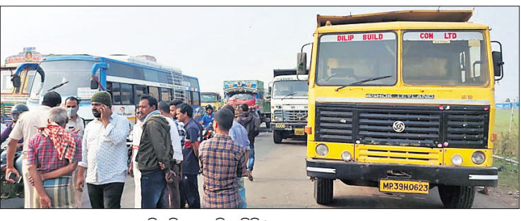
ରାଷ୍ଟ୍ରା ଅବରୋଧ ଯୋଗୁ ଗାଡ଼ିଚୁଡ଼ିକ ଅଟକି ରହିଛି ।