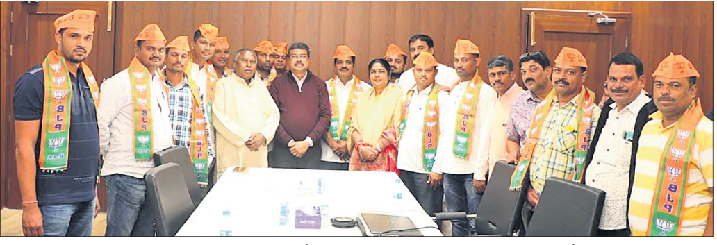
ନୂଆଦିଲ୍ଲୀରେ କେନ୍ଦ୍ରମନ୍ତ୍ରୀ ଧର୍ମେନ୍ଦ୍ର ପ୍ରଧାନଙ୍କ ବାସଭବନରେ ଆୟୋଜିତ ମିଶ୍ରଣ ପର୍ବ।