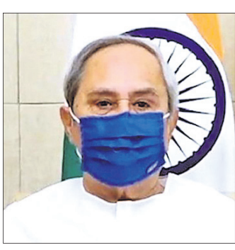
ଓ କର୍ମଚାରୀମାନଙ୍କ ମଧ୍ୟରେ ବ୍ୟବହାରିକ ପରିବର୍ତ୍ତନ ଆଣିବାରେ ସକ୍ଷମ ହୋଇଛି।

ଭୁବନେଶ୍ୱର, ୨୮।୧୨(ବୁଧବେ) କେବଳ ଜନସାଧାରଣଙ୍କ ସରକାରୀ ନିରନ୍ତର ଉତ୍ତର ସେବା ହେଉଛି ରାଜ୍ୟ ସରକାରଙ୍କ ଲକ୍ଷ୍ୟ। ତେଣୁ ଲୋକଙ୍କ ସମସ୍ୟାର ସମାଧାନ ପାଇଁ ଆମ ସମସ୍ତଙ୍କୁ ଜୁମାଗତ ଭାବରେ ପରିବର୍ତ୍ତନ କରିବାକୁ ହେବ। ମଙ୍ଗଳବାର 'ମୋ ସରକାର' କାର୍ଯ୍ୟକ୍ରମର ସମୀକ୍ଷା ସର୍ବସମ୍ମତ ମୁଖ୍ୟମନ୍ତ୍ରୀ ନବୀନ ପଟ୍ଟନାୟକ ପ୍ରଶଂସନୀୟ ଅଧିକାରୀମାନଙ୍କୁ ଏହି ବାଣ୍ଟି ଦେଇଛନ୍ତି।