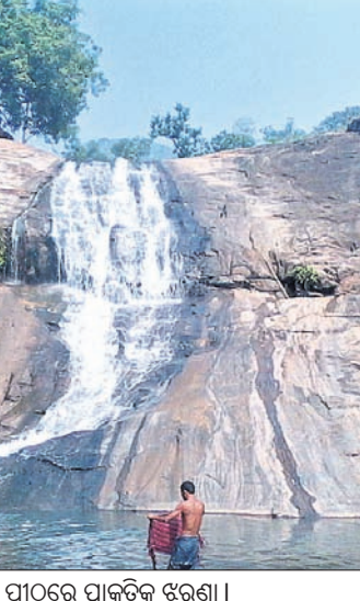
ଯୋଗାଯୋଗିଆଣୀ ପୀଠରେ ପ୍ରାକୃତିକ ଝରଣା।

ଜଳକୁ ଚେକ୍ ଡ୍ୟାମ୍ ମାଧ୍ୟମରେ ଅଟକାଇ ନିର୍ମାଣ କାମ ଆଜି ପର୍ଯ୍ୟନ୍ତ ସମ୍ପର୍କ ହୋଇ ପାରିନାହିଁ। ପଞ୍ଚାୟତ ପକ୍ଷରୁ ନିର୍ମାଣ ହୋଇଥିବା ଏହି କଲ୍ୟାଣ ମଣ୍ଡପର ଛାତ ପଡି ଥିଲେ ମଧ୍ୟ ଗୃହର ଅନ୍ୟାନ୍ୟ କାମ ଅନୁଦାନ ଆଭାବରୁ ବନ୍ଦ ରହିଛି।