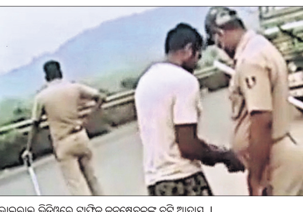
ଭାଇରାଲ ଭିଡିଓରେ ଟ୍ରାଫିକ୍ କର୍ମଚ୍ଚେଷ୍ଟକଙ୍କ ବଡ଼ି ଆଦାୟ ।