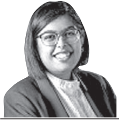
ସାପ୍ତାହୀକ ଅବସ୍ଥା କରନ୍ତୁ

ଦକ୍ଷିଣ ଆଫ୍ରିକାରେ କୋଭିଡ୍-୧୯ର ଦୁଃଖ ଉପ ଓପିକ୍ସ ପ୍ରକାଶ ପାଇବା ପରେ ଏହାକୁ ନେଇ ସାମାଜିକ, ଆର୍ଥିକ ଓ ରାଜନୈତିକ କ୍ଷେତ୍ରରେ ବିକଶିତ ଦେଶଗୁଡ଼ିକରେ ପ୍ରତିକ୍ରିୟା ପ୍ରକାଶପାଇଛି । ପୂର୍ଣ୍ଣ ମହାମାରୀକୁ ନେଇ ଚାପ ଅସମାନତା ମୁଖ୍ୟ ଚେତନା ପୂର୍ବରୁ ମଧ୍ୟ ଦକ୍ଷିଣ ଆଫ୍ରିକାୟ ଦେଶଗୁଡ଼ିକ ବିରୋଧରେ ଚାପ ଓ ଗମନ ପ୍ରତିକ୍ରିୟା ପ୍ରକାଶ ପାଇଥିଲା । ଏପରିକି ଅବଶ୍ୟକ ଦିଶୁଥିବା ସୁରକ୍ଷିତ ରଖିବା ଲାଗି ସେଠାକାର ଯାତ୍ରାମାନଙ୍କୁ ବାରଣ କରାଯାଇଥିଲା । କିନ୍ତୁ ବିଶ୍ୱ ସୁରକ୍ଷିତ ହୋଇନାହିଁ । ଏଣୁ ଉତ୍ତର ଓପିକ୍ସ ଦେଶଗୁଡ଼ିକରେ ସାମାଜିକ ବନ୍ଧନ କିମ୍ବା କିଛି କାମ ହେବ ନାହିଁ ଅନୁପାଳନ ଅନୁସାରେ ପ୍ରତିକ୍ରିୟା ଦେଖାଦେଇଥିବା ଅସମାନତା ସାଧାରଣ ସାମ୍ମୁଖ୍ୟ ପ୍ରତି ଅତ୍ୟନ୍ତ କ୍ଷତିକାରକ । କୋଭିଡ୍ ମହାମାରୀକୁ ପ୍ରତିହତ କରିବା ପାଇଁ ବିଶ୍ୱର ଅନ୍ତର୍ଜାତୀୟ ଲୋକ ଟିକା ନେଇଥିବାବେଳେ ଗଭିର ଦେଶଗୁଡ଼ିକର ମାତ୍ର ୮% ଲୋକ ଟିକା ନେଇଛନ୍ତି । ନିମ୍ନ ତଥ୍ୟ ମଧ୍ୟ ଆୟ ବର୍ଗର ଦେଶଗୁଡ଼ିକରେ ୪୮% ଲୋକ ଟିକା ନେଇଥିବାବେଳେ ଧନୀ ଦେଶଗୁଡ଼ିକର ଟିକାକରଣ ହାର ଏହାଠାରୁ ଯଥେଷ୍ଟ ଅଧିକ । ଆଫ୍ରିକାର ସବୁ ଦେଶରେ ଯେତିକି ଟିକା ଦିଆଯାଇଛି ନଭେମ୍ବର ମୁଖ୍ୟ ତାହାର ଦୁଇଗୁଣ ଟିକା ଆମେରିକା ଦେଇଥିଲା । ଏହି ସଂଖ୍ୟାକୁ ଦେଖିଲେ ଟିକାକରଣ ହାର କମ୍ ଥିବା ଦେଶଗୁଡ଼ିକରେ ଲାଗତର କୋଭିଡ୍ ନୂଆ ଉପ ବାହାର ଶାନ୍ତ ବ୍ୟାପିବା ସ୍ୱାଭାବିକ ଓ ଏଥିରେ ମଧ୍ୟ ଆଶ୍ଚର୍ଯ୍ୟ ହେବା କିଛି କାରଣ ନାହିଁ । ଟିକା ପ୍ରସ୍ତୁତି ଓ ଯୋଗାଣରେ ଅସମାନତା ବା ପକ୍ଷପାତ ହେଉଥିବା ଆରମ୍ଭ ହୋଇନାହିଁ । ଧନୀ ଦେଶଗୁଡ଼ିକ ଅନ୍ୟ ଦେଶକୁ ସାହାଯ୍ୟ ନ କରି ନିଜର ସ୍ୱାର୍ଥକୁ ଦେଖିବା ନୀତି ଆପଣାଇବା ଓ ଟିକା ଗଠିତ ରଖିବା ଯୋଗୁ ଏହା ହୋଇଛି । ଏହାର ପରିଣାମ ଏବେ ଗଭିର ଦେଶଗୁଡ଼ିକୁ ଭୋଗିବାକୁ ପଡ଼ିଛି । ଏପରିକି ଟିକା ଉପଲବ୍ଧ ହେଲା ପୂର୍ବରୁ ବିଶ୍ୱ ସାମ୍ମୁଖ୍ୟ ସଂଗଠନର ମହାନିର୍ଦ୍ଦେଶକ ଚେନ୍ଦ୍ରୋସ ଅଧିକାରୀ ଘିନ୍ଦ୍ରୋସସୁଭେନ ସମେତ ବହୁ ବିଶେଷଜ୍ଞ ଟିକା କ୍ଷେତ୍ରରେ