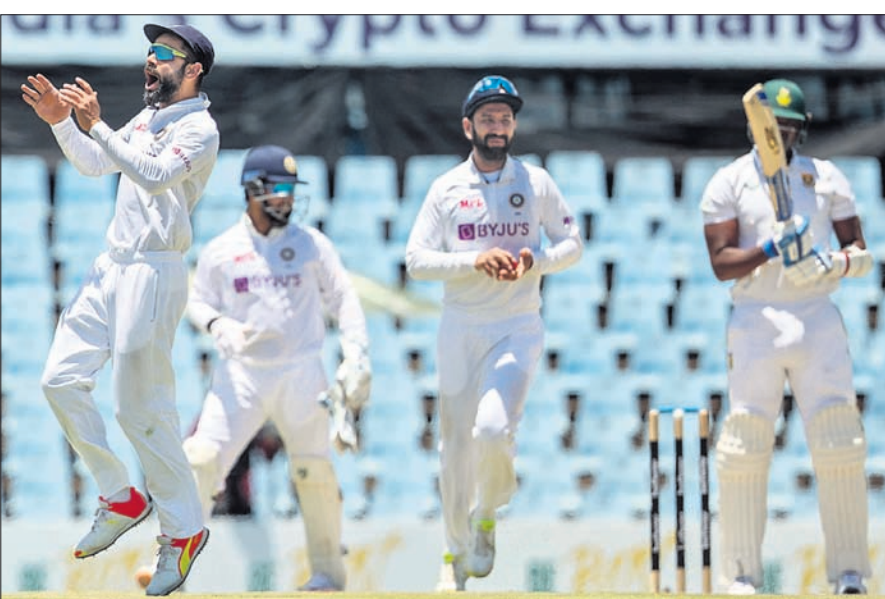
ଲୁଗି ଏନ୍‌ଟିଭିକ ଆଉଟ୍ ପରେ ସାଥୀ ଖେଳାଳିଙ୍କ ସହ ଉଲ୍ଲସିତ ଭାରତ ଅଧିନାୟକ ବିରାଟ କୋହଲି (ବାମ) ।

ଏହା କ୍ରମାଗତ ଦ୍ୱିତୀୟ ବିଜୟ ସାବ୍ୟସ୍ତ ହୋଇଛି। ଏହା ପୂର୍ବରୁ ୨୦୧୮ରେ ଭାରତ ଜୋହାନସ୍ବର୍ଗ ଟେଷ୍ଟରେ ୨୮ ରନରେ ବିଜୟ ହାସଲ କରିଥିଲା। ଦକ୍ଷିଣ ଆଫ୍ରିକା ମାଟିରେ ଭାରତ ପାଇଁ ଏହା ଚତୁର୍ଥ ଟେଷ୍ଟ ବିଜୟ ଓ ସେଣ୍ଟିଆନରେ ପ୍ରଥମ ବିଜୟ ସାବ୍ୟସ୍ତ ହୋଇଛି। ଗ୍ଲାନାୟ ସୁପରସ୍ପୋର୍ଟ ଗ୍ରାଉଣ୍ଡରେ ଖେଳାଯାଇଥିବା ଏହି ଟେଷ୍ଟରେ ଭାରତ ପ୍ରଥମ ଇନିଂସରେ ୧୩୦ ରନର ଅଗ୍ରଣୀ ହାସଲ କରିଥିଲା। ଦ୍ୱିତୀୟ ଇନିଂସରେ ଭାରତ ୧୭୪ ରନକରି ଅଲଆଉଟ ହେବା ପରେ ଦକ୍ଷିଣ ଆଫ୍ରିକା ସମ୍ପୂର୍ଣ୍ଣରେ ୩୦୫ ରନର ବିଜୟ ଲକ୍ଷ୍ୟ ଧାର୍ଯ୍ୟ ହୋଇଥିଲା। ଜବାବରେ ଦକ୍ଷିଣ ଆଫ୍ରିକା ଦ୍ୱିତୀୟ ଇନିଂସ ଆରମ୍ଭ କରି ଭାରତୀୟ ଦ୍ରୁତ ବୋଲରଙ୍କ