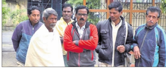
ମୁଖ୍ୟ ଜିଲ୍ଲା ଯୋଗାଣ ଅଧିକାରୀଙ୍କୁ ଫେରାବ ହୋଇଥିବା ଗଣ୍ଡା ପ୍ରତିନିଧିତ୍ୱ ।