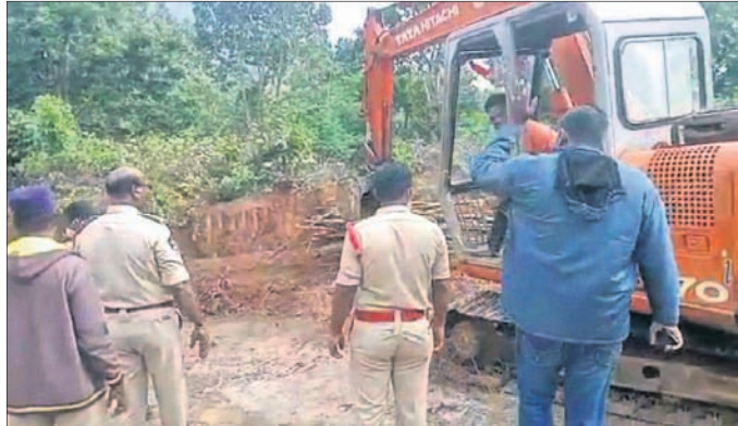
ଓଡ଼ିଶାର ନିର୍ମାଣାଧୀନ ରାସ୍ତାକାମକୁ ଆନ୍ଧ୍ର ପୋଲିସ ବନ୍ଦ କରୁଛି।

ଘଣ୍ଟା ଅଟକ ରଖିବା ପରେ ଛାଡ଼ିଥିଲେ। ଚଳଗଞ୍ଜେଇପଦର ଗ୍ରାମରେ ଆନ୍ଧ୍ର ପକ୍ଷରୁ ଚାଲିଥିବା ଅଜ୍ଞାନଘାତୀ ଗୃହ କରିଥିଲେ। ଏଥିସହ ରାସ୍ତା କାର୍ଯ୍ୟରେ ନିୟୋଜିତ ଶ୍ରମିକମାନଙ୍କୁ ନେଇ ଅଟକ ରଖି କିଛି ସମୟ ପରେ ୨ ଜଣଙ୍କୁ ଛାଡ଼ି ଦେଇଥିଲେ। ଅନ୍ୟ ଜଣେ କର୍ମଚାରୀଙ୍କୁ ସାଲୁର ଆନାକୁ ନେଇ ସେଠାରେ ଦୁଇ