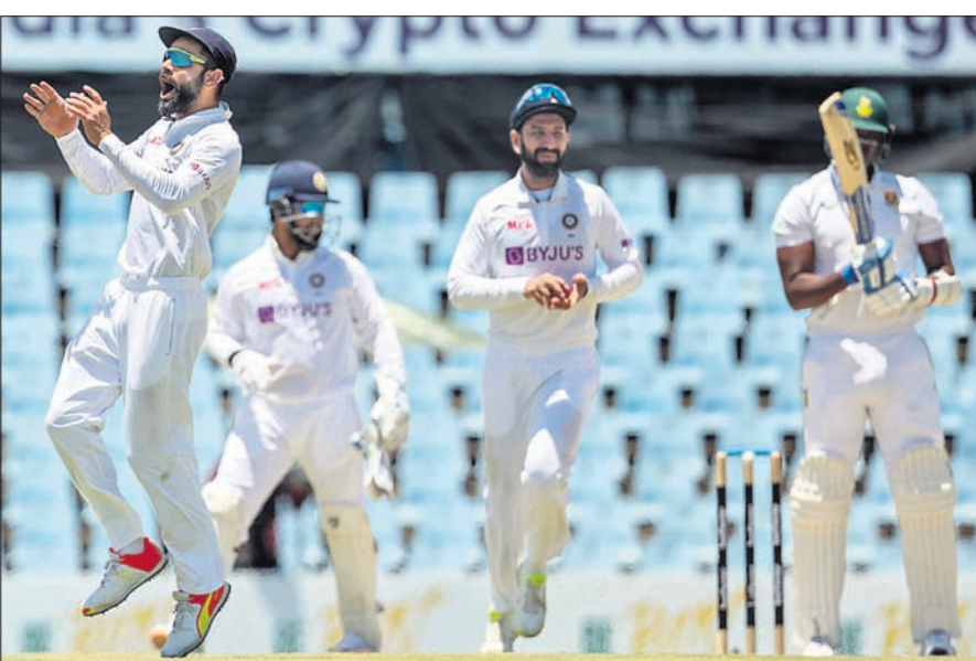
ଲୁଗ୍ଗି ଏନ୍‌ଟିକ୍ ଆଉଟ୍ ପରେ ସାଥୀ ଖେଳାଳିଙ୍କ ସହ ଉଲ୍ଲସିତ ଭାରତ ଅଧିନାୟକ ବିରାଟ କୋହଲି (ବାମ)।

ଏହା କ୍ରମାଗତ ଦ୍ୱିତୀୟ ବିଜୟ ସାବ୍ୟସ୍ତ ହୋଇଛି। ଏହା ପୂର୍ବରୁ ୨୦୧୮ରେ ଭାରତ ଜୋହାନସ୍ବର୍ଗ ଟେଷ୍ଟରେ ୨୮ ରନରେ ବିଜୟ ହୋଇଥିଲା। ଦକ୍ଷିଣ ଆଫ୍ରିକା ମାଟିରେ ଭାରତ ପାଇଁ ଏହା ଚତୁର୍ଥ ଟେଷ୍ଟ ବିଜୟ ଓ ସେଣ୍ଟିଆନରେ ପ୍ରଥମ ବିଜୟ ସାବ୍ୟସ୍ତ ହୋଇଛି। ଗ୍ଲାନାୟ ସୁପରସ୍ପୋର୍ଟ ଗ୍ରାଉଣ୍ଡରେ ଖେଳାଯାଇଥିବା ଏହି ଟେଷ୍ଟରେ ଭାରତ ପ୍ରଥମ ଇନିଂସରେ ୧୩୦ ରନର ଅଗ୍ରଣୀ ହାସଲ କରିଥିଲା। ଦ୍ୱିତୀୟ ଇନିଂସରେ ଭାରତ ୧୭୪ ରନକରି ଅଲଆଉଟ ହେବା ପରେ ଦକ୍ଷିଣ ଆଫ୍ରିକା ସମ୍ପୂର୍ଣ୍ଣରେ ୩୦୫ ରନର ବିଜୟ ଲକ୍ଷ୍ୟ ଧାର୍ଯ୍ୟ ହୋଇଥିଲା। ଜବାବରେ ଦକ୍ଷିଣ ଆଫ୍ରିକା ଦ୍ୱିତୀୟ ଇନିଂସ ଆରମ୍ଭ କରି ଭାରତୀୟ ଦ୍ରୁତ ବୋଲରଙ୍କ