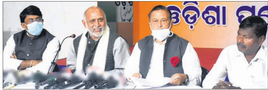
ଖବରଦାତା ସମ୍ମିଳନୀରେ କଂଗ୍ରେସ ନେତୃତ୍ୱ।