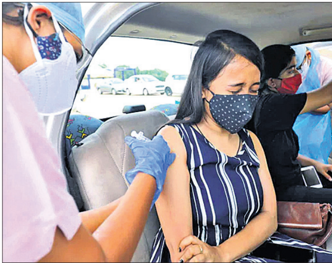
ମୁମ୍ବାଇରେ ଜଣେ ସ୍ୱାସ୍ଥ୍ୟକର୍ମୀ ଗାଡ଼ି ଭିତରେ ମହିଳାଙ୍କୁ କୋଭିଡ୍ ଟିକା ଦେଉଛନ୍ତି।