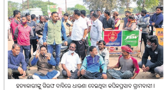
ହତ୍ୟାକାରୀଙ୍କୁ ଗିରଫ ଦାବିରେ ଧାରଣା ଦେଇଥିବା କପିଳପ୍ରସାଦ ଗ୍ରାମବାସୀ।

ହତ୍ୟାକାରୀଙ୍କୁ ଗିରଫ ଦାବିରେ ଧାରଣା ଶିବିରର ପୂର୍ବାହରେ କପିଳପ୍ରସାଦ ଗ୍ରାମବାସୀ ସୁନ୍ଦରପଦା ଶଙ୍କରାବତ୍ତାର ଛକରେ ଗାୟାର କାଳି ଧାରଣାରେ ବସିଥିଲେ। ମୃତକଙ୍କ ପରିବାରକୁ ୨୦ ଲକ୍ଷ ଟଙ୍କା କ୍ଷତିପୂରଣ ଓ ହତ୍ୟାକାରୀଙ୍କୁ ୨୪ ଘଣ୍ଟା ମଧ୍ୟରେ ଗିରଫ କରିବାକୁ ଡାକର ଦାବି ଥିଲା। ଅଭିଯୁକ୍ତମାନଙ୍କୁ ଗିରଫ କରିବା ପରେ ଧାରଣାରୁ ଓହରିଥିଲେ।