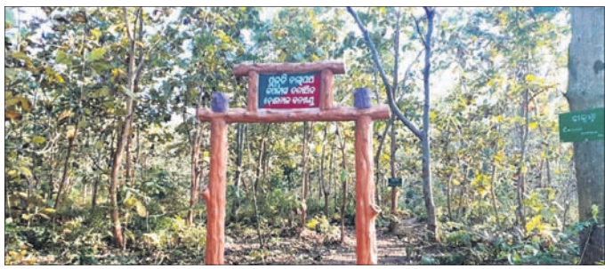
କପିଳାସ ଅଭୟାରଣ୍ୟ ପ୍ରବେଶ ଦ୍ୱାର ।

କପିଳାସ ଅଭୟାରଣ୍ୟର କେଳାନାଳ ଜିଲାର ଏହି ପ୍ରମୁଖ ସଂରକ୍ଷିତ ଜଙ୍ଗଲକୁ ପର୍ଯ୍ୟଟନ ଅନୁକୂଳ କରିବାକୁ ବନ ବିଭାଗ ପକ୍ଷରୁ ଲଗାତର ପ୍ରୟାସ କରି ରହିଛି । ସଫାରି ସମେତ ଏଠାରେ କାରିରହିଥିବା ପ୍ରକଳ୍ପଗୁଡ଼ିକ ମଧ୍ୟରୁ ଅଧିକାଂଶ ୨୦୨୨ ଶେଷ ପୂର୍ଣ୍ଣାଙ୍ଗ ରୂପ ନେବ । ଏହା କାର୍ଯ୍ୟକ୍ରମ ହେଲେ ଦେଶୀୟ ଏବଂ ବିଦେଶୀ ପର୍ଯ୍ୟଟକଙ୍କୁ ଆକୃଷ୍ଟ କରିବ । ତା' ସାଙ୍ଗକୁ ରାଜସ୍ୱ ମଧ୍ୟ ବଢ଼ିବ । ୧୨୫୫୯.୫୯ ହେକ୍ଟର ପରିମିତ କପିଳାସ ଜଙ୍ଗଲକୁ ୨୦୧୧ ଏପ୍ରିଲ ୨ରେ ଅଭୟାରଣ୍ୟ ମାନ୍ୟତା ମିଳିଥିଲା । ଏବେ ଏହି ସଂରକ୍ଷିତ ନିଷିଦ୍ଧାଞ୍ଚଳରେ ହରିଣ, ଶମ୍ଭର, କୁରୁରା ଭଳି ବୃକ୍ଷଭୋଜୀ ପ୍ରାଣୀଙ୍କ ସଂଖ୍ୟା ବୃଦ୍ଧି ପାଇବାରେ ଲାଗିଛି । ସେମାନଙ୍କ ଖାଦ୍ୟ ସମସ୍ୟା ଦୂର କରିବା ଏବଂ ବିପ୍ରାଣ୍ଟି ଚାରଣ ଭୂମି ସୃଷ୍ଟି କରିବା ଉଦ୍ଦେଶ୍ୟରେ ୨୦ ହେକ୍ଟର ଜାଗାରେ