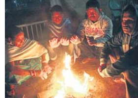
ଡାକ୍ତରୀ ଲହରୀ... ରବିବାର ମଧ୍ୟ ଏହାକୁ ଶୀତ ଭାବେ ରହିବ।

ଭୁବନେଶ୍ୱର, ୧।୧ (ବୁଧବାର) ରାଜ୍ୟରେ ଖୁସି ପାଇବା ଗତ କିଛିଦିନ ହେବ ଶୀତ କମିଥିବାବେଳେ ଏବେ ପୁଣି ଅନୁଭୂତ ହେଲାଣି।