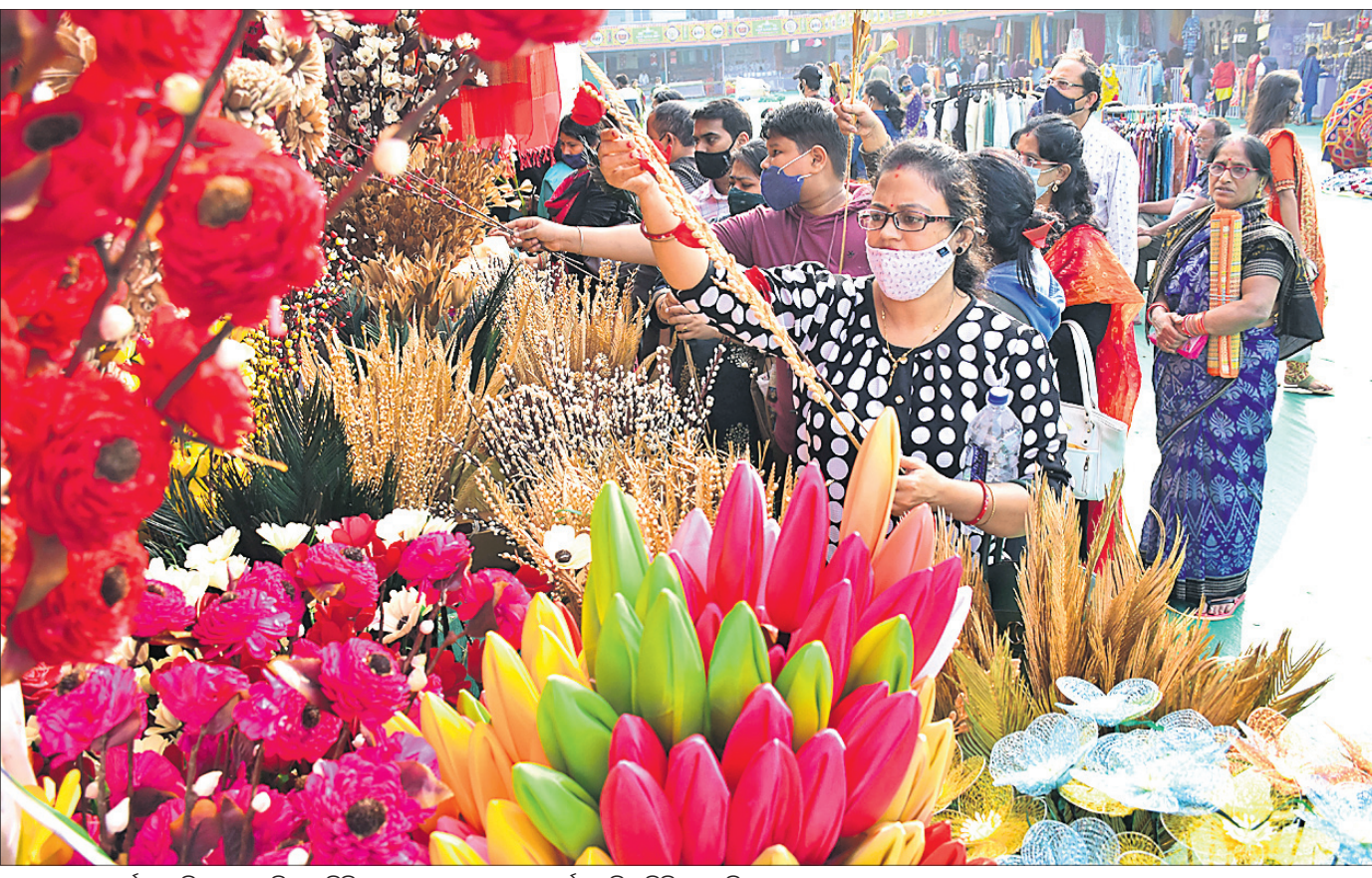
ଭୁବନେଶ୍ୱର ପ୍ରଦର୍ଶନୀ ପଡ଼ିଆରେ ଚାଲିଥିବା ଶିଶୁର ସରସ ମେଳାରେ ନୂଆବର୍ଷରେ କିଶାକିଶି କରୁଛନ୍ତି ଲୋକେ।