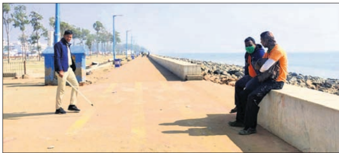
ଦୀପ୍ତା ବେଳାଭୂମିରେ ପୋଲିସ ପାଇଁ ଚରା ମାଗୁଛି।