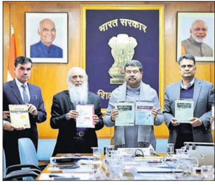
ବୈଷୟିକ ପୁସ୍ତକ ଉନ୍ମୋଚନ ଅବସରରେ କେନ୍ଦ୍ରମନ୍ତ୍ରୀ ଧର୍ମେନ୍ଦ୍ର ପ୍ରଧାନ ଓ ଅନ୍ୟମାନେ ।

ଦେଶରେ ଶୁଭାରମ୍ଭ ହୋଇଥିବା ନିର୍ଦ୍ଦିଷ୍ଟ ୩୦ (ନ୍ୟାଶନାଲ ଏଡୁକେଶନାଲ ଏକ୍ସଲେନ୍ସିଟି) ଅନ୍ତର୍ଗତ ୧୨ ଲକ୍ଷ ସାମାଜିକ-ଆର୍ଥିକ ଅନଗ୍ରସର ଛାତ୍ରାଛାତ୍ରୀଙ୍କୁ ୨୫୩ କୋଟି ଟଙ୍କାର ମାଗଣା ନିର୍ଦ୍ଦିଷ୍ଟ-ଚେକ୍ କୋର୍ସ୍ ବ୍ୟବସ୍ଥା କରାଯାଇଛି । ଏହା ଛାତ୍ର ସମାଜ ପାଇଁ ପ୍ରଧାନମନ୍ତ୍ରୀଙ୍କ ୨୦୧୨ର ସବୁଠାରୁ ବଡ଼ ଉପହାର ବୋଲି କେନ୍ଦ୍ରମନ୍ତ୍ରୀ ଧର୍ମେନ୍ଦ୍ର ପ୍ରଧାନ କହିଛନ୍ତି । ନୂଆଦିଲ୍ଲୀଠାରେ ସୋମବାର ନ୍ୟାଶନାଲ ଏଡୁକେଶନାଲ ଏକ୍ସଲେନ୍ସିଟି ଫର୍ ଟେକ୍ନୋଲୋଜି ଏବଂ ଆଞ୍ଚଳିକ ଭାଷାରେ ଏଆଇସିଟିଇ ପ୍ରାପ୍ତ ବୈଷୟିକ ପୁସ୍ତକର ଉନ୍ମୋଚନ କରିବା ଅବସରରେ ଧର୍ମେନ୍ଦ୍ର କହିଛନ୍ତି, ଓଡ଼ିଶା ସମେତ ଦେଶର ବିଭିନ୍ନ ରାଜ୍ୟର ୧୨ ଲକ୍ଷ ସାମାଜିକ-ଆର୍ଥିକ ଦୁର୍ବଳ ପଢୁଆ ଛାତ୍ରାଛାତ୍ରୀଙ୍କୁ ମାଗଣା ନିର୍ଦ୍ଦିଷ୍ଟ-ଚେକ୍ କୋର୍ସ୍ କୁପନ ବ୍ୟବସ୍ଥା କରାଯାଇଛି । ସେଥିମଧ୍ୟରୁ ଓଡ଼ିଶାରେ ୩୩ ହଜାର ୫୦୦ରୁ ଊର୍ଦ୍ଧ୍ୱ ଛାତ୍ରାଛାତ୍ରୀଙ୍କୁ ୧୦ କୋଟି ମୂଲ୍ୟର ମାଗଣା ନିର୍ଦ୍ଦିଷ୍ଟ-ଚେକ୍ କୋର୍ସ୍ କୁପନ ବିତରଣ କରାଯାଇଛି । ଡିଜିଟାଲ ରୂପାନ୍ତରୀକରଣ ଆଜି 'ନ୍ୟୁ ନର୍ମାଲ' ହୋଇଛି । ତେଣୁ ଆମକୁ ଶିକ୍ଷାର କ୍ଷତି(ଲର୍ନିଂ ଲସ୍)କୁ ଭରଣ କରିବା ପାଇଁ ସାମୂହିକ ଉଦ୍ୟମ କରିବାକୁ ହେବ । ଦକ୍ଷତା