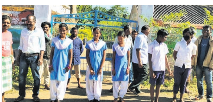
ବିଦ୍ୟାଳୟ ଫାଟକ ଆଗରେ ଛାତ୍ରଛାତ୍ରୀ ଓ ଗ୍ରାମବାସୀ।

ମୟୂରଭଞ୍ଜ ଜିଲ୍ଲା ବାଳିଚିପୋଷି ବ୍ଲକ୍ ଅଧୀନ ବାଳିଚିପୋଷି ପ୍ରକଳ୍ପ ଉ.ପ୍ରା. ବିଦ୍ୟାଳୟରେ ଶ୍ଲାୟା ପ୍ରଧାନଶିକ୍ଷକ ନିମ୍ନୁକ୍ତି ପାଇଁ ଛାତ୍ରଛାତ୍ରୀ ଓ ଗ୍ରାମବାସୀ ଦାବି କରିଛନ୍ତି।