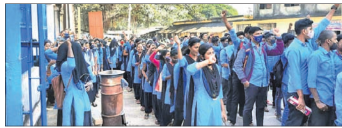
ବିକ୍ଷୋଭ ପ୍ରଦର୍ଶନ କରୁଥିବା ଛାତ୍ରଛାତ୍ରୀ।