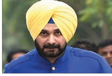
ବିଧାନସଭାରେ କଂଗ୍ରେସ ସଭାପତି ନବଜୋତ ସିଂ ସିଦ୍ଧୁ

କଂଗ୍ରେସ, ୩୧: ପଞ୍ଜାବ ବିଧାନସଭା ନିର୍ବାଚନ ପୂର୍ବରୁ ମହିଳା ଭୋଟଦାତ୍ରୀଙ୍କୁ ହାତରେ ରଖି ରାଜ୍ୟ କଂଗ୍ରେସ ସଭାପତି ନବଜୋତ ସିଂ ସିଦ୍ଧୁ ବୃହତ୍ ୨,୦୦୦ ଟଙ୍କା ଆର୍ଥିକ ସହାୟତା ଯୋଗ୍ୟ କରିଛନ୍ତି। କଂଗ୍ରେସ ସମତାକୁ ଆସିଲେ ପ୍ରତିବର୍ଷ ବୃହତ୍ ୨,୦୦୦ ଟଙ୍କା ପ୍ରତିଶ୍ରୁତି ଦିଆଯିବ ବୋଲି ସେ କହିଛନ୍ତି। ଏଥିପାଇଁ କଲେଜ ଛାତ୍ରୀଙ୍କୁ ଦୁଇଟିଟା ଗାଡ଼ି ଏବଂ ଦାସ ଶ୍ରେଣୀ ଉଦାରଣକୁ ୨୦,୦୦୦ ଓ ଦଶମ ପାଠ୍ୟ ପୁସ୍ତକ ୧୫,୦୦୦ ଟଙ୍କା ଯୋଗାଇ ଦିଆଯିବ ବୋଲି ସେ ପ୍ରତିଶ୍ରୁତି ଦେଇଛନ୍ତି।