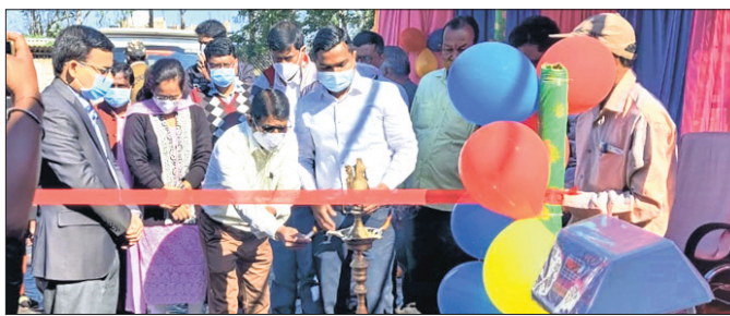
ଜିଲ୍ଲାପାଳ ବିନୀତ ଭଟ୍ଟାଚାର୍ଯ୍ୟଙ୍କ ସମ୍ମୁଖେ ଧାନ କିଣା ଆରମ୍ଭ ହେଉଛି।

ସରକାରଙ୍କ ଖାଦ୍ୟ ଯୋଗାଣ ଓ ଖାଉଟି କଲ୍ୟାଣ ବିଭାଗ ନିର୍ଦ୍ଦେଶନାରେ ଚଳିତ ଖରିଫ ଋତୁରେ ମୟୂରଭଞ୍ଜ ଜିଲ୍ଲାରୁ ଧାନ କିଣା ଆରମ୍ଭ ହୋଇଛି।