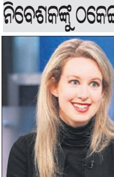
ସାର୍ ପ୍ରାନ୍ତିସକୋ, ୪।୧

ଆମେରିକୀୟ ହେଲଥକେୟାର କମ୍ପାନୀ ଥେରାମୋସ୍ ପ୍ରତିଷ୍ଠାତା ତଥା ସୁବ ବିଲିୟନେୟାର ଏଲିଜାବେଥ୍ ଦୋଷ୍ଟା ନିବେଶକଙ୍କୁ ଠକେଇ ମାମଲାରେ ସୋମବାର ଦୋଷ୍ଟା ସାବ୍ୟସ୍ତ ହୋଇଛନ୍ତି।