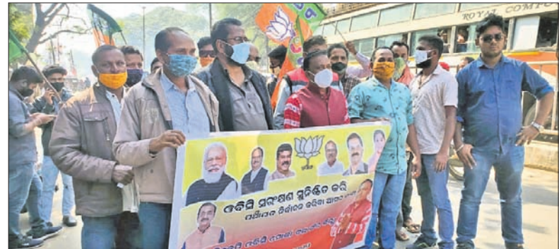
ଭାଜପା ଓଡ଼ିଶା ମୋର୍ଚ୍ଚା ନେତୃବୃନ୍ଦ ଜିଲ୍ଲାପାଳଙ୍କୁ ଦାବିପତ୍ର ଦେବାକୁ ଯାଉଛନ୍ତି।

ଶୁକେ ଆରାମା ନିର୍ବାଚନରେ ସଂରକ୍ଷଣ ଲାଗୁ ନ କରିବାକୁ ନେଇ ସେମାନେ ଅବରୋଧ ପ୍ରକାଶ କରିଥିଲେ। ରାଜ୍ୟରେ ପଞ୍ଚୁଆ ବର୍ଗର ଜନସଂଖ୍ୟା ୫୪ ପ୍ରତିଶତ ଅର୍ଥାତ ୨.୫ କୋଟି। ଏପରି ଶୁକେ ଓଡ଼ିଶା ବର୍ଷକୁ ସଂରକ୍ଷଣ ନ ଦେବା ରାଜ୍ୟ