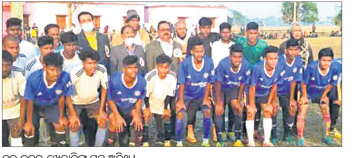
ତୁଳସୀ ଏକାଡେମୀର ଶ୍ରୀ ଗଣେଶ କ୍ଳବର ଉପସ୍ଥିତ ଲାଗୁଥିବା ଖେଳାଳିମାନଙ୍କ ସହ ଅତିଥି।

ଭଦ୍ରକ ଜିଲ୍ଲା ବାସୁଦେବପୁର ଶୁକ୍ଳପୁର ଗ୍ରାମ ନାକମଣି ମିନିଷ୍ଟିଆରମରେ ଶ୍ରୀ ଗଣେଶ କ୍ଳବ ଆନୁଷ୍ଠାନିକ ଭାବରେ ଆୟୋଜିତ ହୋଇଥିବା ତୁଳସୀ ଏକାଡେମୀ କ୍ରୀଡ଼ା ମ୍ୟାଚ୍ ୨-୧ ଗୋଲରେ ବିଜୟୀ ହୋଇଛି।