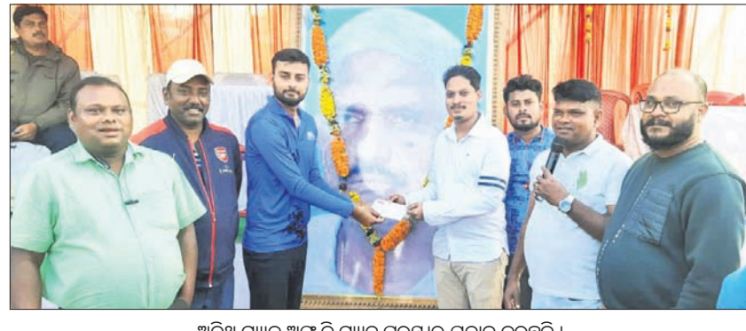
ଅତିଥି ମନ୍ତ୍ରୀ ଅର୍ପି ଦି ମନ୍ତ୍ରୀ ପୁରସ୍କାର ପ୍ରଦାନ କରୁଛନ୍ତି