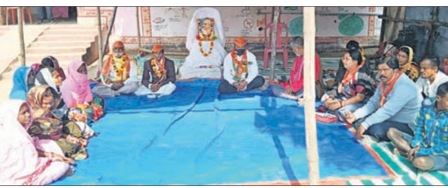
ଗ୍ରାମବାସୀଙ୍କ ପକ୍ଷରୁ ଆମରଣ ଅନଶନ କରାଯାଇଛି।

କେନ୍ଦୁଝର, ୪୧ (ଡି.ଏନ୍.ଏ.) ଆମରଣ ଅନଶନ ଆରମ୍ଭ ହୋଇଛି। ଦାବି ପୂରଣ ନ ହେବା ପର୍ଯ୍ୟନ୍ତ ଗାଳିବେଳେ ତେଜସବୁ ଦିଆଯାଇଛି। ଏହି ଆୟୋଜନରେ ଗୋପାଳ ଦତ୍ତ, ସୁମତୀ ହେଲା ସ୍ଥାୟୀ ତାଲୁର ନ ଥିବାରୁ ପୂର୍ବ ସୂଚନା ଅନୁଯାୟୀ ମଙ୍ଗଳବାର ଗ୍ରାମବାସୀଙ୍କ ପକ୍ଷରୁ ଆମରଣ ଅନଶନ ଆରମ୍ଭ ହୋଇଛି।