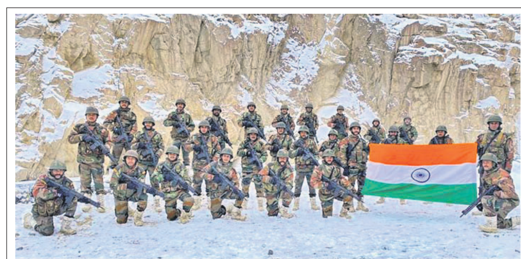
ଗଲଘାନ୍ ଉପତ୍ୟକାରେ ଯବାନମାନେ ନବବର୍ଷ ପାଳନ ଅବସରରେ ଜାତୀୟ ପତାକା ଧରି ଫଟୋ ପାଇଁ ପୋର୍ଟ ଦେଉଛନ୍ତି।

ଆମେରିକୀୟ ହେଲଥକେୟାର କମ୍ପାନୀ ଥେରାମୋସ୍ ପ୍ରତିଷ୍ଠାତା ତଥା ସୁବ ବିଲିୟନେୟାର ଏଲିଜାବେଥ୍ ଦୋଷ୍ଟା ନିବେଶକଙ୍କୁ ଠକେଇ ମାମଲାରେ ସୋମବାର ଦୋଷ୍ଟା ସାବ୍ୟସ୍ତ ହୋଇଛନ୍ତି।