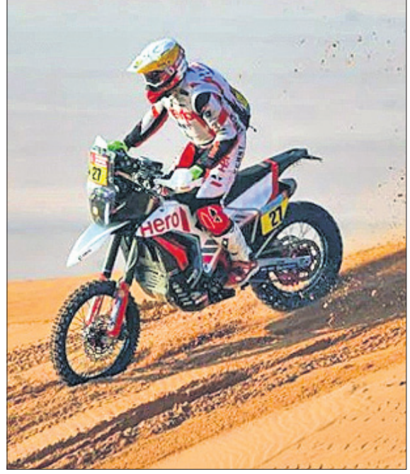
ଚୂତୀୟ ସ୍ପେକ୍ଟ୍ ଅବସରରେ ଡୋକ୍ସିନ ରୋଡ୍‌ରେଡ୍‌ସ୍ ଲିମିଟେଡ୍