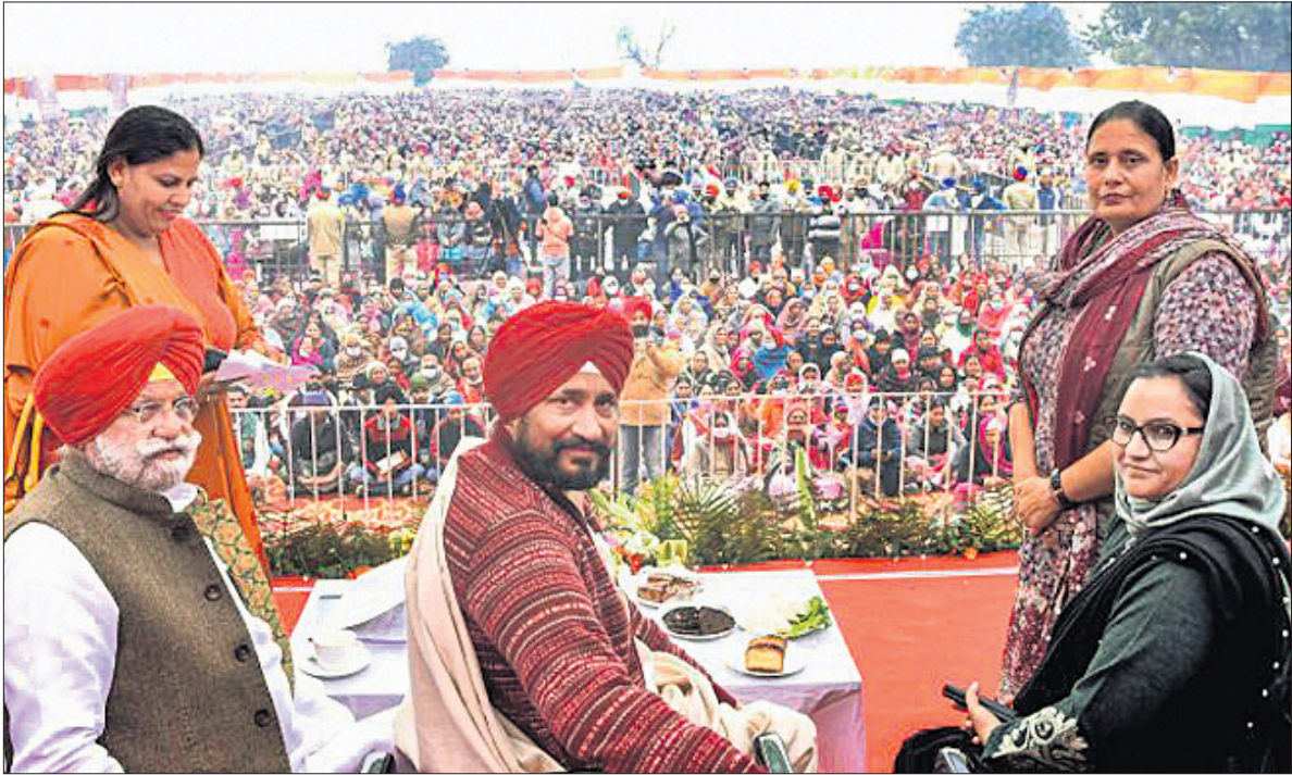
ପଞ୍ଜାବର ରୂପନଗର ଅନ୍ତର୍ଗତ ମୋରିଆରେ ଆରାମା ବିଧାନସଭା ନିର୍ବାଚନ ପାଇଁ ପ୍ରଚାର କରୁଥିବା ମୁଖ୍ୟମନ୍ତ୍ରୀ ଜଗନ୍ନାଥଙ୍କ ସହିତ।