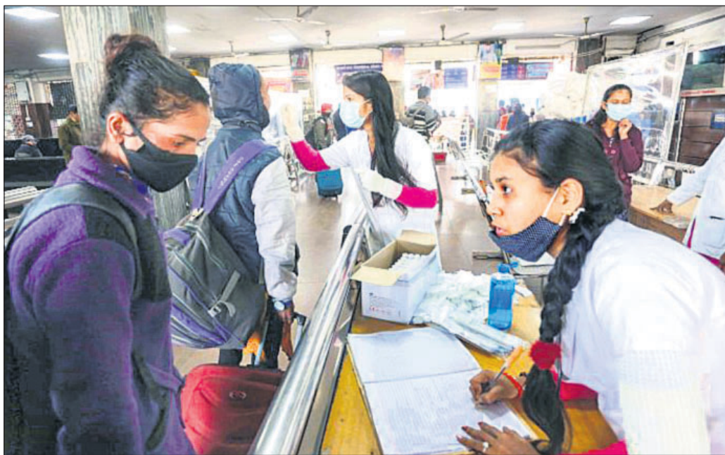
ଭୋପାଳ ରେଳ ଷ୍ଟେଶନରେ ଜଣେ ମେଡିକାଲ ଛାତ୍ରୀ ଯାତ୍ରୀମାନଙ୍କ ସ୍ଵାସ୍ଥ୍ୟ ନିୟନ୍ତ୍ରଣ କରୁଛନ୍ତି।