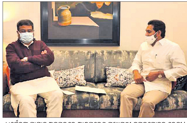
ଧର୍ମେନ୍ଦ୍ରଙ୍କୁ ସାକ୍ଷାତ୍ ଅବସରରେ ଆନ୍ଧ୍ରପ୍ରଦେଶ ମୁଖ୍ୟମନ୍ତ୍ରୀ ଜଗନ୍ନାଥନାଥ ଭେଟିଲେ।