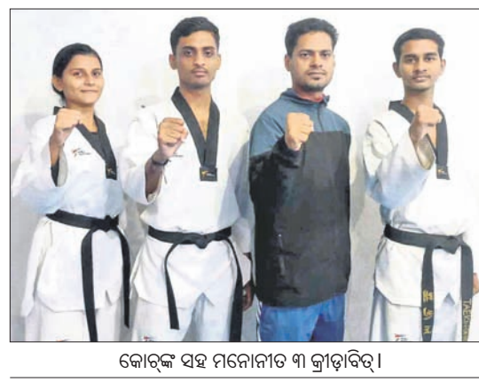
କୋର୍କ ସହ ମନୋନୀତ ଶ୍ରୀକ୍ରୀଡ଼ାବିତ୍