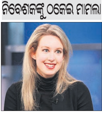
ସାର୍ ପ୍ରାନ୍ତସିଦ୍ଧା, ୪୧

କମ୍ପାନୀ ଥେରାନୋସ୍ ବିକ୍ରିତ କରିଥିବା ଉକ୍ତ ପରାମ୍ପା ଉପକରଣ ମାତ୍ର କିଛି ରୁଦ୍ଧା ଉପରେ ଗ୍ୟାସ୍ କରି ଶରୀରର ସମସ୍ତ ରୋଗ ସମ୍ପର୍କରେ ଜଣାଇପାରିବ ବୋଲି ସେ କହିଥିଲେ।