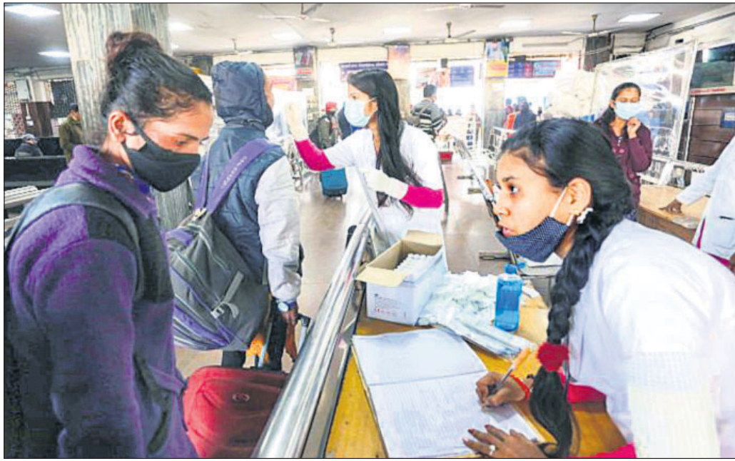
ଭୋପାଳ ରେଳ ଷ୍ଟେଶନରେ ଜଣେ ମେଡିକାଲ ଛାତ୍ରୀ ଯାତ୍ରୀମାନଙ୍କ ସ୍ଵାସ୍ଥ୍ୟ ନମୁନା ସଂଗ୍ରହ କରୁଛନ୍ତି।