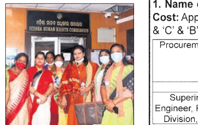
ଭୁବନେଶ୍ୱର, ୪୧୧ (ଖୁବରୋ): ଗଣତନ୍ତ୍ରରେ ସମସ୍ତଙ୍କୁ ବଞ୍ଚିବା ପାଇଁ ସମାନ ଅଧିକାର ଓ ସୁଯୋଗ ମିଳିବା ଦରକାର।