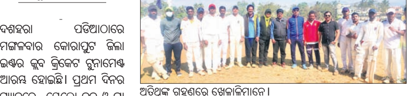
ଅଭିଭୂତ ଗହଣରେ ଖେଳାଳିମାନେ

କୋରାପୁଟ ଜିଲ୍ଲା ଇଣ୍ଡର କ୍ଲବ୍ କ୍ରିକେଟ୍ ଚୁନାମେଣ୍ଟ୍: ରୁନୁ ଦଳ ବିଜୟୀ। ପଞ୍ଚମ ଦିନରେ ଯେଲୋ ଦଳ ଓ ରୁନୁ ଦଳ ପରସ୍ପରକୁ ଭେଟିଥିଲେ।