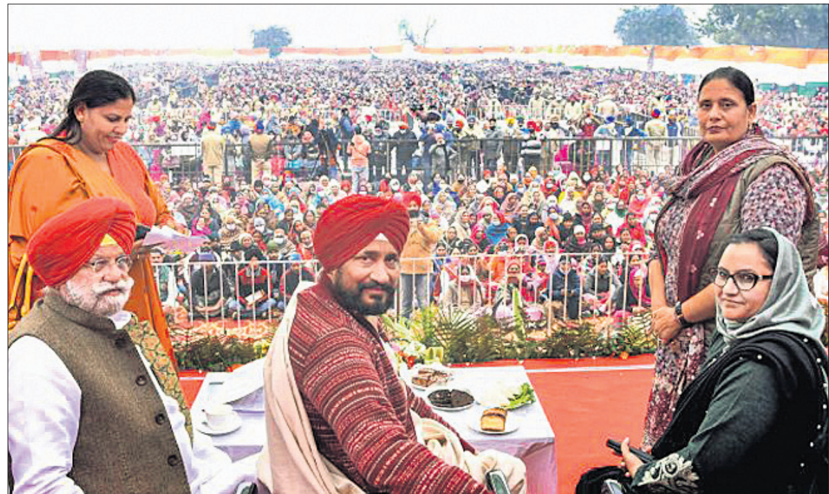
ପଞ୍ଚାବର ରୂପନର ଅନ୍ତର ମୋଡ଼ିଫାଇରେ ଆଗାମୀ ବିଧାନସଭା ନିର୍ବାଚନ ପାଇଁ ପ୍ରଚାର କରୁଥିବା ମୁଖ୍ୟମନ୍ତ୍ରୀ ଚରଣକିନ୍ଦା ଚନ୍ଦ୍ର