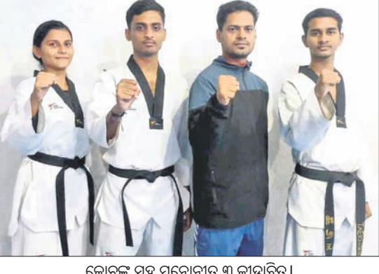
କୋର୍ଟ୍ ସହ ମନୋନୀତ ୩ କ୍ରୀଡ଼ାବିତ୍

ଉତ୍ପକ ଅଫିସ୍, ୪୧: ଚଳିତ ମାସ ୬ ତାରିଖରେ ଉତ୍ତରପ୍ରଦେଶର ଲକ୍ଷ୍ନୋ ସାଲ୍ ସେଣ୍ଟରରେ ଏସିଆନ ଗେମ୍ ଚାଏକୋଥୋ ପ୍ରତିଭା ଚୟନ ପ୍ରକ୍ରିୟା-୨୦୨୨ ଅନୁଷ୍ଠିତ ହେବ।