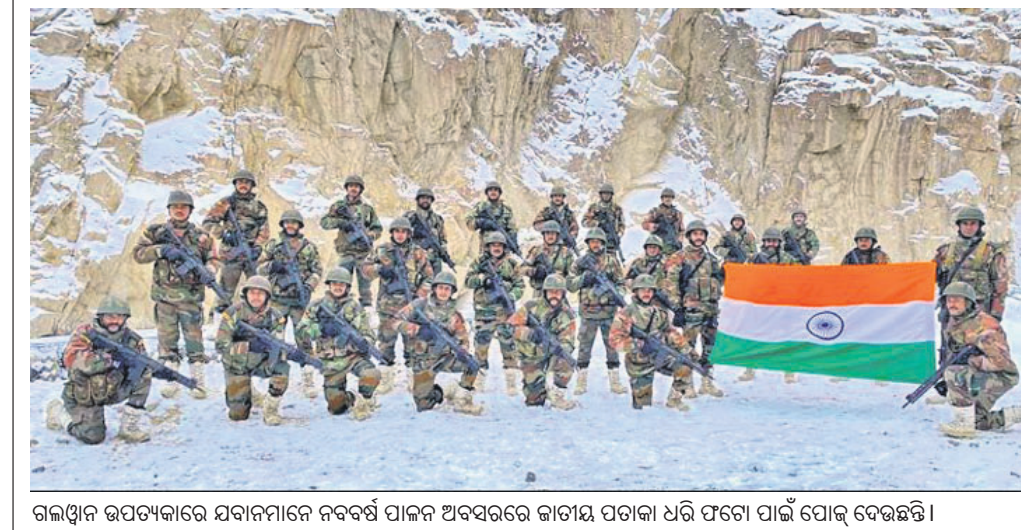
ଗଲଘାନ୍ ଉପତ୍ୟକାରେ ଯବାନମାନେ ନବବର୍ଷ ପାଳନ ଅବସରରେ ଜାତୀୟ ପତାକା ଧରି ଫଟୋ ପାଇଁ ପୋର୍ଟ ଦେଉଛନ୍ତି।

କମ୍ପାନୀ ଥେରାନୋସ୍ ବିକ୍ରିତ କରିଥିବା ଉକ୍ତ ପରାମ୍ପା ଉପକରଣ ମାତ୍ର କିଛି ରୁଦ୍ଧା ଉପରେ ଗ୍ୟାସ୍ କରି ଶରୀରର ସମସ୍ତ ରୋଗ ସମ୍ପର୍କରେ ଜଣାଇପାରିବ ବୋଲି ସେ କହିଥିଲେ।