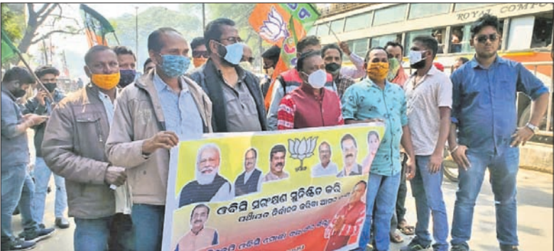
ଭାଜପା ଓଡ଼ିଶା ମୋଟା ନେତୃବୃନ୍ଦ ଜିଲ୍ଲାପାଳଙ୍କୁ ଦାବିପତ୍ର ଦେବାକୁ ଯାଇଛନ୍ତି।

ସ୍ଥଳ ଆଗାମୀ ନିର୍ବାଚନରେ ସଂରକ୍ଷଣ ଲାଗୁ କରିବାକୁ ନେଇ ସେମାନେ ଅବତୋଷ ପ୍ରକାଶ କରିଥିଲେ। ରାଜ୍ୟରେ ପଛୁଆ ବର୍ଗର ଜନସଂଖ୍ୟା ୫୪ ପ୍ରତିଶତ ଅର୍ଥାତ ୨.୫ କୋଟି ଏପରି ସ୍ଥଳ ଓଡ଼ିଶା ସଂରକ୍ଷଣ ନ ଦେବା ରାଜ୍ୟ