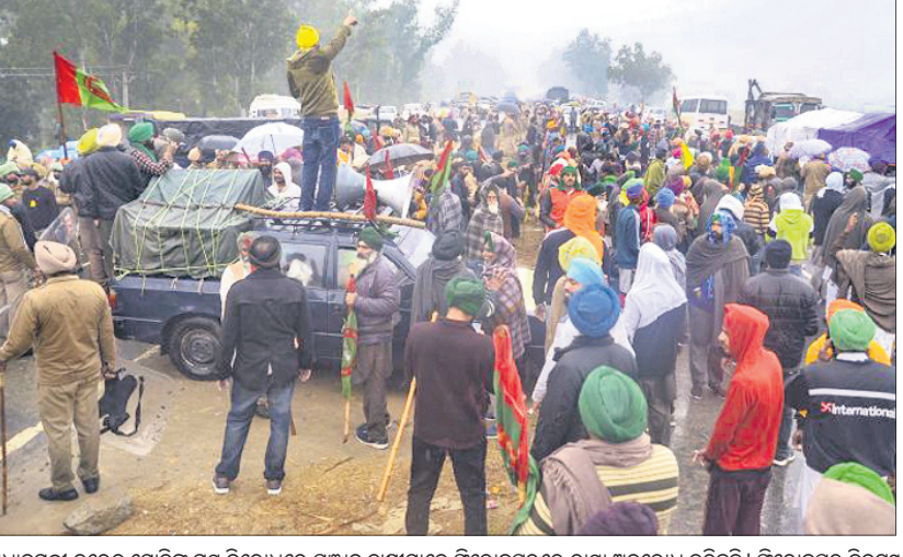
ପ୍ରଧାନମନ୍ତ୍ରୀ ନରେନ୍ଦ୍ର ମୋଦିଙ୍କ ଗସ୍ତ ବିରୋଧରେ ପଞ୍ଜାବ ଗଣମାନେ ପିରୋକପୁରରେ ରାସ୍ତା ଅବରୋଧ କରିଛନ୍ତି। ପିରୋକପୁର ନିକଟସ୍ଥ ଯୁଏଓବର ଉପରେ ପ୍ରଧାନମନ୍ତ୍ରୀ ପରିହରଣକରିବାକୁ ବନ୍ଦ୍ୟାସି ସରକାରମାନେ ଚାକ କାରକୁ ଘେରିଛନ୍ତି।