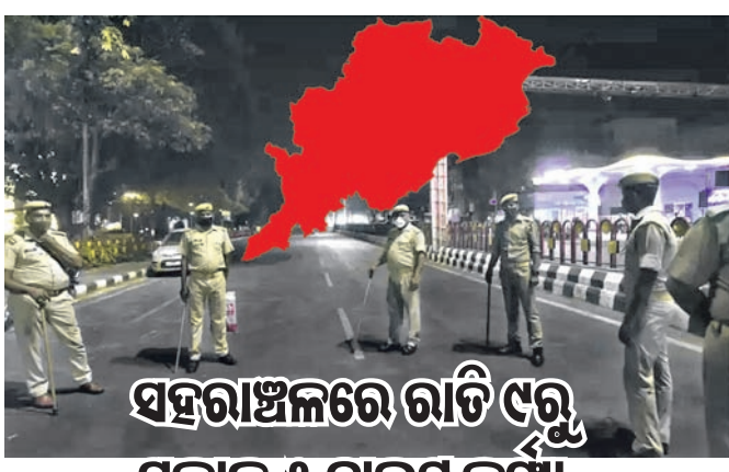
ସହରାଞ୍ଚଳରେ ରାତି ୯ରୁ ସକାଳ ୫ ନାଲ୍ କର୍ଫ୍ୟୁ

ଭୁବନେଶ୍ୱର, ୫।୧ (ବୁଧବାର) କରୋନାର ନୂଆ ଭାରିଆଣ୍ଟ ଓମିକ୍ରନ୍ ଆକ୍ରାନ୍ତଙ୍କ ସଂଖ୍ୟା ଦ୍ରୁତ ବେଗରେ ବୃଦ୍ଧି ପାଇବାରେ ଲାଗିଛି। ଦିନକୁ ଦିନ ସଂକ୍ରମଣ ବଢ଼ିଚାଲିଥିବାରୁ ସରକାରଙ୍କ ଚିନ୍ତା ବଢ଼ିଯାଇଛି। ଏହାକୁ କିପରି ନିୟନ୍ତ୍ରଣରେ ରଖାଯାଇ ପାରିବ ସେ ନେଇ ସରକାର ପଦକ୍ଷେପ ନେବା ଆରମ୍ଭ କରିଛନ୍ତି। ଜାନୁଆରୀ ମାସ ପାଇଁ ଗାଇଡ଼ଲାଇନ ଜାରି ହୋଇଥିଲେ ମଧ୍ୟ ଓମିକ୍ରନ୍ ସଂକ୍ରମଣକୁ ବେଶ୍ କଟକଣାକୁ ଆଣିବା କଠିନ କରାଯାଇଛି। ବୁଧବାର ସ୍ୱତନ୍ତ୍ର ରିଲିଫ୍ କମିଶନର(ଏସ୍ଆରସି)ଙ୍କ କାର୍ଯ୍ୟାଳୟ ପକ୍ଷରୁ ସ୍ୱତନ୍ତ୍ର ନୂଆ ଗାଇଡ଼ଲାଇନ ଜାରି କରାଯାଇଛି। ସଂକ୍ରମଣ ବୃଦ୍ଧି ପାଇଥିବାରୁ ରାଜ୍ୟର ସମସ୍ତ ସହରାଞ୍ଚଳରେ ରାତି ୧୦ଟା ପରିବର୍ତ୍ତେ ୯ଟାରୁ ନାଲ୍ କର୍ଫ୍ୟୁ ଲାଗୁ ହେବ। ଜାନୁଆରୀ ୭ରୁ ଫେବୃଆରୀ ୧ ଚାରିଜା ଯାଏ ଏହି କଟକଣା ଲାଗୁ ହେବ। ସଂକ୍ରମଣ ବହୁଥିବାରୁ ରାଜ୍ୟର ସମସ୍ତ ସ୍କୁଲ, କଲେଜରେ ଦ୍ୱାଦଶ ଶ୍ରେଣୀ ପର୍ଯ୍ୟନ୍ତ କ୍ଲାସ୍ ବନ୍ଦ ରହିବ। ଏ ନେଇ ପ୍ରୋଫିଟିଓର(ଏସ୍ଡିପି) ଜାରି କରିବେ।