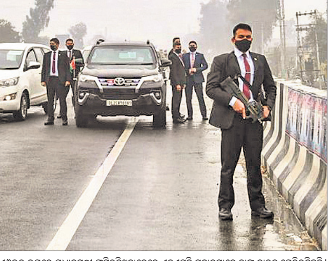
ପ୍ରଧାନମନ୍ତ୍ରୀ ନରେନ୍ଦ୍ର ମୋଦିଙ୍କ ଗସ୍ତକୁ ବିରୋଧ କରିଆସୁଥିବାବେଳେ ୨ ବର୍ଷ ମଧ୍ୟରେ ରାଜ୍ୟକୁ ଏହା ଥିଲା ଚାକର ପ୍ରଥମ ଗସ୍ତ। ସ୍ୱରାଷ୍ଟ୍ର ମନ୍ତ୍ରୀଙ୍କ ସହ ଏହାକୁ ଏକ ବଡ଼ ସୁରକ୍ଷା କ୍ରମି ଭାବେ ଅଭିହିତ କରି ପଞ୍ଜାବ ସରକାରଙ୍କଠାରୁ ବିସ୍ତୃତ ରିପୋର୍ଟ ମାଗିଛି। ଏହି ପ୍ରସଙ୍ଗରେ ଭାଜପା ଏବଂ କଂଗ୍ରେସ ମଧ୍ୟରେ ବାକ୍‌ସ୍ପନ୍ଦ୍ ଜାତୀୟ ରାଜନୀତିକୁ ଉତ୍ସ ୧୬ ପୃଷ୍ଠା-୬