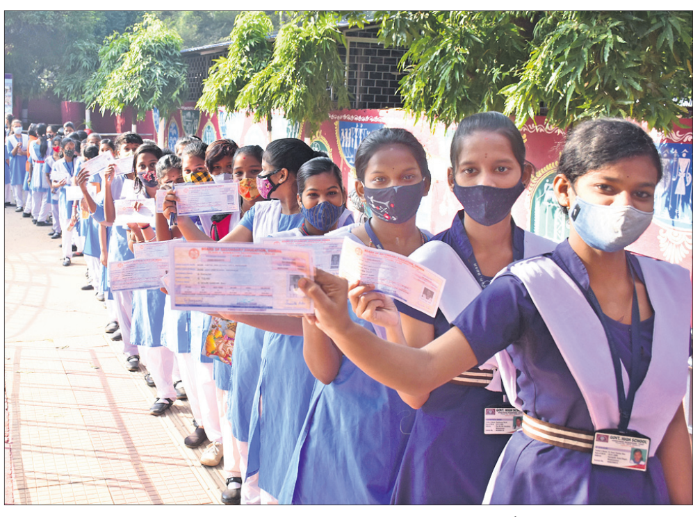
ମାଟ୍ରିକ ସମେତ-୧ ପରୀକ୍ଷାର ପ୍ରଥମ ଦିନ ବୁଧବାର ଭୁବନେଶ୍ୱରର କ୍ୟାମ୍ପସ୍‌ରେ ଶ୍ରୀଜଗନ୍ନାଥ ମନ୍ଦିର ପ୍ରବେଶ କରୁଛନ୍ତି।