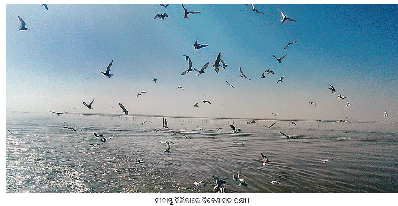
ନୀଳାୟୁ ତିଳିକାରେ ବିଦେଶାଗତ ପକ୍ଷୀ।