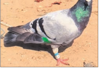
ମହାକାଳପଡ଼ା, ୫୧ (ଡି.ଏନ.ଏ.)