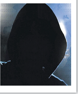
ମହାକାଳପଡ଼ା, ୫୧ (ଡି.ଏନ.ଏ.)