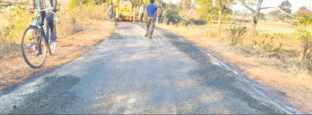
ରାସ୍ତା କାମ ନିମ୍ନମାନର ହୋଇଛି।

କଳିଙ୍ଗାପଥରରୁ ଭୋଗରା ରାସ୍ତା କେତେ ଚଙ୍କାର କାମ, କେତେ ଚଙ୍କାରେ ଠିକାଦାର କାମ ନେଇଛନ୍ତି ଓ କଣ କଣ ରାସ୍ତାର ଚଉଡ଼ା ୩.୭୫ ମିଟର କରୁଛନ୍ତି କେତେବେଳେ ୩ ମିଟର କରୁଛନ୍ତି। ପୁଣି କିଛି ରାସ୍ତାର ଚଉଡ଼ା ୩.୭୫ ମିଟର ଉର୍ଦ୍ଧ୍ୱରେ ଅଛି, କିଛି ନେଗାଲିଙ୍ଗ ୩ ମିଟର ହୋଇଥିଲା ବୋଲି ରାସ୍ତା ୩ ମିଟର କରୁଛନ୍ତି। ଏହି ଘଟଣା ଅଞ୍ଚଳବାସୀଙ୍କ ସ୍ୱାଧୀନତା ଚାପ ପ୍ରତିକ୍ରମ ସୃଷ୍ଟି କରିଛି।