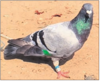
ମହାକାଳପଡ଼ା, ୫୧ (ଡି.ଏନ.ଏ.)