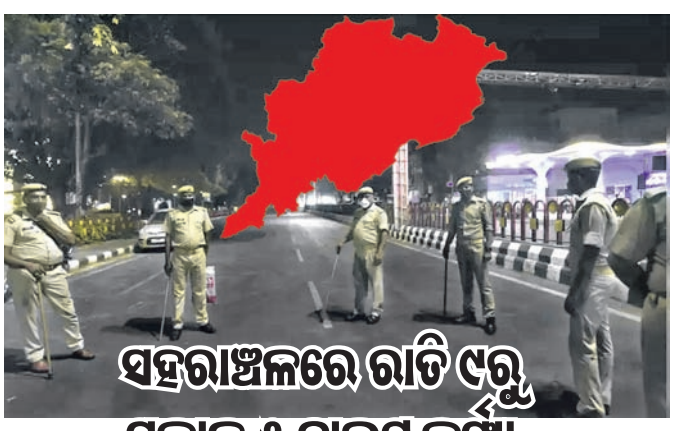
ସହରାଞ୍ଚଳରେ ରାତି ୯ରୁ ସକାଳ ୫ ନାଇଟ୍ କର୍ଫ୍ୟୁ

ଭୁବନେଶ୍ୱର, ୫।୧ (ବୁଧବାର) କରୋନାର ନୂଆ ଭାରିଆଣ୍ଟ ଓମିକ୍ରନ୍ ଆକ୍ରାନ୍ତଙ୍କ ସଂଖ୍ୟା ଦ୍ରୁତ ବେଗରେ ବୃଦ୍ଧି ପାଇବାରେ ଲାଗିଛି। ଦିନକୁ ଦିନ ସଂକ୍ରମଣ ବଢ଼ିଚାଲିଥିବାରୁ ସରକାରଙ୍କ ଚିନ୍ତା ବଢ଼ିଯାଇଛି। ଏହାକୁ କିପରି ନିୟନ୍ତ୍ରଣରେ ରଖାଯାଇ ପାରିବ ସେ ନେଇ ସରକାର ପଦକ୍ଷେପ ନେବା ଆରମ୍ଭ କରିଛନ୍ତି। ଜାନୁଆରୀ ମାସ ପାଇଁ ଗାଇଡ଼ଲାଇନ ଜାରି ହୋଇଥିଲେ ମଧ୍ୟ ଓମିକ୍ରନ୍ ସଂକ୍ରମଣକୁ ବେଶ୍ କଟକଣାକୁ ଆଣିବା କଠିନ କରାଯାଇଛି। ରୁଧିର ରାଜ୍ୟର ସ୍ୱତନ୍ତ୍ର ରିଲିଫ କମିଶନର (ଏସ୍ଆରସି)ଙ୍କ କାର୍ଯ୍ୟାଳୟ ପକ୍ଷରୁ ସ୍ୱତନ୍ତ୍ର ନୂଆ ଗାଇଡ଼ଲାଇନ ଜାରି କରାଯାଇଛି। ସଂକ୍ରମଣ ବୃଦ୍ଧି ପାଇଥିବାରୁ ରାଜ୍ୟର ସମସ୍ତ ସହରାଞ୍ଚଳରେ ରାତି ୧୦ଟା ପରିବର୍ତ୍ତେ ୯ଟାରୁ ନାଇଟ୍ କର୍ଫ୍ୟୁ ଲାଗୁ ହେବ। ଜାନୁଆରୀ ୭ରୁ ଫେବୃଆରୀ ୧ ଚାରିଜା ଯାଏ ଏହି କଟକଣା ଲାଗୁ ହେବ। ସଂକ୍ରମଣ ବହୁଥିବାରୁ ରାଜ୍ୟର ସମସ୍ତ ସ୍କୁଲ, କଲେଜରେ ଦ୍ୱାଦଶ ଶ୍ରେଣୀ ପର୍ଯ୍ୟନ୍ତ କ୍ଲାସ୍ ବନ୍ଦ ରହିବ। ଏ ନେଇ ଗ୍ରେଣୀ ପର୍ଯ୍ୟନ୍ତ କ୍ଲାସ୍ ବନ୍ଦ ରହିବ। କିନ୍ତୁ ଅନୁଲାଇନ ପାଠପଢ଼ା ଚାଲୁ ରହିବ।