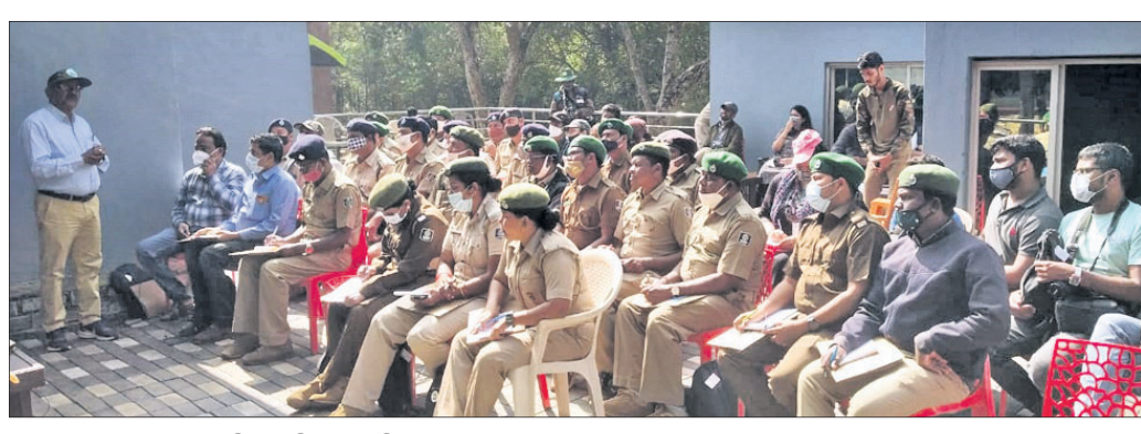
ଗଣନାକାରୀଙ୍କୁ ସ୍ୱତନ୍ତ୍ର ପ୍ରଶିକ୍ଷଣ ଦିଆଯାଇଛି ।

ରାଜନଗର, ୫୧ (ଡି.ଏନ.ଏ.) ଭିତରକନିକା ଜାତୀୟ ଉଦ୍ୟାନ ଓ ଉଦ୍ୟାନ ବାହାରେ ପ୍ରାସିଦ୍ଧ ନବାନାଲରେ ଥିବା ବଉଳା କୁମ୍ଭୀର ଗଣନା ପାଇଁ ବୁଧବାର ବନ କର୍ମଚାରୀମାନଙ୍କୁ ସ୍ୱତନ୍ତ୍ର ପ୍ରଶିକ୍ଷଣ ଦିଆଯାଇଛି । ବୁଧବାରଠାରୁ ଆସନ୍ତା ୧୦ ତାରିଖ ଯାଏ କୁମ୍ଭୀର ଗଣନା କରାଯିବ । ୧୧ ତାରିଖରେ ଏହି ଗଣନା ପ୍ରକ୍ରିୟା ଶେଷ ହେବ । ସେଥିପାଇଁ ଜାନୁୟାରୀ ୨ ରୁ ୧୧ ତାରିଖ ଯାଏ ୧୦ଦିନ ଧରି ଭିତରକନିକା ଜାତୀୟ ଉଦ୍ୟାନ ପର୍ଯ୍ୟଟକଙ୍କ ପାଇଁ ବନ୍ଦ ରଖାଯାଇଛି । ପ୍ରତିବର୍ଷ କୁମ୍ଭୀର ଗଣନା ହେଉଥିବା ପାରମ୍ପରିକ ପଦ୍ଧତି ସହିତ ଚଳିତ ବର୍ଷ ପ୍ରଥମ ଥର ପାଇଁ ପଲିଗନ