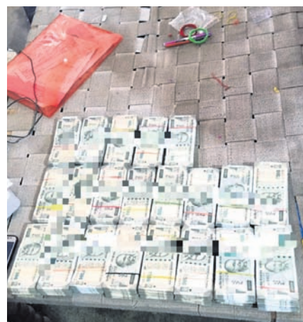
ଚଢ଼ାଇ ବେଳେ ପିଣ୍ଡୁଙ୍କ ଘରୁ ଜବତ ୨୦ ଲକ୍ଷ ଟଙ୍କା।

ଏକ କଣ୍ଠେନରରୁ ୪ କୁରାଏଲ ୪୦ କେଜି ଗଞ୍ଜେଇ ଜବତ କରିଥିଲା। ଏଥିସହ କଣ୍ଠେନର ଗାଳକ ଓ ପାଲକଟି କରି ନେଉଥିବା ଏକ କାରରେ ଥିବା ୩ ଜଣଙ୍କୁ ଗିରଫ କରିଥିଲା।