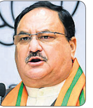
ପ୍ରଧାନମନ୍ତ୍ରୀଙ୍କ ଗସ୍ତକୁ ବିରୋଧ କରିବା ପାଇଁ ଆନ୍ଦୋଳନ ଚଳାଯାଇଛି ।