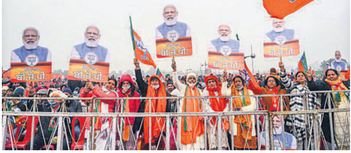
ଫିରୋଜପୁର ସଭାରେ ପ୍ରଧାନମନ୍ତ୍ରୀଙ୍କ ଆଗମନ ଅପେକ୍ଷାରେ ଭାଙ୍ଗିବା ସମର୍ଥକ।

ବିରୋଧ କରି ରୁଧିବାର ଫିରୋଜପୁରରେ କୁଷ୍ଠକର୍ମୀଙ୍କର ଗାଥାପଞ୍ଜି ହେବାକୁ ସମାଜୀୟ ଶକ୍ତି ଥିବା କହିବାକୁ ପାରିବେ ନାହିଁ ।