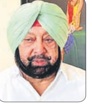
ପ୍ରଧାନମନ୍ତ୍ରୀଙ୍କ ଗସ୍ତକୁ ବିରୋଧ କରିବା ପାଇଁ ଆନ୍ଦୋଳନ ଚଳାଯାଇଛି ।