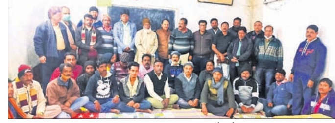
ବୈଠକରେ ଭଦ୍ରକ ଅଞ୍ଚଳ ଭାରତୀୟ ଦୁଃଖୀ ସମାଜର କର୍ମକର୍ମୀ।

ଭଦ୍ରକ ଅଞ୍ଚଳ ସାନ ସରକାର ବାବା ସ୍ମୃତିଦିନ ସମୟରେ ଆଖିପତା ଓ ଉପ ମାମାଜାନଙ୍କ ଜନ୍ମଦିନ ପାଳନ କରାଯାଇଛି।