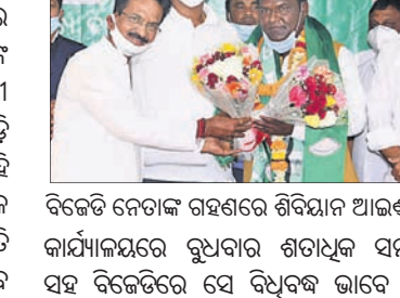
ବିଜେଡିରେ ମିଶିଲେ ଜେଏମ୍ଏମ୍ ଉପସଭାପତି ।