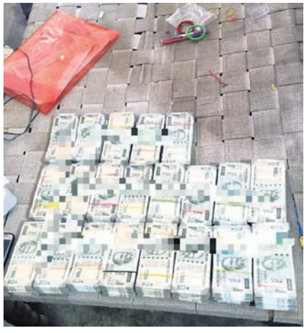
ଚଢ଼ାଇ ବେଳେ ପିଣ୍ଡୁଙ୍କ ଘରୁ ଜବତ ୨୦ ଲକ୍ଷ ଟଙ୍କା।