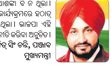
ପ୍ରଧାନମନ୍ତ୍ରୀଙ୍କ ଗସ୍ତକୁ ବିରୋଧ କରିବା ପାଇଁ ଆନ୍ଦୋଳନ ଚଳାଯାଇଛି ।