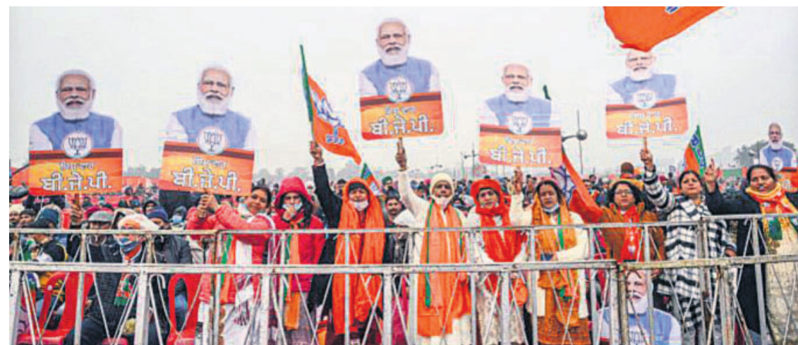
ଫିରୋଜପୁର ସଭାରେ ପ୍ରଧାନମନ୍ତ୍ରୀଙ୍କ ଆଗମନ ଅପେକ୍ଷାରେ ଭାଙ୍ଗିବା ସମ୍ପର୍କରେ

ଫିରୋଜପୁର, ୫୧୧ ପ୍ରଧାନମନ୍ତ୍ରୀ ନରେନ୍ଦ୍ର ମୋଦିଙ୍କ ପଞ୍ଜାବ ଗସ୍ତକୁ ବିରୋଧ କରି ରୁଧିରାଣୀ ଫିରୋଜପୁରରେ କୃଷକମାନେ ରାସ୍ତାକୁ ଓହ୍ଲାଇଛନ୍ତି।