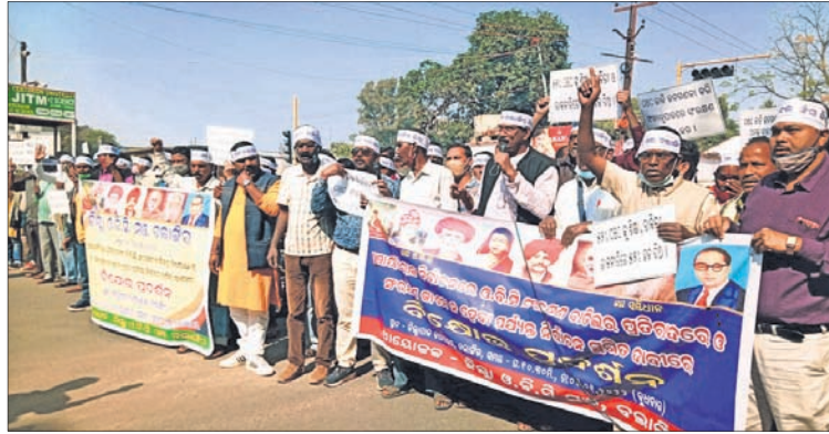
ଜିଲ୍ଲାପାଳଙ୍କ କାର୍ଯ୍ୟାଳୟ ସମ୍ମୁଖରେ ଓସିସି ମଞ୍ଚ ଚରମ ଚେତାବନୀ ପ୍ରଦର୍ଶନ କରାଯାଇଛି।

ଜିଲ୍ଲା ଓସିସି ମଞ୍ଚ ଶୁଣାଇଲା ଚରମ ଚେତାବନୀ ଜିଲ୍ଲାପାଳଙ୍କ ଜରିଆରେ ମୁଖ୍ୟମନ୍ତ୍ରୀଙ୍କୁ ଦେଲେ ଦାବିପତ୍ର