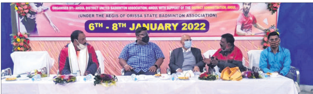
ଉଦ୍ଘାଟନା କାର୍ଯ୍ୟକ୍ରମ ଅବସରରେ ଅତିଥିମାନେ।

ଅନୁଗୋଳ ଅଞ୍ଚଳରେ ଅନୁଗୋଳ ଜିଲ୍ଲା ଉଦ୍ଘାଟିତ ହୋଇଛି।