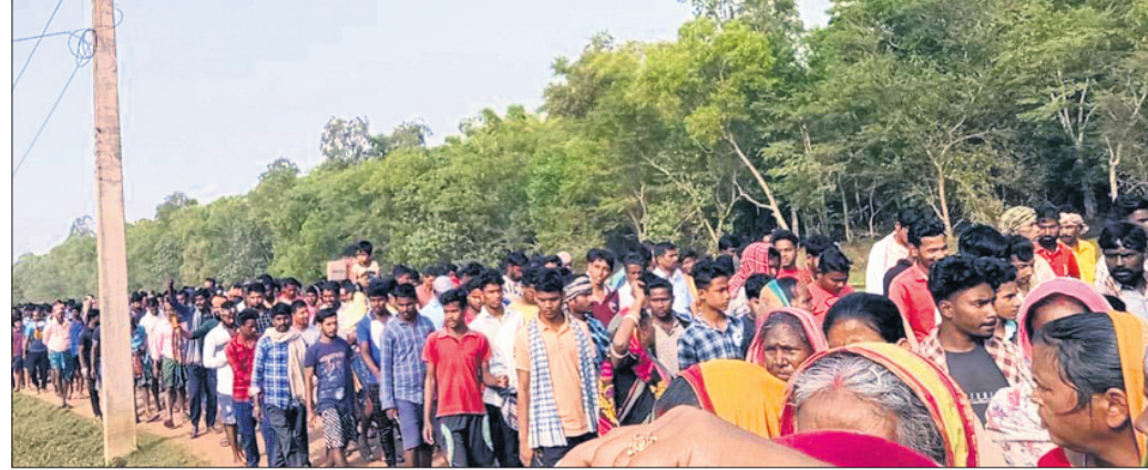
ପ୍ରସ୍ତାବିତ କେଏସ୍‌ସିଏସ୍ ପ୍ରକଳ୍ପକୁ ବିରୋଧ କରି ଡିକ୍ରେଟିଭ୍ ଗ୍ରାମର ଲୋକମାନେ ଶୋଭାଯାତ୍ରାରେ ଯାଉଛନ୍ତି ।