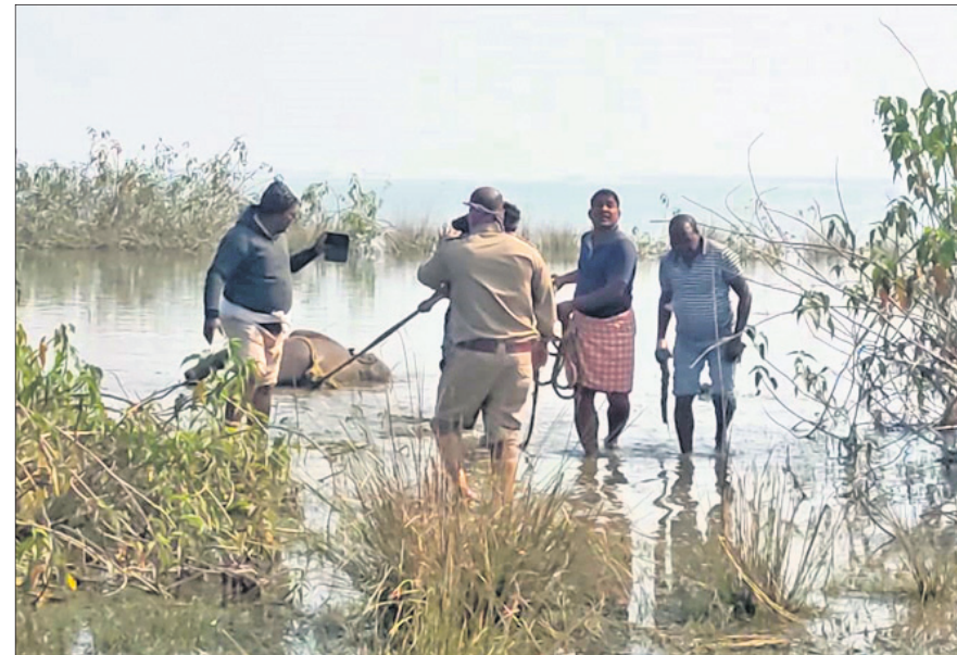
ରେଙ୍ଗାଲି ତ୍ୟାମ୍ବୁ ମୃତ ହାତୀ ଶାବକକୁ ଉଦ୍ଧାର କରାଯାଇଛି।