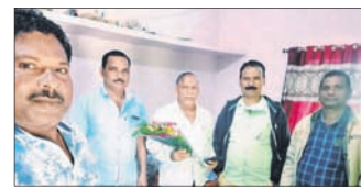
ଛେଡ଼ିପଦା, ୭ (ସ.ପ୍ର.)

ଅନୁଗୋଳ ଜିଲ୍ଲା ଶରତ ଗଡ଼ନାୟକ ନୂଆ ସଭାପତି ରହିବେ ବୋଲି ଜଣାପଡ଼ିଛି।