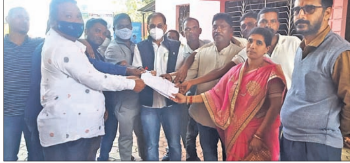
କୁନାଗଡ଼ରେ ଭାଜପା ଓଡ଼ିଶା ମୋର୍ଚ୍ଚା ପକ୍ଷରୁ ଦାବିପତ୍ର ଦିଆଯାଇଛି।

ଅନୁସୂଚିତ ଜାତି, ଜନଜାତି ଓ ପଛୁଆବର୍ଗ ମିଶି ୧୪ ପ୍ରତିଶତ ରହିଛି। ଉଚ୍ଚ ନ୍ୟାୟାଳୟର ନିଷ୍ପତ୍ତି ଆକ ଦେଖାଇ ରାଜ୍ୟ ସରକାର ଓଡ଼ିଶାବର୍ଗଙ୍କୁ ଆଗାମୀ ତ୍ରିସ୍ରାୟ ପଞ୍ଚାୟତ ନିର୍ବାଚନରେ ବଞ୍ଚିତ କରିବାକୁ ଉଦ୍ୟମ କରୁଛନ୍ତି ବୋଲି ଦାବିପତ୍ରରେ ଉଲ୍ଲେଖ କରାଯାଇଛି। ଆଗାମୀ ପଞ୍ଚାୟତ ଅନେକ ଜିଲା ରହିଛି। ସେଥିମଧ୍ୟରୁ