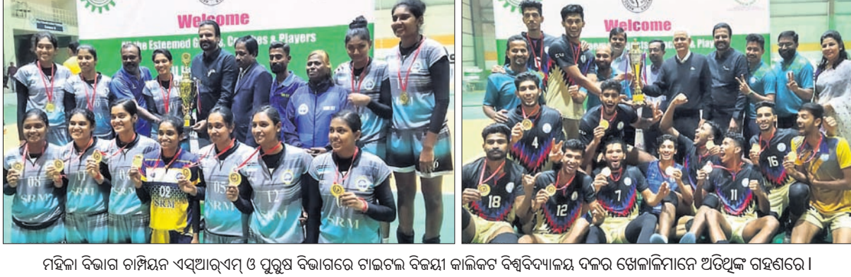
ମହିଳା ବିଭାଗ ଚାମ୍ପିୟନ ଏସ୍‌ଆର୍‌ଏମ୍ ଓ ପୁରୁଷ ବିଭାଗରେ ଗାଜଲ ବିଜୟୀ କାଲିକଟ ବିଶ୍ୱବିଦ୍ୟାଳୟ ଦଳର ଖେଳାଳିମାନେ ଅତିଥିକ ଗହଣରେ।

ଭୁବନେଶ୍ୱର, ୭।୧ (କ୍ରୀଡ଼ା ପ୍ରତିନିଧି) କିନ୍ତୁ ବିକ୍ତ ପଟ୍ଟନାୟକ ଉଦ୍ଦେଶ୍ୟରେ ଷ୍ଟାଡିୟମରେ ଅନୁଷ୍ଠିତ ସର୍ବଭାରତୀୟ ଆଠଃ ବିଶ୍ୱବିଦ୍ୟାଳୟ ଆଠଃ ଗୋର୍ ଭଲିବଲ ଚୁର୍ନାମେଣ୍ଟରେ ଏସ୍‌ଆର୍‌ଏମ୍ ମହିଳା ଓ କାଲିକଟ ବିଶ୍ୱବିଦ୍ୟାଳୟ ପୁରୁଷ ଦଳଗୁଡ଼ିକ ଚାମ୍ପିୟନ ହୋଇଛନ୍ତି। ଶୁକ୍ରବାର ଅନୁଷ୍ଠିତ ପୁରୁଷ ଦଳର