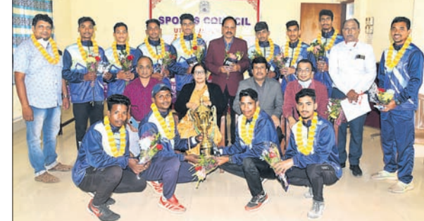
ସମର୍ଥନ ହେବା ଅବସରରେ ଭକ୍ତ ବିଶ୍ୱବିଦ୍ୟାଳୟ ଖୋଖୋ ଦଳ।