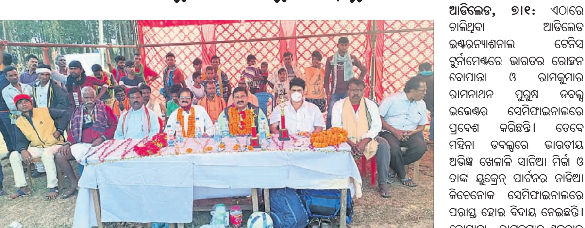
ଉଦ୍ଘାଟନା ମ୍ୟାଚରେ ଉପସ୍ଥିତ ଅତିଥିମାନେ।