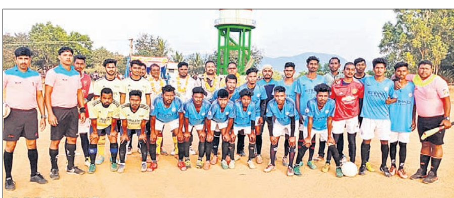
ଅତିଥିକ ଗହଣରେ ଖେଳାଳିମାନେ।