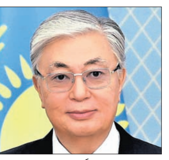
କାସ୍ୟାପ ଜୋମାର୍ଟ ଚୋକାୟେଭ୍

ଆଲମାଟି, ୭/୧ ଗ୍ୟାସ୍ ଦର ବୃଦ୍ଧିକୁ ବିରୋଧ କରି କାଜାଖସ୍ତାନରେ ଭେଦନା ସୃଷ୍ଟି ହୋଇଛି। ସରକାର ଏକପିଟି ଦର ବୃଦ୍ଧିକୁ କରୁଥିବା ପରେ ସାଧାରଣ ଜନତା ଏହାର ପ୍ରତିବାଦରେ ରାସ୍ତାକୁ ଓହ୍ଲାଇଛନ୍ତି। ସେମାନେ ସରକାରୀ ଅଫିସଗୁଡ଼ିକୁ ଧସେଇ ପଶି ଚାର୍ଜେଟ କରିଥିବାବେଳେ ପୁରସ୍କା ବାହିନୀ ବଳ ପ୍ରୟୋଗ କରିଛି। ପୋଲିସ-ଜନତା ଖଣ୍ଡପୁଲରେ ଭେଦ ପକ୍ଷର ଅନେକ ମୃତ୍ୟୁ ହେଉଛି। ବିକ୍ଷୋଭକାରୀଙ୍କୁ ଚୁଲି ଚଳାଇବାକୁ ଶୁକ୍ରବାର କାଜାଖସ୍ତାନ ରାଷ୍ଟ୍ରପତି କାସ୍ୟାପ ଜୋମାର୍ଟ ଚୋକାୟେଭ୍ ସୈନ୍ୟବାହିନୀକୁ ନିର୍ଦ୍ଦେଶ ଦେଇଛନ୍ତି। ଅଧିକ ବିଶ୍ୱାସୀ