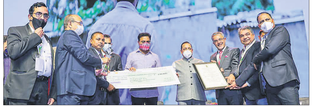
ହାଇଡ୍ରୋପାୱାରରେ ଅନୁଷ୍ଠିତ କାର୍ଯ୍ୟକ୍ରମରେ ଓଡ଼ିଶାର ଅଧିକାରୀମାନେ ପୁରସ୍କାର ଗ୍ରହଣ କରୁଛନ୍ତି ।

ଭୁବନେଶ୍ୱର, ୭୧ (ବୁଧବେ) - କେନ୍ଦ୍ରମନ୍ତ୍ରାଳୟରୁ ଏହି ପୁରସ୍କାର ଗ୍ରହଣ କରାଯାଇଛି । ରାଜ୍ୟ ଓ ଜାତୀୟସ୍ତରୀୟ ୮୯ ପୁରସ୍କାରୀଙ୍କୁ ଏହି ପୁରସ୍କାର ପ୍ରଦାନ କରାଯାଇଛି ।