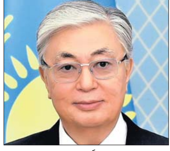
କାସ୍ୟାପ କୋମାର୍ଟ ଚୋକାୟେଭ୍

ଆଲମତି, ୭୧ ଗ୍ୟାସ୍ ବର ବୁଦ୍ଧିକୁ ବିରୋଧ କରି କାଜାଖସ୍ତାନରେ ଭରେକନା ସୃଷ୍ଟି ହୋଇଛି। ସରକାର ଏକପିଟି ଦର ବୃଦ୍ଧି କରିବା ପରେ ସାଧାରଣ ଜନତା ଏହାର ପ୍ରତିବାଦରେ ରାସ୍ତାକୁ ଓହ୍ଲାଇଛନ୍ତି। ସେମାନେ ସରକାରୀ ଅଫିସ୍‌ଗୁଡ଼ିକୁ ଧସେଇ ପଶି ଚାର୍ଜେଜ୍ କରିଥିବାବେଳେ ପୁରସ୍କା ବାହିନୀ ବଳ ପ୍ରୟୋଗ କରିଛି। ପୋଲିସ୍-ଜନତା ଖଣ୍ଡମୁହଁରେ ଉଭୟ ପକ୍ଷର ଅନେକ ମୃତ୍ୟୁ ହେଲେଣି। ବିକ୍ଷୋଭକାରୀଙ୍କୁ ଚୁଲି ଚଳାଇବାକୁ ଶୁକ୍ରବାର କାଜାଖସ୍ତାନ ରାଷ୍ଟ୍ରପତି କାସ୍ୟାପ କୋମାର୍ଟ ଚୋକାୟେଭ୍ ସୈନ୍ୟବାହିନୀକୁ ନିର୍ଦ୍ଦେଶ ଦେଇଛନ୍ତି। ଅଧିକ ବିଶ୍ୱାସୀ ସୈନ୍ୟଙ୍କୁ କାଜାଖସ୍ତାନ ରାଷ୍ଟ୍ରପତିଙ୍କ ନିର୍ଦ୍ଦେଶ ହଜାର ବସ୍ତୁ ଦେଶର ସର୍ବବୃହତ୍ ସହର କହିଲେ ୩,୦୦୦ ବିକ୍ଷୋଭକାରୀଙ୍କୁ ଆଲମତି ଉପରେ ଆକ୍ରମଣ କରିଛି ଓ ଉକ୍ତ ସହରକୁ ଧ୍ୱଂସ କରିଦେବାକୁ ପ୍ରତିଜ୍ଞା କରିଥିବା ରାଷ୍ଟ୍ରପତି କାସ୍ୟାପ କହିଛନ୍ତି। ସେ ବିକ୍ଷୋଭକାରୀମାନଙ୍କୁ ଦସ୍ତୁ ଓ ଆତଙ୍କବାଦୀ ବୋଲି ଦର୍ଶାଇଛନ୍ତି। ଆତଙ୍କବାଦୀ ଦେଶର ସମ୍ପତ୍ତି ନଷ୍ଟ କରିବା ସହ ସାଧାରଣ ନାଗରିକଙ୍କ ବିରୋଧରେ ଅସ୍ତ୍ର ଉଠାଇଛନ୍ତି। ସେଥିପାଇଁ ସେମାନଙ୍କୁ ଚୁଲି କରିଦେବାକୁ ନିର୍ଦ୍ଦେଶ ଦେଇଥିବା ରାଷ୍ଟ୍ରପତି କହିଛନ୍ତି। ୨୬ ସଶସ୍ତ୍ର ଅପରାଧୀ ନିହତ ହେବା ସହ ଅନ୍ୟ ୧୮ ଜଣ ଆହତ ହୋଇଥିବା କାଜାଖସ୍ତାନ ଗୃହମନ୍ତ୍ରୀ ଏକ ବୈଦ୍ୟିକ କହିଛନ୍ତି। ୩,୦୦୦ ବିକ୍ଷୋଭକାରୀଙ୍କୁ ଚିରଫ୍ କରାଗଲାଣି। ଦେଶରେ ପୁରସ୍କା ବ୍ୟବସ୍ଥାକୁ ବଢ଼ାଇ ଦିଆଯାଇଛି। ୭୦ ଟେକ୍‌ସ୍‌ସ୍‌ରେ ପୁରସ୍କା ବଳ ଯଶ୍ନା ଜରି ରହିଛି। ବିକ୍ଷୋଭକାରୀଙ୍କ ଆକ୍ରମଣରେ ୧୮ ପୁରସ୍କା କର୍ମୀ ଆହତ ହୋଇଥିଲେ। ବିକ୍ଷୋଭକାରୀ ଜଣେ ନାଗରିକଙ୍କ ବିରୋଧରେ ଅସ୍ତ୍ର ଉଠାଇଲେ। ତେବେ ସରକାରୀ ଭାବେ ଦର୍ଶାଯାଇଥିବା ଦଂଖ୍ୟାଠାରୁ ଯଥେଷ୍ଟ ଅଧିକ ଲୋକ ପ୍ରାଣ ହରାଇଥିବା ଜଣେ ସ୍ଥାନୀୟ ଖବରଦାତା କହିଛନ୍ତି। ସାରା ଦେଶରେ ଆତଙ୍କବାଦୀ ନିରୋଧୀ କାର୍ଯ୍ୟାଳୟ ଆରମ୍ଭ ହୋଇଛି।