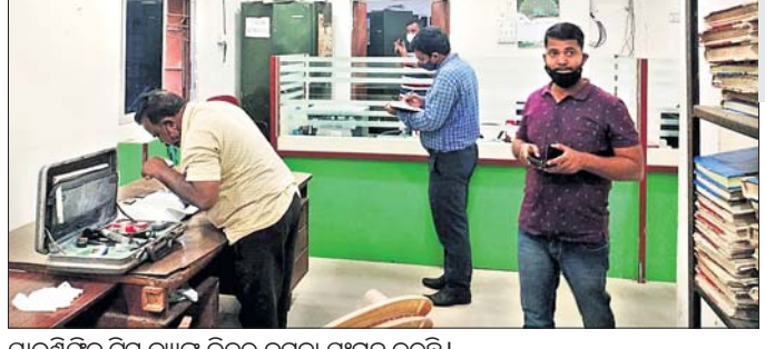
ବାଇଶିଏକ ଚିଠି ବ୍ୟାଙ୍କ ଭିତରୁ ନମୁନା ସାଗ୍ରହ କରୁଛି।