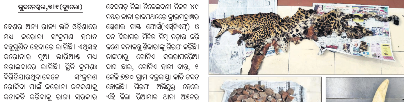
ଗାଳାଣରେଲେ ଧରିଲା ଏସ୍‌ଟିଏଫ୍, ଜଣେ ଗିରଫ

ଦେବଗଡ଼ ଜିଲ୍ଲା ଚିକେଇବଣୀ ନିକଟ ୪୯ ନମ୍ବର କାଟା ରାଜପଥରେ ଜାଲମତ୍ତାଞ୍ଚଳରେ ଶ୍ୱେତାଳ ବାଘ ଫୋର୍ସ (ଏସ୍‌ଟିଏଫ୍) ଓ ବନ ବିଭାଗର ମିଳିତ ଟିମ୍ ଚଢ଼ାଉ କରି ଜଣେ ବନ୍ୟଜନ୍ତୁ ଶିକାରୀଙ୍କୁ ଗିରଫ କରିଛି ।