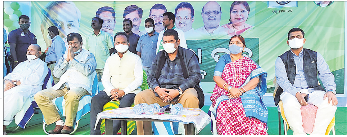
ମଞ୍ଚାସୀନ ବିଜେଡି ନେତୃବର୍ଗ।

ବାଲିଆପାଳ, ୭।୧ (ସ୍ୱ.ସ୍ୱ.): ବାଲିଆପାଳ ବ୍ଲକ ନୂଆଗାଁ ପଞ୍ଚାୟତ ମନୁମଣ୍ଡଳ ଡାକ୍ତରଖାନା ପରିସରରେ ଶୁକ୍ରବାର ବିଜେଡିର କର୍ମୀ ସମାବେଶ ଅନୁଷ୍ଠିତ ହୋଇଯାଇଛି।