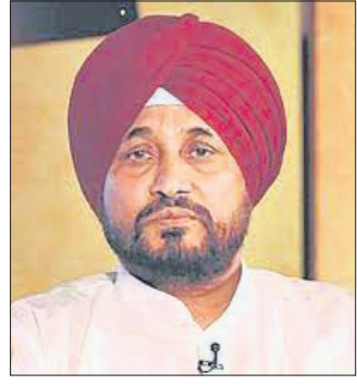
ଚନ୍ଦିଗଡ଼ର ସର୍ବୋଚ୍ଚ ମନ୍ତ୍ରୀ

ପ୍ରଧାନମନ୍ତ୍ରୀଙ୍କ ସୁରକ୍ଷାରେ ଗୁରୁତ୍ୱପୂର୍ଣ୍ଣ ଭାବରେ ପଞ୍ଜାବରେ ଗସ୍ତ କରିବାକୁ ସରକାରଙ୍କୁ ନିଷିଦ୍ଧ କରିବାକୁ ପଞ୍ଜାବୀ ଲୋକମାନଙ୍କୁ ଆହ୍ୱାନ ଦେଇଛନ୍ତି।