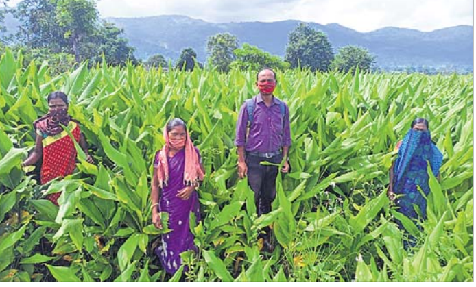
ସ୍ବାଭିମାନ ଅଞ୍ଚଳର ପଶ୍ଚାତପୁରରେ ହୋଇଥିବା ହଳଦୀ ଚାଷ

ମାଲକାନଗିରି,୮୧ (ଡି.ଏନ୍.ଏ.) ରଞ୍ଚିବେ ସେଥିପାଇଁ ଶୀତଳ ଭଣ୍ଡାର ସ୍ଥାପନ କରାଯିବ। ମିଶନ ଶକ୍ତି କରିଆରେ ମହିଳାଙ୍କୁ ଛୋଟ ଛୋଟ ମିଲ୍ ପ୍ରାଦାନ କରାଯାଇଛି। ଆଗାମୀ ଦିନରେ ୫ଟି ବଡ଼ ମୁହଁର ପ୍ରତିଷ୍ଠା କରାଯିବ। ହଳଦୀ ଚାଷ ପାଇଁ ଚାଷୀଙ୍କୁ ସ୍ବଚ୍ଚନ୍ଦ୍ର ହାଲଡିଓ ହଳଦୀ ମଞ୍ଜି ଯୋଗାଇ ଦିଆଯିବ। ସମସ୍ତ ଚାଷୀ ସେଇ ଯୋଜନାରେ ତାଲିମ ନେବେ। କନ୍ଧମାଳ ଅପେକ୍ଷା ମାଲକାନଗିରି ହଳଦୀ ଆହୁରି ଉନ୍ନତମାନର ହୋଇଥିବାରୁ ସ୍ବଚ୍ଚନ୍ଦ୍ର ପ୍ୟାକିଂ ୟୁନିଟ୍ ପ୍ରତିଷ୍ଠା ଉପରେ ଜିଲ୍ଲାପାଳ ସୁଦ୍ଧାରୋପ କାରିଥିଲେ। ହଳଦୀର ପ୍ରଚାରପ୍ରସାର ଇଞ୍ଚରନେଟ ମାଧ୍ୟମରେ କରାଯିବ। ଆମାଜନ କମ୍ପାନୀ ଦ୍ବାରା ବିକ୍ରି ବଜାରରେ ଏହାକୁ ବିକ୍ରି କରାଗଲେ ଚାଷୀ ଲାଭବାନ ହୋଇପାରିବେ ବୋଲି ଜିଲ୍ଲାପାଳ ପ୍ରକାଶ କରିଛନ୍ତି।