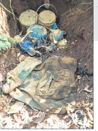
ନିଷ୍ପୃୟ କରାଯାଇଥିବା ବିଷୟରକ।

ମାଲକାନଗିରି ଜିଲ୍ଲା ସ୍ବାଭିମାନ ଅଞ୍ଚଳରେ ନବନିର୍ମୃତ ଦୂରବୀକ୍ଷଣ ଯନ୍ତ୍ର ବିକ୍ରୟ ଫାଇନାଲିସନ ସାଧନାମାନେ ମାଓବାଦୀଙ୍କ ଚାଲନା ନିର୍ମୃତ ୨ ଦୂରବୀକ୍ଷଣ ଯନ୍ତ୍ର ସହ ୫ ଆଇଇଡି ଶିବିର ଛବଚ କରିଛନ୍ତି। ଜଙ୍ଗଲରେ କେତେକ ମାଓବାଦୀ ସାମଗ୍ରୀ ଲୁଚାଇ ରଖାଯାଇଥିବା ନେଇ ଗୋଲନ୍ଦା ସୂଚନା ପାଇ ବିକ୍ରୟ ସାଧନାମାନେ ସର୍ବ ଅପରେଶନ ଆରମ୍ଭ କରିଥିଲେ। ଏହି ସମୟରେ ଆଜ୍ଞା ସାମାନ୍ତ କୋରିଭାଜି ଗ୍ରାମ ନିକଟ ଜଙ୍ଗଲରେ ମାଟି ତଳେ ପୋଡା ଯାଇଥିବା କେତେକ ମାଓବାଦୀ ସାମଗ୍ରୀ ଛବଚ କରାଯାଇଥିଲା। ଛବଚ ସାମଗ୍ରୀ