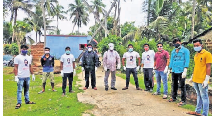
ସଦସ୍ୟମାନଙ୍କ ଦ୍ୱାରା ଗାଁ ସାମିଲକରଣ ।