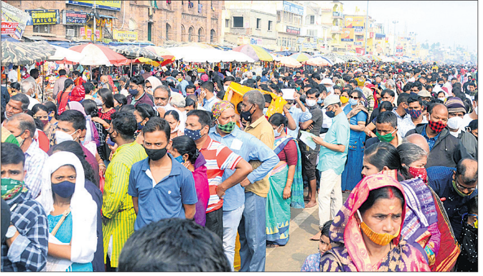
ରବିବାରଠାରୁ ଶ୍ରୀମନ୍ଦିରରେ ସର୍ବସାଧାରଣ ଦର୍ଶନ ବନ୍ଦ ରହୁଥିବାରୁ ଶନିବାର ପୁରୀ ବଡ଼ଦଣ୍ଡରେ ଶ୍ରୀକାଳୀଙ୍କୁ ଅର୍ପଣା କରାଯାଇଛି।