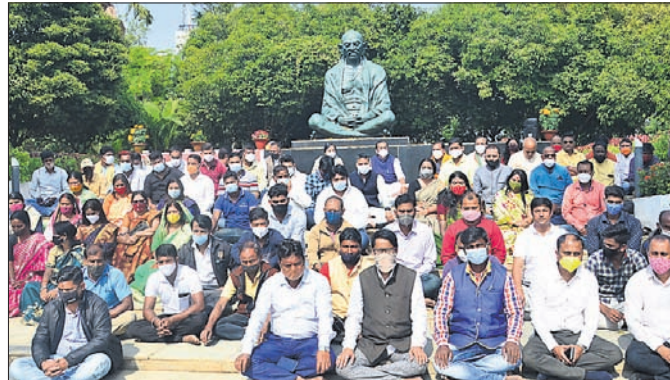
କଂଗ୍ରେସର ଜନତା ମଜଦାନସ୍ଥିତ ଗାନ୍ଧି ପ୍ରତିମୂର୍ତ୍ତି ତଳେ ଭାଜପା ପକ୍ଷରୁ ଧାରଣା।