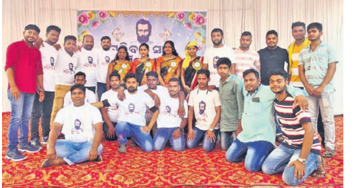
ଗରିବର ସାଥୀ ଅନୁଷ୍ଠାନର ସଦସ୍ୟମାନେ ।