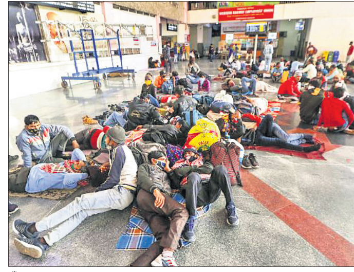
ଗାଁକୁ ପଳାଇନ କରୁଥିବା ଶ୍ରମିକମାନେ ରବିବାର ଅହମଦାବାଦ ରେଳ ଷ୍ଟେଶନରେ ଆଶ୍ରୟ ନେଇଛନ୍ତି।

ଛଳଚଳ ଆଖି, ଅବଶ ପାଦ। ଲକ୍ଷ୍ମୀନାଥ ଜାରି ହେଲେ ଜୀବିକା ହରାଇବାର ଭୟ। କେବଳ ଜୀବିକା ନୁହେଁ, ସଂକ୍ରମିତ ହୋଇ ଜୀବନ ଯିବାର ଆଶଙ୍କା ବି କ୍ରମଶଃ ଦୃଢ଼ୀଭୂତ ହେବାରେ ଲାଗିଛି। ଏଥିଲାଗି ଜାତୀୟ ରାଜଧାନୀ ଦିଲ୍ଲୀ ଓ ଆର୍ଥିକ ରାଜଧାନୀ ମୁମ୍ବାଇ ସମେତ ବହୁ ସହରଗୁଡ଼ିକର ଷ୍ଟେଶନରେ ଲାଗିଛି ପ୍ରବାସୀ ଶ୍ରମିକଙ୍କ ଭିଡ଼। ସେମାନେ ଯେମିତି ବି ହେଉ ଗାଁକୁ ଫେରିଯିବାକୁ ବ୍ୟାକୁଳ। ନୂଆ ଭାରିଆଣ୍ଟ ଓମିକ୍ରନ୍ ଏବେ ଆଜି ଖବର ବିକଳ ଚିତ୍ର। ମହାନାଗର ଲେଉଟାଣି ସହ ତୃତୀୟ ଲହର ଆଶଙ୍କା ଯୋଗୁ ବିଭିନ୍ନ ରାଜ୍ୟରେ କଟକଣା ଲାଗୁ ହେବା ପରେ ପୁଣି ଦେଖିବାକୁ ମିଳିଲାଣି ଦେହବର୍ଷ ଚଳଇ ସେହି ଦୃଶ୍ୟ।