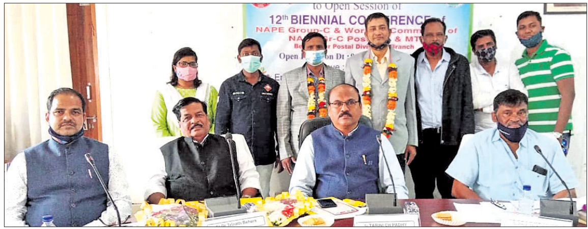
ସମ୍ମିଳନୀରେ ଉପସ୍ଥିତ ଅତିଥି ।