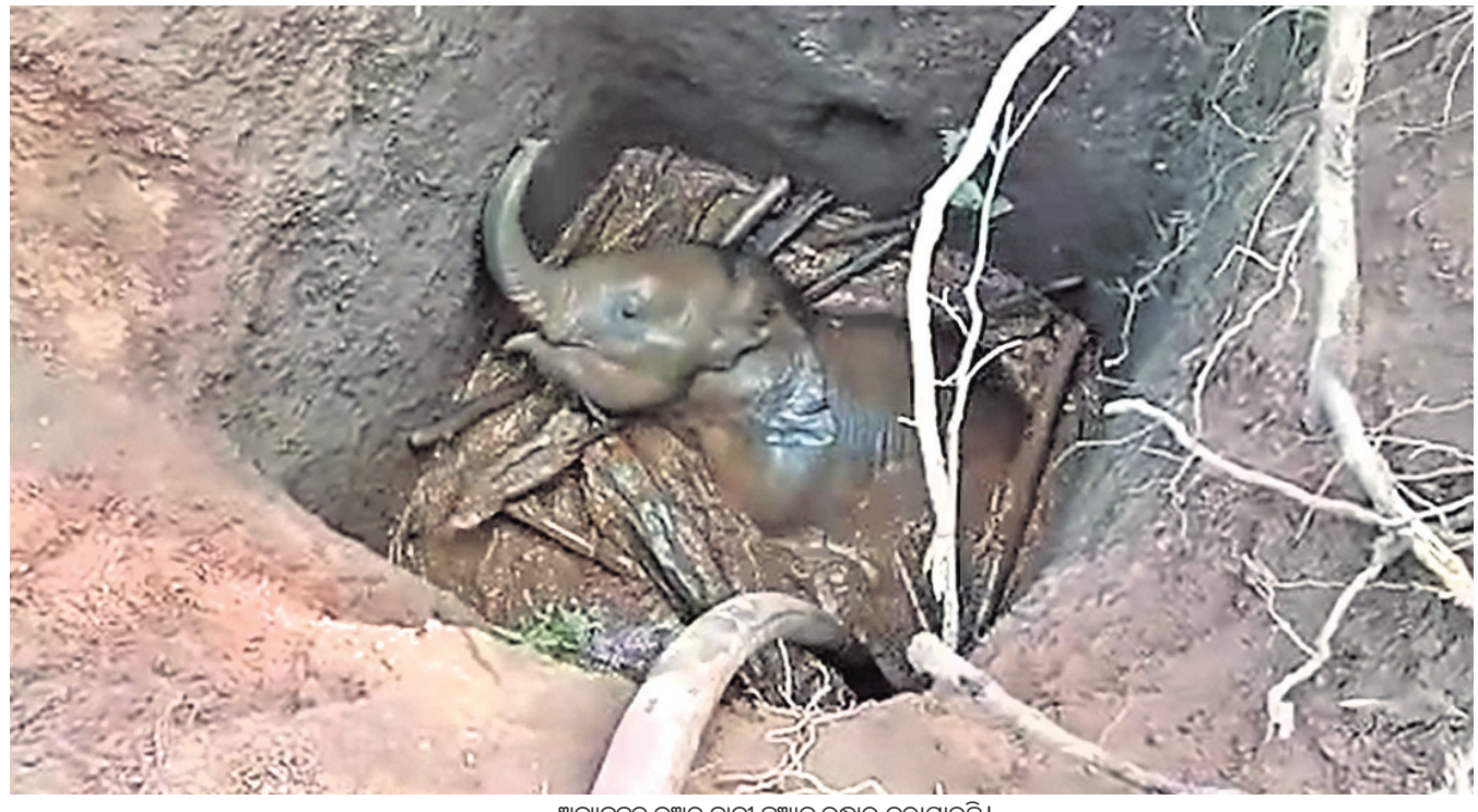
ଅବ୍ୟବହୃତ କୂଅରୁ ହାତୀ ଛୁଆକୁ ଉଦ୍ଧାର କରାଯାଇଛି।

ଆରବିଆଇର ପୂର୍ବତନ ଗଭର୍ନର ଉର୍ଜିତ ପଟେଲଙ୍କୁ ଏସିଆନ୍ ଇନ୍‌ସ୍ପେକ୍ଟର ଇନ୍‌ଭେଷ୍ଟମେଣ୍ଟ ବ୍ୟାଙ୍କ ଏଆଇଆଇବି ଭାଇସ୍-ପ୍ରେସିଡେଣ୍ଟ ନିଯୁକ୍ତ କରାଯାଇଛି।