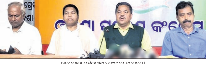
ଖବରଦାତା ସମ୍ମିଳନୀରେ କଂଗ୍ରେସ ନେତୃତ୍ୱ ।