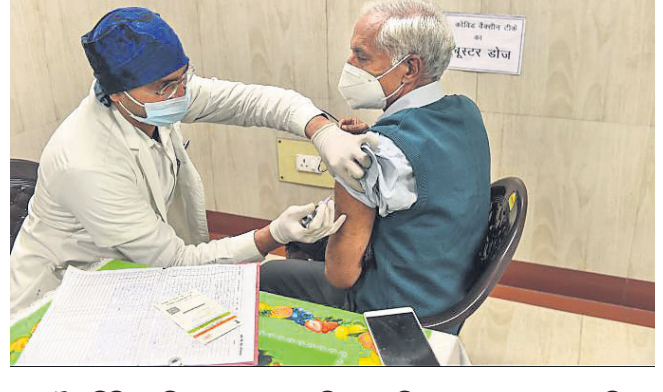
ଲକ୍ଷ୍ନୌର ସିକ୍ସ ହସ୍ପିଟାଲରେ ଜଣେ ବରିଷ୍ଠ ନାଗରିକ ବୁଝାଇ ଦେବା ନେଉଛନ୍ତି।

କେତେକ ରାଜ୍ୟରେ ଏହା ଡେଲ୍ଟା ସ୍ଥାନ ନେଇଯାଇଛି। ଡେଲ୍ଟା ସଂକ୍ରମଣର ସମ୍ପର୍କରେ ଜାଣିବାକୁ ପଡ଼ିଛି।