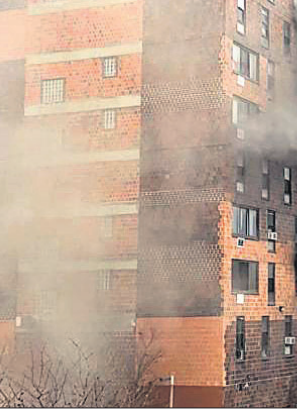
ଲୁୟିସିଆର ସିରିଭୁର ଆପାର୍ଟମେଣ୍ଟରେ ନିଆଁ

ଲୁୟିସିଆର ସିରିଭୁର ଏକ ଆପାର୍ଟମେଣ୍ଟରେ ୯ ପିଲାଙ୍କ ସମେତ ୧୯ ଜଣଙ୍କ ମୃତ୍ୟୁ ଘଟିଛି।