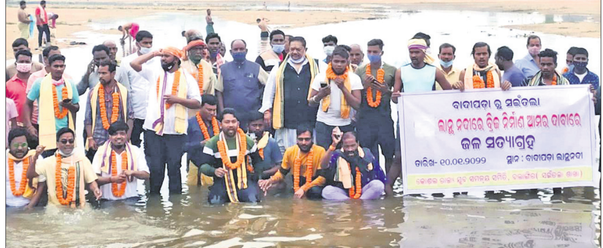
କୋଶଳ ରାଜ୍ୟ ସମନ୍ୱୟ ସମିତି ଆନୁକୁଲ୍ୟରେ କରାଯାଇଥିବା ଜଳ ସତ୍ୟାଗ୍ରହ ।