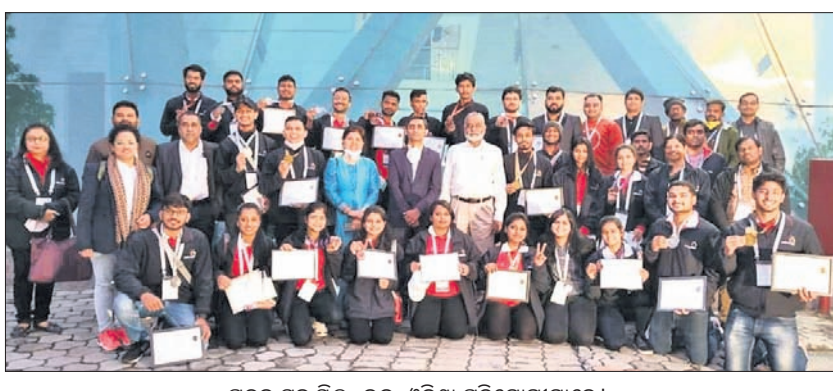
ପଦକ ସହ ସିଲ୍-ଇନ୍-ଓଡ଼ିଶା ପ୍ରତିଯୋଗୀମାନେ।

ଭୁବନେଶ୍ୱର, ୧୦୧୧ (ସ୍ୱାଭାବ): ଦକ୍ଷତା ବିକାଶ କ୍ଷେତ୍ରରେ ଓଡ଼ିଶା ଏକ ଅଗ୍ରଣୀ ରାଜ୍ୟ ହୋଇପାରିଛି। ନୂଆଦିଲ୍ଲୀରେ ଚାଳକଚାରୀ ଇନ୍‌ଡୋର ଷ୍ଟାଡିୟମରେ ଆୟୋଜିତ ଇଣ୍ଡିଆ ସିଲ୍ ୨୦୨୧ ପ୍ରତିଯୋଗିତାରେ ସର୍ବାଧିକ ପଦକ ଲାଭ କରିଥିବା ଓଡ଼ିଶା ପ୍ରତିଯୋଗୀ ରାଜ୍ୟ ପାଇଁ ଗୌରବ ଆଣିଛନ୍ତି।