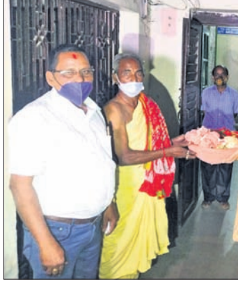
ରଥକାଠ ପାଇଁ ଆଖିମାଳକୁ ନୟାଗଡ଼ ଡିପ୍ୟୁଟି ସ୍ୱାଗତ କରୁଛନ୍ତି।

ଓସାର ୪ ପୁଟର ୬ ଖଣ୍ଡ ଧଉରା, ୧୪ ପୁଟ ଓସାର ୫ପୁଟ ଲମ୍ବର ଫାଦି, ଶିମିଳି କାଠ ୧୪ ପୁଟ ଲମ୍ବ ୬ ପୁଟ ଓସାରର ୩ ଖଣ୍ଡ ଦିଆଯିବାକୁ ଚିହ୍ନଟ ହୋଇଛି। ଏ ନେଇ ମଙ୍ଗଳବାର ପୂର୍ବାହ୍ନରେ ବଣପଲ୍ଲୀ ପୁରାତନ ଗଡ଼ଜାତ ରାଜ୍ୟର ଗଣିଆ ନିକଟବର୍ତ୍ତୀ ମହାନଦୀ ଅବବାହିକାର ବତମୁକ୍ତ ଗ୍ରାମ ଦେବୀ ମା' ବଡ଼ରାଉଳକ ପାଠରେ ବିଧି ଅନୁଯାୟୀ ପୂଜାର୍ଚ୍ଚନା କରାଯିବାକୁ ନୀତି ନିର୍ଦ୍ଧାରିତ ହୋଇଛି।