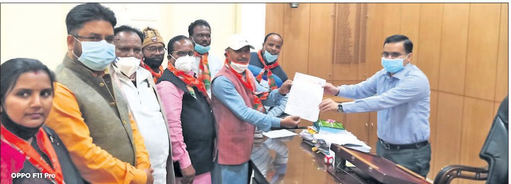
ଓଡ଼ିସି ମୋର୍ଚ୍ଚା ପକ୍ଷରୁ ରାଜ୍ୟପାଳଙ୍କ ଉଦ୍ଦେଶ୍ୟରେ ଜିଲ୍ଲାପାଳଙ୍କୁ ଦାବିପତ୍ର ଦିଆଯାଇଛି।