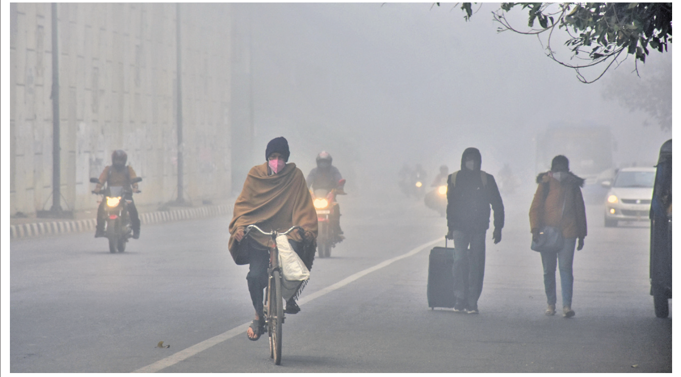
ଭୁବନେଶ୍ୱରରେ ସୋମବାର ସକାଳେ ଘନ ଛୁହୁଡ଼ି ମଧ୍ୟରେ ଲୋକେ ଯା'ଆସ କରୁଛନ୍ତି।

ଓଭର ଉପରେ ପ୍ରଧାନମନ୍ତ୍ରୀଙ୍କ ଗାଡ଼ି ୨୦ ମିନିଟ୍ ଅଟକିବା ପରେ ସେ କାର୍ଯ୍ୟକ୍ରମରେ ଯୋଗଦେଇ ନ ପାରି ଫେରିଯାଇଥିଲେ। ଭବିଷ୍ୟତରେ ଯେପରି ଏଭଳି ଘଟଣାର ପୁନରାବୃତ୍ତି ନ ହୁଏ, ସେଥିପାଇଁ ସୁରକ୍ଷାରେ ତୁଟି ଘଟଣାର ପୂର୍ଣ୍ଣାବଳୀ ତଦନ୍ତ ଲାଗି ଲକ୍ଷ୍ୟ ଭିତ୍ତିକ ନାମକ ସଂଗଠନ ପକ୍ଷରୁ ସୁପ୍ରିମକୋର୍ଟରେ ପିଟିଗନ ଦାଏର କରାଯାଇଥିଲା। ପଞ୍ଜାବ ସରକାରଙ୍କ ପକ୍ଷରୁ ମଧ୍ୟ ନିରପେକ୍ଷ ତଦନ୍ତ ଲାଗି ଅନୁରୋଧ କରାଯାଇଛି। ସୁପ୍ରିମକୋର୍ଟକି ନିର୍ଦ୍ଦେଶକ୍ରମେ ପ୍ରଧାନମନ୍ତ୍ରୀଙ୍କ ସୁରକ୍ଷା ସମ୍ପର୍କିତ ସମସ୍ତ ରେକର୍ଡ୍ ହାଇକୋର୍ଟର ରେଜିଷ୍ଟ୍ରାର ଜେନେରାଲଙ୍କ ହସ୍ତଗତ ହୋଇଥିବା ପଞ୍ଜାବ ସରକାରଙ୍କ ପକ୍ଷରୁ ଆଡଭୋକେଟ ଜେନେରାଲ ଡି.ଏ.ଏ. ପଟ୍ଟାଲିଆ ଖଣ୍ଡପାଠକୁ କହିଥିଲେ। କେନ୍ଦ୍ରୀୟ ସଂସ୍ଥା ହୋଇଥିବାରୁ ଏବଂ ଏହା ପଛରେ ରାଜନୀତି ଥିବାରୁ ଉପଯୁକ୍ତ ଶୁଣାଣି ହେବା ଉପରେ ପଟ୍ଟାଲିଆ