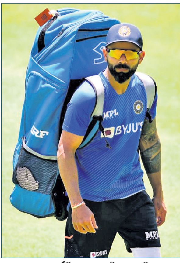
ଅଭ୍ୟାସ ପାଇଁ ଯିବା ଅବସରରେ ବିରାଟ କୋହଲି।

ଭାରତ ଓ ଘରୋଇ ଦକ୍ଷିଣ ଆଫ୍ରିକା ମଧ୍ୟରେ ମଙ୍ଗଳବାରଠାରୁ ତୃତୀୟ ତଥା ଅନ୍ତିମ ଚେଷ୍ଟା ମ୍ୟାଚ ଆରମ୍ଭ ହେବ। ଗ୍ଲାନାୟ ନ୍ୟୁଜିଲାଣ୍ଡ ଷ୍ଟାଡ଼ିୟମରେ ଖେଳାଯିବାକୁ ଥିବା ଏହି ନିର୍ଣ୍ଣାୟକ ମ୍ୟାଚ ଉପରେ ସିରିଜର ଫଳାଫଳ ନିର୍ଭର କରୁଛି। ପିଠି ଯନ୍ତ୍ରଣା କାରଣରୁ ତୃତୀୟ ମ୍ୟାଚ ଖେଳି ନ ଥିବା ଅଧିନାୟକ ବିରାଟ କୋହଲି ଏହି ଚେଷ୍ଟାରେ ପ୍ରତ୍ୟାବର୍ତ୍ତନ କରିବେ। ମ୍ୟାଚକୁ ଅତିକ୍ରମରେ ଡ୍ର ରଖିପାରିଲେ କିମ୍ବା ବଜୟା ହେଲେ ଭାରତ ସିରିଜ ଜିତିବ। ଏହି ଚେଷ୍ଟାରେ ପରାସ୍ତ ହେଲେ ମଧ୍ୟ ଭାରତ ସିରିଜ ପରାଜୟ ବରଣ କରିବ ନାହିଁ। ତେବେ ଏହି ମ୍ୟାଚ ଜିତି ଦକ୍ଷିଣ ଆଫ୍ରିକା ସିରିଜ ଅନାମୀତ ରଖିବାକୁ ପ୍ରୟାସ କରିବ। କୋହଲି କ୍ୟାପ୍ଟେନ୍‌ସିପ୍ ଲାଭ କରିବେ ତେବେ ପ୍ରଥମ ଜନ୍ମଦିନ ମଧ୍ୟ ଏହି ମ୍ୟାଚ ଅବସରରେ ପଡ଼ିବ। ଚେଷ୍ଟା ନିଜର ସ୍ଵତନ୍ତ୍ର ମାଧ୍ୟମରେ ଏହି ମ୍ୟାଚକୁ ସ୍ଵତନ୍ତ୍ର ଭାବେ ଗୁରୁତ୍ଵ ଦେବେ ବୋଲି ଆଶା କରାଯାଉଛି। ଭାରତ ସଫଳ ହେଲେ ୩ ଦଶନ୍ଧିରେ ପ୍ରଥମଥର ପାଇଁ ଦକ୍ଷିଣ ଆଫ୍ରିକାରେ ସିରିଜ ଜିତି ଇତିହାସ ସୃଷ୍ଟି କରିବ ଓ ଚାପରେ ଥିବା କୋହଲିଙ୍କ ପାଇଁ ବିଶେଷ ଭାବେ ମହତ୍ତ୍ଵ ରଖିବ। ତେବେ ଏଥିପାଇଁ ଭାରତକୁ ବ୍ୟାଟିଂରେ ସୁଧାର ଆଣିବାକୁ ହେବ। ପ୍ରଥମ ଇନିଂସରେ ଭାରତ ଯଦି ୩୦୦ରୁ ଉର୍ଦ୍ଧ୍ଵ ରନ ସଂଗ୍ରହ କରିବ ତାହେଲେ ଅଧିକାଂଶ ସମ୍ଭାବନାରେ ଭାରତ ସିରିଜ ଜିତିବ।