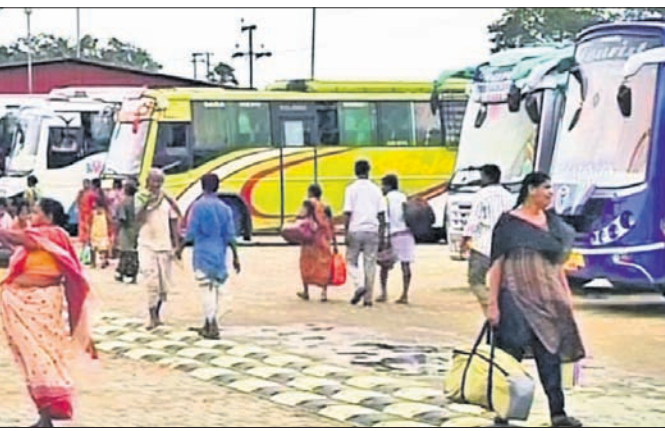
ବାଲେଶ୍ୱର ବସ୍ଷ୍ଟାଣ୍ଡ। ସଂଘକୁ ଲିଖିତ ଜଣାଇଥିଲେ। ଗତ ୮ତାରିଖ ଡିସେମ୍ବର ୨୭ରେ ବାଲେଶ୍ୱର ବସ୍ଷ୍ଟାଣ୍ଡ ପରିସରରେ ଭଉଁସ ସଂଘକୁ ନେଇ ଏକ ବୈଠକ ବସିଥିଲା। ଏହାକୁ ଠିକ୍ କାର୍ଯ୍ୟକାରୀ କରିବା ପାଇଁ ବାଲେଶ୍ୱର ସଂଘ ଜାନୁୟାରୀ ୧ ତାରିଖ ପର୍ଯ୍ୟନ୍ତ

ବାଲେଶ୍ୱର ଅଫିସ, ୧୦୧୧ ବାଲେଶ୍ୱର ଓ ବାରିପଦା ବସ୍ ମାଲିକ ସଂଘ ମଧ୍ୟରେ ଚିତ୍କଟା ଯୋଗୁ ଗତ ୮ତାରିଖରୁ ବସ୍ ଚଳାଚଳ ବନ୍ଦ ଥିଲା। ସୋମବାର ଭଉଁସ ଆରତିଓ, ବସ୍ ମାଲିକ ସଂଘ, ପୋଲିସ ନିଜିତ ଭାବେ ଆଲୋଚନା କରି ସମସ୍ୟାର ସମାଧାନ କରିବା ପରେ ବସ୍ ଚଳାଚଳ ସ୍ୱାଭାବିକ ହୋଇଛି। ବାରିପଦାକୁ ଭାୟା ଉଦଳା ଦେଇ ବାଲେଶ୍ୱର ଆସୁଥିବା ଓମ୍ ମୋଟର୍ସକୁ ବାଲେଶ୍ୱର ବସ୍ଷ୍ଟାଣ୍ଡକୁ ଛାଡ଼ିବା ପାଇଁ ଅପରାହ୍ନ ୧ଟା ୧୨ମିନିଟ୍ ସରକାରୀ ସମୟ ଧାର୍ଯ୍ୟ ହୋଇଥିବା ବେଳେ ବାଲେଶ୍ୱର ସଂଘ ୨ଟା ୧୦ମିନିଟ୍ ସମୟ ଦେଇଥିଲା। ବେଳେ ବେଳେ ପୁଣି ତାକୁ ଆହୁରି ୨୦ମିନିଟ୍ ବିଳମ୍ବରେ ଛାଡ଼ାଯାଏ। ଏ ସମ୍ପର୍କରେ ବାରିପଦା ବସ୍ ମାଲିକ ସଂଘ ପକ୍ଷରୁ ଭଉଁସ ବାଲେଶ୍ୱର, ବାରିପଦା ଆରତିଓ, ବାଲେଶ୍ୱର