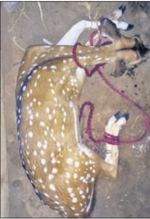
ଉଦ୍ଧାର ହୋଇଥିବା ହରିଣ। ଅଭୟାରଣ୍ୟ ମଧ୍ୟରେ ପଶି ବନ୍ୟଜନ୍ତୁ ଶିକାର କରୁଛନ୍ତି। ଫଳରେ ଜୀବନ ବଞ୍ଚାଇବାକୁ ଯାଇ ବନ୍ୟଜନ୍ତୁମାନେ ଗାଁ ଓ ସହର ମୁହାଁ ହେଉଛନ୍ତି। ବିଭାଗ ପକ୍ଷରୁ ଏଥିପ୍ରତି ଆବଶ୍ୟକ ହାତ୍ତି ଦେଇଛନ୍ତି। ବିଭାଗ ପକ୍ଷରୁ କଡ଼ାକଡ଼ି ପାଟ୍ରୋଲିଂ କରାଯାଉ ନ ଥିବାରୁ ଦିନ ବେଳେ ମଧ୍ୟ ଶିକାରୀମାନେ ଶିମିଳିପାଳ