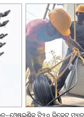
ଫେବୃୟାରୀରେ ଭାରତ-ଫ୍ରେଣ୍ଡ୍‌ଶିପ୍ ଟି-୨୦ କ୍ରିକେଟ ମ୍ୟାଚକୁ ଦୃଷ୍ଟିରେ ରଖି କଟକର ବାରବାଟୀ ସ୍ଵାତିୟରେ ସୋମବାର ଏକଇଡି ପୁରଲାଇଟ୍ ଲାଗାଯାଇଛି।