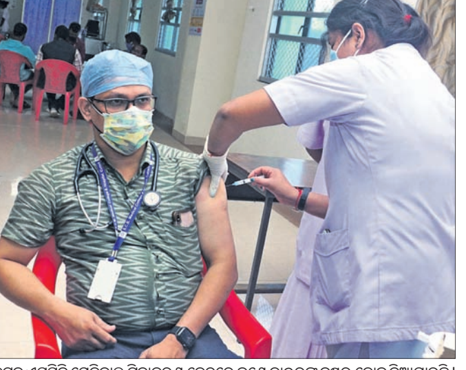
କଟକ ଏସ୍‌ସି ମେଡିକାଲ ଚିକାକରଣ କେନ୍ଦ୍ରରେ ଜଣେ ଡାକ୍ତରଙ୍କୁ ବୁଝୁର ଡୋକ୍ ବିଆଯାଇଛି।