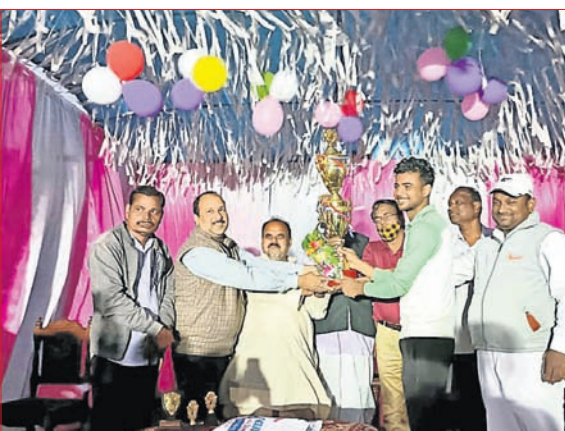
ଖୋର୍ଦ୍ଧା: ବୋଲଗଡ଼ ବୁକ୍ ସଂଗ୍ରହ ଗ୍ରାମସ୍ଥିତ ଖେଳପରିଆରେ ଅନୁଷ୍ଠିତ ଲକ୍ଷ୍ମୀଧର ସ୍ମାରଣା ନିକେତ ଚୂର୍ଣ୍ଣମେଘ ଉଦ୍‌ଘାଟନା ଉତ୍ସବରେ ମଙ୍ଗଳବାର ଅତିଥିକଠାରୁ ଚାମିନ୍ଦର ଦଳ ତ୍ରୁପ୍ତି ପ୍ରଦାନ କରୁଛି।