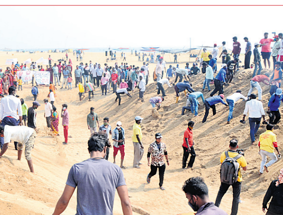
ପୁରୀ ବେଳାଭୂମିରେ କୁପ୍ପାର୍ ବିରୋଧ କରି ବେଳାଭୂମିର ସ୍ଥଳ ବ୍ୟବସାୟୀମାନେ ପ୍ରଶାସନ ଦ୍ୱାରା ଖୋଜାଯାଇଥିବା ବାଲିକୁ ମଙ୍ଗଳବାର ଯୋଗୁଛନ୍ତି।

ଧାରଣାରେ ବସିଛନ୍ତି। ହେଲେ ପ୍ରଶାସନ ଦାବି ଶୁଣିଲା ନାହିଁ। ତେବେ ବର୍ତ୍ତମାନ ନିର୍ବାଚନ ଆଚରଣ ବିଧି ଲାଗୁ ହେବା କାରଣରୁ ପ୍ରଶାସନ ପକ୍ଷରୁ କୌଣସି କାର୍ଯ୍ୟ କରାଯାଇପାରିବ ନାହିଁ। ତେଣୁ ଆୟୋଜନକୁ କିଛି ଦିନ ପାଇଁ ବ୍ୟବସାୟୀ ସଂଘ ସ୍ଥଗିତ କରିଛି। ଯଦି ନିର୍ବାଣ କାର୍ଯ୍ୟ ଆରମ୍ଭ ପୁଣି ଆୟୋଜନ ଜାରି ରହିବ ବୋଲି ପକ୍ଷନାୟକ କହିଛନ୍ତି। ମହାସଂଘ ପକ୍ଷରୁ ନିର୍ବାଣ ପାଇଁ ଖୋଜାଯାଇଥିବା ବାଲିକୁ ଯୋଗି ଦେଇ ଆୟୋଜନକୁ ସ୍ଥଗିତ ରଖିଛି।