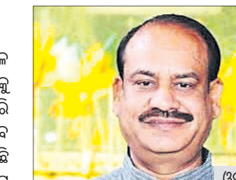
ଓମ୍ ବିଲ୍ଲା ସ୍ୱାସ୍ଥ୍ୟ ସୁରକ୍ଷା ସମ୍ପର୍କିତ ସ୍ଥିତି ଯାଞ୍ଚ କରିଥିଲେ। ଏମ୍ପି, ଅଧିକାରୀ ଓ ଅନ୍ୟ କର୍ମଚାରୀମାନଙ୍କ

ନିମ୍ନ ପରୀକ୍ଷା ଲାଗି କରାଯାଇଥିବା ବ୍ୟବସ୍ଥା ଉପରେ ସେ ଅନୁଧ୍ୟାନ କରିଥିଲେ। ୬୦ ବର୍ଷରୁ ଊର୍ଦ୍ଧ୍ୱ ବୟସ୍କ ଏମ୍ପିମାନଙ୍କ ସ୍ୱଚ୍ଛତା ଯତ୍ନ ପାଇଁ ଅଧିକାରୀମାନଙ୍କୁ ନିର୍ଦ୍ଦେଶ ଦେଇଥିବା ବିଲ୍ଲା କହିଛନ୍ତି। ପାର୍ଲିମେଣ୍ଟ ସ୍ତରରୁ ଜଣାପଡ଼ିଛି ଯେ, ଗତ ୪୭୮ ତାରିଖ ମଧ୍ୟରେ ରାଜ୍ୟ ସଭା ସେକ୍ରେଟାରିଏଟ୍‌ରେ ୬୫୦ ଏବଂ ଆନୁଷ୍ଠାନିକ ବିଭାଗଗୁଡ଼ିକର ୧୩୩ ଜଣ କୋଭିଡ୍ ପଜିଟିଭ୍ ରିକ୍ଟ ହୋଇଛନ୍ତି।