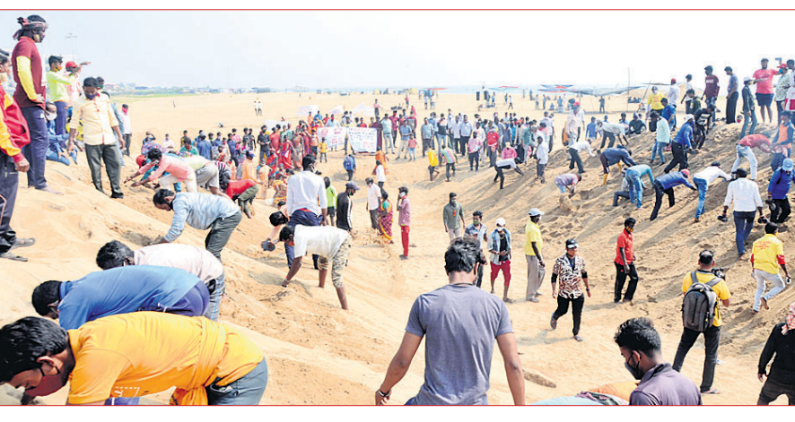
ପୁରୀ ବେଳାଭୂମିରେ ବୁ ପ୍ଲାନ ବିରୁଦ୍ଧ ବିରୋଧ କରି ବେଳାଭୂମିର କ୍ଷୁଦ୍ର ବ୍ୟବସାୟୀମାନେ ପ୍ରଶାସନ ଦ୍ୱାରା ଖୋଲାଯାଇଥିବା ଜାଗାକୁ ମଙ୍ଗଳବାର ଯୋଡ଼ୁଛନ୍ତି।