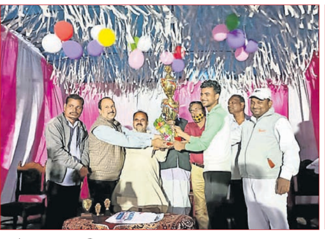
ଖୋର୍ଦ୍ଧା: ବୋଇରତ ବୁକ୍ ସଂଗ୍ରହ ଗ୍ରାମସ୍ଥିତ ଖେଳପରିଆରେ ଅନୁଷ୍ଠିତ ଲକ୍ଷ୍ମୀଧର ସ୍ମାରକ କ୍ରିକେଟ୍ ଟୁର୍ନାମେଣ୍ଟ ଉଦ୍‌ଘାଟନା ଉତ୍ସବରେ ମଙ୍ଗଳବାର ଅତିଥିଙ୍କଠାରୁ ଚାମ୍ପିୟନ ଦଳ ତ୍ରୁପ୍ତି ଗ୍ରହଣ କରୁଛି।