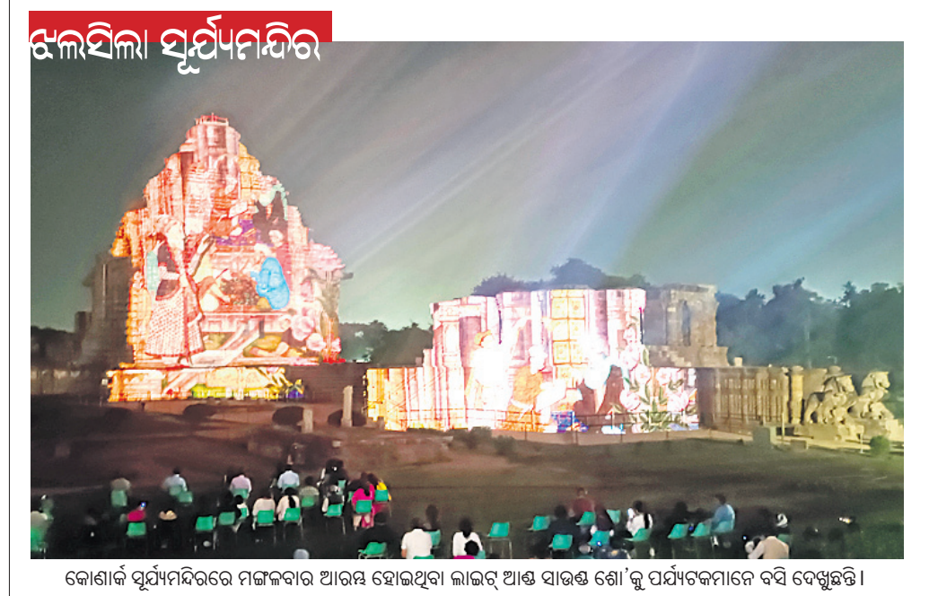
କୋଣାର୍କ ସୂର୍ଯ୍ୟମନ୍ଦିରରେ ମଙ୍ଗଳବାର ଆରମ୍ଭ ହୋଇଥିବା ଲାଇଟ୍ ଆଣ୍ଡ୍ ସାଉଣ୍ଡ୍ ଶୋ 'କୁ ପର୍ଯ୍ୟଟକମାନେ ବସି ଦେଖୁଛନ୍ତି।