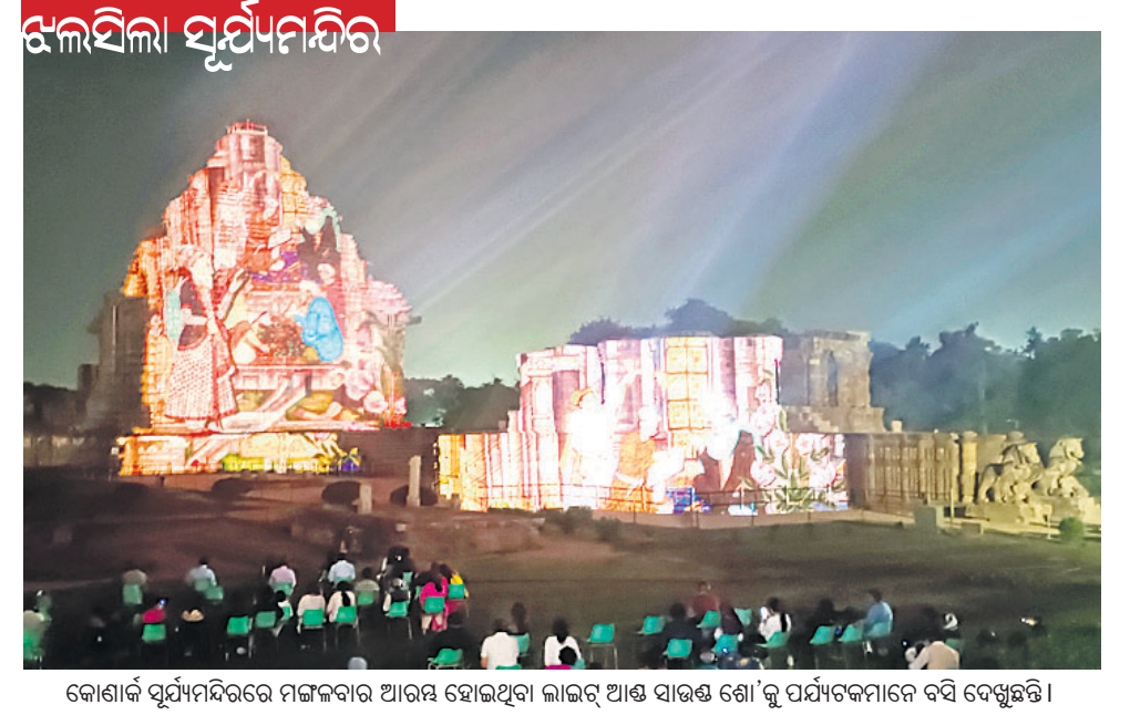
କୋଶାଙ୍ଗି ସୂର୍ଯ୍ୟମନ୍ଦିରରେ ମଙ୍ଗଳବାର ଆରମ୍ଭ ହୋଇଥିବା ଲାଇଟ୍ ଆଣ୍ଡ୍ ସାଉଣ୍ଡ୍ ଶୋ 'କୁ ପର୍ଯ୍ୟଟକମାନେ ବସି ଦେଖୁଛନ୍ତି।

କରାଦ୍ୱିହସ୍ତରୁ ଜିଲା ଡିକିଆ ଅଞ୍ଚଳରେ ଗଣତାନ୍ତ୍ରିକ ଉପାୟରେ ଆନ୍ଦୋଳନ କରୁଥିବା ଲୋକଙ୍କ ଉପରେ ଯୋଲିସର ବନମ ପ୍ରତିବାଦରେ ମଙ୍ଗଳବାର ବିଭିନ୍ନ ନାଗରିକ ଅନୁଷ୍ଠାନ ପକ୍ଷରୁ ଡିକିଆକୁ ସ୍ମାରକପତ୍ର ଦିଆଯାଇଛି। ସେଥିରେ ଉଲ୍ଲେଖ କରାଯାଇଛି, ସରକାର କର୍ପୋରେଟ୍ ସଂସ୍ଥାକୁ ଚାଷଜମି, ଖଣି, ପାଣି ଓ ଜଙ୍ଗଲ ବିନା ମୂଲ୍ୟରେ ଦେଉଛନ୍ତି। ଡିକିଆ ଅଞ୍ଚଳର ବହୁ ଲୋକଙ୍କ ନାଁରେ ମିଥ୍ୟା ମକଦ୍ଦମା ରୁଜୁ କରାଯାଇ ବିଭିନ୍ନ ନିର୍ଯାତନା ଦିଆଯାଇଛି। ସରକାର ଯୋଲିସ ଦ୍ୱାରା ସେଠାକାର ଚାଷ ଓ ଲୋକଙ୍କଠାରୁ ଜମି ଛତାଇ ଏକ କମ୍ପାନୀକୁ ଦେବାକୁ ଉଦ୍ୟମ କରୁଛନ୍ତି। ଡିକିଆ ଅଞ୍ଚଳବାସୀ ନିଜର ଜୀବନକାବିକା ଓ ଭିତ୍ତିମୂଳିକ ସୁରକ୍ଷା ପାଇଁ ଆନ୍ଦୋଳନ ଜାରି ରଖିଛନ୍ତି। ହେଲେ ଯୋଲିସ ସେମାନଙ୍କୁ ନିର୍ଯାତନା ଦେଉଛି। ସେଠାରେ ଗଣତାନ୍ତ୍ରିକ, ସାମ୍ବାଦିକ, ମାନବିକ ଅଧିକାରରେ ଖୋଲାଖୋଲି ଉଲ୍ଲଙ୍ଘନ କରାଯାଉଛି। ତେଣୁ ଯୋଲିସ ଏପରି ଅଗଣତାନ୍ତ୍ରିକ କାର୍ଯ୍ୟରୁ ନିବୃତ୍ତ ରହିବାକୁ ଉକ୍ତ ସ୍ମାରକ ପତ୍ରରେ ଉଲ୍ଲେଖ କରାଯାଇଛି।