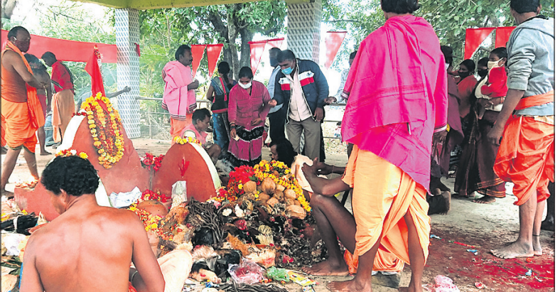
ଖଇରଗୁରାସ୍ଥିତ ବଡ଼ଖଳାରେ ଶୁଲିଆଙ୍କ ପୂଜାର୍ଚ୍ଚନା କରାଯାଉଛି।