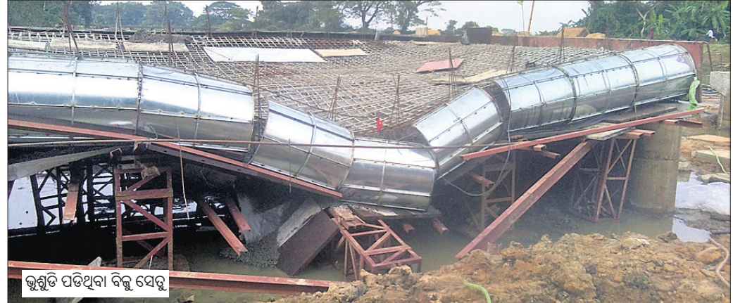
ଭୁଣ୍ଡି ପଡିଥିବା ବିଜୁ ସେତୁ