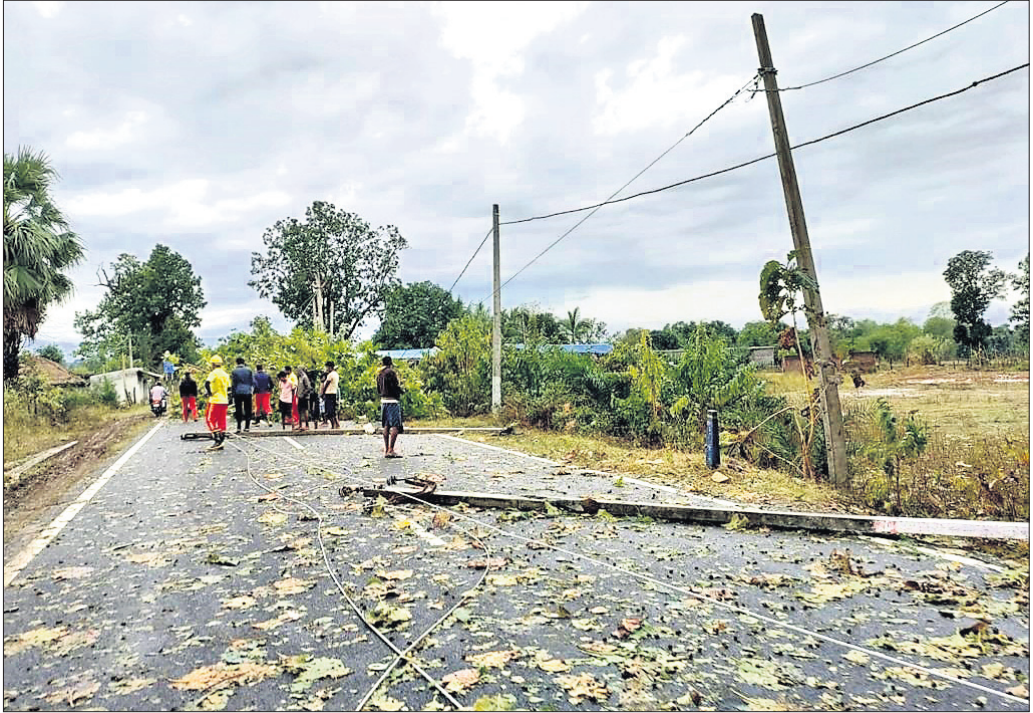
ଅନୁଗୋଳ ଜିଲ୍ଲା ଆଠମଲିକ ଉପଖଣ୍ଡରେ ମଙ୍ଗଳବାର ଅପରାହ୍ନରେ ଝଡ଼ତୋଫାନ ଯୋଗୁ ୬୨ ନମ୍ବର ରାଜ୍ୟ ରାଜପଥର ଯତୁପୁରଠାରେ ଗଛ ଓ ଲକ୍ଷେକ୍ଷ ଖୁଣ୍ଟ ପଡ଼ି ରାସ୍ତା ଅବରୋଧ ହୋଇଛି ।

କୋଟି ଟଙ୍କାର ରାଜସ୍ୱ ଲୁଟ ହୋଇଛି । ବିଜ୍ଞାନ ବିଭାଗ ବାଲି ଖାଦାନ ଏବଂ ବେଆଇନ ବାଲି ଉଠାଣ କେବଳ ରାଜ୍ୟର ରାଜସ୍ୱ କ୍ଷତି କରୁନାହିଁ ବରଂ ନଦୀର ପ୍ରାକୃତିକ ସମତୁଳ୍ୟ ପ୍ରକ୍ରିୟାକୁ ବ୍ୟାହତ କରୁଛି । ଏହାଦ୍ୱାରା ନଦୀକୂଳ ଗ୍ରାମବାସୀଙ୍କ ଜୀବନଚର୍ଯ୍ୟା ଉପରେ ନକାରାତ୍ମକ ପ୍ରଭାବ ପକାଉଛି । ନଦୀ ତଟବର୍ତ୍ତୀ ନଦୀବନ୍ଧ ବନ୍ଧୁକ ଭାବେ କ୍ଷତି ହେବା ସହିତ କ୍ରମଶଃ ଘୁର୍ବନ ହେବାରେ ଲାଗିଛି । ନଦୀ ତଟବର୍ତ୍ତୀ ଅଞ୍ଚଳରେ ବସବାସ କରୁଥିବା ବିଭିନ୍ନ ପ୍ରାଣୀ ଓ ପକ୍ଷୀ ବିନାଶ ହେଉଥିବାବେଳେ ମାଛଚାଷ ଉପରେ ଏହାର ପ୍ରଭାବ ପଡୁଥିବା ଅଭିଯୋଗରେ ଦର୍ଶାଯାଇଥିଲା । ବିଚାରଣା ନଦୀଗର୍ଭରେ ଯାକପୁର ଜିଲ୍ଲାର ବ୍ୟାପନଗର ତହସିଲ ଅନ୍ତର୍ଗତ ଶଠିପୁର, ଲିଙ୍ଗେଶ୍ୱର, ନିଶିଖପୁର, ନୟାହାଟ ପାଟଣା, ଗହ୍ୱାରିଆ, ବୋଧିଆପୁରୀ, କଣ୍ଠାବଣିଆ, ସାହାଡ଼ାଶୁଣା, ମୁକୁନ୍ଦପୁର, ମଥୁରାପୁର, ମୁଲପାଳ, ସାଆଁଳ, ସାଲବା ଆଦି ବାଲିଘାଟରେ ବେଆଇନ ଉତ୍ତୋଳନ ବ୍ୟାପକ ହେଉଛି । ଏଥିପାଇଁ ଗ୍ରାମ ରାସ୍ତାର ପିଚୁ ଉଠି ପୁଣି ମାଟିରାସ୍ତାରେ ପରିଣତ ହୋଇଥିବା ଦେଖିବାକୁ ମିଳିଛି । ତେଣୁ ଏମ୍.ଜି.ଟି ନିର୍ଦ୍ଦେଶ ଅନୁସାରେ ଅନ୍ୟ ବାଲିଘାଟ ଉପରେ ଆବଶ୍ୟକ ତଦନ୍ତ କରି ବିହିତ ପଦକ୍ଷେପ ନେବାକୁ ସଂପୃକ୍ତ ଅଞ୍ଚଳବାସୀ ଦାବି କରିଛନ୍ତି ।