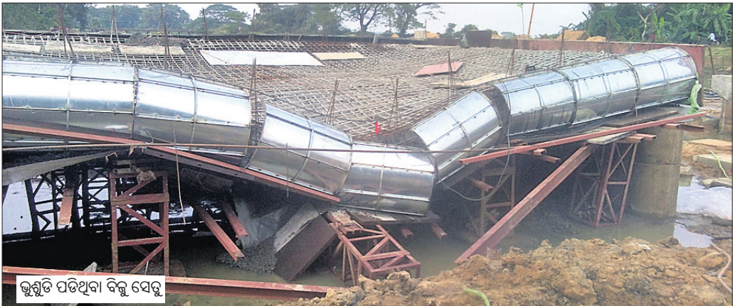
ଭୁଣ୍ଡୁଡ଼ି ପଡିଥିବା ବିଜୁ ସେତୁ