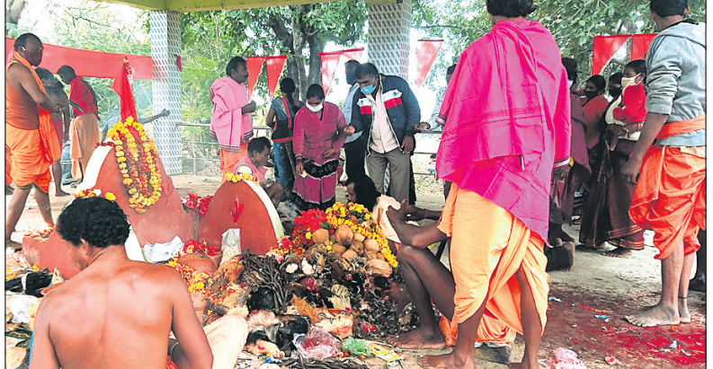
ଖଜରଗୁରାସ୍ଥିତ ବଡ଼ଖଳାରେ ଶୁଲିଆଙ୍କ ପୂଜାର୍ଚ୍ଚନା କରାଯାଉଛି।

ପରେ ମଙ୍ଗଳବାର ସକାଳ ୬ଟା ୩୦ରେ ପୂଜକ, ଝାଙ୍କର, ବରୁଆ ତଥା ସ୍ଥାନୀୟ କନ୍ଧ ଆଦିବାସୀମାନେ ପାଟବୋବାକୁ ଫୁଲମାଳ ପିନ୍ଧାଇ ଏକ ଶୋଭାଯାତ୍ରାରେ ପୂଜାପୀଠରେ ପହଞ୍ଚିଥିଲେ। ସେଠାରେ ରାତିନାଟିରେ ପୂଜାର୍ଚ୍ଚନା କରାଯାଇ ପରମ୍ପରା ଅନୁସାରେ