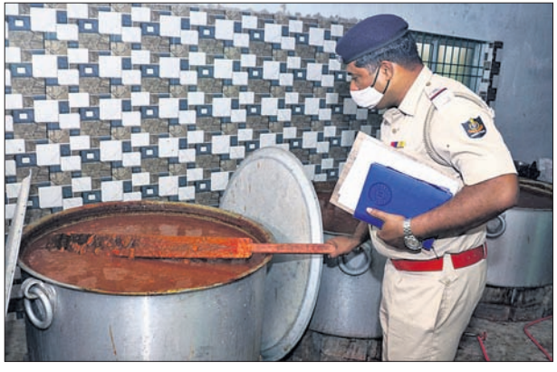
କଟକ ସସ୍ତୁ ପୋଲିସ୍ ଯାଞ୍ଚ କରୁଛି ।

କଟକ ଅଧିକ/କଟକ ସଦର, ୧୩୧୧ (ନି.ପ୍ର.)- ବିଭିନ୍ନ ହୋଟେଲ ଓ ଫାଷ୍ଟଫୁଡ୍ ଦୋକାନରେ ସୁସ୍ୱାଦ ଖାଦ୍ୟ ପ୍ରସ୍ତୁତ ପାଇଁ ବ୍ୟବହାର ହେଉଛି ଚମାଟୋ ଓ ଚିଲି ସସ୍। ହେଲେ ପତା କଖାରୁ, ରାସାୟନିକ ରଙ୍ଗ ମିଶ୍ରଣରେ କଟକ ଜିଲ୍ଲାରେ ପ୍ରସ୍ତୁତ ହେଉଛି ନକଲି ସସ୍। ପରେ ଏହାକୁ ବିକ୍ରି ପାଇଁ ବଜାରକୁ ଛଡ଼ାଯାଇଛି। କିଛିଦିନର ବ୍ୟବଧାନ ପରେ ଗୁରୁବାର କଟକ ମାଲଗୋଦାମ ଓ ୪୨ ମୌଜା ଅଞ୍ଚଳକୁ ଜବତ ହୋଇଛି ନକଲି ସସ୍।