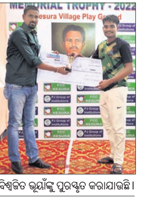
ବିଶ୍ୱକିତ ଷ୍ଟୋଟ୍‌କୁ ପୁରସ୍କୃତ କରାଯାଇଛି।

କୁବନେଶ୍ୱର, ୧୩୧ (କ୍ରୀଡ଼ା ପ୍ରତିନିଧି): କେଶୁରା ଖେଳ ପଡ଼ିଆରେ ଚାଲିଥିବା ପଞ୍ଚାଶନ ବେନା ସ୍ମାରକା କ୍ରିକେଟ ଚୁନାମେଣ୍ଟର ଗୁରୁତ୍ୱର ଅନୁଷ୍ଠିତ ମ୍ୟାଚରେ ରାମେଶ୍ୱର ଷ୍ଟୋଟ୍ ୪ ଉତ୍ତମେଣ୍ଟରେ ସହିଦ ଷ୍ଟୋଟ୍‌କୁ ପରାସ୍ତ କରିଛି। ଚମ୍ପ ହାରି ପ୍ରଥମେ ବ୍ୟାଟି ଆମନ୍ତ୍ରଣ ପାଇଥିବା ସହିଦ ଷ୍ଟୋଟ୍ ୨୪.୨ ଓଭରରେ ୧୪୬ ରନକରି ଅଲଆଉଟ ହୋଇଥିଲା। କବାବରେ ରାମେଶ୍ୱର ୨୩.୨ ଓଭରରେ ୪