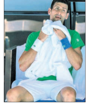
କରାଯାଇଛି। ଡ୍ର ଅନୁସାରେ ଆସନ୍ତା ସପ୍ତାହରେ ଓପନିଂ ରାଉଣ୍ଡରେ ଜୋକୋଭିଚ୍ ବିଶ୍ୱର

ଭିକ୍ଟା ବିବାଦ ଏପର୍ଯ୍ୟନ୍ତ ତ୍ରୁଟି ନ ଥିଲେ ମଧ୍ୟ ନୋଭାକ୍ ଜୋକୋଭିଚ୍ ଅଷ୍ଟ୍ରେଲିଆନ ଓପନ ଡ୍ର'ରେ ସ୍ଥାନ ପାଇଛନ୍ତି। ସର୍ବାଧିକ ଚେନିସ ଷ୍ଟାର ସରକାରଙ୍କ ନିଷ୍ପତ୍ତି ଅପେକ୍ଷାରେ ରହିଛନ୍ତି। କୋଭିଡ୍ ଭାଙ୍ଗିନ ନେଇ ନ ଥିବାରୁ ଅଷ୍ଟ୍ରେଲିଆ ସରକାର ଜୋକୋଭିଚ୍‌ଙ୍କ ଭିକ୍ଟା ବାଟିଲ କରି ତାଙ୍କର ପ୍ରତ୍ୟାପଣ କରିବାର ବ୍ୟବସ୍ଥା କରିବେ କି ନା ତାହା ଏବେ ସୁଦ୍ଧା ଅସ୍ପଷ୍ଟ ରହିଛି। ଅଷ୍ଟ୍ରେଲିଆନ ଓପନ ଡ୍ର'ରେ କିନ୍ତୁ ତାଙ୍କୁ ଚମ୍ପ ସିଡ୍ ମାନ୍ୟତା ପ୍ରଦାନ