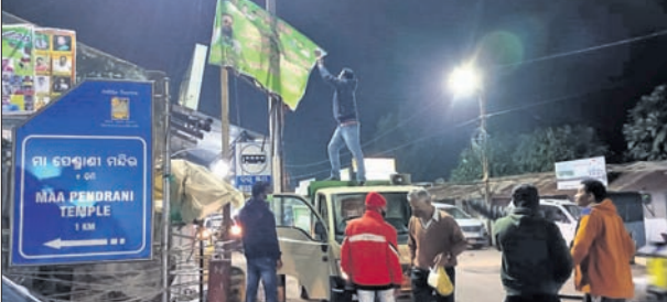
ନିର୍ବାଚନ ଆଚରଣ ବିଧି ଲାଗୁ ପରେ ନବରଙ୍ଗପୁର ଜିଲ୍ଲା ଉପରକୋଟରୁ ବିଭିନ୍ନ ରାଜନୈତିକ ଦଳ ପକ୍ଷରୁ ଲଗାଯାଇଥିବା ହୋଟି ହଟାଯାଇଛି।