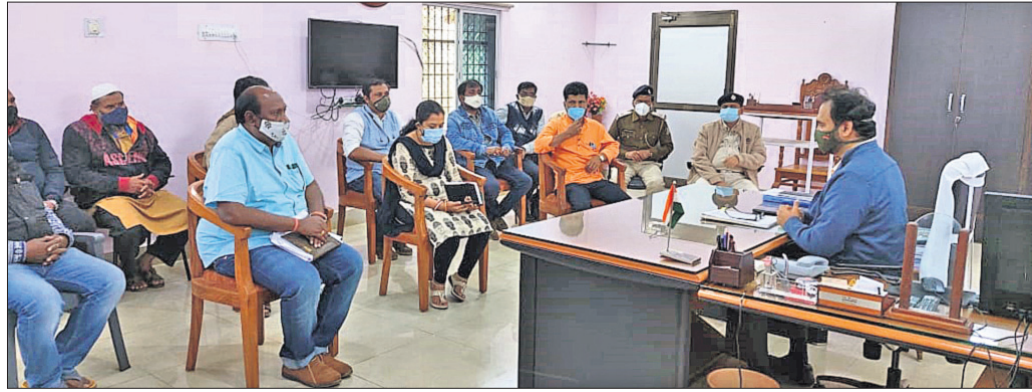
ବୈଠକରେ ଜିଲାପାଳଙ୍କ ସମେତ ବିଭିନ୍ନ ଧର୍ମାନ୍ୱେଷଣ ସଦସ୍ୟ ଓ ଅନ୍ୟମାନେ ।