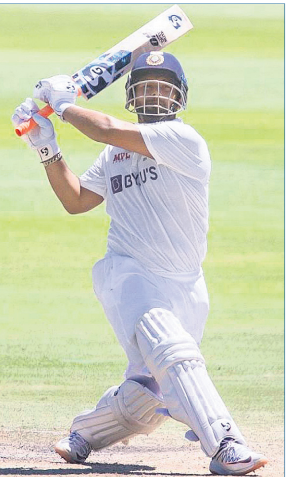
ଶତକ ହାସଲ ଅବସରରେ ଶତ ଖେଳୁଛନ୍ତି ରିଷଭ ପଟ୍ଟ।

ଭାରତର ଯୁବ ଉତ୍ତମ କିପର ରିଷଭ ପଟ୍ଟ ଶତକ ହାସଲ କରି ଭାରତର ସମ୍ମାନ ରକ୍ଷା କରିଛନ୍ତି। ତାଙ୍କ ଶତକ ସତ୍ତ୍ୱେ ଭାରତ ଦ୍ୱିତୀୟ ଇନିଂସରେ ୧୯୮ରେ ଅଲଆଉଟ ହୋଇ ଯାଇଛି। ଫଳରେ ଦକ୍ଷିଣ ଆଫ୍ରିକା ସମ୍ପୂର୍ଣ୍ଣରେ ୧୨୧ ରନର ଗୁରୁତ୍ୱର ତୃତୀୟ ଦିବସରେ ଖବର ମିଳିବା ବେଳକୁ ଦକ୍ଷିଣ ଆଫ୍ରିକା ୧ ଉତ୍ତମେଣ୍ଟ ହରାଇ ୮୩ ରନକରି ବିଜୟ ପଥରେ ଗ୍ରହଣ ହୋଇଛି। ମହମ୍ମଦ ସାମିକ ବଲ୍ରେ ଏଡେନ ମାରକ୍ରମ ଆଉଟ ହୋଇଥିବାବେଳେ ଅଧିନାୟକ ତିନି ଏଲଗାର ୩୦ ଓ ଗିରାନ ପିଟରସନ ୩୧ ରନରେ ଅପରାଜିତ ରହିଛନ୍ତି। ଦ୍ୱିତୀୟ ଦିବସର ଅସମାପ୍ତ ଇନିଂସ ୫୭/୨ରୁ ଖେଳ ଆରମ୍ଭ କରିଥିବା ଭାରତ ସମାନ ଷ୍ଟୋରରେ ଚେଷ୍ଟା ପୂର୍ଣ୍ଣାକାରଣ ଉତ୍ତମେଣ୍ଟ ହରାଇଥିଲା। ପୂର୍ଣ୍ଣାକାରଣ ପୂର୍ବଦିନ ଷ୍ଟୋର ୯ ରନରେ ହିଁ ପ୍ୟାଭିଲିୟନ ଫେରିଥିଲେ। ଅଜିଙ୍କ୍ୟ ରାହାନେ ପୁଣି ବିଫଳ ହୋଇ ମାତ୍ର ୧ ରନ କରି ପାରିଥିଲେ। ବଡ଼ ଷ୍ଟୋର କରିପାରି ନ ଥିଲେ ହେଁ ଅଧିନାୟକ ବିରାଟ କୋହଲି ଖେଳିଥିଲେ ମାରାଥନ ଇନିଂସ। ସେ ୨୯ ରନ କରିଥିଲେ ସତ, ମାତ୍ର ୧୪୩ଟି ବଲ୍ ଖେଳି ରିଷଭ ପଟ୍ଟଙ୍କୁ ବଡ଼ ଷ୍ଟୋର କରିବାରେ ବିଶେଷ ସହାୟକ ହୋଇଥିଲେ। କୋହଲି ଓ ପଟ୍ଟଙ୍କ