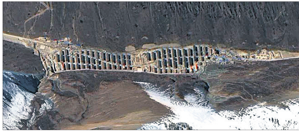
ତୁଟାନ ସଂଲଗ୍ନ ବିବାଦୀୟ ସୀମାରେ ଚାଇନା ବେଆଇନ ଭାବେ ନିର୍ମାଣ କରିଥିବା ଖୁବୁର ।