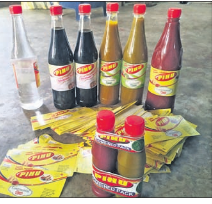
କଟକ ନକଲି ସସ୍ ବୋତଲ ।