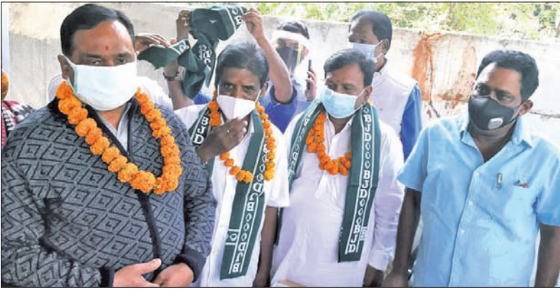
ମିଶ୍ରଣ ପର୍ବରେ ଅନ୍ୟ ଦଳର କର୍ମକର୍ତ୍ତାଙ୍କ ସହ ସ୍ୱାସ୍ଥ୍ୟମନ୍ତ୍ରୀ ।