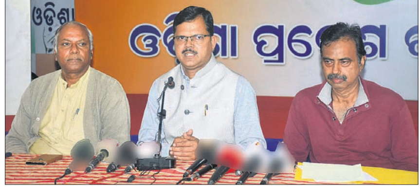
ଖବରଦାତା ସମ୍ମିଳନୀରେ କଂଗ୍ରେସ ନେତୃବୃନ୍ଦ।