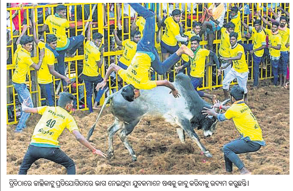
ଚିତ୍ତୋରରେ ଜାଲିକାରୁ ପ୍ରତିଯୋଗିତାରେ ଭାଗ ନେଇଥିବା ଯୁବକମାନେ ଷଷ୍ଠକୁ କାବୁ କରିବାକୁ ଉଦ୍ୟମ କରୁଛନ୍ତି।

ଚିତ୍ତୋର, ୧୫।୧: ଦେଶରେ କୋଭିଡ୍ ସଂକ୍ରମଣ ମାଡ଼ି ଚାଲିଥିବାବେଳେ ଆକ୍ରମଣରେ ପାରମ୍ପରିକ ଷଷ୍ଠ ଲଢ଼େଇ ପ୍ରତିଯୋଗିତା ଜାଲିକାରୁ ଆୟୋଜନ କରାଯାଇଛି। ଏହି ସମାରୋହରେ କରୋନା ରାଜତଲାଜନ ଉଲ୍ଲଙ୍ଘନ କରି ବହୁ ସଂଖ୍ୟାରେ ଲୋକ ଭିଡ଼ ଜମାଇଥିବା ଦେଖିବାକୁ ମିଳିଛି। ଶନିବାର ଜାଲିକାରୁ ବିତୀୟ ଦିନରେ ଚିତ୍ତୋରରେ ପ୍ରବଳ