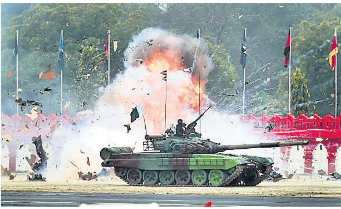
ସେନା ଦିବସ ଅବସରରେ ନୂଆଦିଲ୍ଲୀର କେଏମ୍ କାରିଆପୁା ପରେ ଗ୍ରାଉଣ୍ଡରେ ଯବାନମାନେ ଯୁଦ୍ଧ କୌଶଳ ପ୍ରଦର୍ଶନ କରୁଛନ୍ତି।

ମୁମ୍ବାଇ, ୧୫।୧: ପୁର ସାମ୍ରାଜ୍ୟ ଲତା ମଙ୍ଗେସ୍କର କୋଭିଡ୍ରେ ସଂକ୍ରମିତ ହୋଇ ଗତ ମଙ୍ଗଳବାର ୧୦ରୁ ମୁମ୍ବାଇର ଏକ ହସିନାଲ ଆଇସିଏସ୍ରେ ଭର୍ତ୍ତି ହୋଇଛନ୍ତି। ତାଙ୍କୁ ଆଉ କିଛି ଦିନ ଆଇସିଏସ୍ରେ ନିରୀକ୍ଷଣରେ ରଖାଯିବ ବୋଲି ଚିକିତ୍ସା କରୁଥିବା ଡାକ୍ତର ପ୍ରତି ସାମ୍ରାଜ୍ୟ ଶନିବାର କହିଛନ୍ତି। ତାଙ୍କ ସ୍ୱାସ୍ଥ୍ୟାବସ୍ଥାରେ ସମ୍ପୂର୍ଣ୍ଣ ସୁଧାର ନ ଆସିବା ପର୍ଯ୍ୟନ୍ତ ଅପେକ୍ଷା କରିବାକୁ ପଡ଼ିବ। ତାଙ୍କ ଆରୋଗ୍ୟ କାମନା କରି ପ୍ରାର୍ଥନା କରିବାକୁ ଡାକ୍ତର କହିଛନ୍ତି। କୋଭିଡ୍ରେ ଆକ୍ରାନ୍ତ ହେବା ପରେ ଲତା ମଙ୍ଗେସ୍କର ନିମୋଆଇସିଏସ୍ରେ ମଧ୍ୟ ପଡ଼ିତ ହୋଇଛନ୍ତି।