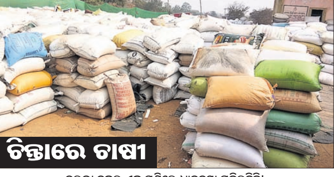
ଚିତ୍ରରେ ଗାଷୀ ତରଭା ବ୍ଲକର ଏକ ମଝିରେ ଧାନବସ୍ତା ପଡିରହିଛି। ଗାଟେଲ୍ ଦେଇଛି। ଜିଲ୍ଲାର ୬୨ଟି ପାଣ୍ଡୁ ଓ ୩୯ଟି ମହିଳା ଏସ୍ଏସ୍ ନିକଟରୁ ଧାନ ଉଠାଇବା ପାଇଁ ଜିଲ୍ଲା ଯୋଗାଣ ବିଭାଗ ଅନୁସାରେ ମିଳିବୁଁ ଗାଟେଲ୍ ଦେଇଛି। ତେବେ ଜିଲ୍ଲାର ଜଳସେଚିତ ଅଞ୍ଚଳ ଛାଡି ପାଲି ଓ ବିନା ବ୍ଲକର ଧାନ ପର୍ଯ୍ୟାୟରେ ଏହି ଜିଲ୍ଲାକୁ ୩୦ଲକ୍ଷ ୯୨ ହଜାର ୬୪୦ ଟଙ୍କା ଧାନକ୍ରୟ ପାଇଁ ଅଣକଳସେଚିତ ୪ ବ୍ଲକକୁ ମାତ୍ର ୫୦ ଲୁ ୬୦ ପ୍ରତିଶତ ଗାଟେଲ୍ ପ୍ରଦାନ କରିଛନ୍ତି। ଏଭଳି ସ୍ଥିତିରେ ୫୦ ପ୍ରତିଶତ ଧାନ କ୍ରୟ କରିବା ପରେ ସୋନପୁର, ତରଭା, ଭଲୁଣ୍ଡା ଓ ବୀରମହାରାଜପୁର ବ୍ଲକର ପାଣ୍ଡୁ ଓ ଏସ୍ଏସ୍ ନିକଟରୁ ଧାନ କ୍ରୟ ଗାଟେଲ୍ ସରି ଗଲାଣି। ଏହି ସବୁ ଅଞ୍ଚଳର ଗାଷୀ ଧାନ ବିକ୍ରି ପ୍ରତିଶତ ଗାଟେଲ୍ ପ୍ରଦାନ କରିଥିବା ବେଳେ

ସୋନପୁର, ୧୫:୧୧(ବି.ପ୍ର.) ଗାଟେଲ୍ ନ ଥିବାରୁ ସୁବର୍ଣ୍ଣପୁର ଜିଲ୍ଲାର ଅଣକଳସେଚିତ ୪ ବ୍ଲକରେ ଧାନ ସଂଗ୍ରହ ପ୍ରକ୍ରିୟା ଧିମିକି ଯାଇଛି। ଜିଲ୍ଲାର ସୋନପୁର, ତରଭା, ବୀରମହାରାଜପୁର ଓ ଭଲୁଣ୍ଡା ବ୍ଲକରେ ଏଭଳି ସମସ୍ୟା ଦୃଷ୍ଟି ହୋଇଛି। ଗାଟେଲ୍ ସରି ଯାଇଥିବାରୁ କେତେକ ପାଣ୍ଡୁ ଓ ମହିଳା ସ୍ୱୟଂ ସହାୟକ ଗୋଷ୍ଠୀ(ଏସ୍ଏସ୍)ଧାନ କିଣିପାରୁ ନାହାନ୍ତି। ମଝିରେ ଧାନ ରଖି ଗାଷୀ ଦିନରାତି ଜରି ରଖୁଛନ୍ତି। ମଝିରେ ୨୪ଘଣ୍ଟାରୁ ଉର୍ଦ୍ଧ୍ୱ ସମୟ ଧାନ ପଡିରହିବନି ବୋଲି ସରକାର କହୁଥିବା ବେଳେ ବାସ୍ତବ ସ୍ଥିତି ଭିନ୍ନ। ଅଧିକାଂଶ ମଝିରେ ଭିଜିଭୁମି ଅଭାବ ଥିବାରୁ ଗାଷୀକୁ ନିଜ ଉପାଦାନ ଧାନକୁ ସୁରକ୍ଷା ଦେବାକୁ ପଡୁଛି। ଗାଷୀ ନିକଟରୁ ବଳକା ଧାନ କିଣିବା ଲାଗି ରାଜ୍ୟ ସରକାର ବୁଲିତ ପର୍ଯ୍ୟାୟରେ ଏହି ଜିଲ୍ଲାକୁ ୩୦ଲକ୍ଷ ୯୨ ହଜାର ୬୪୦ ଟଙ୍କା ଧାନକ୍ରୟ ପାଇଁ