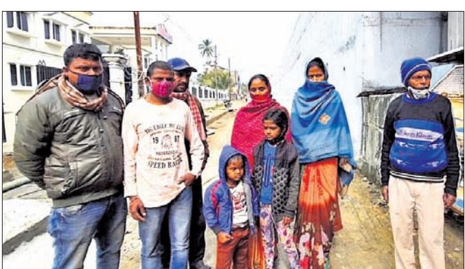
ଡିଆଇଜି ଅଫିସକୁ ଅଭିଯୋଗ କରିବାକୁ ଆସିଥିବା ମୃତକଙ୍କ ସ୍ତ୍ରୀ ଓ ପରିବାର ସଦସ୍ୟ ।