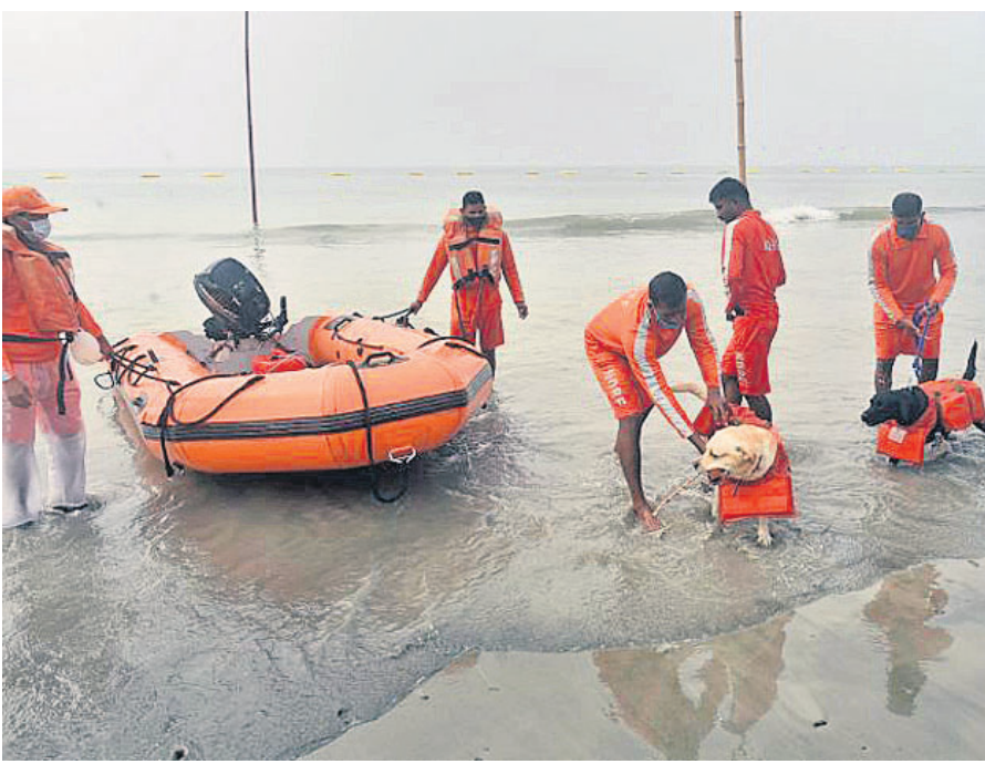
ଗଙ୍ଗାସାଗର ମେଳାରେ ସୁରକ୍ଷା ପାଇଁ ଏନ୍‌ଡିଆର୍‌ଏଫ୍ ଯବାନ ତାଲିମପ୍ରାପ୍ତ କୁକୁର ସହ ସାଗରତୀର ବେକାଭୂମିରେ ପ୍ରସ୍ତୁତ।