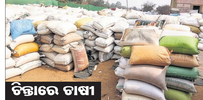
ଟିକ୍ତାରେ ଟାଟା ଟରଭା ବ୍ଲକର ଏକ ମଞ୍ଜିରେ ଧାନବସ୍ତା ପଡ଼ିରହିଛି। ଟାଟେଟ୍ ଦେଇଛି। ଜିଲାର ୬୨ଟି ପାଣ୍ଡୁ ଓ ୩୯ଟି ମହିଳା ଏସ୍‌ଏସ୍‌ଜି ନିକଟରୁ ଧାନ ଉଠାଇବା ପାଇଁ ଜିଲା ଯୋଗାଣ ବିଭାଗ ଅନୁସାରେ ମିଳୁଥିବା ଟାଟେଟ୍ ଦେଇଛି। ତେବେ ଜିଲାର ଜଳସେଚିତ ଅଞ୍ଚଳ ଛାଡ଼ିପାଲି ଓ ବିନା ବ୍ଲକର ଧାନ ପର୍ଯ୍ୟାୟରେ ଏହି ଜିଲାକୁ ୩୦ଲକ୍ଷ ୯୨ ହଜାର ୬୪୦ ଟଙ୍କା ଧାନକ୍ରୟ ପାଇଁ ଅଣକସେଚିତ ୪ ବ୍ଲକକୁ ମାତ୍ର ୫୦ ଲୁ ୬୦ ପ୍ରତିଶତ ଟାଟେଟ୍ ପ୍ରଦାନ କରିଛନ୍ତି। ଏଭଳି ସ୍ଥିତିରେ ୫୦ ପ୍ରତିଶତ ଧାନ କ୍ରୟ କରିବା ପରେ ସୋନପୁର, ତରଭା, ଭଲୁଣ୍ଡା ଓ ବୀରମହାରାଜପୁର ବ୍ଲକର ପାଣ୍ଡୁ ଓ ଏସ୍‌ଏସ୍‌ଜିଙ୍କୁ ଧାନ କ୍ରୟ ଟାଟେଟ୍ ସରି ଗଲାଣି। ଏହି ସବୁ ଅଞ୍ଚଳର ଗଣ୍ଡା ଧାନ ବିକ୍ରି ପ୍ରତିଶତ ଟାଟେଟ୍ ପ୍ରଦାନ କରିଥିବା ବେଳେ

ସୋନପୁର, ୧୫।୧(ବି.ପ୍ର.) ଟାଟେଟ୍ ନ ଥିବାରୁ ସୁବର୍ଣ୍ଣପୁର ଜିଲାର ଅଣକସେଚିତ ୪ ବ୍ଲକରେ ଧାନ ସଂଗ୍ରହ ପ୍ରକ୍ରିୟା ଧିମିକି ଯାଇଛି। ଜିଲାର ସୋନପୁର, ତରଭା, ବୀରମହାରାଜପୁର ଓ ଭଲୁଣ୍ଡା ବ୍ଲକରେ ଏଭଳି ସମସ୍ୟା ଦୃଷ୍ଟି ହୋଇଛି। ଟାଟେଟ୍ ସରି ଯାଇଥିବାରୁ କେତେକ ପାଣ୍ଡୁ ଓ ମହିଳା ସ୍ୱୟଂ ସହାୟକ ଗୋଷ୍ଠୀ(ଏସ୍‌ଏସ୍‌ଜି)ଧାନ କିଣିପାରୁ ନାହାନ୍ତି। ମଞ୍ଜିରେ ଧାନ ରଖି ଗଣ୍ଡା ଦିନରାତି କରି ରଖୁଛନ୍ତି। ମଞ୍ଜିରେ ୨୪ଘଣ୍ଟାକୁ ଉର୍ଦ୍ଧ୍ୱ ସମୟ ଧାନ ପତ୍ତିରହିବନି ବୋଲି ସରକାର କହୁଥିବା ବେଳେ ବାସ୍ତବ ସ୍ଥିତି ଭିନ୍ନ। ଅଧିକାଂଶ ମଞ୍ଜିରେ ଭିଜିଭୁମି ଅଭାବ ଥିବାରୁ ଗଣ୍ଡା ନିଜ ଉପାଦାନ ଧାନକୁ ସୁରକ୍ଷା ଦେବାକୁ ପଡୁଛି। ଗଣ୍ଡା ନିଜରୁ ବଳକା ଧାନ କିଣିବା ଲାଗି ରାଜ୍ୟ ସରକାର ବୁଲିତ ପର୍ଯ୍ୟାୟରେ ଏହି ଜିଲାକୁ ୩୦ଲକ୍ଷ ୯୨ ହଜାର ୬୪୦ ଟଙ୍କା ଧାନକ୍ରୟ ପାଇଁ