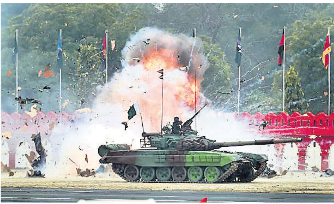
ସେନା ଦିବସ ଅବସରରେ ନୂଆଦିଲ୍ଲୀର କେଏମ୍ କାରିଆପୁା ପରେ ଗ୍ରାଭଣ୍ଡରେ ଯବାନମାନେ ଯୁଦ୍ଧ କୌଶଳ ପ୍ରଦର୍ଶନ କରୁଛନ୍ତି।