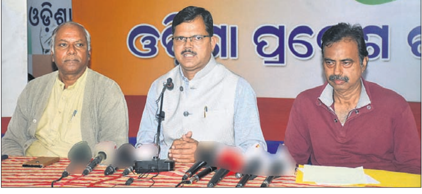
ଖବରଦାତା ସମ୍ମିଳନୀରେ କଂଗ୍ରେସ ନେତୃବୃନ୍ଦ।