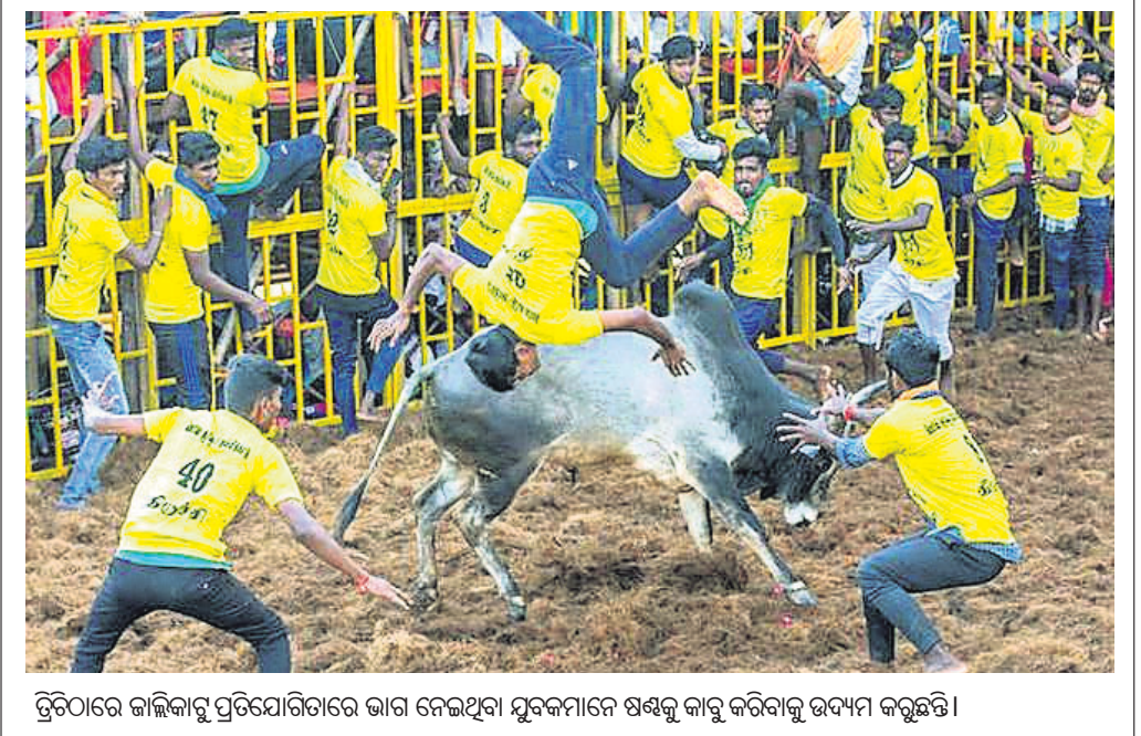
ତ୍ରିତୀୟରେ ଜାଲିକାରୁ ପ୍ରତିଯୋଗିତାରେ ଭାଗ ନେଇଥିବା ଯୁବକମାନେ ଷଷ୍ଠକୁ କାରୁ କରିବାକୁ ଉଦ୍ୟମ କରୁଛନ୍ତି।

ଗହଳି ଜମିଥିଲା। ରାମଚନ୍ଦ୍ରପୁରମ୍ରେ ଆୟୋଜିତ ଏହି ବାର୍ଷିକ ସଂକ୍ରାନ୍ତି ଖେଳ ଦେଖିବାକୁ ହଜାର ହଜାର ସଂଖ୍ୟାରେ ଲୋକ ବୁଝି ହୋଇଥିଲେ। ସେମାନଙ୍କ ମଧ୍ୟରେ ଅଧିକାଂଶ ମାଝ ପିଢ଼ି ନ ଥିବାବେଳେ ସାମାଜିକ ଦୂରତା ନିୟମ ମଧ୍ୟ ପାଳନ ହୋଇ ନ ଥିଲା। ପତୋଶୀ ଚାମିଲନାଟୁରେ ମଧ୍ୟ ଜାଲିକାରୁ ପାଳନ କରାଯାଇଛି। ଏଥିପାଇଁ ରାଜ୍ୟ ସରକାରଙ୍କ ପକ୍ଷରୁ କୋଭିଡ୍ ରାଜତଲାଜନ ଜାରି ହୋଇଛି।