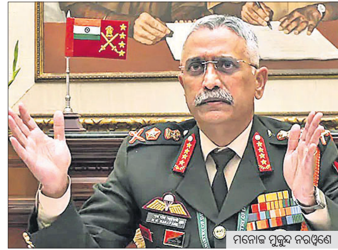
ମନୋଜ ମୁକୁନ୍ଦ ନରଝିଣେ

ନୂଆଦିଲ୍ଲୀ, ୧୫।୧: ଦେଶର ସୀମାରେ ଏକପାଖୁଆ ଭାବେ ସ୍ଥିତାବସ୍ଥା ପରିବର୍ତ୍ତନ ଲାଗି କୌଣସି ଉଦ୍ୟମକୁ ସମର୍ଥନ ହେବାକୁ ଦିଆଯିବ ନାହିଁ। ଶନିବାର ସେନା ଦିବସ ପରେ ଉଦ୍‌ବୋଧନ ଦେଇ ଭାରତୀୟ ସେନା ମୁଖ୍ୟ ଜେନେରାଲ ମନୋଜ ମୁକୁନ୍ଦ ନରଝିଣେ ପତୋଶୀ ଦେଶକୁ କଡ଼ା ବାଣୀ ଦେଇଛନ୍ତି। ଗତବର୍ଷ ଚାଇନା ସୈନ୍ୟକ ଉପସ୍ଥିତି ଭାରତୀୟ ସେନା ପାଇଁ ଚ୍ୟାଲେଞ୍ଜ ସୃଷ୍ଟି କରିଥିଲା। ଏକାଧିକ ଥର ଉଭୟ ପକ୍ଷ ସୈନ୍ୟକ ମଧ୍ୟରେ ମୁହାଁମୁହିଁ ପରିସ୍ଥିତି ସୃଷ୍ଟି ହୋଇଥିଲା। ସ୍ଥିତିକୁ ନିୟନ୍ତ୍ରଣକୁ ଆଣିବା ଲାଗି ନିକଟରେ ବୁଲି ଦେଶର ସୀମାରେ ସ୍ଥିତି ପୂର୍ବ