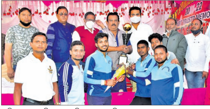
ସମ୍ପଦ ସମ୍ପର୍କରେ ଟ୍ରଫି ପ୍ରଦାନ କରୁଛନ୍ତି।

ପୂରୀ ଅପିସ, ୧୫।୧ ଚାକଟପୁର ବ୍ଲକ କାର୍ଯ୍ୟାଳୟରେ ଲଭର୍ସ ସ୍ଵୋର୍ଟିଂ ଚାମ୍ପିୟନ ନିକଟ ପଡ଼ିଆରେ ପୂରୀର ଜିୟାଣ୍ଟ କ୍ଲବ୍ ଆନୁଷ୍ଠାନିକଙ୍କୁ ଗୌରବ ସମ୍ପନ୍ନ କରିବା ପାଇଁ ପ୍ରତିଯୋଗିତାରେ ଜିଲ୍ଲାର ୩୨ଟି କ୍ଲବ୍ ଅଂଶଗ୍ରହଣ କରିଥିଲେ। ତେବେ ଫାଇନାଲ ମ୍ୟାଚ ଜିୟାଣ୍ଟ ସ୍ଵୋର୍ଟିଂ ଓ ଲଭର୍ସ ସ୍ଵୋର୍ଟିଂ ମଧ୍ୟରେ ହୋଇଥିଲା। ଲଭର୍ସ ସ୍ଵୋର୍ଟିଂ ପ୍ରଥମେ ବ୍ୟାଟିଂ କରି ୧୫ ଓଭରରେ ୧୦୮ରନ କରିଥିଲା। ଜବାବରେ ଜିୟାଣ୍ଟ ସ୍ଵୋର୍ଟିଂ ମାତ୍ର ୯୩ ରନ କରି ସମଗ୍ର ଉଦ୍ଦେଶ୍ୟ ହରାଇଥିଲା। ଫଳରେ ଲଭର୍ସ ସ୍ଵୋର୍ଟିଂ ଚାମ୍ପିୟନ ହୋଇଥିଲା। ଆୟୋଜକଙ୍କ ପକ୍ଷରୁ ଚାମ୍ପିୟନ ଦଳକୁ ଟ୍ରଫି ସମେତ ୨୦,୦୦୦ ଟଙ୍କା ଓ ରନସଂପଦ ଦଳକୁ କର୍ପ୍ ଓ ୧୦,୦୦୦ ଟଙ୍କା ପ୍ରଦାନ କରାଯାଇଥିଲା।