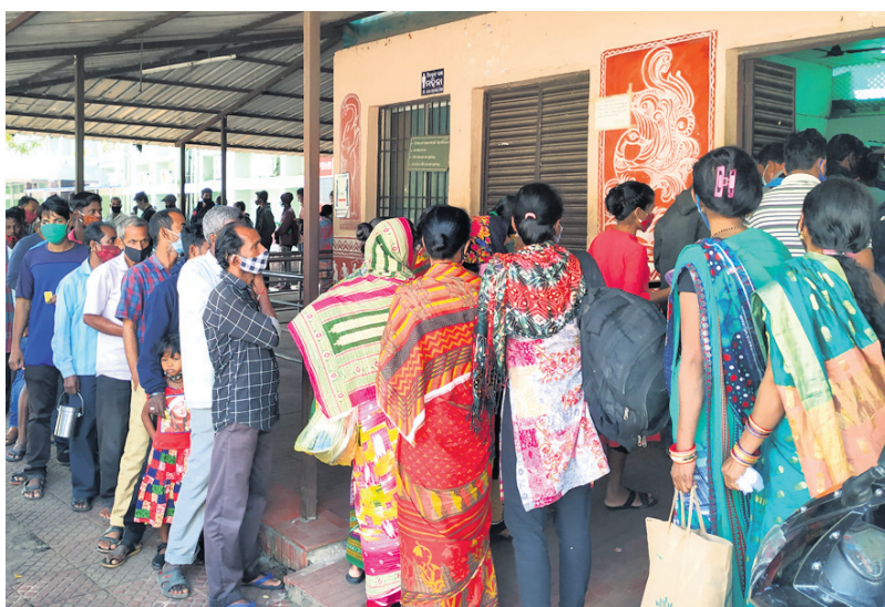
କରୋନା କଟକଣାକୁ ପୂ: ଶିବିବାର କଟକ ଏସିପିଓ ମେଡିକାଲ କଲେଜ ଆଖି ହସ୍ପିଟାଲ ପରିସରରେ ଥିବା ଆହାର କେନ୍ଦ୍ରରେ ଲୋକଙ୍କ ଭିଡ଼।