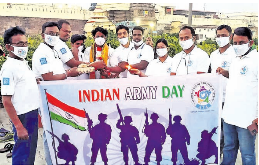
ସେନା ଦିବସ ଅବସରରେ ଆୟୋଜିତ ଥିବା ଅର୍ପଣ କାର୍ଯ୍ୟକ୍ରମରେ ଆକ୍ରିଭିଟିଭ୍ ପକ୍ଷରୁ ପୂରୀ ସିଂହଦ୍ୱାର ସମ୍ମୁଖରେ ସମୂହ ଦୀପାଦାନ କରାଯାଇଛି।