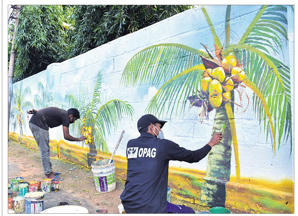
ଆମ ସହର କେଡ଼େ ସୁନ୍ଦର: ଭୁବନେଶ୍ୱର ସୌନ୍ଦର୍ଯ୍ୟକରଣ ଅଭିଯାନରେ ରବିବାର ସ୍ୱାର୍ତ୍ତସିତର ଏହି ଛକ ନିକଟ ପାଟେରିକୁ ଖଲିକୋଟ୍‌ ଆର୍ଟ୍‌ କଲେକ୍ଟର ଛାତ୍ରମାନେ ଚିତ୍ରିତ କରୁଛନ୍ତି।