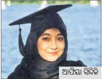
ଆର୍ଟିଷ୍ଟା ସିଦ୍ଧିକା ସୁରକ୍ଷାକର୍ମୀଙ୍କ ଗୁଳିରେ ବନ୍ଦୀଖାଧାରୀ ନିହତ

ଝାନ୍ସି, ୧୬.୧: ଜଣେ ପାକିସ୍ତାନୀ ଆତଙ୍କବାଦୀଙ୍କୁ ମୁକ୍ତ କରାଯିବା ଦାବିରେ ଆମେରିକା ଚେକ୍ୱାସ୍ ସ୍ଥିତ କୋଲେଜିଏଟରେ ଇନ୍ଦୁମାନଙ୍କ ପ୍ରାର୍ଥନା ସ୍ଥଳୀ (ସିନେଗର)ରେ ଜଣେ ବ୍ୟକ୍ତି ଶନିବାର ୪ ଜଣଙ୍କ ମୁକ୍ତ କାମିନ ରଖିଥିଲେ। ପ୍ରାୟ ୧୦ ଘଣ୍ଟାର ଅପରେଶନ ପରେ ବନ୍ଦୀ ଥିବା ସମସ୍ତ ୪ ଜଣଙ୍କୁ ସୁରକ୍ଷିତ ଭାବେ ମୁକ୍ତ କରାଯାଇଛି। ଏଥିସହ ସୁରକ୍ଷାକର୍ମୀଙ୍କ ଗୁଳିରେ ବନ୍ଦୀଖାଧାରୀ ନିହତ ହୋଇଛନ୍ତି।