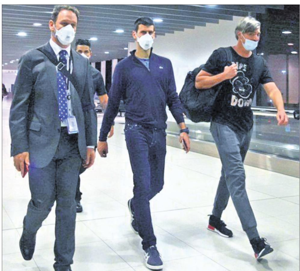
ମେଲବୋର୍ନ ବିମାନ ବନ୍ଦରରେ ନୋଭାକ କୋକୋଭିଡ୍ (ମଝି)