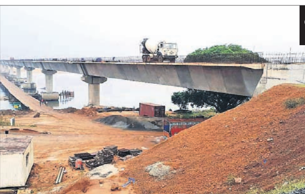
ନିର୍ମାଣଧୀନ କାଲୁଡିଆ-ଗୋରଡିଆ ସେତୁ।