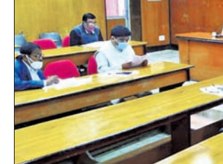
ବୈଠକରେ ଉପସ୍ଥିତ ଜିଲ୍ଲା ପ୍ରଶାସନିକ ଅଧିକାରୀ ଓ ରାଜନୈତିକ ଦଳର ପ୍ରତିନିଧିମାନେ