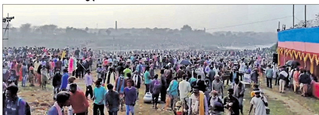
ବାମୋଦର ଯାତ୍ରାରେ ବାଉଁଶା ଘାଟରେ ଅସ୍ତି ବିସର୍ଜନ ପାଇଁ ଆସିଥିବା ଆତ୍ମୀୟ ସମ୍ପର୍କୀୟ ଉଡ଼ି

ବାରିପଦା ଅଫିସ, ୧୬୧୧ ମୟୂରଭଞ୍ଜ ଜିଲ୍ଲାର ରାଣପୁର ମକର ଅବସରରେ ସୁନାମୁହଁ (ବାଉଁଶା) ଘାଟରେ ରବିବାର ବାମୋଦର ଯାତ୍ରା ଆରମ୍ଭ ହୋଇଛି। ଏହି ଯାତ୍ରା ତିନିଦିନ ଚଳାଇବାକୁ ଥିବା ବେଳେ କୋଭିଡ଼ କଟକଣାକୁ ନ ମାନି ବହୁ ଲୋକଙ୍କ ଭିଡ଼ରେ ଏହି ପରମ୍ପରା ପାଳନ ହୋଇଛି। ବାରିପଦା ବେଢ଼ ପ୍ରାସାଦ ଛୁଡ଼ାବଦଳ, ଜରାଳି ଓ ସରାଳି ସେତୁର ବଜେ ମୁକ୍ତ ତ୍ରିବେଣୀ (ସୁନାମୁହଁ) ଘାଟରେ ସହସ୍ରାଧିକ ଲୋକ ଅସ୍ତି ବିସର୍ଜନ କରିଛନ୍ତି। କରୋନା ସତ୍ତ୍ୱେ ଜିଲ୍ଲା ସମେତ ଓଡ଼ିଶା, ପଡ଼ୋଶୀ ରାଜ୍ୟ ଝାଡ଼ଖଣ୍ଡ ଓ ପଶ୍ଚିମବଙ୍ଗରୁ ହଜାର ହଜାର ଲୋକ ଆସି ଏଠାରେ ଅସ୍ତି ବିସର୍ଜନ କରିଛନ୍ତି।