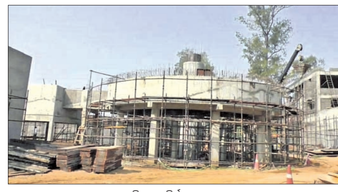
ଚାନ୍ଦବାଲିଠାରେ ନିର୍ମାଣାଧୀନ ପ୍ରକଳ୍ପ

ଆରଡ଼ି, ୧୬୧୧ (ଡି.ଏନ.ଏ.) ପ୍ରତି ଘରକୁ ଦିନା ମୂଲ୍ୟରେ ପାନୀୟ ଜଳ ଯୋଗାଇ ଦିଆଯିବ। ଆଉ ଜଳକଣ୍ଠ ରହିବ ନାହିଁ। ଭୂତଳ ଜଳ ବି ଖର୍ଚ୍ଚ ହେବନି। ନଦୀ ପାଣିକୁ ବିଶୁଦ୍ଧ କରାଯାଇ ପାନୀୟ ଜଳରେ ପରିଣତ କରାଯିବ। ଏହାକୁ କାର୍ଯ୍ୟକାରୀ କରିବା ନିମନ୍ତେ ୨୦୧୮ରେ ଭଦ୍ରକ ଜିଲ୍ଲା ଚାନ୍ଦବାଲିଠାରେ ଆରମ୍ଭ ହୋଇଥିଲା ମେଗା ପ୍ରକଳ୍ପ ନିର୍ମାଣ କାର୍ଯ୍ୟ। କେନ୍ଦ୍ରାପଡ଼ା ଜିଲ୍ଲା ରାଜକନିକା ନିକଟସ୍ଥ ଖରସ୍ରୋତା ନଦୀର ଜଳକୁ ଏହି ପ୍ରକଳ୍ପ ମାଧ୍ୟମରେ ଲୋକଙ୍କୁ ଯୋଗାଇବା ପାଇଁ ଭଦ୍ରକ ଜିଲ୍ଲା ଚାନ୍ଦବାଲି ସମେତ ତିହିଡ଼ି, ବାସୁଦେବପୁର ଓ ଧାମନଗର ବ୍ଲକ୍ ଅଞ୍ଚଳରେ ପାଇପ୍ ବିଛାଯାଇଛି। ଠିକାଦାରମାନେ ଗାଁ ଦାଣ୍ଡ ଖୋଳି ପରେ ପରାମର୍ଶ କରୁ ନ ଥିବାରୁ ଲୋକେ ଅସୁବିଧାର ସମ୍ମୁଖୀନ ହେଉଛନ୍ତି। ଏପରି କି ପାଇପ୍ ବିଛାଇବା ଲାଗି କଂକ୍ରିଟ ରାସ୍ତାକୁ ମଧ୍ୟ ଖୋଳି ଦିଆଯାଇଛି। ଏହାବ୍ୟତୀତ ପ୍ରତି ପଞ୍ଚାୟତରେ ଗୋଟିଏ ଗୋଟିଏ ପାଣି ଟାଙ୍କି ନିର୍ମାଣ କରାଯାଇଛି।