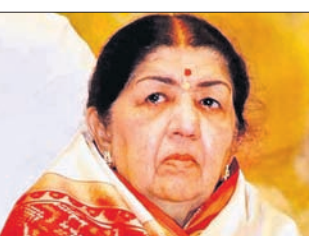
ଦେଖା କରିବାକୁ ମନାକଲେ ତାଙ୍କୁ