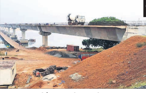
ନିର୍ମାଣଧୀନ ବାଲୁଡିଆ-ଗୋରଡିଆ ସେତୁ।

ରତନ ନାୟକ ଡେକାନାଲ ଅଧିକ, ୧୬୧ ଓଡ଼ିଶାର ବୃତ୍ତୀୟ ବୃହତ୍ତମ ନଦୀ ବ୍ରାହ୍ମଣୀରେ ହେବ ରାଷ୍ଟ୍ରୀୟ ଜଳମାର୍ଗ। ଶିଳ୍ପାୟନରେ ପ୍ରମୁଖ ଭୂମିକା ଗ୍ରହଣ କରିଥିବା ଏହି ନଦୀରେ ଚଳାଚଳ କରିବ ପଣ୍ୟବାହୀ ଜାହାଜ। ଅନୁଗୋଳ-ଡେକାନାଲ-ଯାଜପୁର ଭଳି ଶିଳ୍ପସମୃଦ୍ଧ ଜିଲ୍ଲାକୁ କୋଇଲା, ସାର ସମେତ କମ୍ପାନୀ ଉତ୍ପାଦିତ ସାମଗ୍ରୀ ପରିବହନ ସୁବିଧାରେ କରିହେବ। କୃଷି, ପର୍ଯ୍ୟଟନ, ଶିଳ୍ପାୟନରୁଚିତ ବିକାଶ ସାଜକୁ ପରିବେଶକର୍ମିତ ଷଡ଼କୁ ବହୁ ପରିମାଣରେ କମାଯାଇପାରିବ। ହେଲେ ଏହା ଏତେ ସହଜ ନୁହେଁ। କାରଣ ଅଗଭୀର ନଦୀ ଏବଂ ପୂର୍ବରୁ କମ୍ ଉଚ୍ଚତାରେ ନିର୍ମିତ ସେତୁ ଜାହାଜ ଚଳାଚଳରେ ପ୍ରତିବନ୍ଧକ ସାଜିବ। ତେଣୁ କେନ୍ଦ୍ର ସରକାରଙ୍କ ରାଷ୍ଟ୍ରୀୟ ଜଳମାର୍ଗ ବିଭାଗର ମାର୍ଗଦର୍ଶିକା ଅନୁଯାୟୀ ସମସ୍ୟା ଦୂରୀକରଣ ପାଇଁ ଉଦ୍ୟମ ଆରମ୍ଭ ହୋଇଛି। ପ୍ରକଳ୍ପ ଲାଗି ଯେଉଁସବୁ ଆନୁଷ୍ଠାନିକ ଭିତ୍ତିପ୍ରତି ଆବଶ୍ୟକ, ସେସବୁ ୧୨୫୩-୨