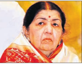
ଦେଖା କରିବାକୁ ମନାକଲେ ତାଙ୍କୁ

ଆଜିଠୁ ତରୁଣ ଏଫ୍ ସମିତ୍ ମୋଦି, ଜିନ୍‌ପିଙ୍ଗ ଉଦ୍‌ବୋଧନ ଦେବେ