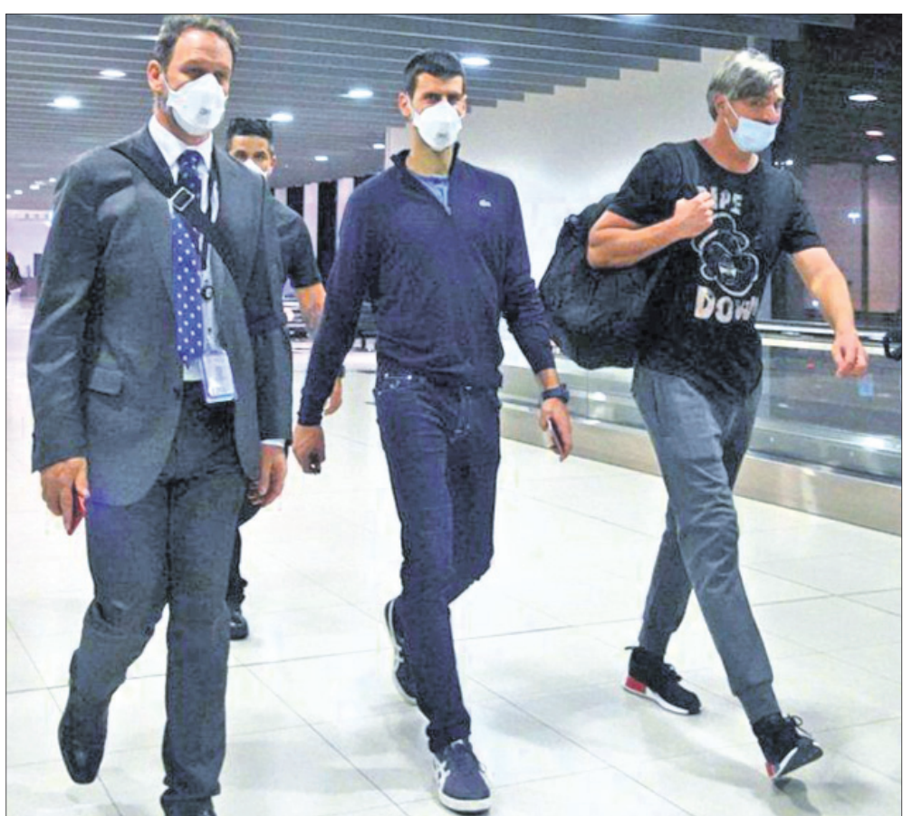
ମେଲବୋର୍ନ ବିମାନ ବନ୍ଦରରେ ନୋଭାକ କୋକୋଭିର୍ (ମଝି)