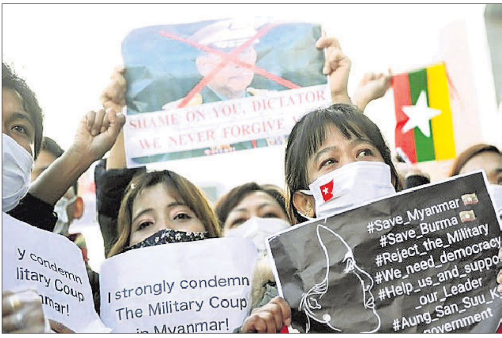
ଏବେ ସେମାନଙ୍କଠାରୁ ବିଜିଲ୍ ବିଲ୍ ଏବଂ ରଖିବାକୁ ଅର୍ଥ ସଂଗ୍ରହରେ ଲାଗିଛି। ଏପରି କି ସେନା ଅଧିକାରୀମାନେ ବିଦ୍ୟୁତ୍ ବିଲ୍ ନିମନ୍ତେ ଲୋକଙ୍କ ଘର କବାଟ ବାଜାଉଛନ୍ତି। ବିଲ୍ ନ ଦେଲେ ବଦଳରେ ବିଲ୍ ଆଦାୟ କରୁଥିବା ଦେଖାଯାଇଛି।