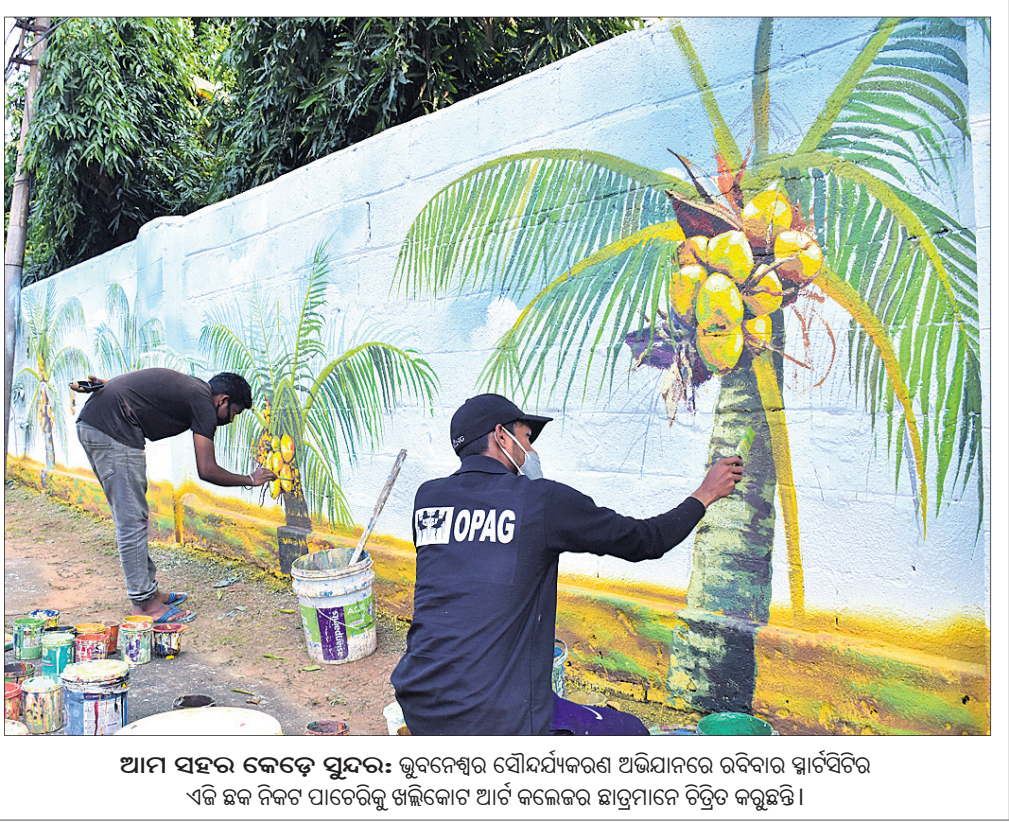
ଆମ ସହର କେଡ଼େ ସୁନ୍ଦର: ଭୁବନେଶ୍ୱର ସୌନ୍ଦର୍ଯ୍ୟକରଣ ଅଭିଯାନରେ ରବିବାର ସ୍ୱାର୍ତ୍ତସିତର ଏହି ଛକ ନିକଟ ପାଟେରିକୁ ଖଲିକୋଟ ଆର୍ଟ କଲେକ୍ଟର ଛାତ୍ରମାନେ ଚିତ୍ରିତ କରୁଛନ୍ତି।