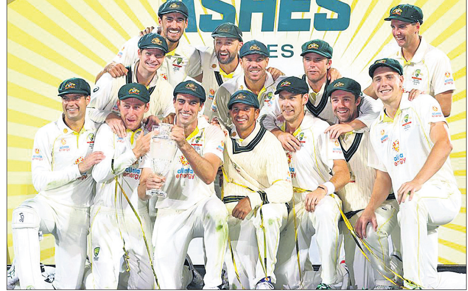
ଆଶେଷ୍ଟ୍ ଟ୍ରଫି ସହ ଅଷ୍ଟ୍ରେଲିଆ କ୍ରିକେଟ ଦଳ।

ଆଶେଷ୍ଟ୍ ଟେଷ୍ଟ୍ ସିରିଜ୍ ■ ଇଂଲଣ୍ଡ ୧୪୬ ରନରେ ପରାସ୍ତ ■ ଗ୍ରାଭିସ୍ ହେଡ୍ ଫ୍ଲୋୟର ଅଫ ଦି ମ୍ୟାଚ୍ ଓ ସିରିଜ୍ ହୋବର୍ଟ, ୧୬୧