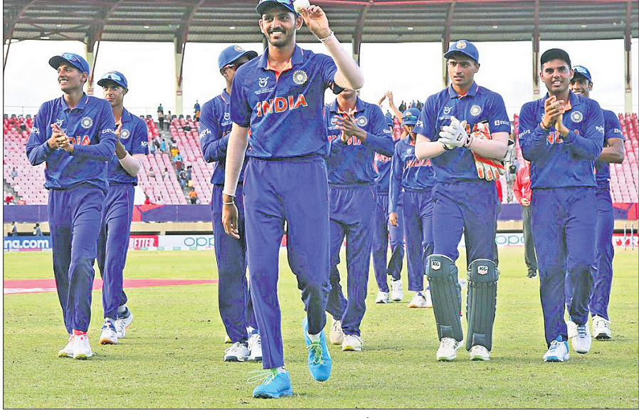
ଦକ୍ଷିଣ ଆଫ୍ରିକାକୁ ପରାସ୍ତ କରିବା ପରେ ୧୯ ବର୍ଷରୁ କମ୍ ଭାରତୀୟ କ୍ରିକେଟ୍ ଦଳ।

କଟକରେ ୧୬୧ ରେକର୍ଡ୍ ୪୭ର ଟାଇଟଲ ହାସଲ କରିଥିବା ଭାରତୀୟ କ୍ରିକେଟ୍ ଦଳ ଏବଂ ଫ୍ରେସ୍‌ଇଣ୍ଡିଆରେ ଚାଲିଥିବା ୧୯ ବର୍ଷରୁ କମ୍ ବିଶ୍ୱକପ୍ରେ ବିଜୟରୁ ଅଭିଯାନ ଆରମ୍ଭ କରିଛି। ଶନିବାର ବୁୟାନାର ପ୍ରୋଭିଡେଟ୍ ସ୍ୱାଧିନାୟକ ଅନୁଷ୍ଠିତ ଟୁର୍ନାମେଣ୍ଟର ଚତୁର୍ଥ ମ୍ୟାଚ୍ରେ ଭାରତ ୪୫ ରନରେ ଦକ୍ଷିଣ ଆଫ୍ରିକାକୁ ପରାସ୍ତ କରି ୨ ପଏଣ୍ଟ ହାସଲ କରିଛି। ଟ୍ରେ ହାରି ବ୍ୟାଟ୍ ପାଇଁ ଆମ୍ବୁଶ ପାଇଥିବା ଭାରତ ୪୬.୫ ଓଭରରେ ୨୩୨ ରନକରି ଅଲଆଉଟ ହୋଇଥିଲା। ଜବାବରେ ଦକ୍ଷିଣ ଆଫ୍ରିକା ୪୫.୪ ଓଭରରେ ୧୮୭ ରନକରି ଅଲଆଉଟ ହୋଇଥିଲା। ଭାରତ ସହ ପରାସ୍ତ ହୋଇଛି। ଭାରତ ସହ ପରାସ୍ତ ହୋଇଛି। ଭାରତ ସହ ପରାସ୍ତ ହୋଇଛି। ଭାରତ ସହ ପରାସ୍ତ ହୋଇଛି।