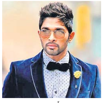
ଅଲ୍ଲୁକ ଅର୍ଜୁନ ଅଲ୍ଲୁକ ମୁଖ୍ୟ ଯୁଗପତି ହେବା ପରେ ନିଜାତା ଫିଲ୍ମ 'ବୈକୁଣ୍ଠପୁରମ' କୁ ହିନ୍ଦୀ ଭର୍ସନରେ ରିଲିଜ୍ କରିବାକୁ ନିଷ୍ପତ୍ତି ନେଇଛନ୍ତି।

ମୁମ୍ବାଇ: ସାଉଥ ୟୁରଷ୍ଟର ଅଲ୍ ଅର୍ଜୁନ ପିଲ୍ଲୁକୁ ନେଇ ଚଳିତରେ ରୁହୁଛି। ନିକଟରେ ତାଙ୍କର ବହୁ ପ୍ରତୀକ୍ଷିତ ଫିଲ୍ମ 'ବୈକୁଣ୍ଠପୁରମ' ନେଇ ଦର୍ଶକଙ୍କ ମଧ୍ୟରେ କୁହା ଚାଲିଛି। ତେବେ ଅଲ୍ଲୁକ ଆଉ ଏକ ୟୁରସ୍ଟର ଟେଲିଭିଜନ୍ ଫିଲ୍ମ 'ବୈକୁଣ୍ଠପୁରମ'ର ହିନ୍ଦୀ ଭର୍ସନ ଜାନୁୟାରୀ ୨୨ରେ ପ୍ରୋକାମ୍‌ରେ ରିଲିଜ୍ ହେବାକୁ ଯାଉଛି। ଏହି ଫିଲ୍ମକୁ ପ୍ରତିକ୍ରମ ଶ୍ରୀନିବାସକ ନିର୍ଦ୍ଦେଶନା ଦେଇଛନ୍ତି। ଫିଲ୍ମ 'ବୈକୁଣ୍ଠପୁରମ' ୨୦୨୦ରେ ୟୁରସ୍ଟର ହୋଇଥିଲା। ବର୍ତ୍ତମାନ ନେଟୱାର୍କରେ ଷ୍ଟ୍ରିମିଂ ହେଉଥିବା ଏହି ଫିଲ୍ମଟି ସର୍ବାଧିକ ଆୟ କରିଥିବା ଫିଲ୍ମ ମଧ୍ୟରୁ ଅନ୍ୟତମ। ତେବେ