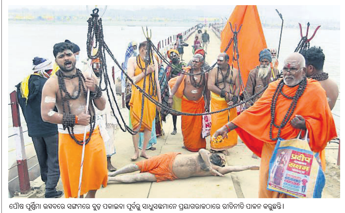
ସୌଖ ପୂର୍ଣ୍ଣିମା ଉତ୍ସବରେ ସଙ୍ଗମରେ ବୁଡ଼ ପକାଇବା ପୂର୍ବରୁ ସାଧୁସଙ୍ଗମାନେ ପ୍ରୟାଗରାଜଠାରେ ରାତିନାତି ପାଳନ କରୁଛନ୍ତି।

ନୂଆଦିଲ୍ଲୀ, ୧୭।୧ (ପି.ଟି.): କୋଣାର୍କ ବ୍ୟକ୍ତିକ ବିନା ସମମତରେ ତାକୁ କୋଭିଡ୍ ଚିକା ଦିଆଯାଇପାରିବ ନାହିଁ। ସ୍ଵାସ୍ଥ୍ୟ ମନ୍ତ୍ରଣାଳୟ ସମସ୍ତ ଜାରି ହୋଇଥିବା କୋଭିଡ୍-୧୯ ଚିକା ଗାନ୍ଧିଜୀନଗରରେ ବାଧ୍ୟତାମୂଳକ ଚିକାକରଣ କଥା କୁହାଯାଇନାହିଁ ବୋଲି କେନ୍ଦ୍ର ସରକାର ସୋମବାର ସୁପ୍ରିମକୋର୍ଟଙ୍କୁ ଜଣାଇଛନ୍ତି। ଭାରତରେ ଚିକାକରଣ କାର୍ଯ୍ୟକ୍ରମ ବିଶ୍ଵରେ ସର୍ବୁତ୍ତମ ୨୦୨୨ ଜାନୁଆରୀ ୧୧ ସୁଦ୍ଧା ଦେଶରେ ୧,୫୨,୫୩,୬୦୨ ତୋଳୁ ଚିକା ଦିଆଯାଇଥିବା ସ୍ଵାସ୍ଥ୍ୟ ମନ୍ତ୍ରଣାଳୟ ସତ୍ୟପାଠରେ ଉଲ୍ଲେଖ କରିଛନ୍ତି। କୋଣାର୍କ ଉଦ୍‌ଘୋଷଣା ପାଇଁ ଚିକା ସାର୍ବିକେନ୍ଦ୍ର ନେବାକୁ ବାଧ୍ୟତାମୂଳକ କରାଯାଇ ନ ଥିବା କେନ୍ଦ୍ର ସରକାର କହିଛନ୍ତି। ଘରକୁ ଘର ଯାଇ ଚିକା ଦେବା ଏବଂ ଭିକ୍ଷାମୁଖୀ ଚିକାକରଣରେ ପ୍ରାଥମିକତା ଦେବା ଲାଗି ଏଭାରି ଫାଉଣ୍ଡେଶନ ନାମକ ଏନଡିଏ ପକ୍ଷରୁ ସୁପ୍ରିମକୋର୍ଟରେ ଆବେଦନ କରାଯାଇଥିଲା। ମହାମାରୀ ସ୍ଥିତିକୁ ନିରାକରଣ ରଖି ବୃହତର ଜନସଂଖ୍ୟାକୁ ଚିକାକରଣ କରାଯାଇ ବୋଲି ସ୍ଵାସ୍ଥ୍ୟ ମନ୍ତ୍ରଣାଳୟ ସତ୍ୟପାଠରେ ଉଲ୍ଲେଖ କରିଛି।