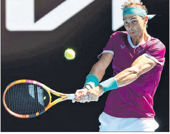
ଶର୍ ଖେଳିବା ଅବସରରେ ରାଫାଲ ନାଡ଼ାଲ।

ବିଶ୍ୱର ନୟର ଓଡ଼ିଆ ପୁରୁଷ ଟେନିସ୍ ଖେଳାଳି ସର୍ବିୟାର ନୋଭାକ ଜୋକୋଭିଚ୍‌ଙ୍କ ବିନା ଯୋଗଦାନ ଅଷ୍ଟ୍ରେଲିଆ ଓପନ ଗ୍ରାଣ୍ଡସ୍ଲାମ ଟେନିସ୍ ଆରମ୍ଭ ହୋଇଛି। କରୋନା ଟିକା ନେଇ ନ ଥିବାରୁ ଏକ ନାଟକୀୟ ଘଟଣାକ୍ରମରେ ବିତାୟ ଅଥ ପାଇଁ ଭିକା ବାଟିଲ ପରେ ଜୋକୋଭିଚ୍‌ଙ୍କୁ ସ୍ୱଦେଶ ପ୍ରତ୍ୟାବର୍ତ୍ତନ କରିଛନ୍ତି। ମହିଳା ସିଙ୍ଗଲ୍‌ରେ ଜାପାନର ନାଓମି ଓସାକା ଓ ପୁରୁଷରେ ହେନ୍‌ଡ୍