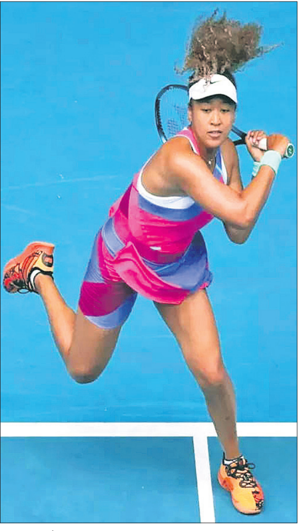
ମେଲବୋର୍ନ: ଅଷ୍ଟ୍ରେଲିଆ ଓପନ ଗ୍ରାଣ୍ଡସ୍ଲାମ ଟେନିସ ମହିଳା ସିଙ୍ଗଲ୍ ପ୍ରଥମ ରାଉଣ୍ଡରେ ଯୋଗଦାନ କାମିଲା ଓସୋରିଓଙ୍କ ବିପକ୍ଷରେ ବିର୍ଟ ଶର୍ ଖେଳୁଛନ୍ତି ଜାପାନର ନାଡ଼ା ଓସାକା।

ଗାଟାନା ମାରିଆଙ୍କୁ ୬-୪, ୬-୬ (୭/୬) ସେନ୍ଦର ମାରିଆ ସିକାରି ହରାଇ ବିତାଣି ରାଉଣ୍ଡରେ ପ୍ରବେଶ କରିଛନ୍ତି। ପୁରୁଷ ସିଙ୍ଗଲ୍ ପ୍ରଥମ ରାଉଣ୍ଡରେ ନାଡ଼ା ଆମେରିକା ମାର୍କୋସ୍ ବିରୋଧୀଙ୍କୁ ୬-୧, ୬-୪, ୬-୨ ସେନ୍ଦରେ ହରାଇଛନ୍ତି। ସେହିପରି ଅନ୍ୟତମ ଟାଇଟଲ ଦାବିଦାର ଆଲେକଜାଣ୍ଡର ଜେଭରେଭ ୬-୭ (୭/୩), ୬-୧, ୬-୬ (୭/୧) ସେନ୍ଦରେ ତାନିଏଲ ଅଲ୍‌ମେନେଙ୍କୁ ହରାଇ ବିତାଣି ରାଉଣ୍ଡରେ ପ୍ରବେଶ କରିଛନ୍ତି। ଅନ୍ୟ ପ୍ରଥମ ରାଉଣ୍ଡ ମ୍ୟାଚ ମଧ୍ୟରେ ଫେଲିସିଆନୋ ଲୋପେଜଙ୍କୁ ୬-୧, ୬-୩, ୪-୬, ୬-୪ ସେନ୍ଦରେ ଜର୍ଜ ମିଲିମ୍ୟାନ, କେଭିନ ଆଣ୍ଡରସନଙ୍କୁ ୬-୩, ୬-୪, ୬-୬ (୭/୩) ସେନ୍ଦରେ ରିଲି ଓପେଲକା, ଫାବିଓ ଫୋଗନିନିଙ୍କୁ ୬-୧, ୬-୪, ୬-୪ ସେନ୍ଦରେ ଟାଲାନ ଗ୍ରାଣ୍ଡସ୍ଵର, କାମେରନ ନୋରିଙ୍କୁ ୬-୩, ୬-୦, ୬-୪ରେ ସେବାଷ୍ଟିଆନ କୋର୍ଡା, ଫେଡେରିକୋ କୋରିଆଙ୍କୁ ୬-୧, ୬-୧, ୬-୩ ସେନ୍ଦରେ ଗାଏଲ ମନପିଙ୍କୁ ପରାସ୍ତ କରିଛନ୍ତି।