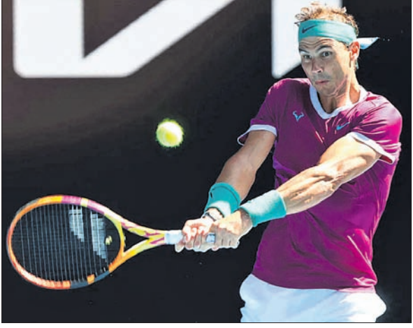
ଶର୍ ଖେଳିବା ଅବସରରେ ରାଫାଲ ନାଡ଼ା।

ବିଶ୍ଵର ନୟର ଓଡ଼ିଆ ପୁରୁଷ ଟେନିସ ଖେଳାଳି ସର୍ବିୟାର ନୋଭାକ ଡଜୋଭିଚିକ୍ ବିନା ଯୋଗଦାନ ଅଷ୍ଟ୍ରେଲିଆ ଓପନ ଗ୍ରାଣ୍ଡସ୍ଲାମ ଟେନିସ ଆରମ୍ଭ ହୋଇଛି। କରୋନା ଟିକା ନେଇ ନ ଥିବାରୁ ଏକ ନାଟକୀୟ ଘଟଣାକ୍ରମରେ ବିତାଣି ପରେ ପାଇଁ ଡଜୋଭିଚିକ୍ ସ୍ଵଦେଶ ପ୍ରତ୍ୟାବର୍ତ୍ତନ କରିଛନ୍ତି। ମହିଳା ସିଙ୍ଗଲ୍‌ରେ ଜାପାନର ନାଡ଼ା ଓସାକା ଓ ପୁରୁଷରେ ସେନ୍ଦର