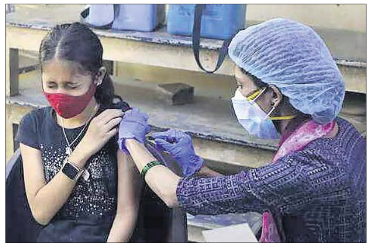
ନୂଆଦିଲ୍ଲୀ, ୧୭।୧ (ପି.ଟି.)

ଏହାର ୨୮ ଦିନ ପରେ ଦ୍ଵିତୀୟ ଡୋଜ୍ ନେବେ। କିଶୋରାକିଶୋରମାନେ ଖୁବ୍ ଆଗ୍ରହର ସହ ଟିକାଦାନ କାର୍ଯ୍ୟକ୍ରମରେ ନିଜକୁ ସାମିଲ କରୁଥିବାରୁ ଫେବୃୟାରୀ ଶେଷ ସୁଦ୍ଧା ସେମାନଙ୍କୁ ଦ୍ଵିତୀୟ ଡୋଜ୍ ଟିକା ଦିଆଯିବ ବୋଲି ଏନ୍ଟିଏଡିଆଇ ଅଧ୍ୟକ୍ଷ ଆଶାବ୍ୟକ୍ତ କରିଛନ୍ତି। ଏହା ପରେ ୧୨ରୁ ୧୪ ବର୍ଷ ବୟସବର୍ଗର ପିଲାଙ୍କୁ ଟିକା ଦେବା ଲାଗି ସରକାର ନିର୍ଦ୍ଦେଶ ଦେବେ। ଏହି ବର୍ଗରେ ପ୍ରାୟ ୭.୫ କୋଟି ପିଲା ରହିଛନ୍ତି। ଦେଶରେ ୨୪ ଘଣ୍ଟା ମଧ୍ୟରେ ୩୯ ଲକ୍ଷରୁ ଊର୍ଦ୍ଧ୍ଵ ଡୋଜ୍ ଟିକା ଦିଆଯାଇଛି। ଏହାକୁ ମିଶାଇ ସୋମବାର ସକାଳ ସୁଦ୍ଧା ଦେଶରେ ମୋଟ ଟିକାଦାନ ୧୫୭.୨୦ କୋଟି ପୁଷ୍ପା-୪