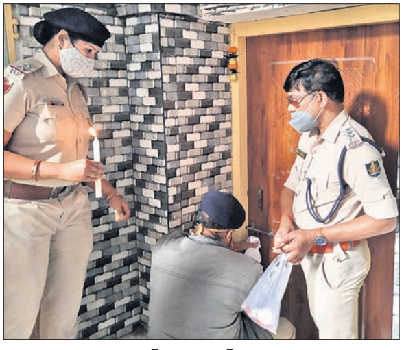
ଆଲ୍‌ଫା ହେଲ୍‌ଥ କେୟାରକୁ ସିଲ୍ କରାଯାଇଛି।