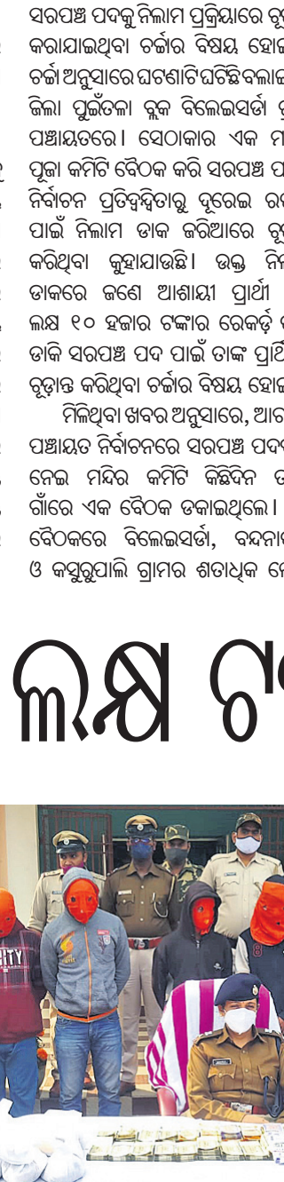
ରାସୋଳ ଗ୍ରାମ୍ୟ ବ୍ୟାଙ୍କ ଡକାୟତି ରହସ୍ୟ ଉନ୍ମୋଚିତ

ଦୁର୍ଘଟଣାରେ ଲାଗୁ ଉଦ୍ଦେଶ୍ୟ ଦୁର୍ଘଟଣାରେ ଲାଗୁ ଉଦ୍ଦେଶ୍ୟ ଦୁର୍ଘଟଣାରେ ଲାଗୁ ଉଦ୍ଦେଶ୍ୟ