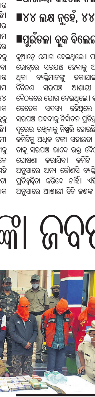
୯ ଅଭିଯୁକ୍ତ ଗିରଫ, ୨ ଫେରାର

ଦୁର୍ଘଟଣାରେ ଲାଗୁ ଉଦ୍ଦେଶ୍ୟ ଦୁର୍ଘଟଣାରେ ଲାଗୁ ଉଦ୍ଦେଶ୍ୟ ଦୁର୍ଘଟଣାରେ ଲାଗୁ ଉଦ୍ଦେଶ୍ୟ