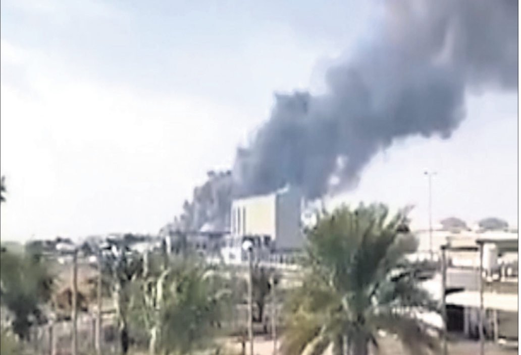
ଆବୁଧାବିରୁ ଅଞ୍ଚଳୀୟ ବିମାନବନ୍ଦ ପରିସରରେ ତ୍ରୋନ୍ ଆକ୍ରମଣ ପରେ ଧୂଆଁ ଉଠୁଛି।

ନିଜକୁ ଗୁଳି ମାରିଲେ ଯବାନ ଦୁର୍ଘଟଣାରେ ଲାଗୁ ଉଦ୍ଦେଶ୍ୟ ଦୁର୍ଘଟଣାରେ ଲାଗୁ ଉଦ୍ଦେଶ୍ୟ