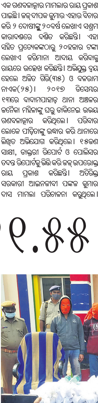
ଖବରଦାତା ସମ୍ମିଳନୀରେ ଏସ୍ପି ତକାୟତ ଉପସ୍ଥାପନ କରୁଥିବା ସମସ୍ତଙ୍କର ସହଯୋଗୀ ସୂଚନା ଦେଉଛନ୍ତି।

ଦୁର୍ଘଟଣାରେ ଲାଗୁ ଉଦ୍ଦେଶ୍ୟ ଦୁର୍ଘଟଣାରେ ଲାଗୁ ଉଦ୍ଦେଶ୍ୟ ଦୁର୍ଘଟଣାରେ ଲାଗୁ ଉଦ୍ଦେଶ୍ୟ