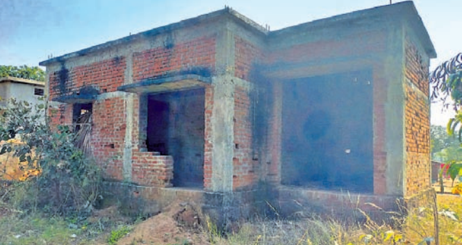
ଅଧ୍ୟାପକ ଶିକ୍ଷା ପତି ରହିଥିବା ପ୍ରାଣୀଧନ ନିରୀକ୍ଷଣ କେନ୍ଦ୍ର।