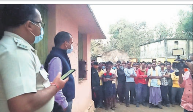
ଏଡିଏମ୍ ମହାପାତ୍ର ଓ ଏସ୍‌ଡିଏମ୍ ଟୋପାନ୍ ବାଗ ବୟାନ ରେକର୍ଡ କରିବାକୁ ଜନସାଧାରଣଙ୍କୁ ଆହ୍ୱାନ କରୁଛନ୍ତି।

ପହଞ୍ଚି ଘଟଣାର ତଦନ୍ତ କରିଥିଲେ। ତଦନ୍ତ ବେଳେ ଆଶାୟୀ ପ୍ରାର୍ଥୀ ଏବଂ ପୁଲିସ୍‌ରୁ ବିଡିଏ ଓ ତଥା ଡିଏମ୍‌ରୁ ଅଧିକାରୀଙ୍କୁ ମୁହଁରେ ନାଏକ ମଙ୍ଗଳବାର ବିଲେଇପତା ପଞ୍ଚାୟତ ଅଧିକାରୀ