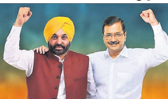
ଭଗଓଡ଼ ମାନ୍ ସହ ଅଭିନବ କେନ୍ଦ୍ରୀୟମାନ

ମୋହାଲି, ୧୮୧ ପଞ୍ଚାବରେ ଆମ୍ଭ ଆଦମା ପାର୍ଟି (ଏଏସି) ପକ୍ଷରୁ ଦଳୀୟ ଏଏସି ଭଗଓଡ଼ ମାନ୍ ମୁଖ୍ୟମନ୍ତ୍ରୀ ପ୍ରାର୍ଥୀ କରାଯାଇଛି।