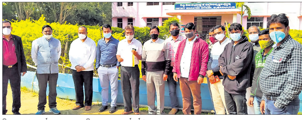
ଶିକ୍ଷାଧିକାରୀଙ୍କ କାର୍ଯ୍ୟାଳୟ ସମ୍ମୁଖରେ ବିଦ୍ୟାଳୟ ସଂଘ କର୍ମକର୍ତ୍ତା।

ସ୍ୱୟମ୍ଭୁପୁର ଜିଲ୍ଲା ବେସରକାରୀ ବିଦ୍ୟାଳୟ ସଂଘ ପକ୍ଷରୁ ମଙ୍ଗଳବାର ଜିଲ୍ଲା ଶିକ୍ଷା ଅଧିକାରୀଙ୍କୁ ଭେଟି ଆରେ ମୁଖ୍ୟମନ୍ତ୍ରୀ ନବୀନ ପଟ୍ଟନାୟକଙ୍କ ଉଦ୍ଦେଶ୍ୟରେ ସ୍ୱାଧୀନ ପଢ଼ାବହି ପ୍ରଦାନ କରାଯାଇଛି।