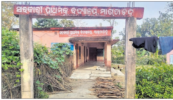
ବନ୍ଦ ଥିବା ମାଗତାଚଢ଼ି ପ୍ରାଥମିକ ବିଦ୍ୟାଳୟ।

ମଧ୍ୟ କିଛି ପୁସ୍ତକ ମିଳି ପାରିନାହିଁ। ଗାଁରେ ଲାଗି ରହିଥିବା ସମସ୍ୟାର ଚୁଚୁଟି ସମାଧାନ ନ ହେଲେ ପଞ୍ଚାୟତ ନିର୍ବାଚନରେ ଭୋଟବର୍ଜନ କରିବେ ବୋଲି ଗ୍ରାମବାସୀ ଚେତାବନୀ ଦେଇଛନ୍ତି।