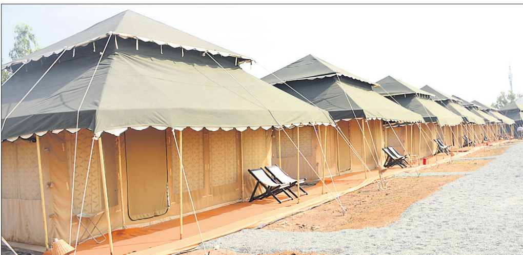
ପର୍ଯ୍ୟଟକଙ୍କ ପାଇଁ ହୋଇଥିବା କଟକଟୁ ବ୍ୟବସ୍ଥା।

ଡିସେମ୍ବର ୧୫ରୁ ରାଜ୍ୟର ଅନ୍ୟ ୬ ସ୍ଥାନ ସହିତ ସମ୍ବଲପୁର ଜିଲ୍ଲା ହାରାକୁଦ ଜଳଭଣ୍ଡାର ତଟ ବଳବତ୍ତର ଗ୍ରାମରେ ଇକୋ ରିଟ୍ରିଟ୍ ଆରମ୍ଭ ହୋଇଥିଲା। ମୁଖ୍ୟମନ୍ତ୍ରୀ ନବୀନ ପଟ୍ଟନାୟକ ଉଦ୍ଦେଶ୍ୟରେ ଇତିପା ବାଣୀ ଦେଇ ଏହାକୁ ଉଦ୍‌ଘାଟନ କରିଥିଲେ। ଗତବର୍ଷଠାରୁ ଏବର୍ଷ ଅଧିକ ପର୍ଯ୍ୟଟକ ଆସିବେ ବୋଲି ଜିଲ୍ଲା ପର୍ଯ୍ୟଟନ ବିଭାଗ ଆଶା ରଖିଥିଲା। ହେଲେ ଆରମ୍ଭ ହେବାର ଏକମାସ ବିତିଯାଇଥିଲେ ମଧ୍ୟ ଆଶାପୂର୍ଣ୍ଣ ପର୍ଯ୍ୟଟକ ଆସିନାହାନ୍ତି। ଡିସେମ୍ବର ୧୫ରୁ ଜାନୁଆରୀ ୧୫ ଭିତରେ ୧୦ ପ୍ରତିଶତରୁ କମ୍ କଟକଟୁ ବୁକ୍ ହୋଇଛି।