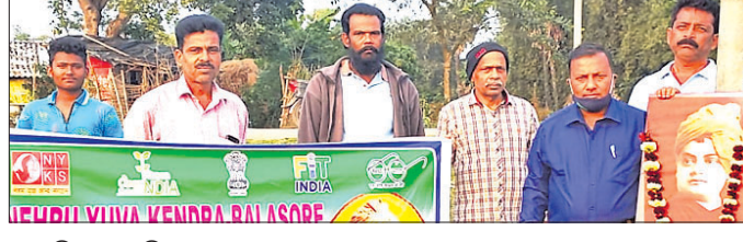
ବାହାରି ଥିବା ଶାନ୍ତି ପଦଯାତ୍ରା।