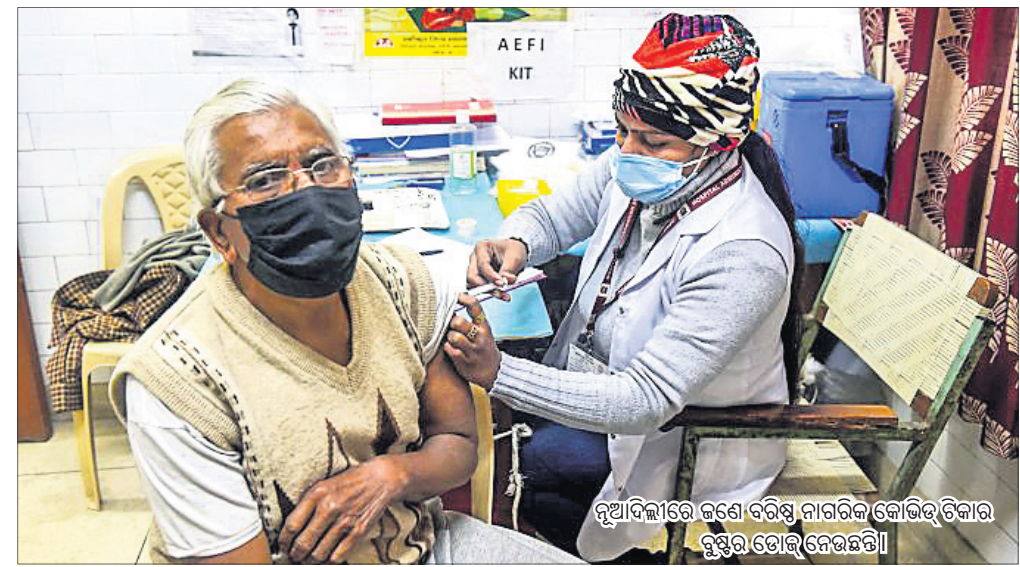
ନୂଆଦିଲ୍ଲୀରେ ଜଣେ ବରିଷ୍ଠ ନାଗରିକ କୋଭିଡ୍ ଚିକିତ୍ସା ଗୁରୁତ୍ୱ ଦେଇଛନ୍ତି । ବ୍ୟାପକ ଯୋଜନା ପ୍ରସ୍ତୁତ କରିବା ଲାଗି ଗତ ମାସ ୨୬ରେ ସାମ୍ବଲ ମନ୍ତ୍ରଣାଳୟ ରାଜ୍ୟଗୁଡ଼ିକୁ ପରାମର୍ଶ ଦେଇଥିଲା । ଅଭିସିଏମ୍‌ଆର୍ ପୋର୍ଟାଲକୁ ଜଣାପଡ଼ିଛି । ମନଜିଆ ଔଷଧ ବ୍ୟବହାର ନ