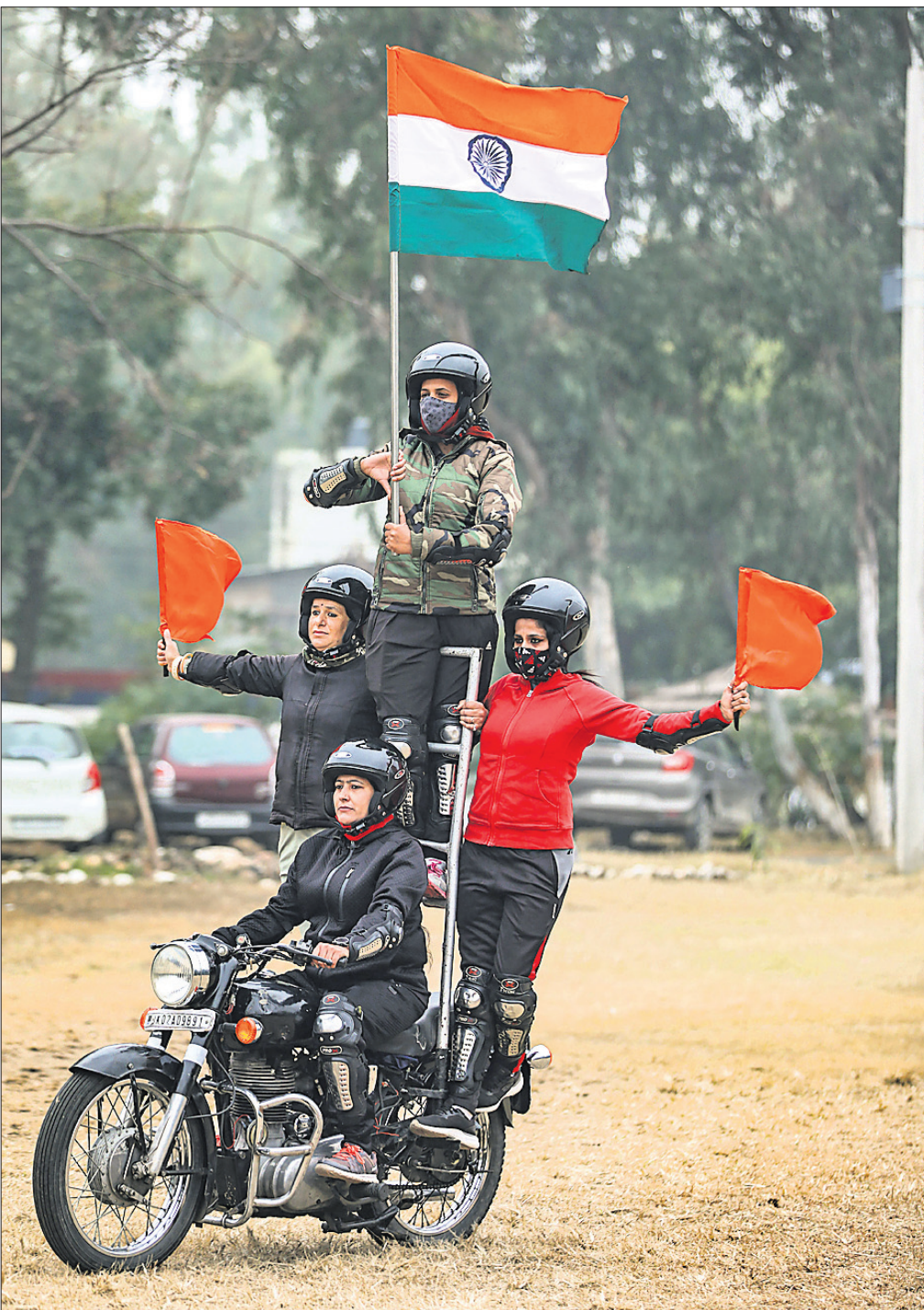
ଜନ୍ମରେ ଆସନ୍ତା ସାଧାରଣତନ୍ତ୍ର ଦିବସ ପାଳନ ପାଇଁ ମଙ୍ଗଳବାର ଜନ୍ମ-କର୍ମାଣ୍ଡ ପୋଲିସର ମହିଳା ଡେୟାରଡେଭିଲ୍ସ ମୋଟରସାଇକଲ ଷ୍ଟ୍ରିଟ ଅଭିଯାନ।