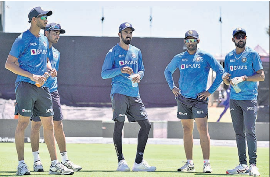
ପଲ୍ଠାରେ ମଙ୍ଗଳବାର ଅଭ୍ୟାସ ଅବସରରେ ଭାରତୀୟ ଖେଳାଳି।

ମ୍ୟାଚ୍ ଆରମ୍ଭ: ଅପରାହ୍ଣ ୨ଟା ସ୍ଥାନ: ବୋଲାଣ୍ଡ ପାର୍କ, ପଲ୍ ସିଧା ପ୍ରସାରଣ: ଷ୍ଟାର୍ ସ୍ପୋର୍ଟ୍ସ