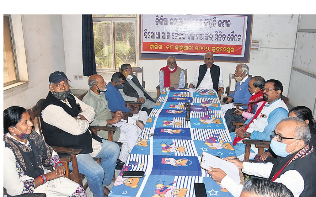
ବୈଠକରେ ଉପସ୍ଥିତ ବିଭିନ୍ନ ଦଳର ନେତୃତ୍ଵର।

ଭୁବନେଶ୍ଵର, ୧୮୧୧(ବୁଧବାର) ଡିଜିଆରେ ପୋଲିସ୍ ଅତ୍ୟାଚାର ବନ୍ଦ ପାଇଁ ୧୩ଟି ବିରୋଧୀ ଦଳ ମିଳିତ ଭାବେ ଦାବି କରିଛନ୍ତି। ଏହି ମିଳିତ ଦଳର ପ୍ରତିନିଧିମାନେ ଖୁବ୍ ଶୀଘ୍ର ରାଜ୍ୟପାଳଙ୍କୁ ଭେଟିବା ସହ ଆସନ୍ତା ୨୧ ତାରିଖରେ ଡିଜିଆ ଅଞ୍ଚଳ ଗସ୍ତ କରିବା ପାଇଁ ନିଷ୍ପତ୍ତି ନେଇଛନ୍ତି। ମଙ୍ଗଳବାର ଭୁବନେଶ୍ଵର ଠାରେ ୧୩ଟି ରାଜନୈତିକ ଦଳଙ୍କୁ ନେଇ ଏକ ମିଳିତ ବୈଠକ ଅନୁଷ୍ଠିତ ହୋଇଥିଲା। ଏଥିରେ ଏହି ରାଜନୈତିକ ଦଳର ନେତୃତ୍ଵ ସହ ଯୋଗଦେଇ କହିଥିଲେ, ଡିଜିଆରେ ମାନବିକ ଅଧିକାର ଓ ସ୍ଵାଭାବିକ ଜୀବନ ଯାତ୍ରା ଭୁଲୁଣ୍ଡିତ ହୋଇଛି। ପୋଲିସ୍ ଓ ସରକାରୀ ଦଳର ଗୁଣ୍ଡାକ