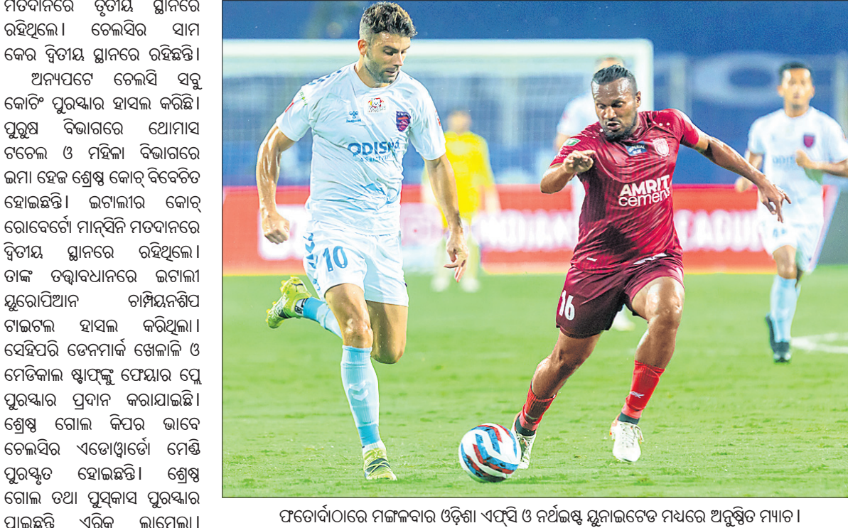
ଫର୍ଡୋର୍ନାଠାରେ ମଙ୍ଗଳବାର ଓଡ଼ିଶା ଏଫ୍ସି ଓ ନର୍ଥଇଷ୍ଟ ୟୁନାଇଟେଡ୍ ମଧ୍ୟରେ ଅନୁଷ୍ଠିତ ମ୍ୟାଚ୍।

ପୁରସ୍କୃତ ହୋଇଛନ୍ତି। ପୁଟୋଲାସ୍ଫିଙ୍କ ନେତୃତ୍ଵରେ ବାର୍ସିଲୋନା ପ୍ରଥମ ମହିଳା ଚାମ୍ପିୟନ୍ ଲିଗ୍ ଚାଳଚଳ ହାସଲ କରିଥିଲା। ତାଙ୍କ ଟିମ୍‌ମେଟ୍ ଜେନିଫର ହେରମୋସୋ ପୁରସ୍କାର ପାଇଁ ହୋଇଥିବା ମତବାନରେ ତୃତୀୟ ସ୍ଥାନରେ ରହିଥିଲେ। ତେଣୁ ସେ ଟିମ୍‌ର ସର୍ବୋତ୍ତମ ସଦସ୍ୟ ଭାବେ ଚିହ୍ନିତ ହୋଇଛନ୍ତି। ଅନ୍ୟପଟେ ଚେଲସି ସିଟି କୋଟି ପୁରସ୍କାର ହାସଲ କରିଛି। ପୁରୁଷ ବିଭାଗରେ ଥୋମାସ ଟବେଲ ଓ ମହିଳା ବିଭାଗରେ ଜମା ହେଉ ଶ୍ରେଷ୍ଠ କୋର୍ଟ ବିବେଚିତ ହୋଇଛନ୍ତି। ଇଟାଲୀର କୋର୍ ଭୋବେର୍ଡୋ ମାନ୍‌ସିନି ମତବାନରେ ବିତୀୟ ସ୍ଥାନରେ ରହିଥିଲେ। ତାଙ୍କ ଚତ୍ଵାବଧାନରେ ଇଟାଲୀ ଯୁରୋପିଆନ୍ ଚାମ୍ପିୟନ୍‌ସିପ ଚାଳଚଳ ହାସଲ କରିଥିଲା। ସେହିପରି ଡେନମାର୍କ ଖେଳାଳି ଓ ମେଡିକାଲ ଷ୍ଟାଫ୍‌ସ୍ମେନ୍‌ସ୍ମେନ୍ ପୁରସ୍କାର ପ୍ରଦାନ କରାଯାଇଛି। ଶ୍ରେଷ୍ଠ ଗୋଲ କିପର ଭାବେ ଚେଲସିର ଏଡୋୟାର୍ଡୋ ମେଣ୍ଡି ପୁରସ୍କୃତ ହୋଇଛନ୍ତି। ଶ୍ରେଷ୍ଠ ଗୋଲ ତଥା ପୁରସ୍କାର ପାଇଛନ୍ତି ଏରିକ୍ ଲାମେଲା।