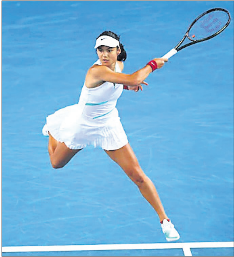
ଅଷ୍ଟ୍ରେଲିଆନ ଓପନ ଗ୍ରାଣ୍ଡସ୍ଲାମ ମହିଳା ସିଙ୍ଗଲ୍ ପ୍ରଥମ ରାଉଣ୍ଡ ମ୍ୟାଚ ଅବସରରେ ଜମା ରାଜୁକାନ୍ତୁ।

ନୂଆଦିଲ୍ଲୀ, ୧୮୧(ପି.ଟି.): ଆସନ୍ତା ମେ-ଜୁନରେ ହେବାକୁଥିବା ଏସଫିଏ କପରେ ଆଇ-ଲିଗ୍ ଚାମ୍ପିୟନ ଗୋକୁଳନ କେରଳ ଏସଫିଏ ପ୍ରଥମ ଥର ଭାଗନେବ। ଯୋଗଦାନ କୁଆଲାଲମ୍ପୁରଠାରେ ଅନୁଷ୍ଠିତ ଡ୍ର ଅନୁସାରେ ଦଳକୁ ପ୍ରତିଯୋଗିତାର ଗ୍ରୁପ୍ ଡି'ରେ ସ୍ଥାନ ମିଳିଛି। ଏହି ଗ୍ରୁପ୍‌ରେ ବାଂଲାଦେଶର ବସୁନ୍ଦରା କିଙ୍କୁ ଓ ମାଜିସ୍ତା ସୋର୍ଡ୍ ଏବଂ ବିକ୍ରିଏଶନ ଅଫ୍ ମାଲଦିଭୁ ଟିମ୍ ମଧ୍ୟ ସ୍ଥାନ ପାଇଛନ୍ତି। ଗୋକୁଳନ କେରଳ ଏସଫିଏ ସହିତ ଗ୍ରୁପ୍ ଡି'ରେ ଯୋଗଦାନ କରିବା ଲାଗି ଉକ୍ତିଆର ସୁପର ଲିଗ୍ (ଆଇଏସ୍‌ଏଲ)ର ଗତ ସିଜନ ରନର୍ସଅପ୍ ଏଟିକେ ମୋହନବାଗାନ ପାର୍ଟି ଏକ ସୁଯୋଗ ରହିଛି। ଏହି ଦଳକୁ ଏସଫିଏ କପର ପ୍ରତିମିନାରି ଓ ପ୍ଲେ-ଅଫ୍ ମ୍ୟାଚ୍‌ଗୁଡ଼ିକରେ ବିଜୟ ଲାଭ କରିବାକୁ ହେବ। ଏହି ପ୍ରତିମିନାରି ଓ ପ୍ଲେ-ଅଫ୍ ମ୍ୟାଚ୍‌ଗୁଡ଼ିକ ଏପ୍ରିଲରେ ଅନୁଷ୍ଠିତ ହେବ।