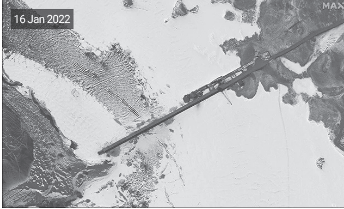
ସେତୁ ନିର୍ମାଣର ସାତେଲାଇର୍ ଚିତ୍ର । ଦେବଦ୍ୱୀ ଦକ୍ଷିଣକୁ ବ୍ରିଜ୍ ନିର୍ମାଣ ହୋଇଛି । ଶୀତ ଦିନ ଶେଷ ହୁଏ ସେତୁ କାମ ଶେଷ କରିବାକୁ ଚାଉନା ଗାର୍ଗେଟ୍ ରଖିଛି । ଜାନୁଆରୀ ୧୬ରୁ ସଂକ୍ରମଣ ସାତେଲାଇର୍ ଚିତ୍ର ଅନୁସାରେ, ସେତୁ ନିର୍ମାଣ କରୁଥିବା ଚାଉନା ଶ୍ରମିକମାନେ ପିଲାରୁଟିକୁ ଯୋଡ଼ିବା ପାଇଁ ଭାରୀ କ୍ରେନ ବ୍ୟବହାର କରୁଛନ୍ତି । ତେବେ

ନୂଆଦିଲ୍ଲୀ, ୧୮।୧ ପଡ଼ୋଶୀ ଦେଶର ଜମି ହାତେଇବା ଉଦ୍ଦେଶ୍ୟରେ ଚାଉନା ସୀମା ନିକଟରେ ବହୁଦେଶୀୟ ନିର୍ମାଣରେ ମାଟିଛି । ଭାରତ ସୀମା ନିକଟରେ ନିଜକୁ ସୁରକ୍ଷାଦାନ କରିଥିବା ଚାଉନା ସୀମା ନିକଟରେ ଏକ ସେତୁ ନିର୍ମାଣ କାର୍ଯ୍ୟକୁ ତୁରନ୍ତରେ ଆରମ୍ଭ କରାଯାଇଛି । ସାତେଲାଇର୍ ଚିତ୍ରରୁ ଜଣାପଡ଼ିଛି ଯେ, ଏହି ବ୍ରିଜ୍ ଏବେ ପ୍ରାୟ ୪୦୦ ମିଟରରୁ ଅଧିକ ଦୀର୍ଘ ପର୍ଯ୍ୟନ୍ତ ଲମ୍ବିଯାଉଛି । ଏହାର ଚଉଡ଼ା ପ୍ରାୟ ୮ ମିଟର ରହିଥିବାବେଳେ ପାଞ୍ଜୋଙ୍ଗର ଉତ୍ତରତଟରେ ଚାଉନା ଆର୍ମି