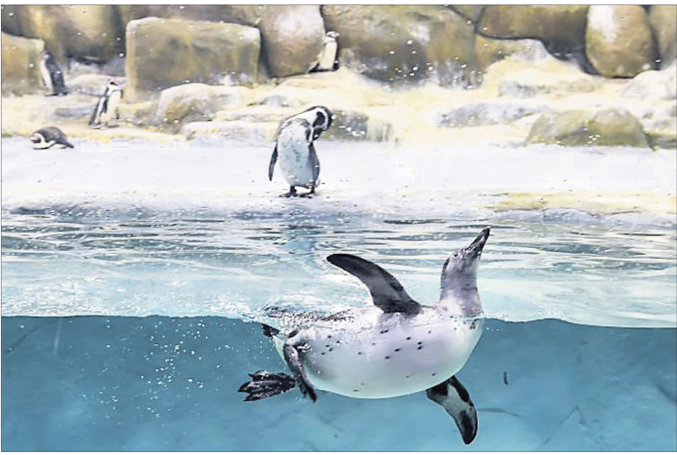
ପୂର୍ଣ୍ଣାଙ୍ଗ ବାଲୁକା ଚିଡ଼ିଆଖାନାରେ ୫ ମାସର ପେଲୁଇନ୍ ଶାବକ ସଫଳତା କରୁଛି ।

ଭାରିସିଂହ, ୧୮।୧ (ପି.ଟି.): ଚଳିତ ବର୍ଷ ମହାମାରୀରୁ ଆରୋଗ୍ୟ ଲାଭର ବାସ୍ତବ ମୁହୂର୍ତ୍ତ ହେଉ ବୋଲି କାଟିସଂଘ ମହାସଚିବ ଆଶୋକ୍ ନିଃ ଗୁଡ଼େରେସ୍ ସୋମବାର ବିଶ୍ୱ ନେତାମାନଙ୍କୁ ଆହ୍ୱାନ ଦେଇଛନ୍ତି । କୋଭିଡ୍-୧୯ ମୁକାବିଲା ପାଇଁ ସମାଜର ଉପରେ ସେ ଗୁରୁତ୍ୱାରୋପ କରିଛନ୍ତି । ସମସ୍ତଙ୍କୁ ଚିକାଦାନରେ ବିଫଳ ହେଲେ ପୁଣି ନୂଆ ଭାରିଆଣ୍ଟ ଆସିବ ଏବଂ ଅର୍ଥନୀତି ଅବକ୍ଷିପ୍ତ ହେବ । ସେ ସତର୍କ କରାଇଛନ୍ତି । ବିଶ୍ୱ ଅର୍ଥନୀତି ଫୋରମ୍ (ଡିଏଫ୍.ଏସ୍.ଏଫ୍)ର ଭର୍ଚୁଆଲ୍ ସମିତିରେ ଉଦ୍‌ଘୋଷଣା ଦେଇ ଗୁଡ଼େରେସ୍ କହିଥିଲେ, ଗତ ଦୁଇବର୍ଷ ବିଶ୍ୱ ସାଧାରଣ କିଛି ଜୟନ୍ତୀ ସତ୍ୟର ସାମନା କରିଛି । କାହାକୁ ଅଣଦେଖା ନ କରିବା ଲାଗି ସେ ପରାମର୍ଶ ଦେଇଛନ୍ତି ।