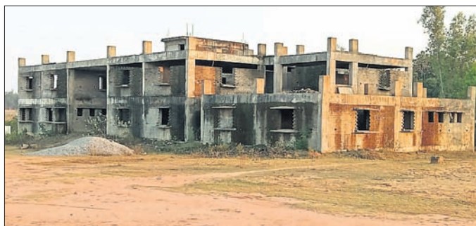
ଅଧୀନପତ୍ରିଆ ହୋଇ ପଡ଼ିଥିବା କଲେଜ ହଷ୍ଟେଲ।

ନବରଙ୍ଗପୁର ଜିଲ୍ଲା ରାଇଘର ବ୍ଲକ୍ ସଦର ମହକୁମାସ୍ଥିତ ପଞ୍ଚାୟତ ସମିତି ମହାବିଦ୍ୟାଳୟରେ ଏକ ହଷ୍ଟେଲ ଗୃହ ଅଧୀନପତ୍ରିଆ ହୋଇପଡ଼ିଛି। ୪ବର୍ଷ ତଳେ ଏହାର ନିର୍ମାଣ କାମ ଆରମ୍ଭ ହୋଇଥିଲା। ଉକ୍ତ ଗୃହ ଏବେ ମନୁଆଲ୍ ଆଣ୍ଡ ଓଡ଼ିଆ ଗାୟକମାନଙ୍କ ପାଇଁ ଉଦ୍ଦିଷ୍ଟ। କଲେଜ କ୍ୟାମ୍ପସ୍ ପରିସରରେ ଏଭଳି ଅଧିକ କାରବାର ବୃଦ୍ଧି ପାଇଥିବାବେଳେ ଅଞ୍ଚଳବାସୀଙ୍କ ମଧ୍ୟରେ ଏହାକୁ ନେଇ ଅସନ୍ତୋଷ ପ୍ରକାଶ ପାଇଛି। ଆଦିବାସୀ ଅଧିକାଂଶ ଅଞ୍ଚଳରେ ଶିକ୍ଷା