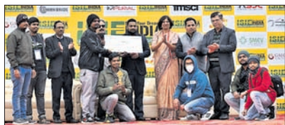
ଜିଆଇଇଟି ଛାତ୍ରଙ୍କୁ ସମ୍ମାନିତ କରାଯାଇଛି।

ଜାତୀୟ ପ୍ରଥମ ପ୍ରତିଯୋଗିତାରେ ଜିଆଇଇଟି ବିଶ୍ୱବିଦ୍ୟାଳୟ ମେକାନିକାଲ ଏବଂ ଇଲେକ୍ଟ୍ରିକାଲ ବିଭାଗ ଛାତ୍ରଙ୍କୁ ସମର୍ଥନା ମିଳିଛି। ବିଶ୍ୱବିଦ୍ୟାଳୟର ସୋସାଇଟି ଅଫ ଅନେମେଟିଭ ଇଞ୍ଜିନିୟରିଂ କ୍ଲବ୍ ପକ୍ଷରୁ ୨୫ ଜଣ ଛାତ୍ର ଜାତୀୟପ୍ରଥମ ପ୍ରତିଯୋଗିତା ଆଇଡେଆର ସିଜନ-୧ରେ ଯୋଗ ଦେଇଥିଲେ। ସେମାନଙ୍କୁ ଇଲେକ୍ଟ୍ରିକାଲ ଭେଇକେଲ ବର୍ଗରେ ବେଷ୍ଟ ଡିଜାଇନ ଆଡ଼ାର୍ଡ ମିଳିଛି। ଏହି ପ୍ରତିଯୋଗିତା କଂଗ୍ରେସିଆଲ ସୋସାଇଟି