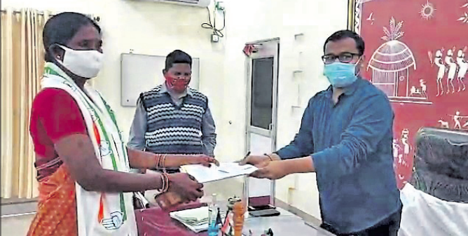
ଉପଜିଲ୍ଲାପାଳଙ୍କ ନିକଟରେ ହାରାବତୀ ଗଣ ପ୍ରାର୍ଥୀପତ୍ର ଦାଖଲ କରୁଛନ୍ତି।