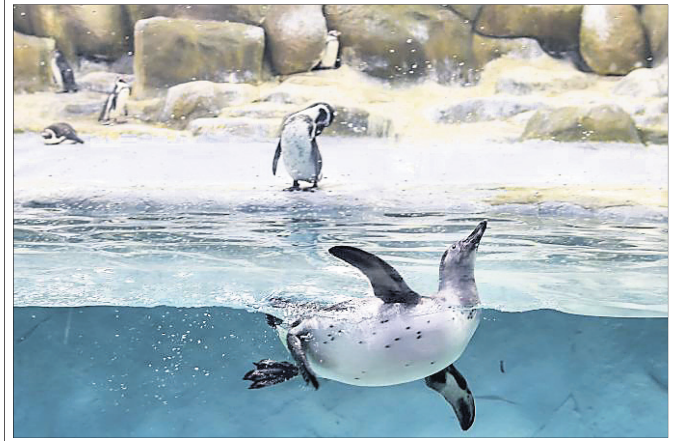
ପୂ୍ୟାଇର ବାଉଳୁଲୀ ତିନିଆଖାନାରେ ୫ ମାସର ପେଲୁଇନ୍ ଶାବକ ସନ୍ତରଣ କରୁଛି।