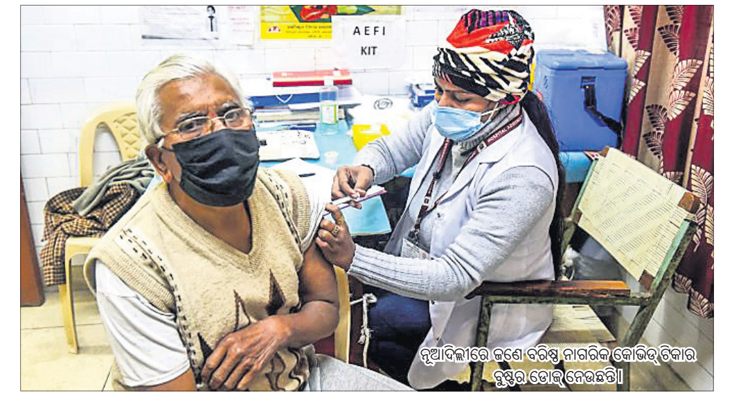
ନୂଆଦିଲ୍ଲୀରେ ଜଣେ ବରିଷ୍ଠ ନାଗରିକ କୋଭିଡ୍ ତିକାର ରୁଷ୍ଟର ତୋଲୁ ନେଉଛନ୍ତି। ବ୍ୟାପକ ଯୋଜନା ପ୍ରସ୍ତୁତ କରିବା ଲାଗି ଗତ ମାସ ୨୬ରେ ସାମ୍ବଲ୍ୟ ମନ୍ତ୍ରଣାଳୟ ରାଜ୍ୟସ୍ତରୀୟ ପରୀକ୍ଷା ଦେଇଥିଲା। ଅଭିଯୋଗପୂର୍ଣ୍ଣ ଘୋରମାତ୍ର ଲଗାପଡ଼ିଛି। ଫଳସ୍ୱରୂପେ ଅଧିକାଂଶ ସ୍ଥାନ ବ୍ୟବହାର ନ