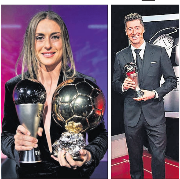
ଆଲେକ୍ସିଆ ପୁଟେଲାସ ଓ ରବର୍ଟ୍ ଲେଫ୍ଟାଣ୍ଡୋସ୍।

ଭୁବନେଶ୍ୱର, ୧୮୧ ପୋଲିକ୍ସ ତାରକା ଯୁବକଲର ତଥା ଦେଉନି ଫୁଲ୍ କିଂ ଫିଫା ଫିଫା ଶ୍ରେଷ୍ଠ ଖେଳାଳି ବିବେଚିତ ହୋଇଛନ୍ତି। ଗତ ବର୍ଷ ମଧ୍ୟ ସେ ଏହି ପୁରସ୍କାର ହାସଲ କରିଥିଲେ। ଏହି କ୍ରମରେ ସେ ଆର୍ଜେଣ୍ଟିନା ଯୁବକଲର ଲିଓନେଲ ମେସି ଓ ଜର୍ଜିଓ ପୁଟବଲର ତଥା ଲିଭରପୁଲ ଫୁଲ୍ ଫିଫା ମହମ୍ମଦ