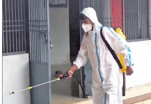
ରୁଣ୍ଡପୁର କୋର୍ଟର ଏକିଜେ, ସବଜେ, ଏସଡିଜେଏମ୍, କୋର୍ଟ ପୋଲିସର ବୁକ୍ ଜଣ ଏବଂ କୋର୍ଟର ବୁକ୍ ଜଣ କର୍ମଚାରୀଙ୍କ ରିପୋର୍ଟ କୋଭିଡ୍ ପଜିଟିଭ୍ ଆସିଥିଲା। ସମସ୍ତଙ୍କୁ ହୋମ୍ ଆଇସୋଲେସନରେ ରହିବାକୁ ଡାକ୍ତର ପରାମର୍ଶ ଦେଇଛନ୍ତି। କିଛିଦିନ ତଳେ କରୋନା ପଜିଟିଭ୍ ଥିବା ରୁଣ୍ଡପୁର ଉପଜିଲ୍ଲାପାଳଙ୍କ ବା.ଏ.ଭ.ଏ.ନ.କୁ ମଧ୍ୟ ସାନିଟାଇଜ୍ କରାଯାଇଛି।

ରାୟଗଡ଼ା ଜିଲ୍ଲା ରୁଣ୍ଡପୁର କୋର୍ଟର ୩ଜଣ ଜଜ୍ଙ୍କ ସମେତ ୭ ଜଣ କରୋନାରେ ଆକ୍ରାନ୍ତ ହୋଇଛନ୍ତି। ଏହାପରେ ଅଗ୍ନିଶମ ବିଭାଗ ପକ୍ଷରୁ ମଙ୍ଗଳବାର କୋର୍ଟ ପରିସରକୁ ସାନିଟାଇଜ୍ କରାଯାଇଛି।