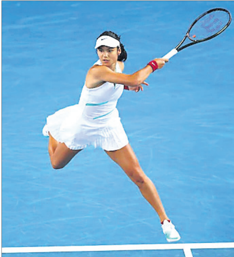
ଅଷ୍ଟ୍ରେଲିଆନ ଓପନ ଗ୍ରାଣ୍ଡସ୍ଲାମ ମହିଳା ସିଙ୍ଗଲ୍ ପ୍ରଥମ ରାଉଣ୍ଡ ମ୍ୟାଚ୍ ଅବସରରେ ଇମା ରାଜୁକାନ୍ତୁ।

ନୂଆଦିଲ୍ଲୀ, ୧୮୧୧(ପି.ଟି.): ଆସନ୍ତା ମେ-ଜୁନରେ ହେବାକୁଥିବା ଏସଫସି କପରେ ଆଇ-ଲିଗ୍ ଚାମ୍ପିୟନ ଗୋକୁଳନ କେରଳ ଏସଫସି ପ୍ରଥମ ଥର ଭାଗନେବ। ଯୋଗଦାନ କୁଆଲାଲମ୍ପୁରଠାରେ ଅନୁଷ୍ଠିତ ଏହି ପ୍ରତିଯୋଗିତାରେ ଗ୍ରୁପ୍ ଡି'ରେ ସ୍ଥାନ ମିଳିଛି। ଏହି ଗ୍ରୁପ୍ରେ ବାଂଲାଦେଶର ବସୁନ୍ଦରା କିଲ୍ଟି ଓ ମାଜିଦ୍ ସୋର୍ଦ୍ଦ୍ ଏବଂ ଚିଲିଏଣର ଅଫ୍ ମାଲିଡିଲ୍ଟି ଚିମ୍ ମଧ୍ୟ ସ୍ଥାନ ପାଇଛନ୍ତି। ଗୋକୁଳନ କେରଳ ଏସଫସି ସହିତ ଗ୍ରୁପ୍ ଡି'ରେ ଯୋଗଦାନ କରିବା ଲାଗି ଉଚ୍ଚିଆନ ସୁପର ଲିଗ୍ (ଆଇଏସ୍ଏଲ)ର ଗତ ସିଜନ ରନର୍ସଅପ୍ ଏଡିକେ ମୋହନବାନାନ ପାଇଁ ଏକ ସୁଯୋଗ ରହିଛି। ଏହି ବଳକୁ ଏସଫସି କପର ପ୍ରତିମିନାରି ଓ ପ୍ରେ-ଅଫ୍ ମ୍ୟାଚ୍‌ଗୁଡ଼ିକରେ ବିଜୟ ଲାଭ କରିବାକୁ ହେବ। ଏହି ପ୍ରତିମିନାରି ଓ ପ୍ରେ-ଅଫ୍ ମ୍ୟାଚ୍‌ଗୁଡ଼ିକ ଏପ୍ରିଲରେ ଅନୁଷ୍ଠିତ ହେବ।