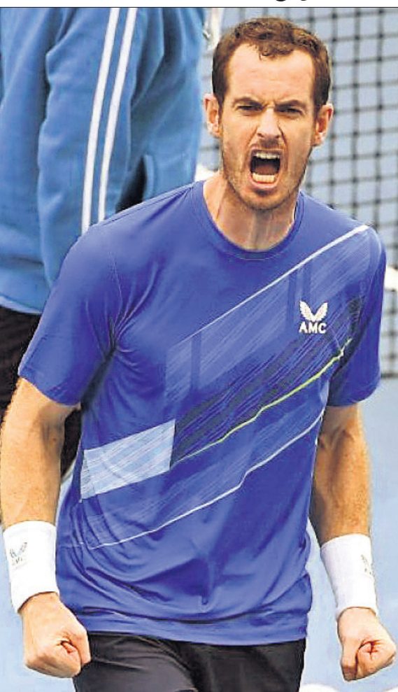
ମ୍ୟାଚ୍ ଜିତିବାପରେ ଆଣ୍ଡି ମୁରେଙ୍କ ପ୍ରତିକ୍ରିୟା।

ଡିଏରୋ ସ୍ଟାକ୍‌ମ୍ୟାନ, ଉଗୋ ହୁର୍ଟୁକ୍ ୩-୬, ୬-୬ (୬/୪), ୬-୬ (୬/୩), ୬-୩ ସେଟ୍‌ରେ ରିଗାର୍ଡ୍ ଗାସ୍‌ଟେ, ଇମିଲିଓ ଗୋମେଜ୍ ୬-୩, ୬-୧, ୬-୨ ସେଟ୍‌ରେ ମାରିନ ସିଲିକ୍ ଏବଂ ଷ୍ଟିଫାନୋ ଗ୍ରାଭାଗଲିଆ ୬-୬ (୬/୨), ୬-୪, ୫-୬, ୬-୧ ସେଟ୍‌ରେ ହରାଇ ଚର୍ଚ୍ଚାବୋଟିଷ୍ଟି ଅଗ୍ର ଡ୍ୱିତୀୟ ରାଉଣ୍ଡରେ ପ୍ରବେଶ କରିଛନ୍ତି। ଅଷ୍ଟ୍ରେଲିଆରେ କରୋନା ଟିକା ନିୟମ ଯୋଗୁ ଦ୍ୱିତୀୟ ଥରପାଇଁ