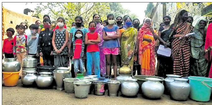
ପ୍ରତିବାଦ କରୁଥିବା ମହିଳାମାନେ।

ନବରଙ୍ଗପୁର ସହରରେ ଥିବା ବିଭିନ୍ନ ସାହିରେ ପାନୀୟ ଜଳର ଉତ୍କଳ ସମସ୍ୟା ଦେଖାଦେଇଛି। ଏହାକୁ ନେଇ ମଙ୍ଗଳବାର ସେନାପତି ସାହି ଖର୍ଚ୍ଚ ନୂ.୧୪୪ ମହିଳାମାନେ ସାହି ରାସ୍ତାରେ ହାଣ୍ଡି, ଗରା ରଖି ପ୍ରତିବାଦ କରିଛନ୍ତି। ଆଜକୁ ପ୍ରାୟ ୩ ବର୍ଷ ହେବ ସାହିକୁ ପିଇବା ପାଣି ଠିକ୍ରେ ଆସୁ ନ ଥିବା ସେମାନେ ଅଭିଯୋଗ କରିଛନ୍ତି। ସାହି ବାସିନ୍ଦାଙ୍କଠାରୁ ପାଣି ବିଲ୍ ବାବଦ ଟଙ୍କା ଜଳ ଯୋଗାଣ ବିଭାଗ ଓ ପୌର ପ୍ରଶାସନ ନେଉଛନ୍ତି। ତଥାପି ମଧ୍ୟ ପାନୀୟ ଜଳ ଠିକ୍ରେ ଯୋଗାଇ ଦିଆଯାଉନି। ଅନେକଥର ବିଭାଗୀୟ ଅଧ୍ୟାପକଙ୍କୁ ଲିଖିତ ଅଭିଯୋଗ କରିଥିଲେ ସୁଦ୍ଧା କୌଣସି ପଦକ୍ଷେପ ନିଆଯାଉ ନ ଥିବା ଅଭିଯୋଗ କରିଛନ୍ତି।