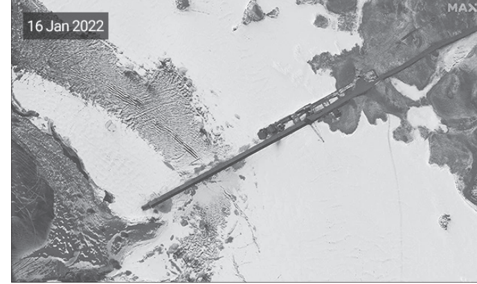
ସେତୁ ନିର୍ମାଣର ସାଚେଲାଲଦ୍ ଚିତ୍ର। ଦେବଦ୍ ଦକ୍ଷିଣକୁ ବ୍ରିଜ୍ ନିର୍ମାଣ ହୋଇଛି। ଶୀତ ଦିନ ଶେଷ ହୁଏ ସେତୁ କାମ ଶେଷ କରିବାକୁ ଚାଉଳନା ଟାର୍ଗେଟ୍ ରଖିଛି। କାନ୍ଥାଆ ୧୨ରୁ ସଂକ୍ରମଣ ସାଚେଲାଲଦ୍ ଚିତ୍ର ଅନୁସାରେ, ସେତୁ ନିର୍ମାଣ କରୁଥିବା ଚାଉଳନା ଶ୍ରମିକମାନେ ପିଲାବର୍ତ୍ତୀକୁ ଯୋଡ଼ିବା ପାଇଁ ଭାରୀ କ୍ରେନ ବ୍ୟବହାର କରୁଛନ୍ତି। ତେବେ

ନୂଆଦିଲ୍ଲୀ, ୧୮।୧: ପଡ଼ୋଶୀ ଦେଶର ଜମି ହାତେଇବା ଉଦ୍ଦେଶ୍ୟରେ ଚାଉଳନା ସୀମା ନିକଟରେ ବହୁଦେଶୀୟ ନିର୍ମାଣରେ ମାତିଛି। ଭାରତ ସୀମା ନିକଟରେ ନିଜକୁ ସୁବିଧାଜନକ ଭିତ୍ତିରେ ରଖିବା ପାଇଁ ବେଙ୍ଗାଳ ପୁର ଲାନ୍ସର ପାଞ୍ଚୋଙ୍ଗ ହ୍ରଦ ଉପରେ ଏକ ସେତୁ ନିର୍ମାଣ କାର୍ଯ୍ୟକୁ ତୁରନ୍ତରେ ଆରମ୍ଭ କରାଯାଇଛି। ସାଚେଲାଲଦ୍ ଚିତ୍ରକୁ ଜଣାପଡ଼ିଛି ଯେ, ଏହି ବ୍ରିଜ୍ ଏବେ ପ୍ରାୟ ୪୦୦ ମିଟରରୁ ଅଧିକ ଦୀର୍ଘ ପର୍ଯ୍ୟନ୍ତ ଲମ୍ବିଯାଉଛି। ଏହାର ଉନ୍ନତ ଗ୍ରାହୀ ୮ ମିଟର ରହିଥିବାବେଳେ ପାଞ୍ଚୋଙ୍ଗର ଉତ୍ତରତଟରେ ଚାଉଳନା ଆମି