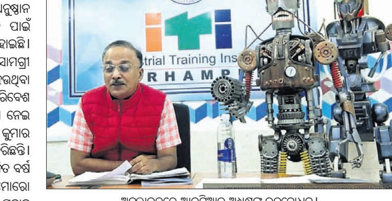
ଅନ୍ୱଳାୟନରେ ଆଇଟିଆଇ ଅଧିକାରୀଙ୍କର ଭବବ୍ୟାପନ।

ଭୁବନେଶ୍ୱର ଶିଳ୍ପ ଚାଳି ମୈତ୍ରୀୟ ଅନୁଷ୍ଠାନ (ଆଇଟିଆଇ) ସ୍ତ୍ରୀ କଳାକୃତି ପାଇଁ ଜାତୀୟ ସ୍ତରରେ ସମ୍ମାନିତ ହୋଇଛି। ଅନୁଷ୍ଠାନ ପକ୍ଷରୁ ଅନୁରୋଧ ସାମଗ୍ରୀ ଓ ବର୍ଦ୍ଧନାକୁ ନେଇ ପ୍ରସ୍ତୁତ ହେଉଥିବା ବିଭିନ୍ନ ସ୍ତ୍ରୀ କଳାକୃତି ପରିଦର୍ଶଣ ପ୍ରଦର୍ଶନୀରେ ସହାୟକ ହୋଇଥିବା ନେଇ କେନ୍ଦ୍ର ପରିଦର୍ଶନୀ ମନ୍ତ୍ରୀ ଅଶ୍ୱିନୀ କୁମାର ତୌରେ ଆଇଟିଆଇକୁ ପ୍ରଶଂସା କରିଛନ୍ତି।