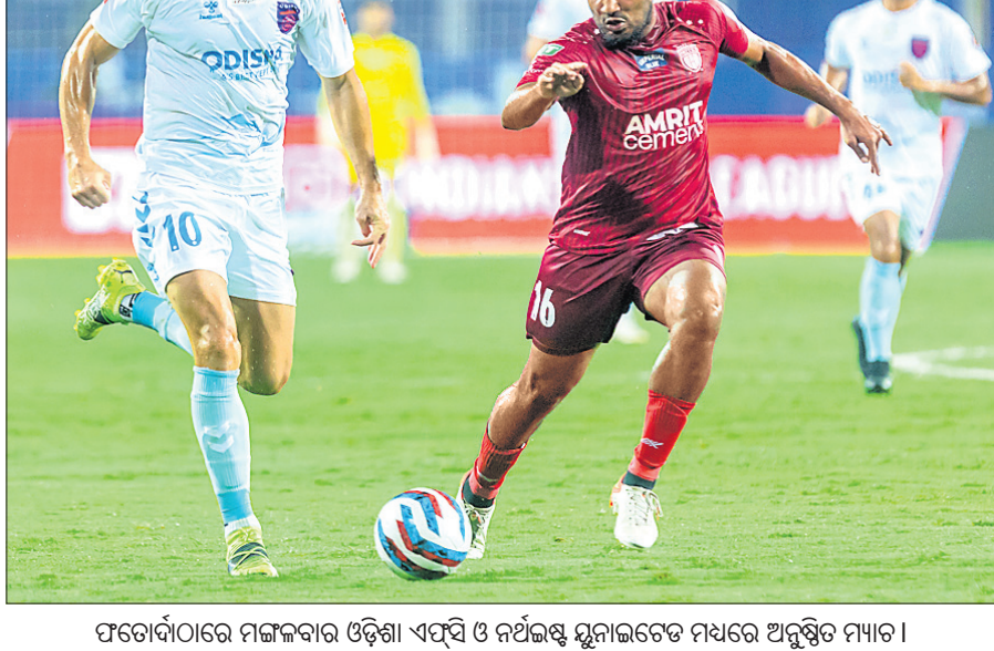
ଫଡୋର୍ଭାଠାରେ ମଙ୍ଗଳବାର ଓଡ଼ିଶା ଏଫ୍ସି ପାଖରେ ନର୍ଥଇଷ୍ଟ ଯୁନାଇଟେଡ ମଧ୍ୟରେ ଅନୁଷ୍ଠିତ ମ୍ୟାଚ।

ଅତିଥି ମିଳିତରେ ତାମିଲ ଲାଲହଲିମପୁଲୁଆ ଓ ୨୨ତମ ମିଳିତରେ ଆରିତାଲ କାଡ୍ରେରା ଗୋଟିଏ ଲେଖାଏ ଗୋଲ ଦେଇଥିଲେ। ଏହି ବିଜୟ ଫଳରେ ଓଡ଼ିଶା ଏଫ୍ସି ପାଖରେ ଚେଲ୍ସି ଓ ୫ମ ସ୍ଥାନକୁ ଲାଞ୍ଜି ମାରିଛି। ପୂର୍ବରୁ