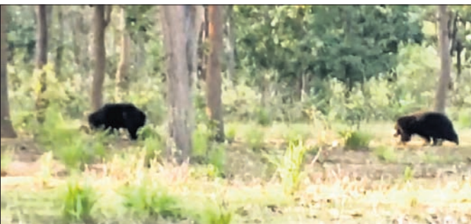
ଗାଁକୁ ପଶିଆସିଥିବା ଭାଲୁ।