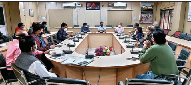
ବୈଠକରେ ଜିଲ୍ଲାପାଳଙ୍କ ସମେତ ଅନ୍ୟ ନୋଡାଲ ଅଧ୍ୟକ୍ଷମାନେ।