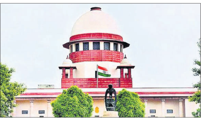
କୋଭିଡ୍ ମୃତ୍ୟୁ ରେକର୍ଡ ହୋଇଛି ସେଠାକୁ ନିଜ ଅଧିକାରୀମାନଙ୍କୁ ପଠାନ୍ତୁ। ଅପେକ୍ଷାକୃତ ସେମାନଙ୍କ ଘରକୁ ଯିବା କରୁଛନ୍ତି। ମୃତ୍ୟୁ ପଞ୍ଜୀକୃତ ହୋଇଥିବା ଗୁଣାଣି ବେଳେ କେବଳ ସରକାରଙ୍କ ନୀତି ଆପଣାଉଥିବାକୁ ଅପାଳତକ

କୋଭିଡ୍-୧୯ରେ ନିଜ ପ୍ରିୟଜନଙ୍କୁ ହରାଇଥିବା ଲୋକଙ୍କ ପାଖକୁ ଯାଇ କ୍ଷତିପୂରଣ ଦିଆ। ସେମାନେ କେବେ କେବେ ତାଙ୍କୁ ଅପେକ୍ଷା କରନାହିଁ ବୋଲି ବୁଧବାର ରାଜ୍ୟ ସରକାରମାନଙ୍କୁ ସୁପ୍ରିମକୋର୍ଟ ନିର୍ଦ୍ଦେଶ ଦେଇଛନ୍ତି।