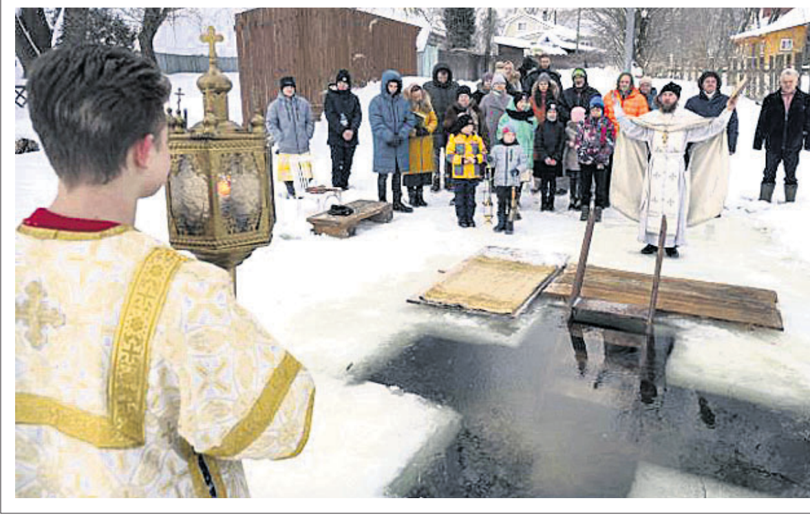
ରୁଷିଆର ଯାରୋସ୍ଲାଭଲ ଛିଡ଼ କୁପାନ୍‌ସୋଭେ ଗ୍ରାମରେ ଜଣେ ଅର୍ଥୋଡକ୍ସ ପ୍ରିଷ୍ଟ ଡେକା ନଦୀର ବରଫ ପାଣିକୁ ଆଖିବାଦ ଦେଉଛନ୍ତି।

ନୂଆଦିଲ୍ଲୀ, ୧୯୧୧: ଦିଲ୍ଲୀର ଓଲୁ ସାମାଜିକବାଦୀ ଓଲୁ ୪ ଶିଶୁ ଓ ମା'ଙ୍କ ମୃତଦେହ ବୁଧବାର କବଚ କରାଯାଇଛି।