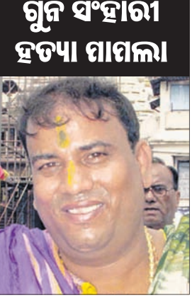
ଗୁମ ସିଂହାରୀ ହତ୍ୟା ଘାତୀ