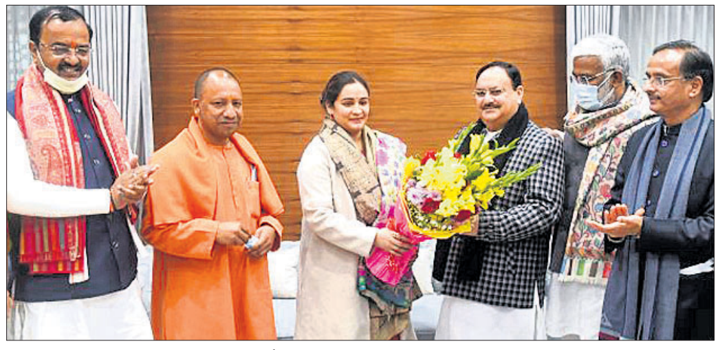
ନୂଆଦିଲ୍ଲୀରେ ମୁଲାୟମ୍ ସିଂ ଯାଦବଙ୍କ ବୋହୂ ଅପର୍ଣ୍ଣା ଯାଦବଙ୍କୁ ଭାଜପା ରାଷ୍ଟ୍ରୀୟ ଅଧ୍ୟକ୍ଷ ଜେ.ପି. ନନ୍ଦା ସ୍ୱାଗତ କରୁଛନ୍ତି। ନିକଟରେ ଅଛନ୍ତି ଯୁପି ମୁଖ୍ୟମନ୍ତ୍ରୀ ଯୋଗୀ ଆଦିତ୍ୟନାଥ, ଉପମୁଖ୍ୟମନ୍ତ୍ରୀ କେଶବ ପ୍ରସାଦ ଗୌରୀ, ଦାକ୍ଷେଣ ଶର୍ମା ଓ ଦଳର ରାଜ୍ୟ ସଭାପତି ସ୍ୱତନ୍ତ୍ର ଦେବ ସିଂ।

ଉତ୍ତର ପ୍ରଦେଶ ବିଧାନସଭା ନିର୍ବାଚନ ପୂର୍ବରୁ ସମାଜବାଦୀ ପାର୍ଟି (ଏଏପି) ପ୍ରତିଷ୍ଠାତା ମୁଲାୟମ୍ ସିଂ ଯାଦବଙ୍କ ସାନବୋହୂ ଅପର୍ଣ୍ଣା ଯାଦବ ଭାଜପାରେ ଯୋଗଦେଇଛନ୍ତି।