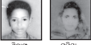
ଶ୍ରୀରାଜ ପରିବାରର ସଦସ୍ୟ ପ୍ରସିଦ୍ଧା ପରିବାରର ସଦସ୍ୟ