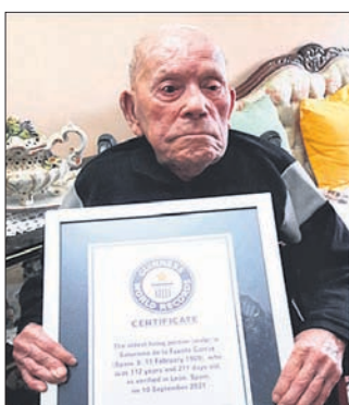
ନେଇଥିଲେ। ସାକ୍ସିଆଗୋ ପଡ଼ୋଶ ଲିଓନ୍-ସିଡି ପୁଏଟ୍ରେ କ୍ୟାଣ୍ଟୋରେ ଏକ ଫୁଟବଲ୍ କ୍ଲବର ପ୍ରତିଷ୍ଠା କରିଥିଲେ।

ମାଡ୍ରିଡ୍, ୧୯୧୧ (ଫ୍ରାନ୍ସ): ବିଶ୍ୱର ବୟସ୍କ ବ୍ୟକ୍ତିଙ୍କ ମାମତା ପାଇଥିବା ୧୧୨ବର୍ଷୀୟ ସେନାୟ ବ୍ୟକ୍ତି ସାକ୍ସିଆଗୋ ତେ ଲା ଯୁଦ୍ଧରେ ମଙ୍ଗଳବାର ପରଲୋକ ଘଟିଛି।