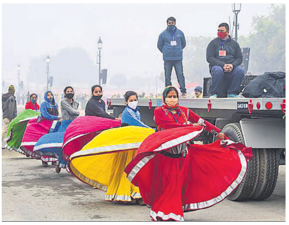
ଦିଲ୍ଲୀର ବିକ୍ରମ ଚୌକରେ ସାଧାରଣଗୁରୁ ଦିବସ ପରେ ଡେଇଁ ଲାଗିଥିବା ପାଇଁ ଗୁରୁବାର ଶାନ୍ତିଆ ସମାବେଶରେ କଳାକାରମାନେ ଅଭ୍ୟାସ କରୁଛନ୍ତି।