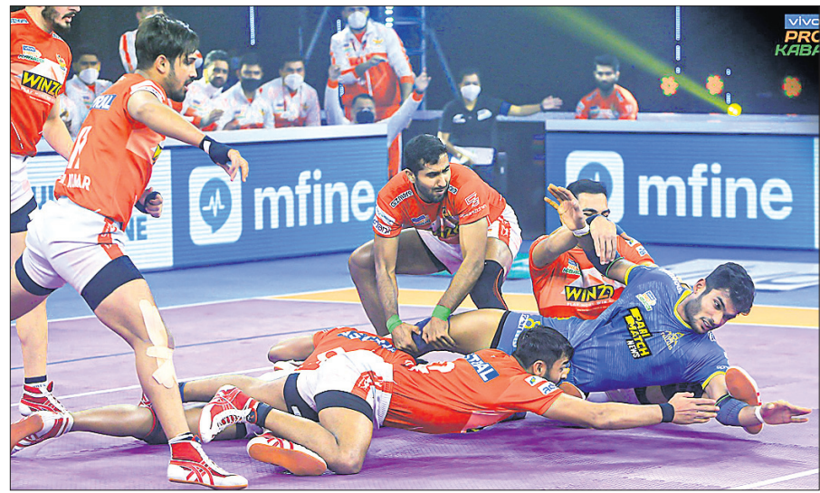
ପ୍ରୋ କବାଡ଼ି ଲିଗରେ ଗୁରୁବାର ଗୁଜରାଟ ଡିଆଣ୍ଟି ଓ ଚାମିଲ ଥାଲାଲଭାସ ମଧ୍ୟରେ ଅନୁଷ୍ଠିତ ମ୍ୟାଚ ।