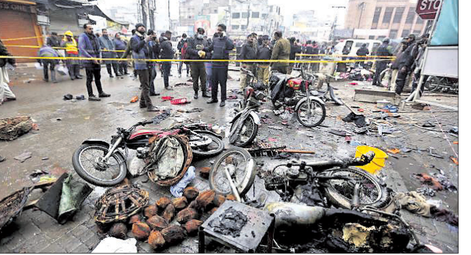
ବିସ୍ଫୋରଣ ପରେ ପୋଲିସ୍‌ର ତନାଘନା।

ଲାହୋର, ୨୦୧୧: ପାକିସ୍ତାନୀୟ ବିସ୍ଫୋରଣ ଏକ ମାର୍କେଟରେ ଗୁରୁବାର ବୋମା ବିସ୍ଫୋରଣ ହୋଇଛି। ଏଥିରେ ୩ ଜଣଙ୍କ ମୃତ୍ୟୁ ଘଟିବା ସହ ୨୫ ଜଣ ଆହତ ହୋଇଛନ୍ତି। ଏକ ବାଇକ୍‌ରେ ଖଣ୍ଡାଯାଇଥିବା ଗାଢ଼ ବୋମା ଯୋଗୁଁ ବିସ୍ଫୋରଣ ହୋଇଥିବା ପ୍ରାଥମିକ ତଦନ୍ତରୁ ଜଣାପଡ଼ିଛି ବୋଲି ଲାହୋର ପୋଲିସ୍ କହିଛି। ବିସ୍ଫୋରଣରେ ନିକଟରେ ଥିବା ଘର, ବୋକାନ୍‌ର ଝରକା କବାଟ ଭଡ଼ି ଯାଇଥିଲା। ତେବେ କେହି ବିସ୍ଫୋରଣ ପାଇଁ ନିକକୁ ଦାୟୀ କରିନାହାନ୍ତି। ଗତ ତିନିଦିନରେ ପାକିସ୍ତାନରେ ୩ ବିସ୍ଫୋରଣ ହୋଇଛି। ଏକ ବାଇକ୍‌ରେ ବୋମା ଯୋଗୁଁ ବିସ୍ଫୋରଣ ହୋଇଥିବା ପ୍ରାଥମିକ ତଦନ୍ତରୁ ଜଣାପଡ଼ିଛି ବୋଲି ଲାହୋର ପୋଲିସ୍ କହିଛି। ବିସ୍ଫୋରଣରେ ନିକଟରେ ଥିବା ଘର, ବୋକାନ୍‌ର ଝରକା କବାଟ ଭଡ଼ି ଯାଇଥିଲା। ତେବେ କେହି ବିସ୍ଫୋରଣ ପାଇଁ ନିକକୁ ଦାୟୀ କରିନାହାନ୍ତି। ଗତ ତିନିଦିନରେ ପାକିସ୍ତାନରେ ୩ ବିସ୍ଫୋରଣ ହୋଇଛି। ଏକ ବାଇକ୍‌ରେ ବୋମା ଯୋଗୁଁ ବିସ୍ଫୋରଣ ହୋଇଥିବା ପ୍ରାଥମିକ ତଦନ୍ତରୁ ଜଣାପଡ଼ିଛି ବୋଲି ଲାହୋର ପୋଲିସ୍ କହିଛି।