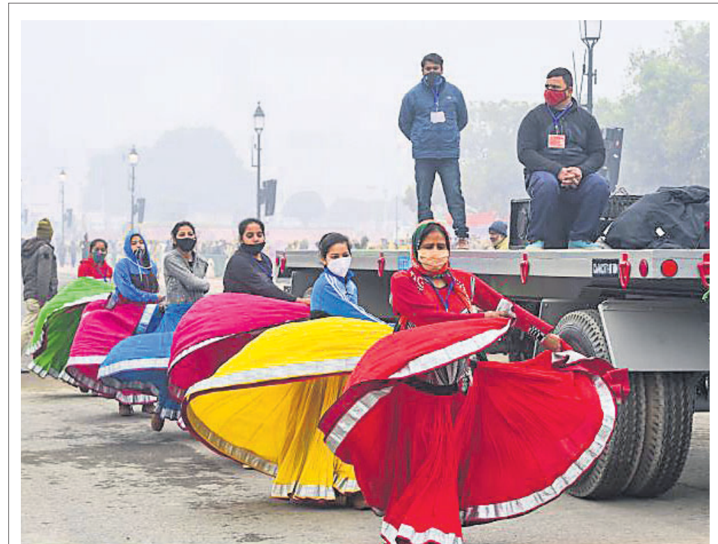
ଦିଲ୍ଲୀର ବିକ୍ରମ ଚୌକରେ ସାଧାରଣଗୁରୁ ଦିବସ ପରେ ଉତ୍ସବ ଆରମ୍ଭରେ ପାଇଁ ଗୁରୁତାର ଶାନ୍ତିଆ ସକାଳରେ କକାକାରମାନେ ଅଭ୍ୟାସ କରୁଛନ୍ତି।