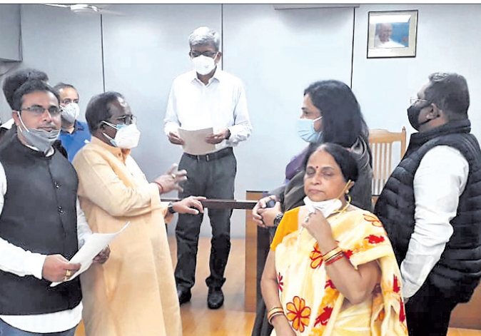
ରାଜ୍ୟ ନିର୍ବାଚନ କମିଶନରଙ୍କୁ ଭେଟି ଦାବିପତ୍ର ପ୍ରଦାନ କରୁଛନ୍ତି ବିଜେଡି ଓ ଭାଙ୍ଗିଯାଇ ପ୍ରତିନିଧି ଦଳ।

ସମ୍ପର୍କରେ କୌଣସି ଏତଲା ହୋଇ ନ ଥିବାବେଳେ ପୋଲିସ କୌଣସି ସୂଚନା ଖବରପାଇ ଘଟଣାସ୍ଥଳରେ ପହଞ୍ଚି ତଦନ୍ତ ଆରମ୍ଭ କରିଛି। ସେହିପରି ପାତ୍ରପୁର ବ୍ଲକ୍ କରଡ଼ା ଥାନା ଅନ୍ତର୍ଗତ ବାବନପୁର ଗ୍ରାମରେ ପ୍ରାର୍ଥୀପତ୍ର ଦାଖଲକୁ ନେଇ ଗଣ୍ଡଗୋଳ ହୋଇଥିଲା। ଏଥିରେ ଗୋଟିଏ ଗୋଷ୍ଠୀର ଗୁରୁତର ହୋଇଛନ୍ତି। ଜରତା ଥାନା ବ୍ରହ୍ମପୁର ବଡ଼ ମେଡିକାଲକୁ ଘ୍ନାନାତର