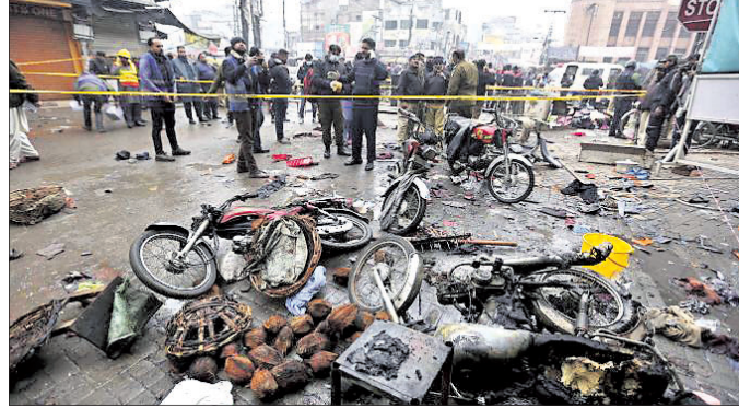
ବିସ୍ଫୋରଣ ପରେ ପୋଲିସ୍ ତନାଘନା।

ଲାହୋର, ୨୦୧୧: ପାକିସ୍ତାନସ୍ଥିତ ଲାହୋରର ଏକ ମାର୍କେଟରେ ଗୁରୁତାର ବୋମା ବିସ୍ଫୋରଣ ହୋଇଛି। ଏଥିରେ ୩ ଜଣଙ୍କ ମୃତ୍ୟୁ ଘଟିବା ସହ ୨୫ ଜଣ ଆହତ ହୋଇଛନ୍ତି। ଏକ ବାଇକ୍ରେ ଖଣ୍ଡାଯାଇଥିବା ଗାଡ଼ି ବୋମା ଯୋଗୁଁ ବିସ୍ଫୋରଣ ହୋଇଥିବା ପ୍ରାଥମିକ ତଦନ୍ତରୁ ଜଣାପଡ଼ିଛି ବୋଲି ଲାହୋର ପୋଲିସ୍ କହିଛି। ବିସ୍ଫୋରଣରେ ନିକଟରେ ଥିବା ଘର, ବୋକାନ୍ଦର ଝରକା କବାଟ ଉଡ଼ି