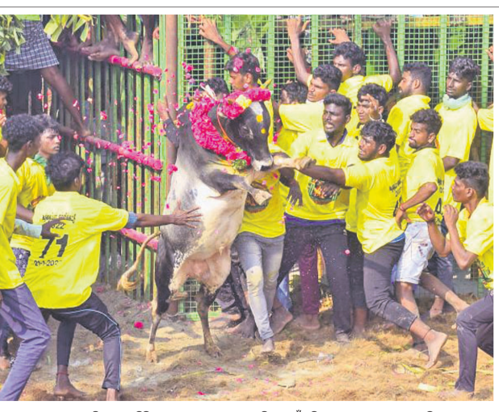
ପୋଲିସ୍ ଅବସରରେ ତାମିଲନାଡୁର ତ୍ରିତୀୟ ଶୁକ୍ରବାର ଷଷ୍ଠ କାବୁ କରିବା ପାଇଁ ପ୍ରତିଯୋଗୀମାନେ ଉଦ୍ୟମ କରୁଛନ୍ତି।