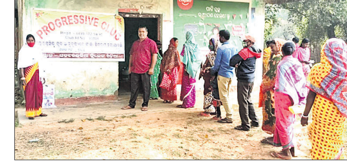
ଟିକା ନେବା ପାଇଁ ଲୋକେ ଧାଡ଼ିରେ ଛିଡ଼ା ହୋଇଛନ୍ତି।