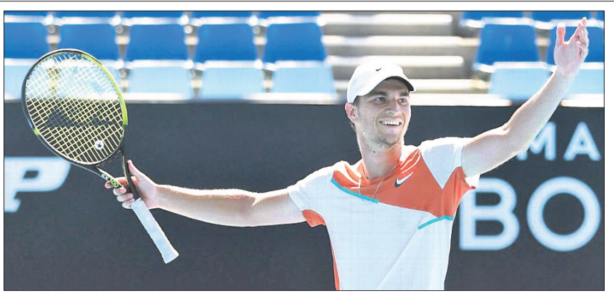
ବିଜୟ ହାସଲ କ୍ଷୁଦ୍ଧରେ ଉଲ୍ଲାସିତ ମିଓମିର କେକ୍‌ମାନୋଭିର୍।

ମେଲବୋର୍ନ, ୨୧।୧ (ଏସି) ଚଳିତ ଅଷ୍ଟ୍ରେଲିଆନ ଓପନ ଟେନିସ ମହିଳା ସିଙ୍ଗଲ୍ସରେ ଗତଥରର ଚାମ୍ପିୟନ କାପାନ୍‌ର ନାଓମି ଓସାକାଙ୍କୁ ହରାଇ ବିପର୍ଯ୍ୟୟ ସୃଷ୍ଟି କରିଛନ୍ତି ଆମେରିକାର ଆମଣ୍ଡା ଆନିସିମୋଭା। ଶୁକ୍ରବାର ଅନୁଷ୍ଠିତ ତୃତୀୟ ରାଉଣ୍ଡ ମ୍ୟାଚରେ ଆନିସିମୋଭା ୪-୬, ୬-୩, ୬-୨(୫) ସେଟ୍‌ରେ ୪ ଥର ବଡ଼ ଗ୍ୟାଲେମ୍ ବିଜୟୀ ଓସାକାଙ୍କୁ ପରାସ୍ତ କରିଛନ୍ତି। ବିଶ୍ୱ ର୍ୟାଙ୍କିଙ୍ଗରେ ୬୦ତମ ସ୍ଥାନରେ ଥିବା ଆନିସିମୋଭା ତୃତୀୟ ରାଉଣ୍ଡରେ ଅଲିକ୍ସିା ଚାମ୍ପିୟନ ବେଲିଣ୍ଡା ବେକିଙ୍କଙ୍କୁ ହରାଇଥିଲେ। ପ୍ରଥମ ସେଟ୍‌ରେ ହାରିବା ପରେ ଆନିସିମୋଭା ଜାଣିଥିଲେ ଯେ ଆଗାମୀ ସେଟ୍‌ରେ ତାଙ୍କୁ ଆକ୍ରମଣାତ୍ମକ ଖେଳିବାକୁ ପଡ଼ିବ ନଚେତ୍ ଚୁନାମେଣ୍ଟରୁ ବିଦା ହେବା ନିଶ୍ଚିତ। ଏହି ଭାବନା ତାଙ୍କ ପାଇଁ କାମ ବୋଲି। ତୃତୀୟ ସେଟ୍‌ରେ ସେ ୨ ମ୍ୟାଚ ପଏଣ୍ଟ ସେଟ୍ କରିବା ସହ ୪୬ ଫିଟ୍‌ସ୍ ଶର୍ତ୍ତ ସହ ଓସାକାଙ୍କୁ ଟକ୍‌ମା ଦେଇଥିଲେ। ୪ର୍ଥ ଥର ପାଇଁ ଓସାକା କୌଣସି ବଡ଼ ଟାକଲ ବଜାୟ ରଖିବାରେ ଅସମର୍ଥ ହୋଇଛନ୍ତି। ୧୧ଥର ପାଇଁ ସେ ଗ୍ରାଣ୍ଡସ୍ଲାମ ଚୁନାମେଣ୍ଟର ୩ୟ ରାଉଣ୍ଡରୁ ବିଦାୟ ନେଇଛନ୍ତି। ଅନ୍ୟ ଏକ ମ୍ୟାଚରେ ଆସ୍କା ବାର୍ଟି