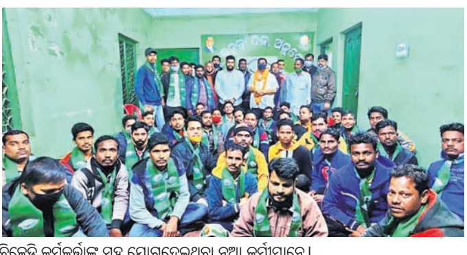
ବିଜେଡି କର୍ମକର୍ତ୍ତାଙ୍କ ସହ ଯୋଗଦେଇଥିବା ଦୁଆ କର୍ମୀମାନେ।

ଅନୁଗୋଳ ବିଜୁ ଜନତା ଦଳ କାର୍ଯ୍ୟାଳୟରେ ଶୁକ୍ରବାର ଏକ ମିଶ୍ରଣ ପର୍ବ ଅନୁଷ୍ଠିତ ହୋଇଯାଇଛି। ଅନୁଗୋଳ ନିର୍ବାଚନମଣ୍ଡଳ ଅଧୀନ ଅଜ୍ଞାନବନ୍ଧ ପଞ୍ଚାୟତ ବାରସିଂହା ଗ୍ରାମର ବହୁ ଭାଜପା ଓ କଂଗ୍ରେସ କର୍ମୀ ଏହି ମିଶ୍ରଣପର୍ବ ମଧ୍ୟମରେ ବିଜେଡିରେ ଯୋଗ ଦେଇଛନ୍ତି। ମୁଖ୍ୟମନ୍ତ୍ରୀ ନବୀନ ପଟ୍ଟନାୟକଙ୍କ ନାତ, ଆଦର୍ଶ, ସଞ୍ଜୁ ଓ କାର୍ଯ୍ୟାଧାରରେ ଅନୁପ୍ରାଣିତ ହୋଇ ସେମାନେ ବିଧିବଦ୍ଧ ଭାବେ ବିଜୁ ଜନତା ଦଳରେ ଯୋଗଦାନ କରିଥିବା ସୂଚନା ମିଳିଛି। ଏହି