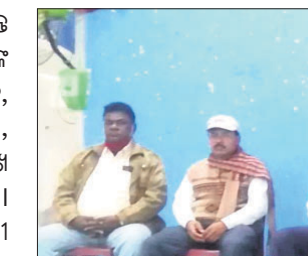
ବାଲେଶ୍ଵର ଅର୍ଥ, ୨୧୧୧