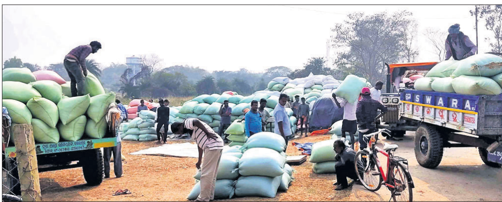
ପଦ୍ମପୁର ମଣ୍ଡିରେ ପଡ଼ି ରହିଥିବା ଧାନ।

ଭଦ୍ରକ ଜିଲ୍ଲା ବାସୁଦେବପୁର ବ୍ଲକ୍ ଅଧୀନ ବିଭିନ୍ନ ସମିତି ଓ ସ୍ଵୟଂସହାୟକ ଗୋଷ୍ଠୀଠାରୁ ଧାନ ଉଠାଇ ନାହାନ୍ତି ସହବନ୍ଧିତ ମିଲର। ବ୍ଲକ୍ ୨୦ଟି ସେବା ସମବାୟ ସମିତି ଓ ୭ଟି ସ୍ଵୟଂ ସହାୟକ ଗୋଷ୍ଠୀ ଚାଷୀମାନଙ୍କଠାରୁ ଧାନ ଜିଣିବା ପାଇଁ ସହବନ୍ଧିତ ହୋଇଛନ୍ତି। ଚାଷୀମାନଙ୍କୁ ଚୋକନ ପ୍ରଦାନ କରାଯିବା ପରେ ସେମାନେ ଧାନ ଆଣି ବିଭିନ୍ନ ମଣ୍ଡିରେ ପହଞ୍ଚାଇଛନ୍ତି। ହେଲେ ଧାନର ମାନ, କର୍ମା ଓ ଲୋଡ଼ିଂ ପାଇଁ ଲୋକଙ୍କ ଅଭାବ ଦର୍ଶାଇ ମିଲରମାନେ ମଣ୍ଡିରୁ ଧାନ ଉଠାଇ ନାହାନ୍ତି। ବିଭିନ୍ନ ମଣ୍ଡିରେ ୫୦ ହଜାର କୁଇଣ୍ଟାଲରୁ ଊର୍ଦ୍ଧ୍ଵ ଧାନ ଖୋଲା ଆକାଶ ତଳେ ପଡ଼ି ରହିଛି। ସମିତିର ନିଜସ୍ଵ ଗୋଦାମ ନ ଥିବା ବେଳେ ଧାନବସ୍ତ୍ରା