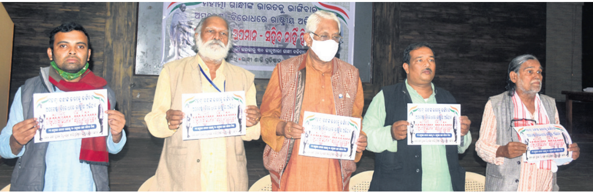
ଖବରଦାତା ସମ୍ମିଳନୀରେ ରାଷ୍ଟ୍ରୀୟ ଅଭିଯାନର ପୂର୍ତ୍ତା ପୋଷ୍ଟରକୁ ଉନ୍ମୋଚନ କରାଯାଇଛି ।