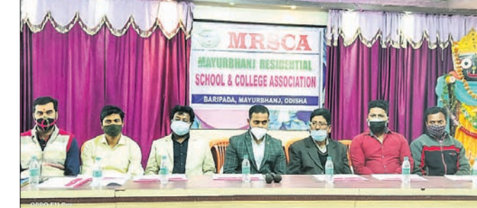
ମଞ୍ଚାସନରେ ରେଭିଡେମ୍ପିଆଲ ସ୍କୁଲ ଓ କଲେଜ ଆସୋସିଏସନ କର୍ମକର୍ମୀ।