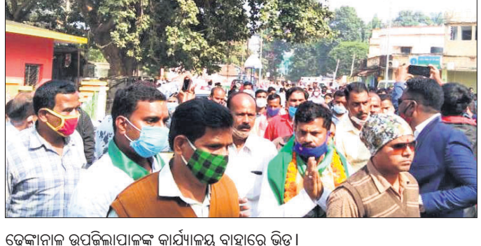
ତେଜନାଳ ଉପଜିଲ୍ଲାପାଳଙ୍କ କାର୍ଯ୍ୟାଳୟ ବାହାରେ ଭିଡ଼।

ତ୍ରିପୁରାୟ ପଞ୍ଚାୟତ ନିର୍ବାଚନ ଲାଗି ନାମାଙ୍କନ ଦାଖଲ ପ୍ରକ୍ରିୟା ଶେଷ ହୋଇଛି। ଶୁକ୍ରବାର ଅନ୍ତିମ ଦିବସରେ ପ୍ରାର୍ଥୀପତ୍ର ଦାଖଲ ବେଳେ ଜନସମୁଦ୍ରରେ ପରିଣତ ହୋଇଥିଲା ତେଜନାଳ ଉପଜିଲ୍ଲାପାଳଙ୍କ କାର୍ଯ୍ୟାଳୟ ପରିସର। ଅଫିସ ଭିତରେ ଏବଂ ବାହାରେ ଏକାଠି ହୋଇଥିବା ହଜାର ହଜାର ସଂଖ୍ୟାରେ ରାଜନୈତିକ ଦଳର ସମର୍ଥକଙ୍କ ଭିଡ଼ ପାଇଁ ଆୟୁଲାର୍ଦ୍ଧ ବି ବାଟ ପାଇ ନ ଥିଲା। ଗଞ୍ଜି ନିୟନ୍ତ୍ରଣ ଲାଗି ଉପଜିଲ୍ଲାପାଳଙ୍କ କାର୍ଯ୍ୟାଳୟରେ ୪୨, ଜିଲ୍ଲା ପରିଷଦରେ ୧୩ ଜଣ ଆଶାୟୀ ନାମାଙ୍କନ ଦାଖଲ କରିଛନ୍ତି। ଅନୁରୂପ ଭାବେ କଳକାହାଡ଼ ଜୁକର ଓଡ଼ିଆପଢ଼ାରେ ୧୮୩, ସରପଞ୍ଚରେ ୩୮, ସମିତିସଭ୍ୟରେ ୩୦, ଜିଲ୍ଲା ପରିଷଦ ପଦବୀରେ ୫୫ ଆଶାୟୀ ପ୍ରାର୍ଥୀପତ୍ର ଦାଖଲ କରିଥିବା ଜିଲ୍ଲା ପ୍ରଶାସନ ସୂଚନା ପ୍ରଦାନ କରାଯାଇଛି।