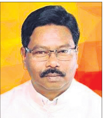
କେନ୍ଦ୍ରମନ୍ତ୍ରୀ ବିଶ୍ଵେଶ୍ଵର ରୁଦ୍ର