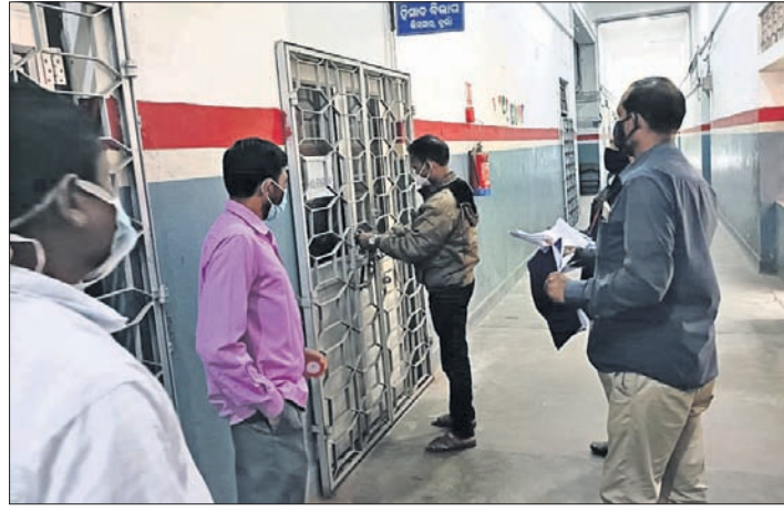
ଭିମ୍ବାର ପ୍ରିଦ୍ୱିପାଳଙ୍କ ଅଧିକାରୀଙ୍କ ସହିତ